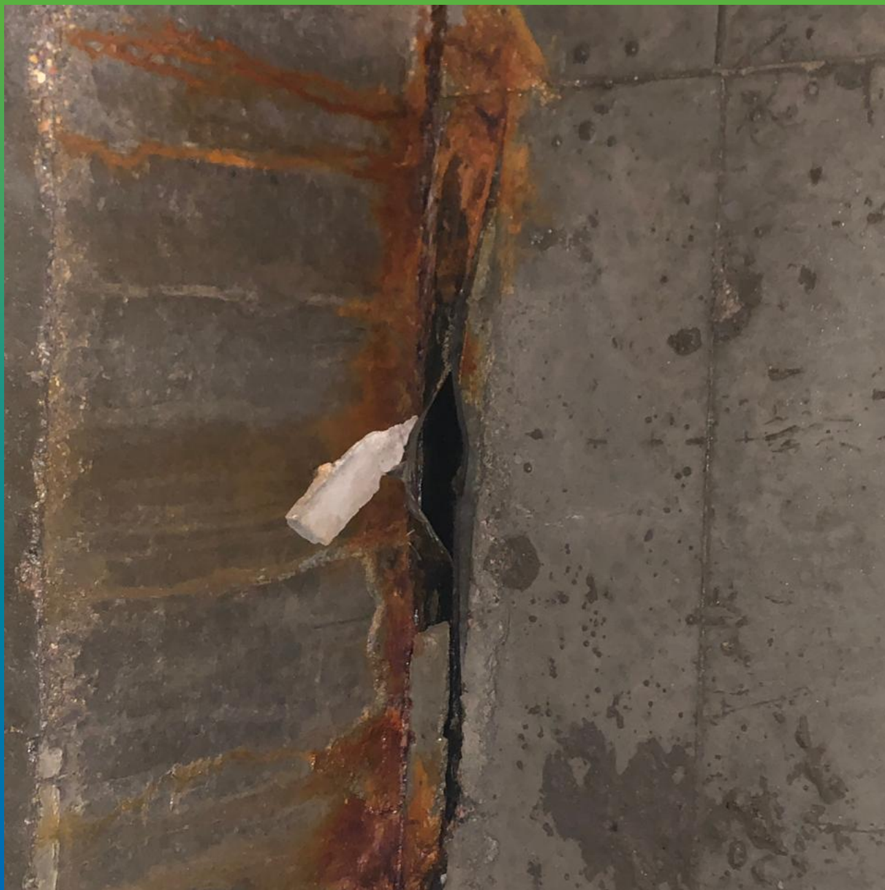
Вид до ремонта.