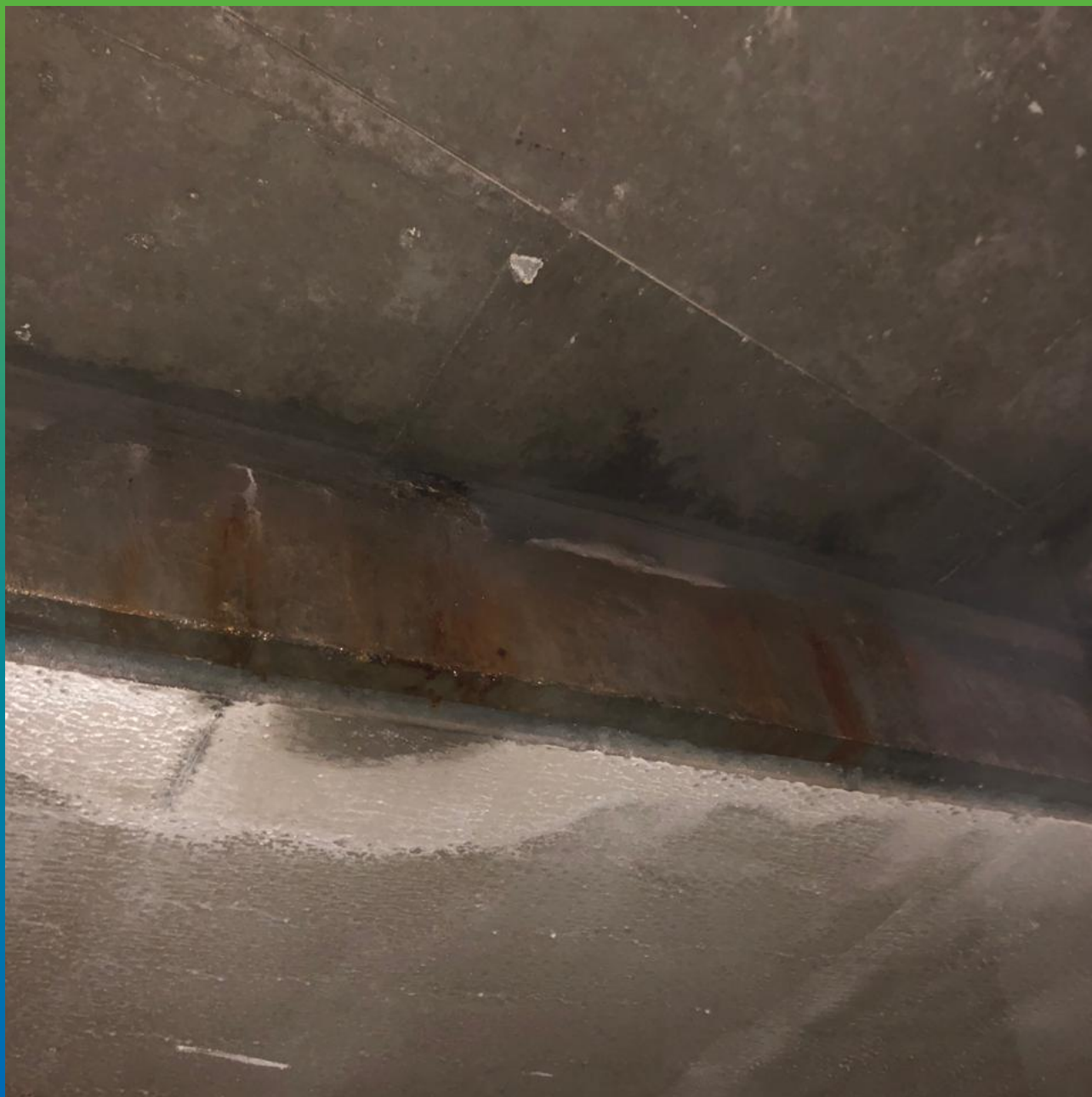
Вид до ремонта.