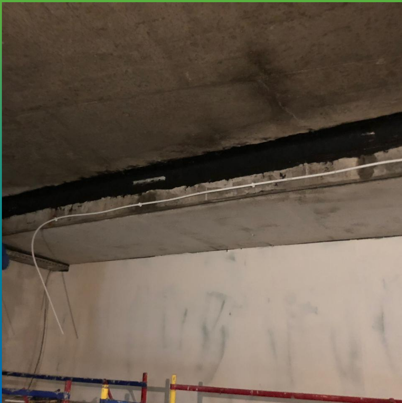
Проведение работ по гидроизоляции деформационного шва.