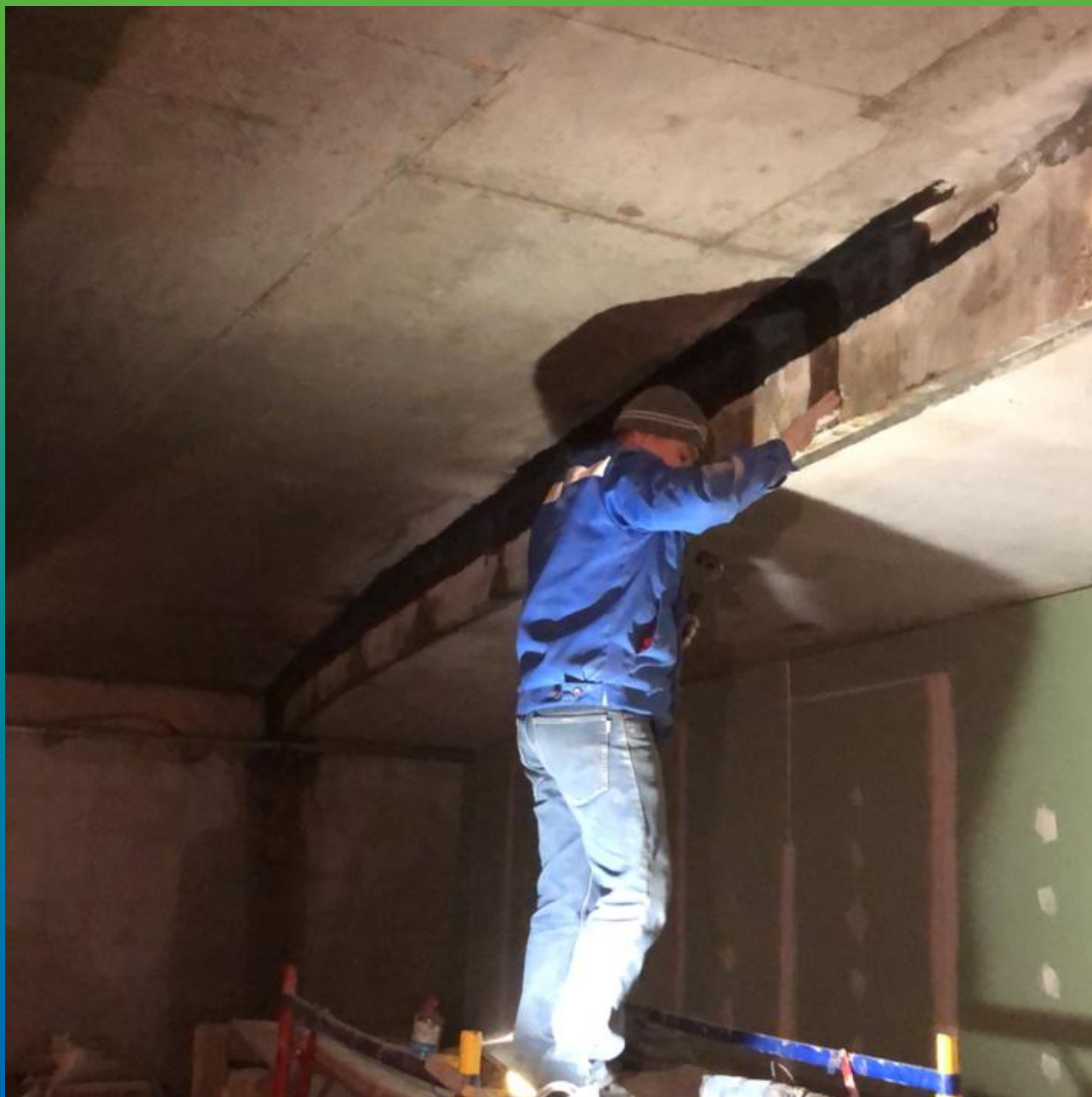
Проведение работ по гидроизоляции деформационного шва.