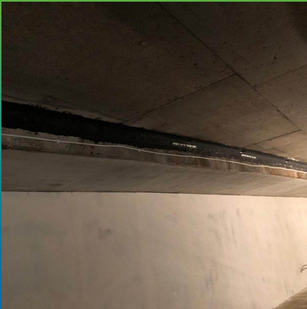
Вид деформационного шва