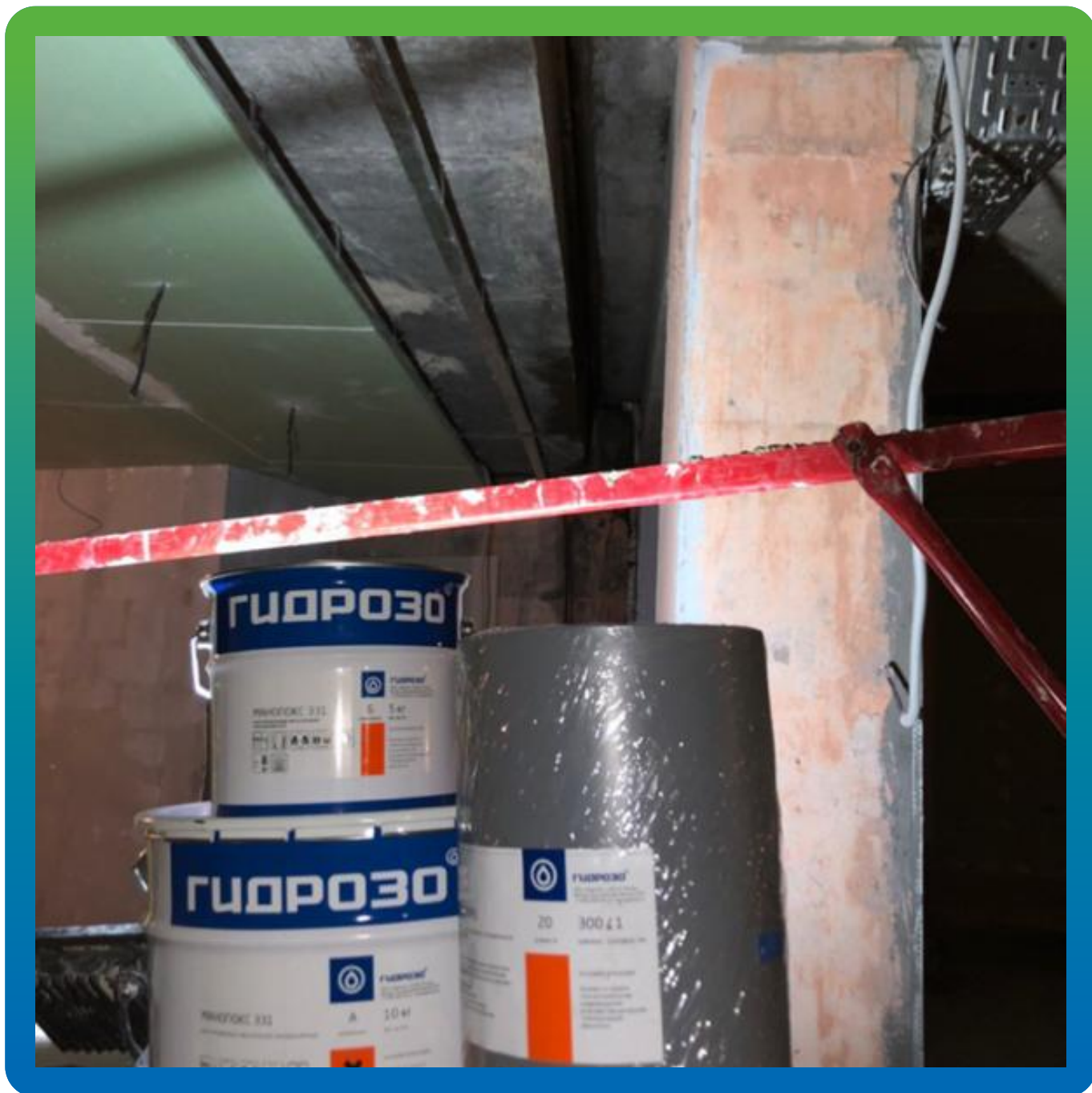
Материалы на объекте.