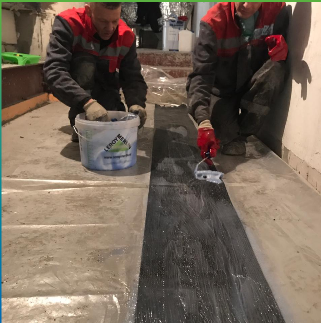
Пропитка холста Армошел KB 500 клеем Манопокс 372