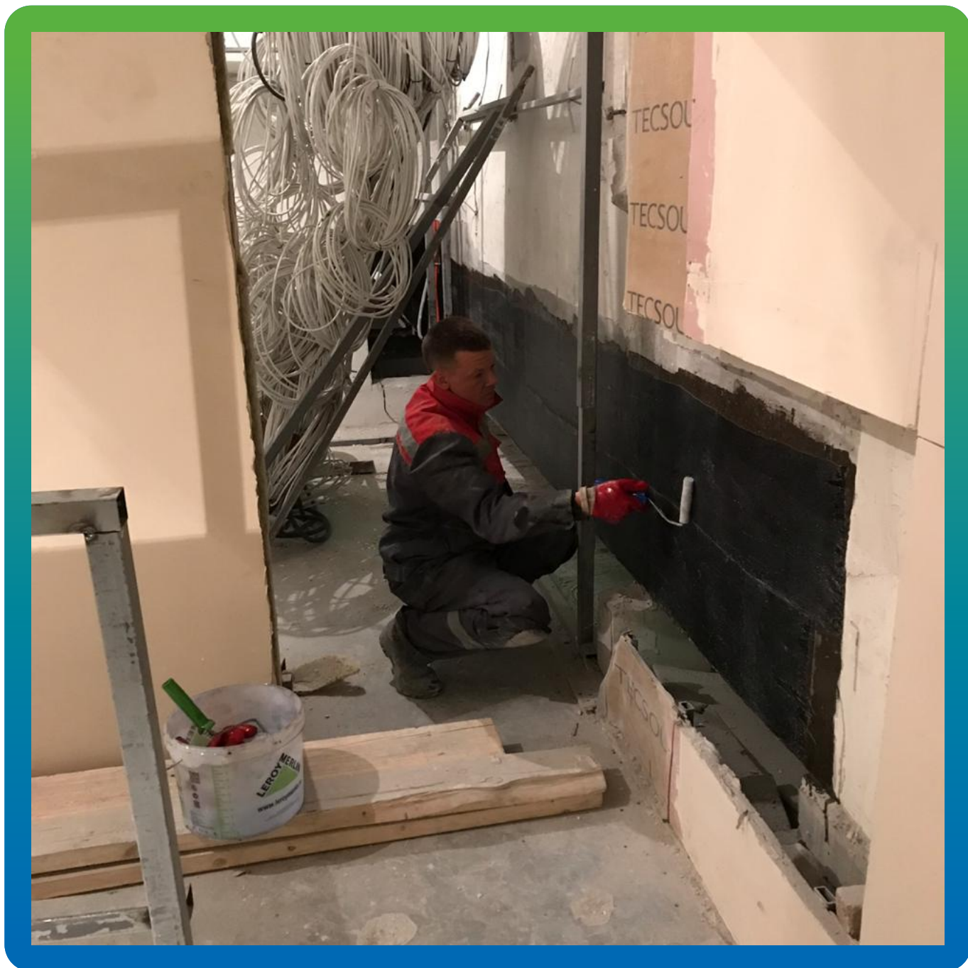
Прокатка холста Армошел КВ 500 валиком для разглаживания и удаления пузырьков воздуха