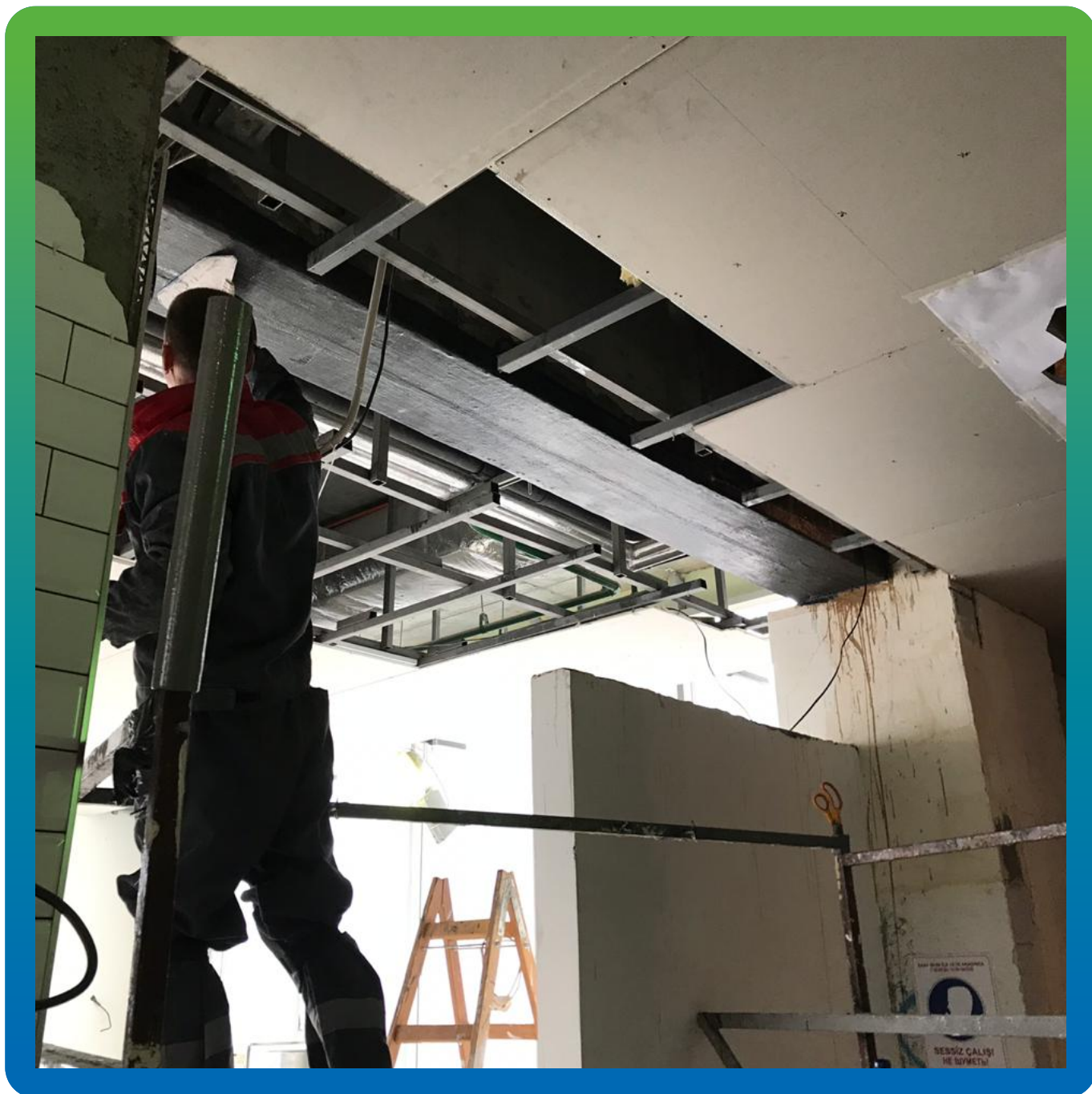
Монтаж холста Армошел КВ 500 на балку