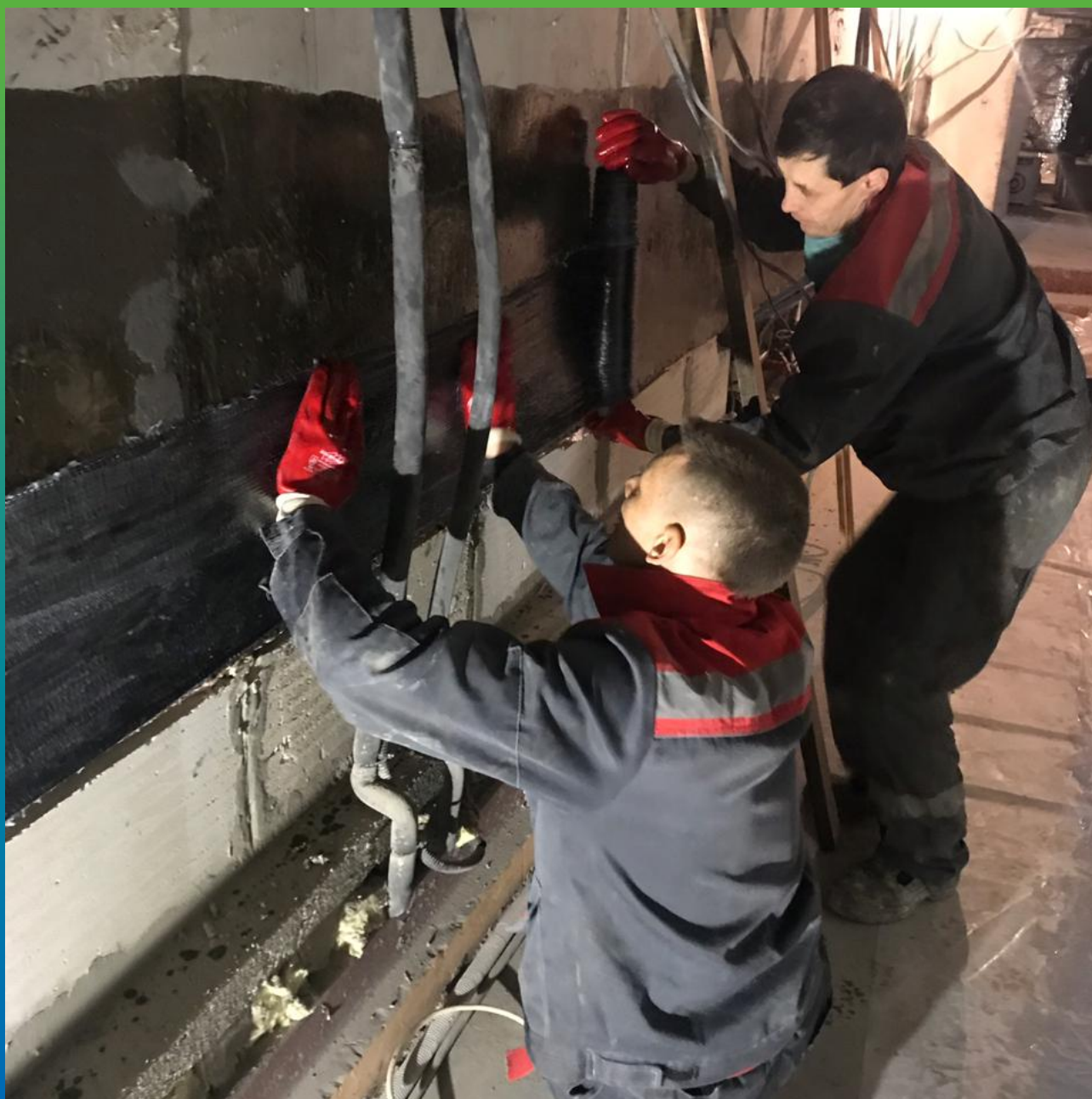
Монтаж холста Армошел KB 500 на стену