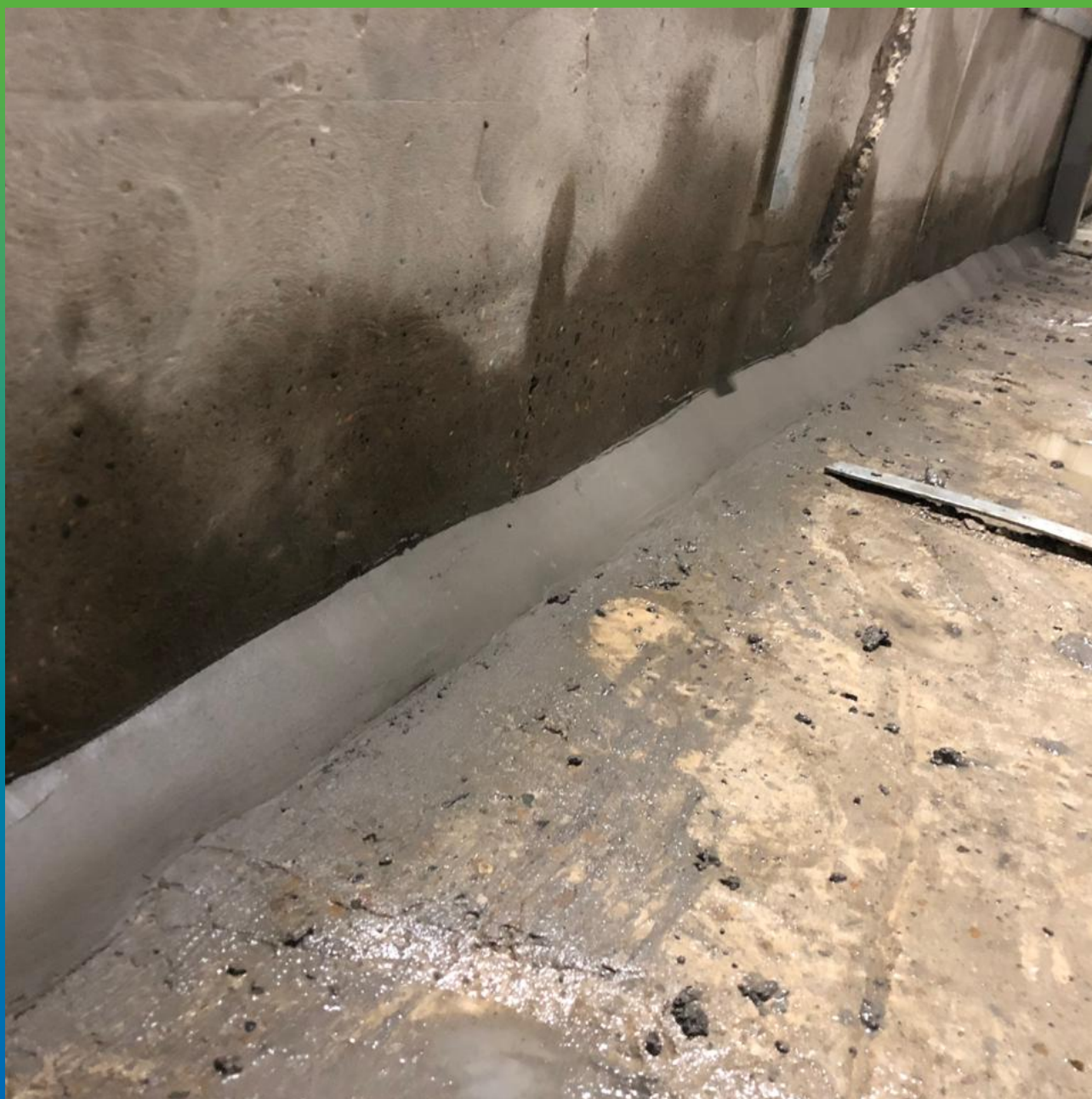
Шов, заполненный составом Стармекс Чекан