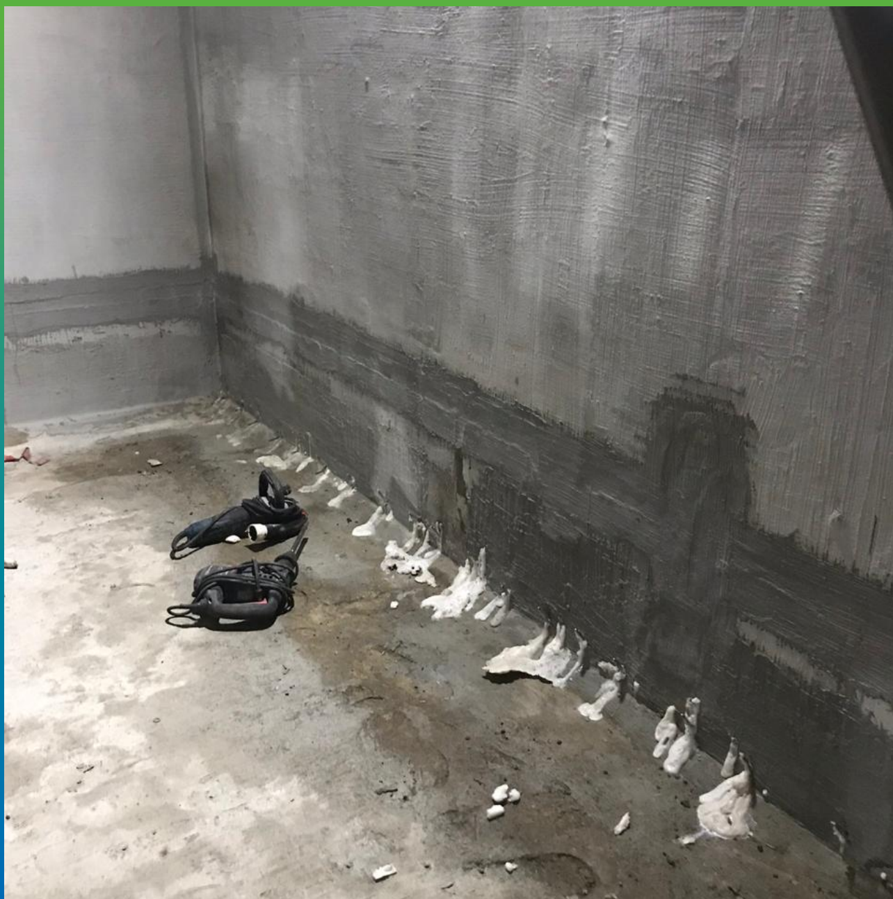
Инъектирование шва составом Манопур С