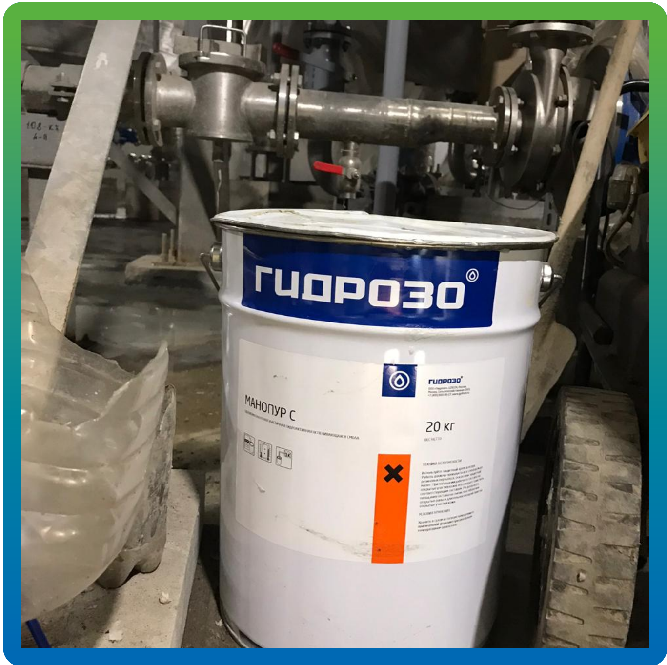
Материал для инъектирования