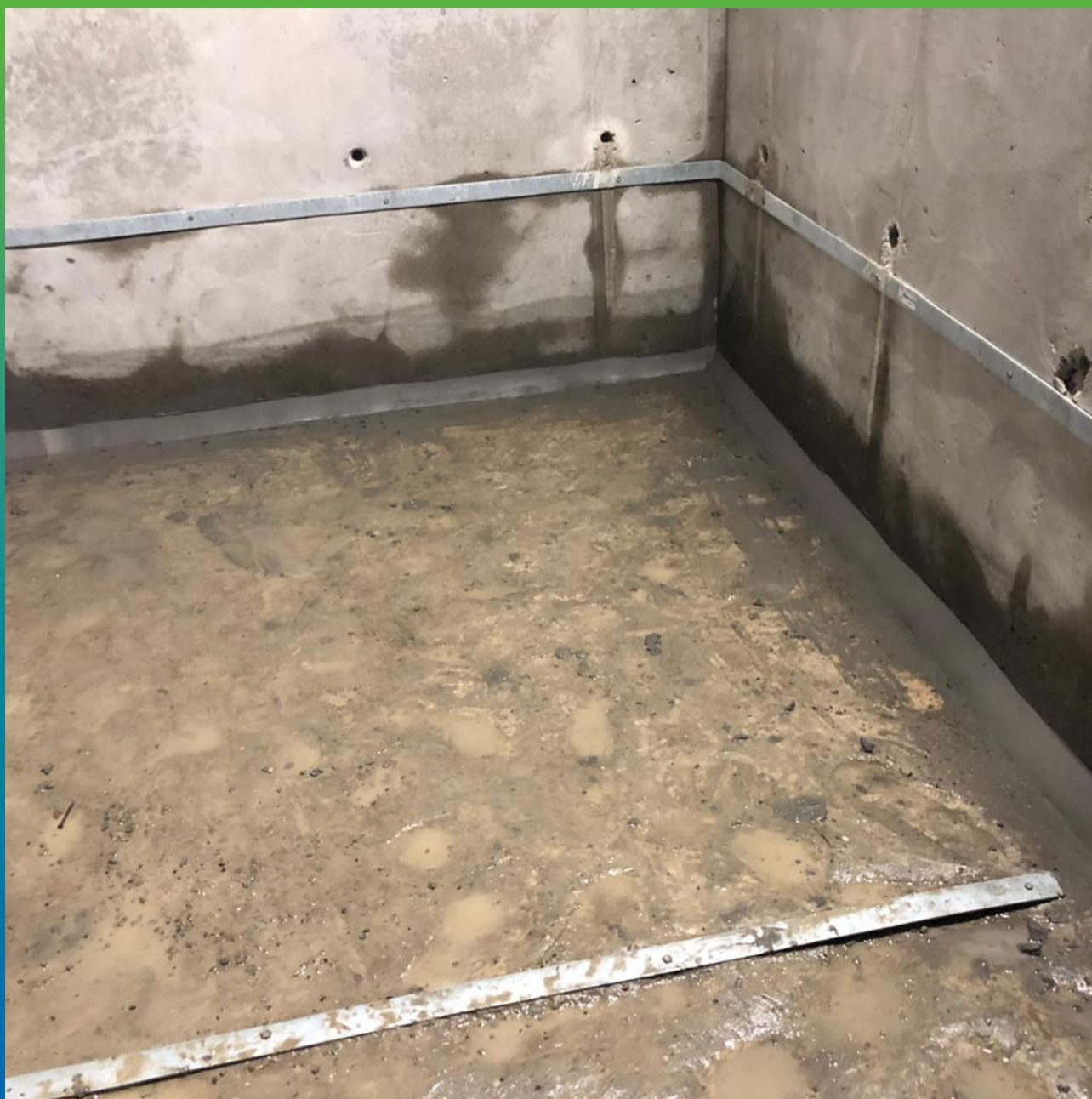
Шов, заполненный составом Стармекс Чекан