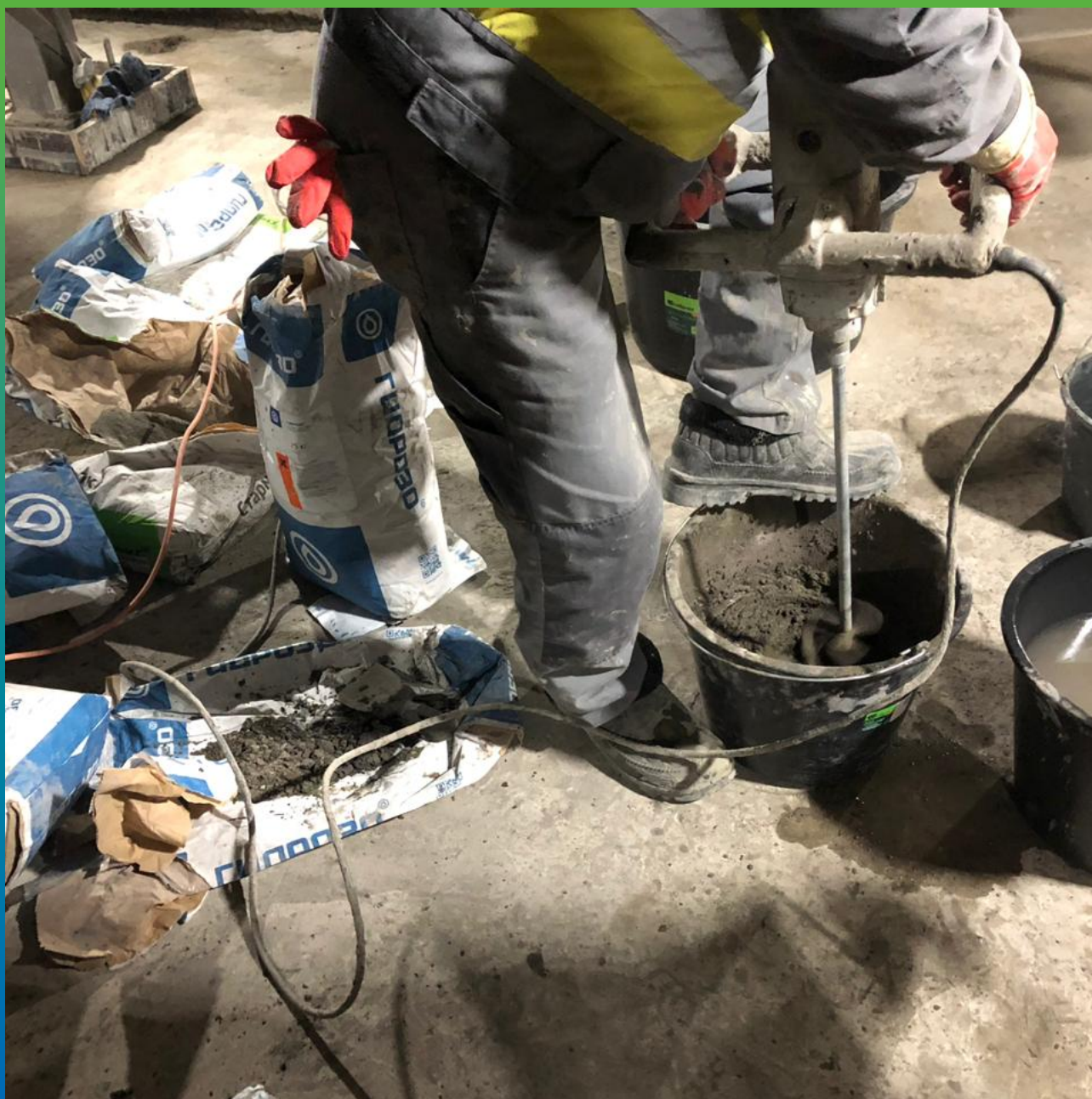
Приготовление состава Стармекс Чекан