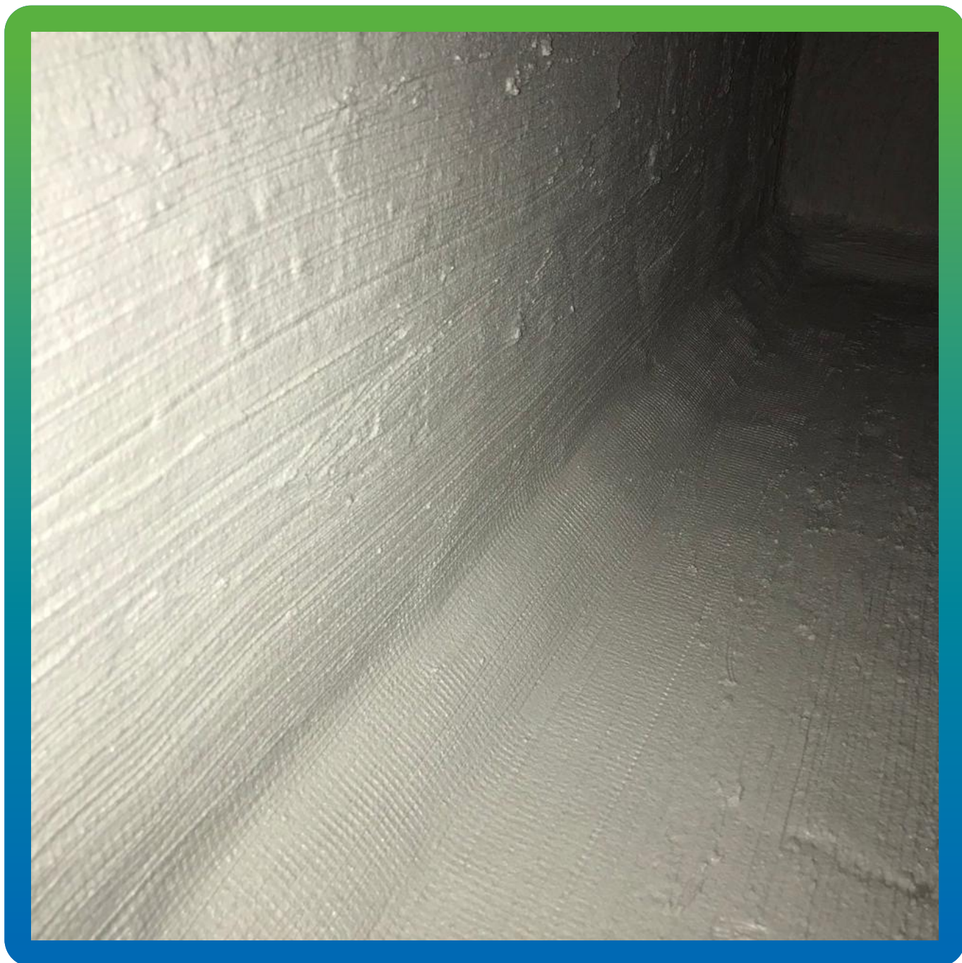
Финальный вид шва