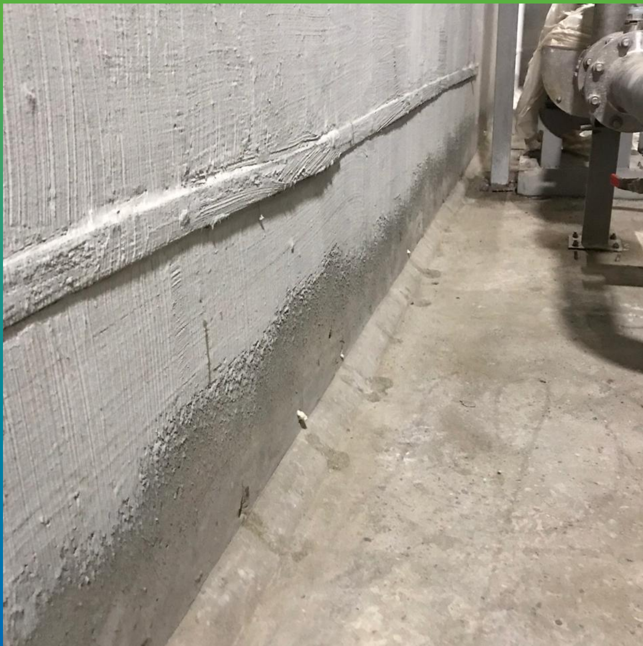
Проинъецированный, зачищенный шов