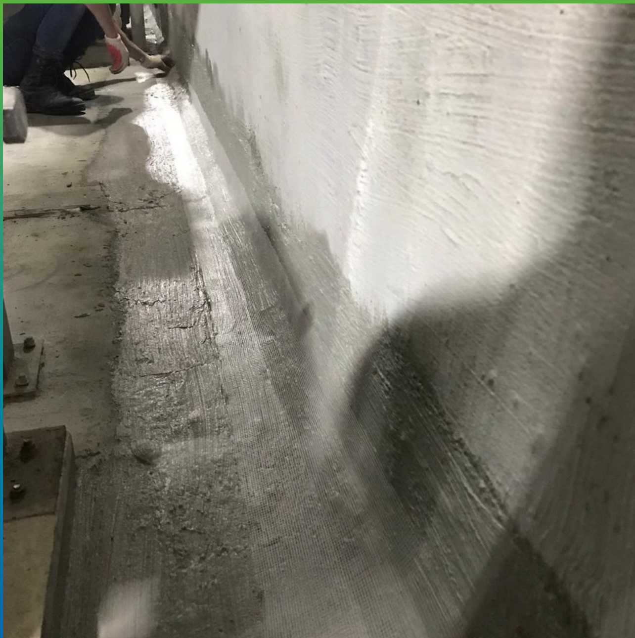
Обмазка шва составом Стармекс Сил Флекс по армирующей сетке в 2 слоя