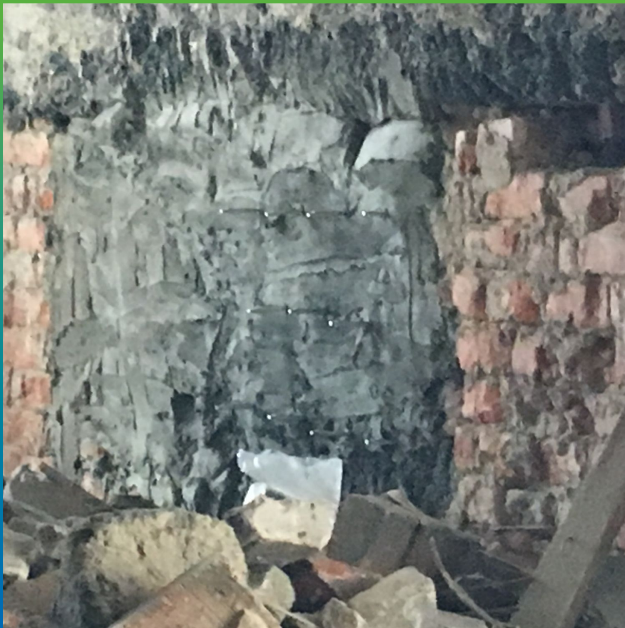
Подготовка. Выравнивание стены Стармекс РМ Супер