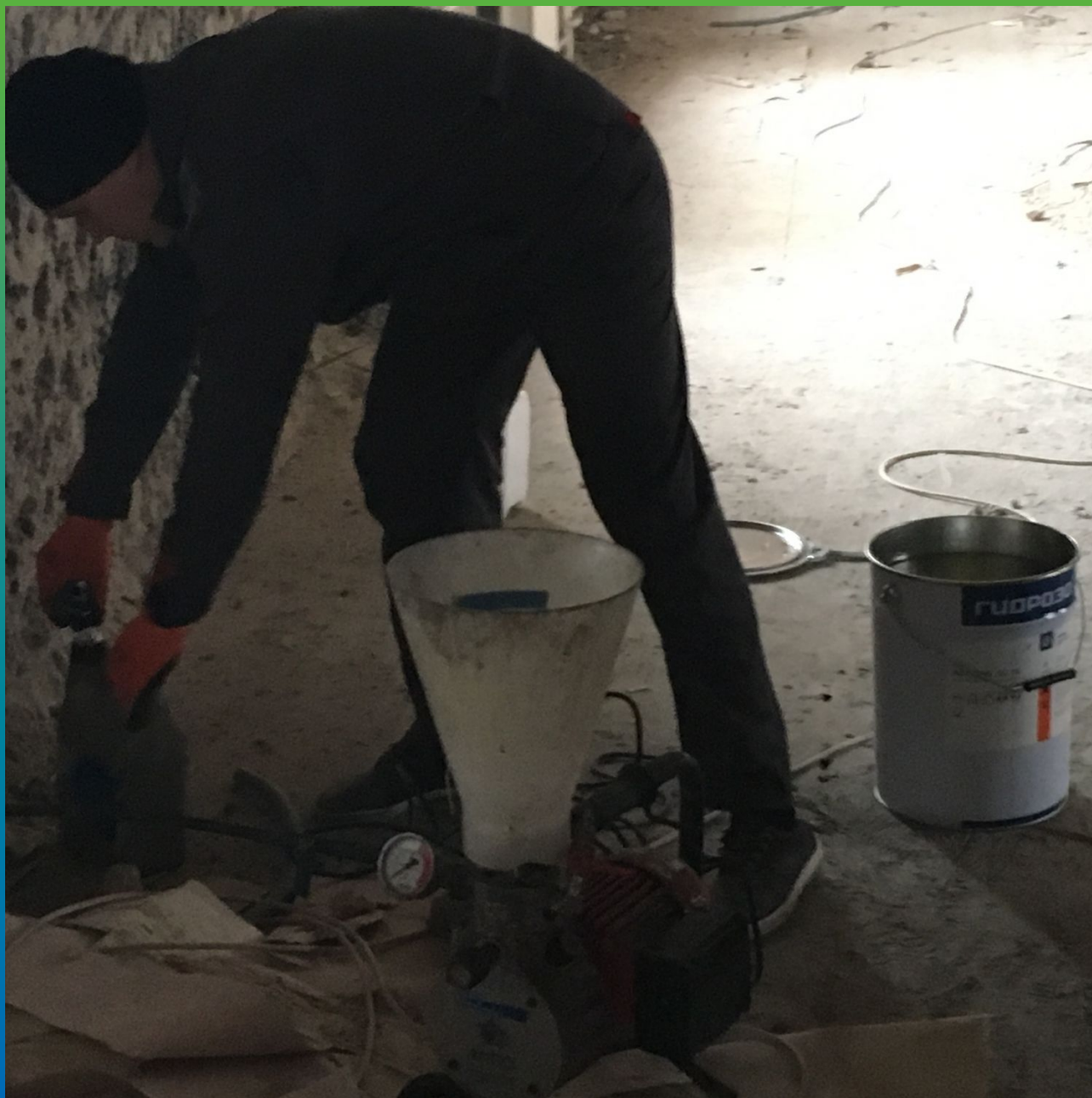
Подготовка к инъектированию Манопокс 352