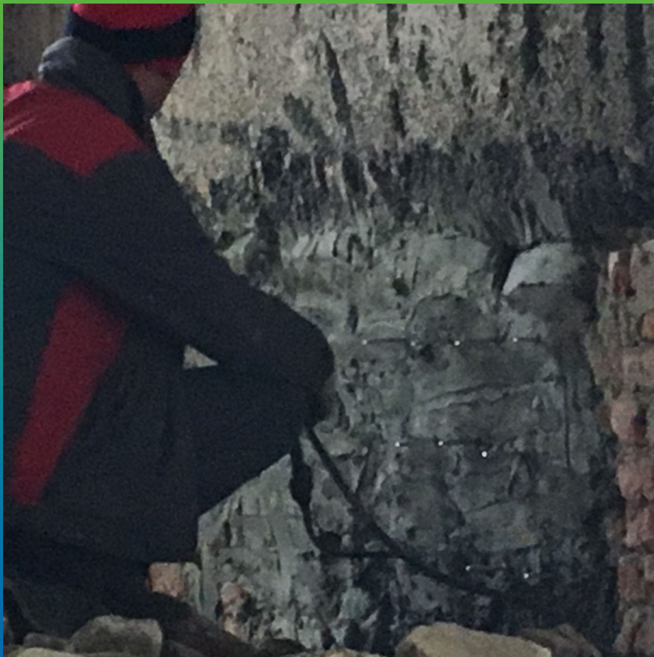
Инъектирование Манопокс 352.