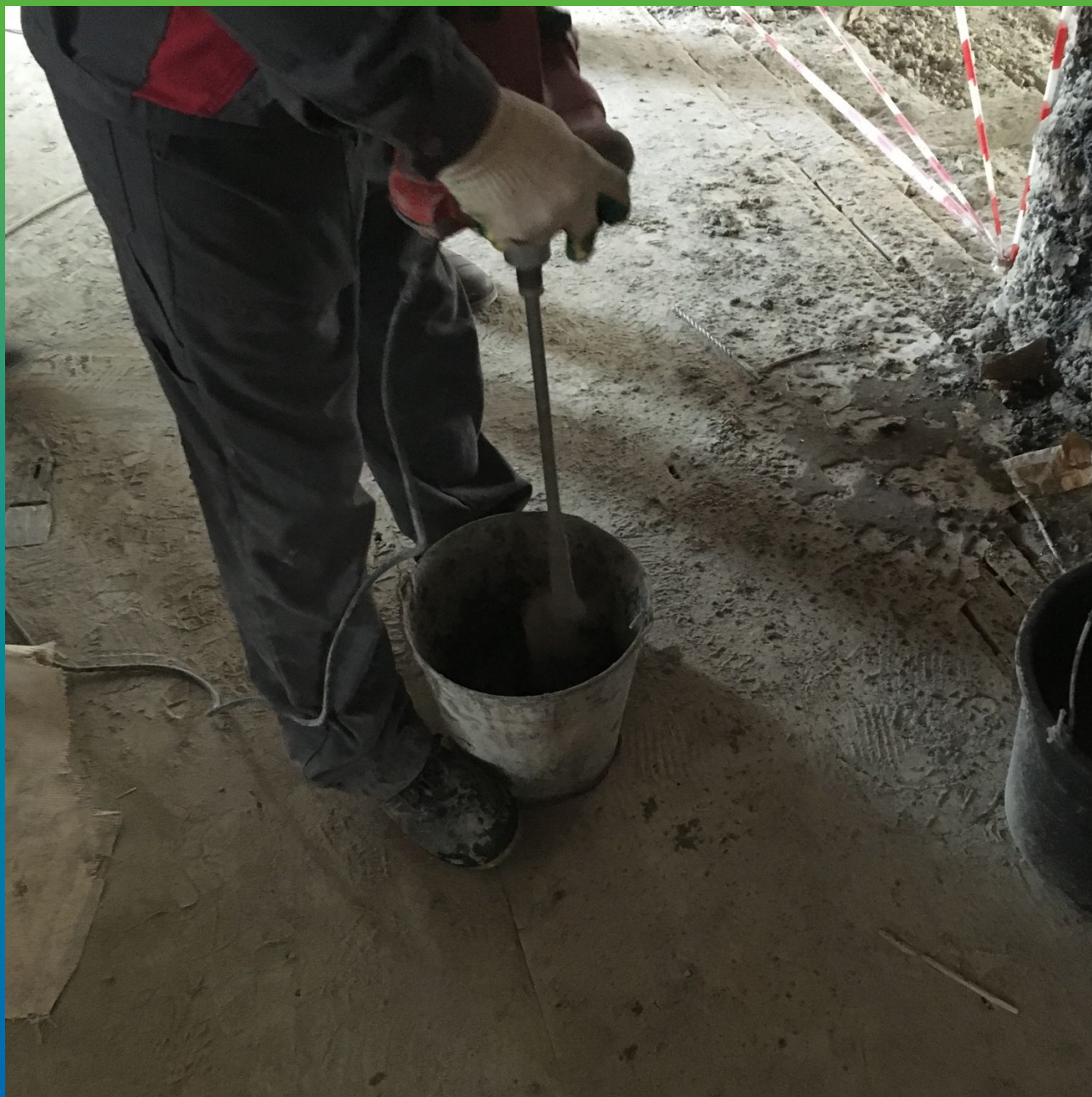
Подготовка к инъектированию Манопокс 352