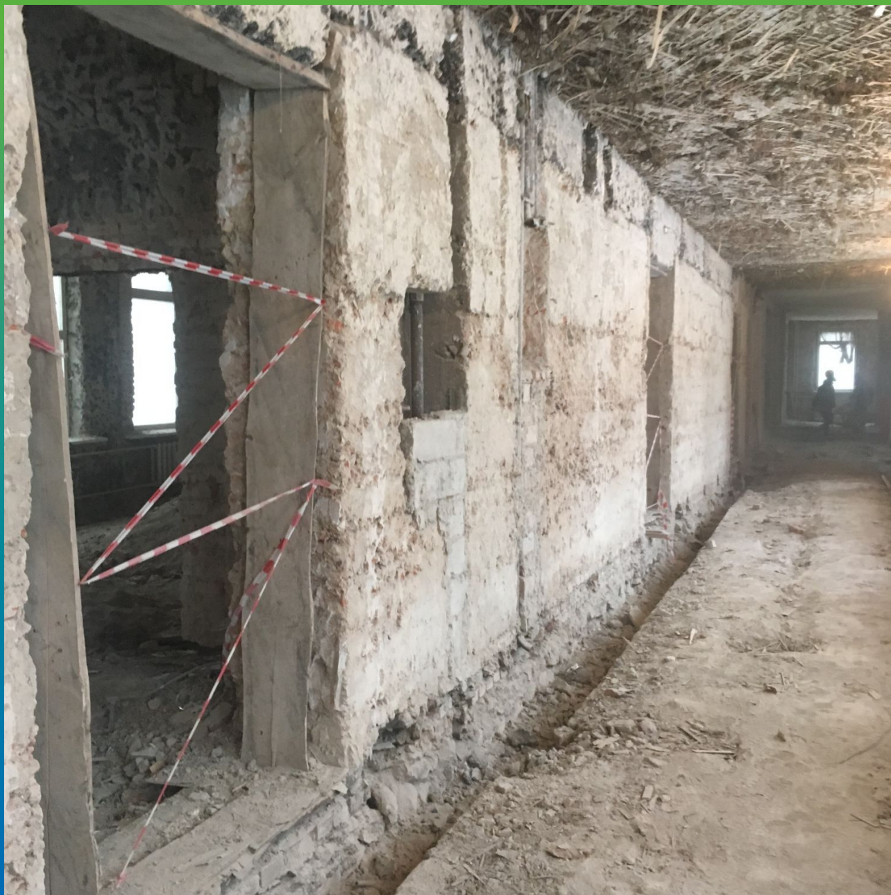
Общий вид объекта