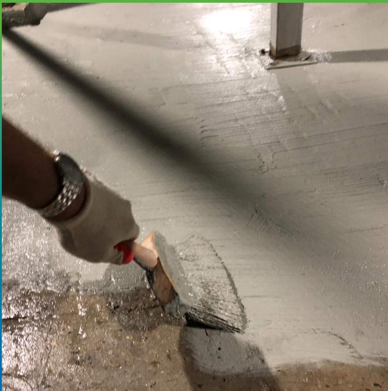
Нанесение состава Стармекс Сил ручным методом