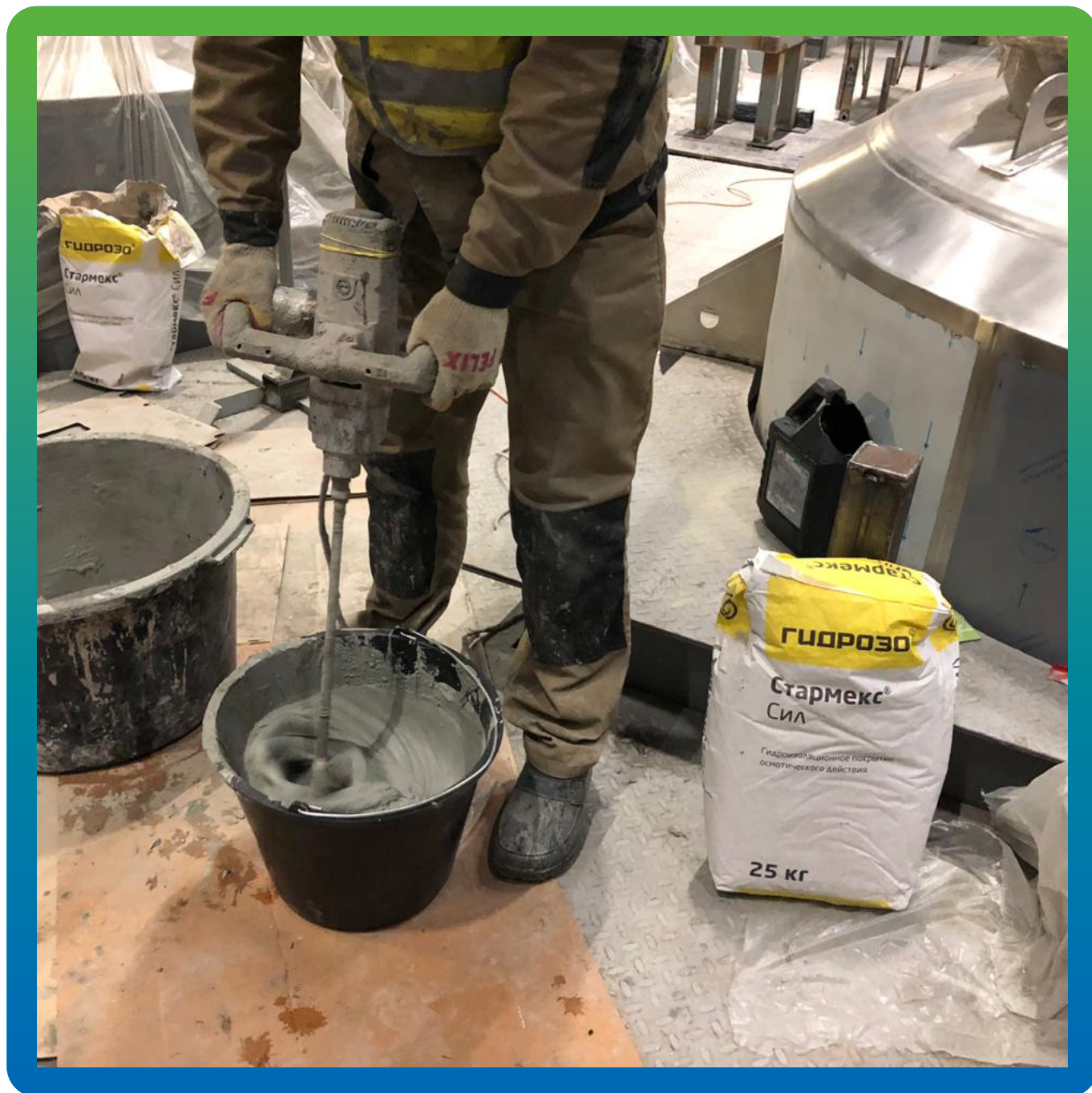
Подготовка материала перед нанесением