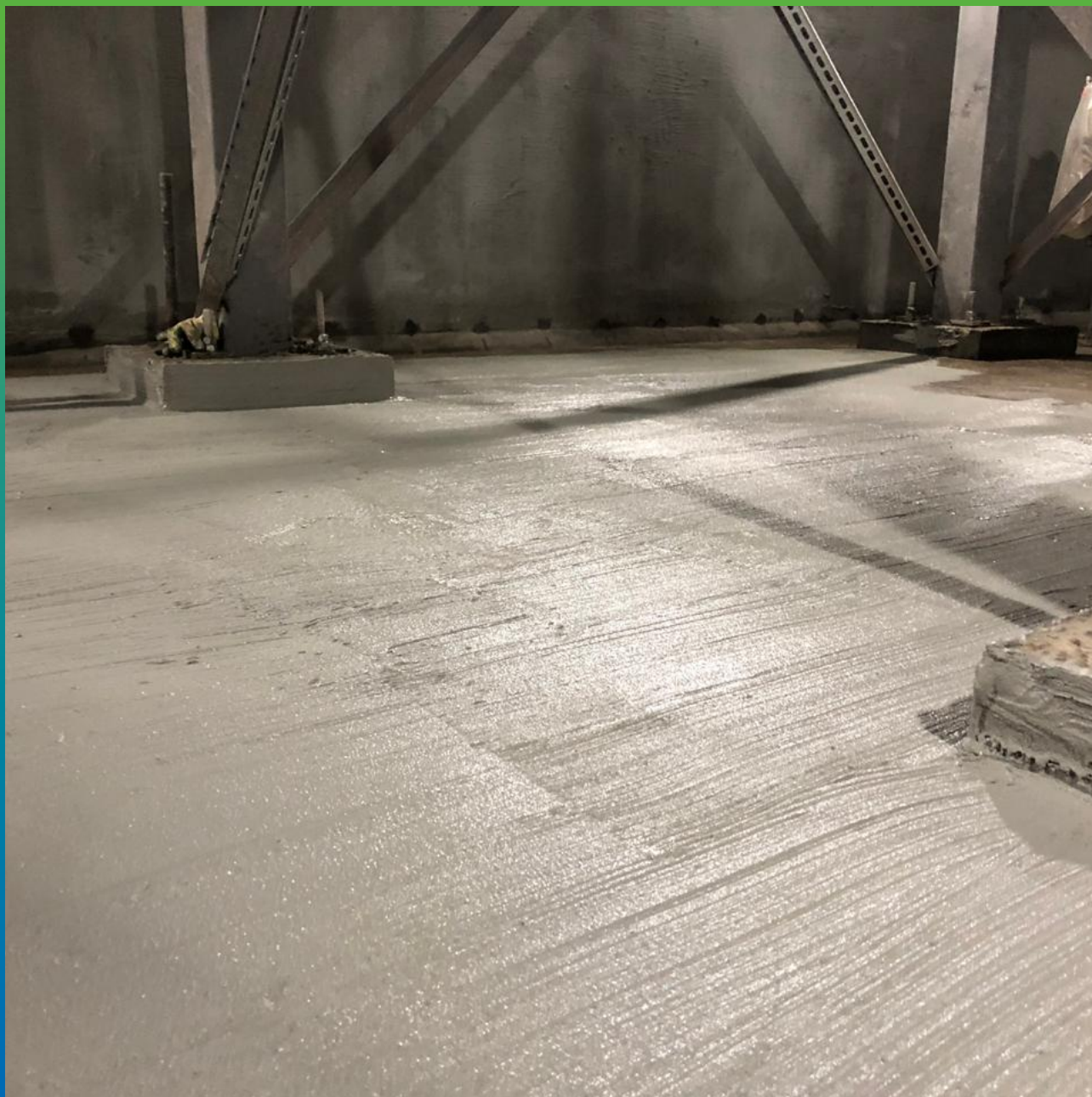
Внешний вид гидроизоляционного состава Стармекс Сил нанесенного на пол