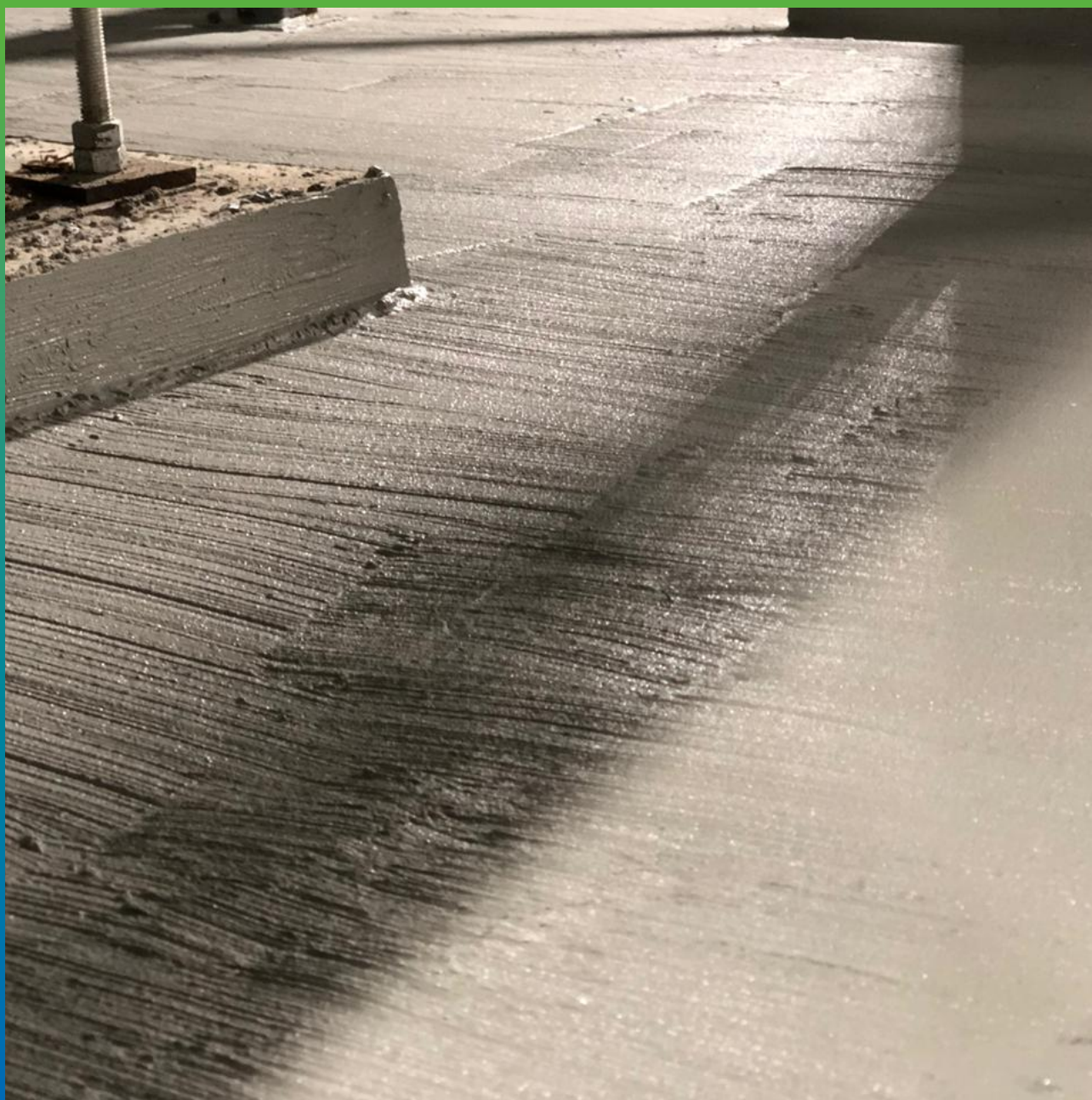
Гидроизоляционный состав Стармекс Сил, нанесенный на пол