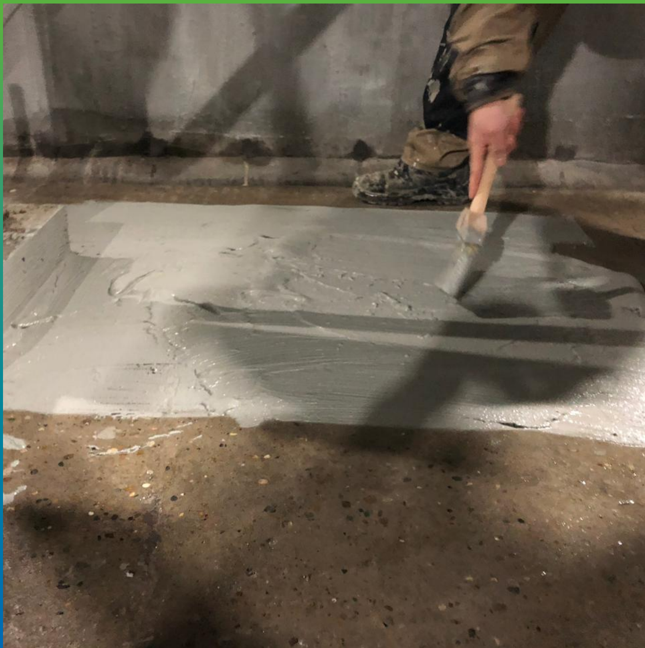
Вид подготовленной поверхности