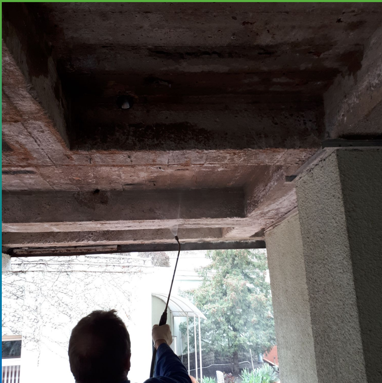
Пропитка плиты перекрытия силоксановой эмульсией Маноксан 150