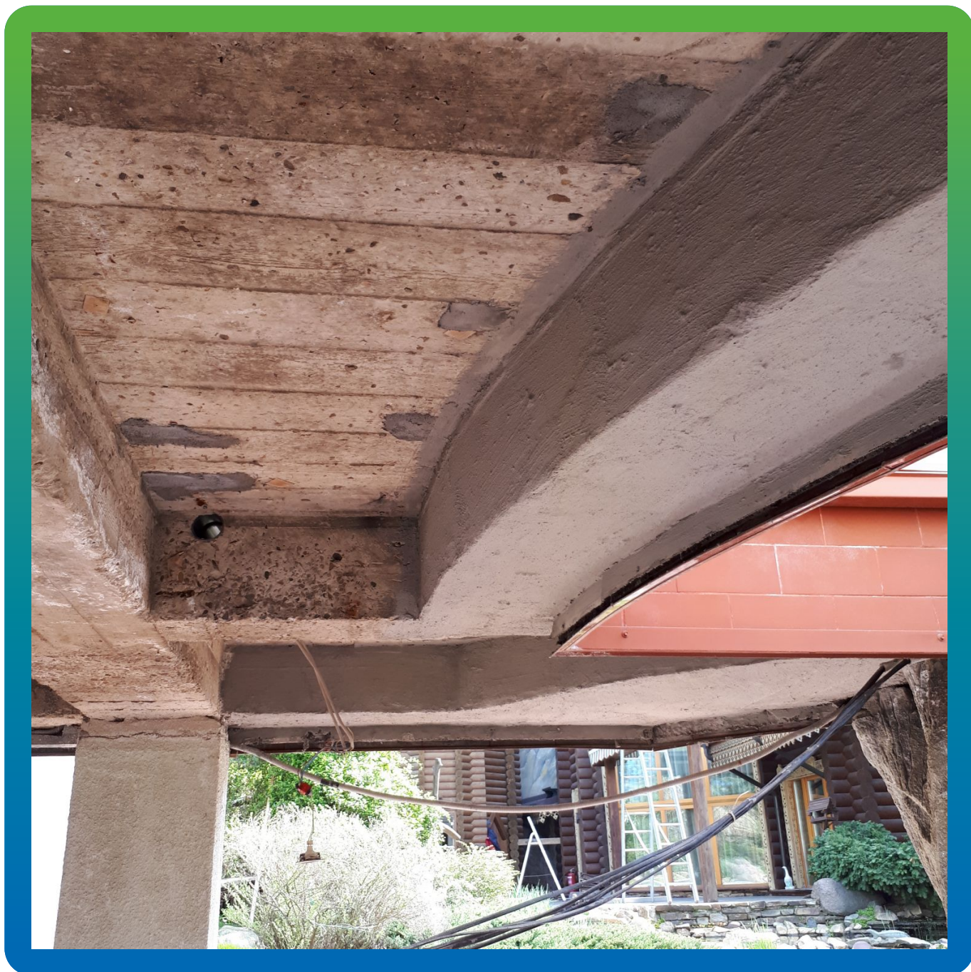
Финишный вид отремонтированного бетона с покрытием гидроизоляцией Стармекс Сил