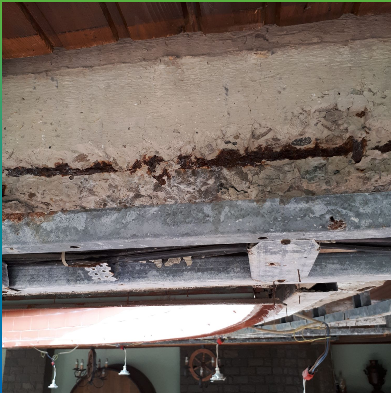
Коррозия арматуры и разрушение защитного слоя бетона