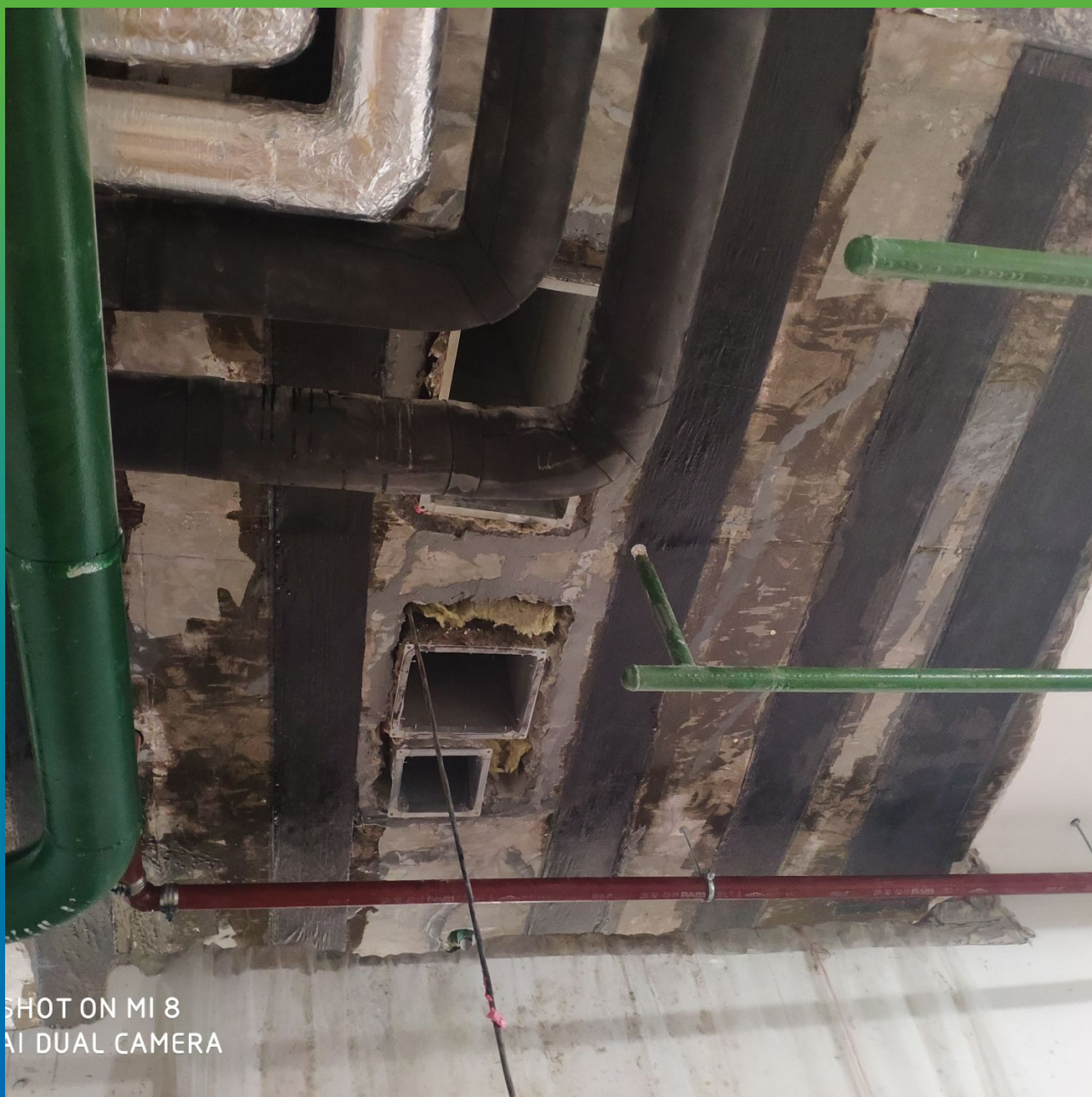
Монтаж КСУ. Этап 1.