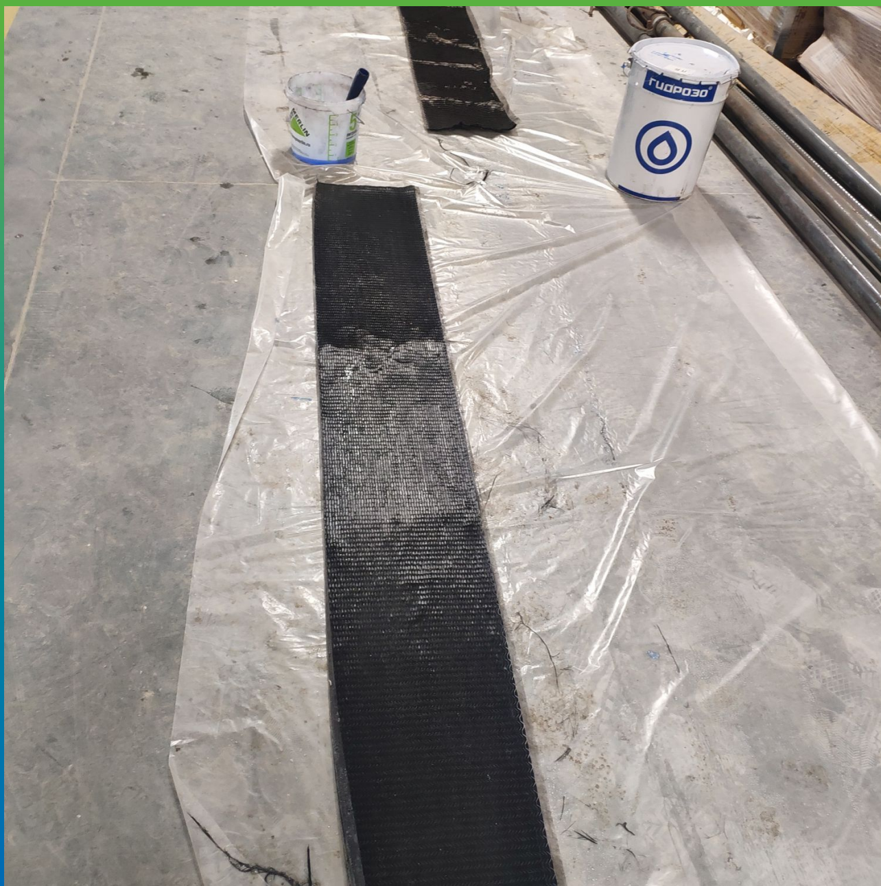
Подготовка углеволоконного холста к монтажу "мокрым" способом.