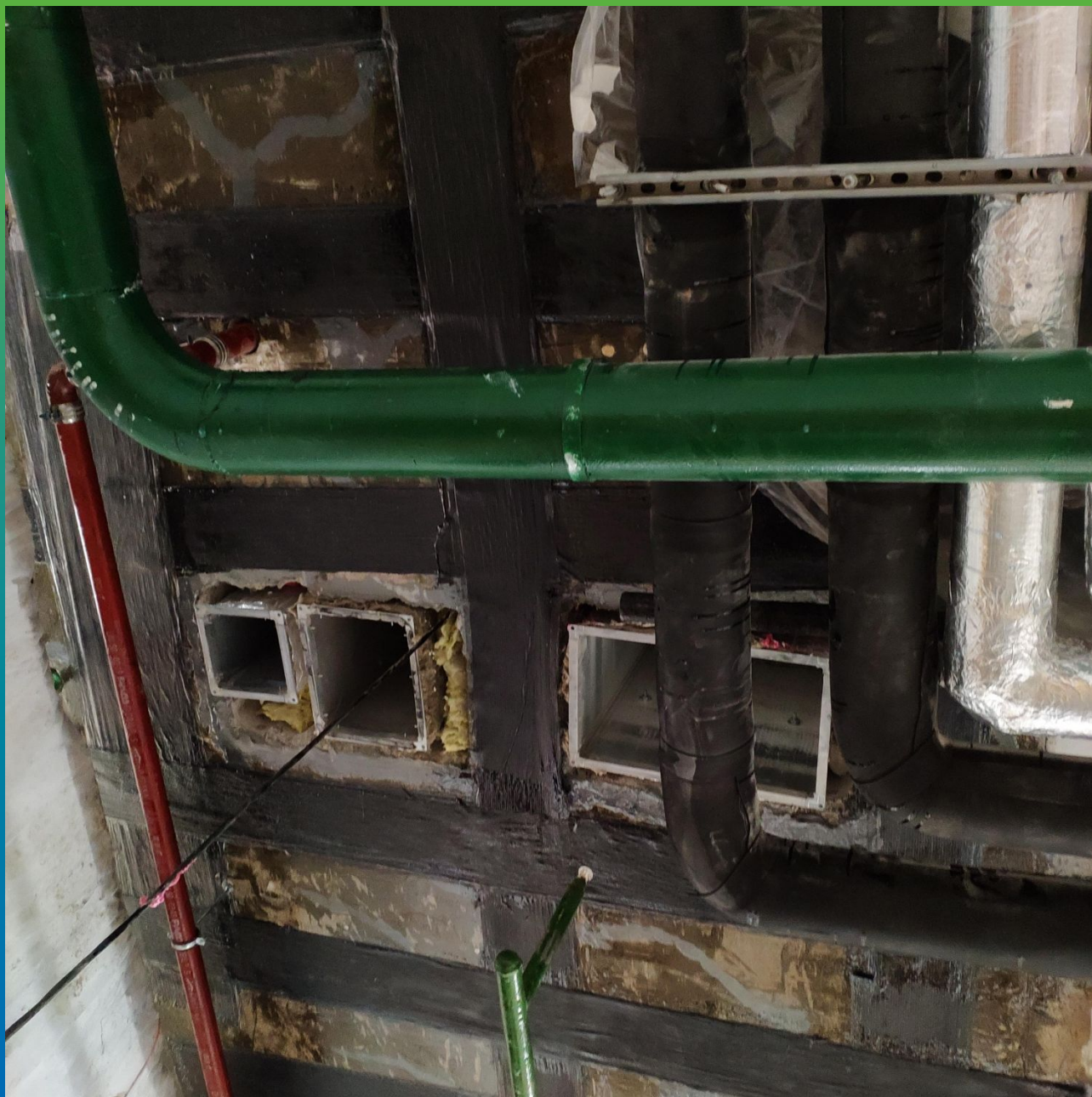
Монтаж КСУ. Этап 2.