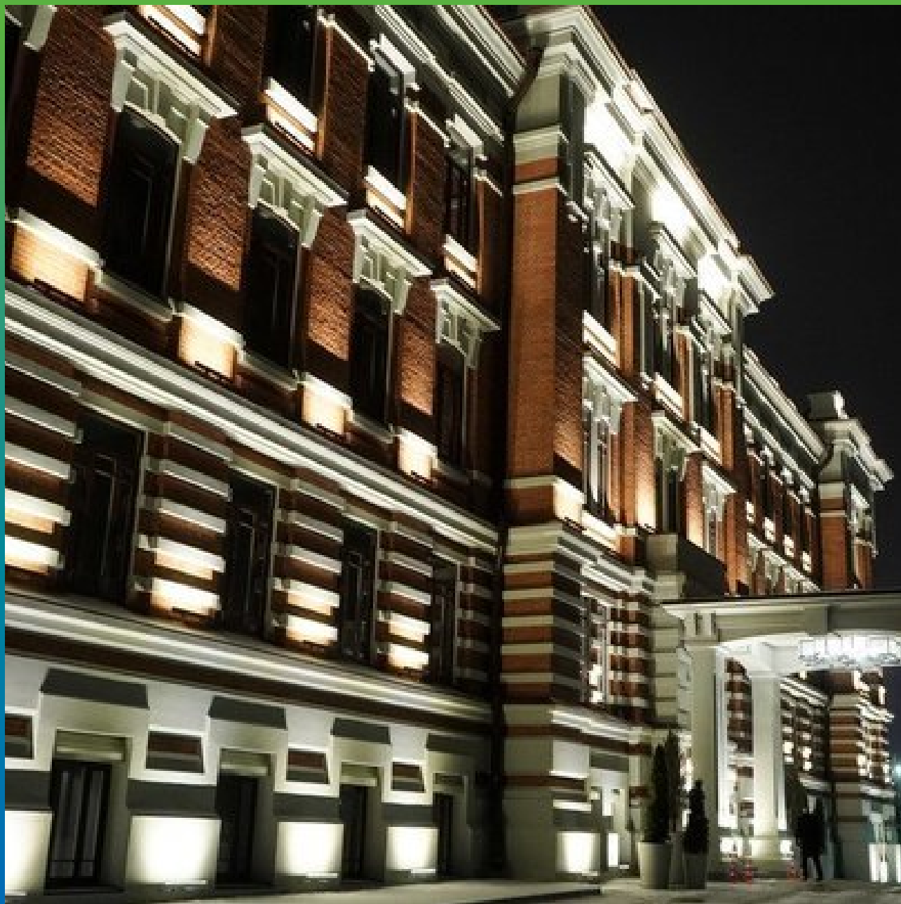
KAZAN PALACE BY TASIGO (ЗДАНИЕ ШАМОВСКОЙ БОЛЬНИЦЫ)