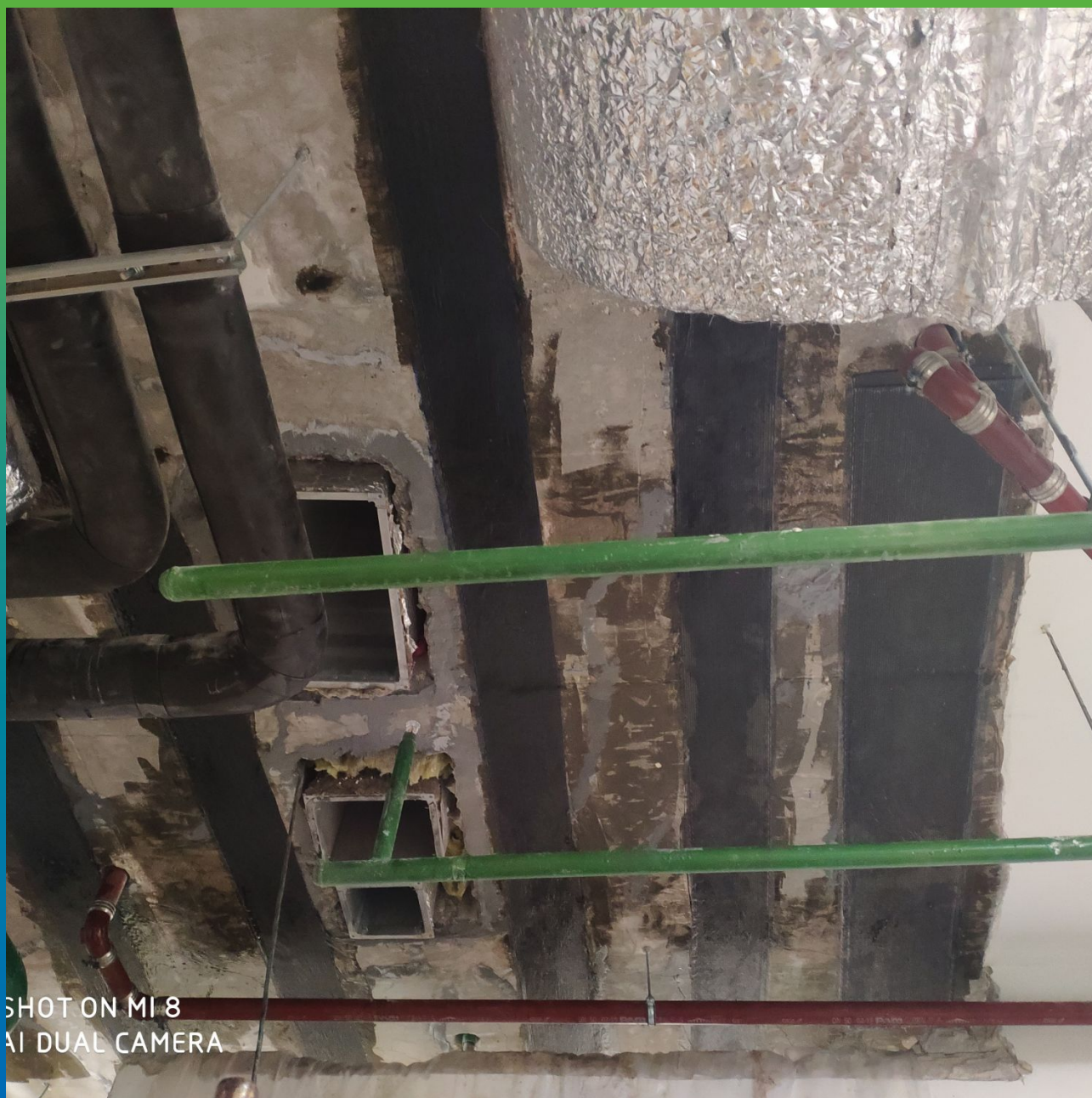
Монтаж КСУ. Этап 1.