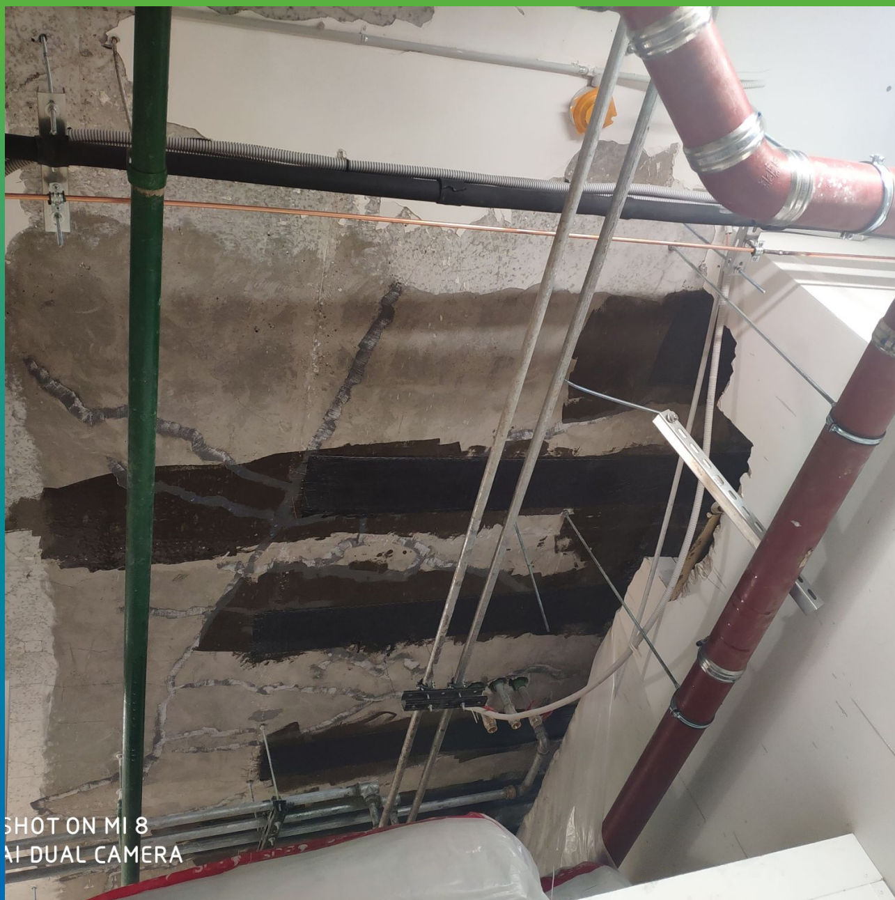
Монтаж КСУ. Этап 1.