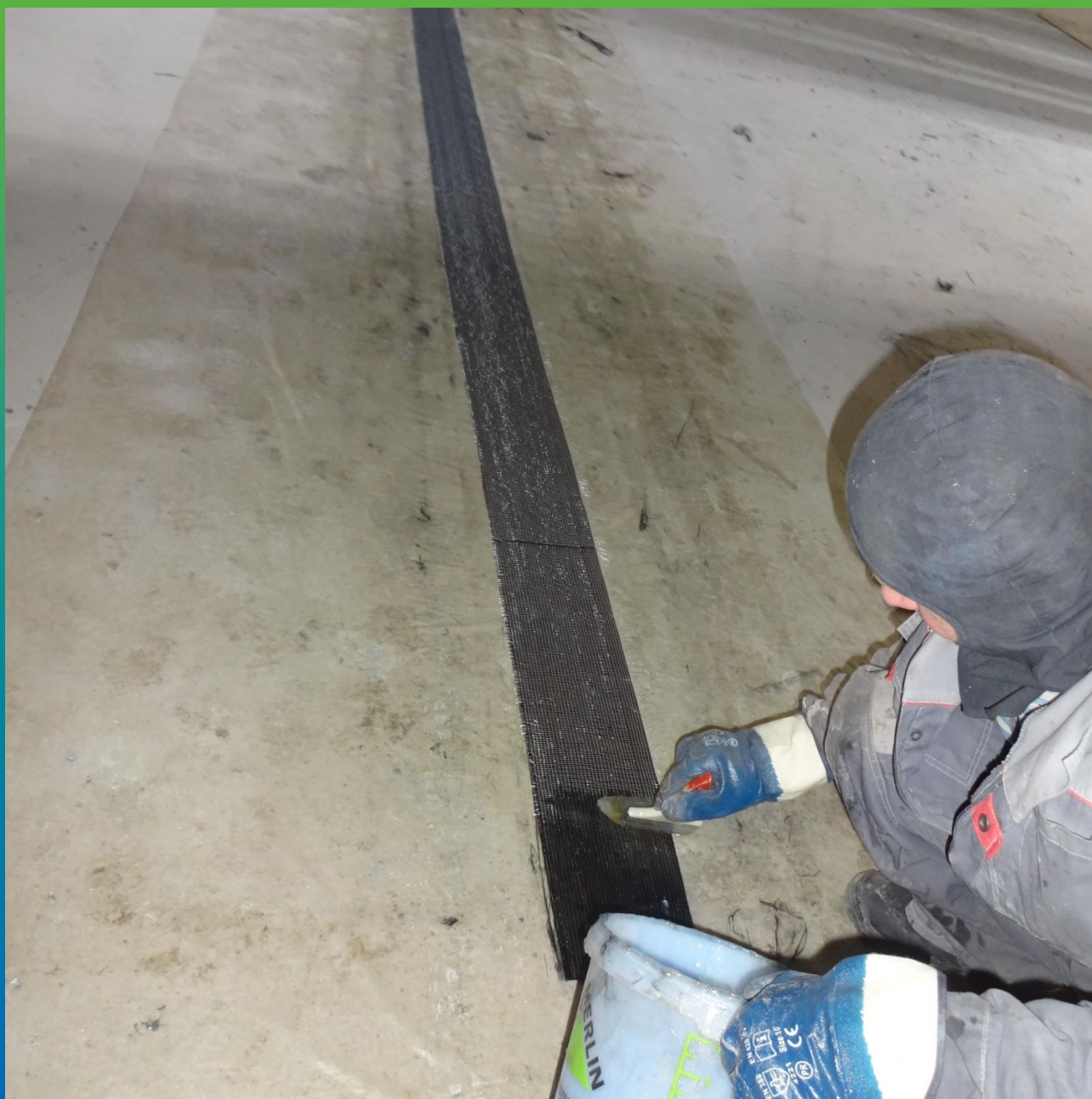
Пропитка ткани Армошел незагущенным клеевым составом Манопокс 372.