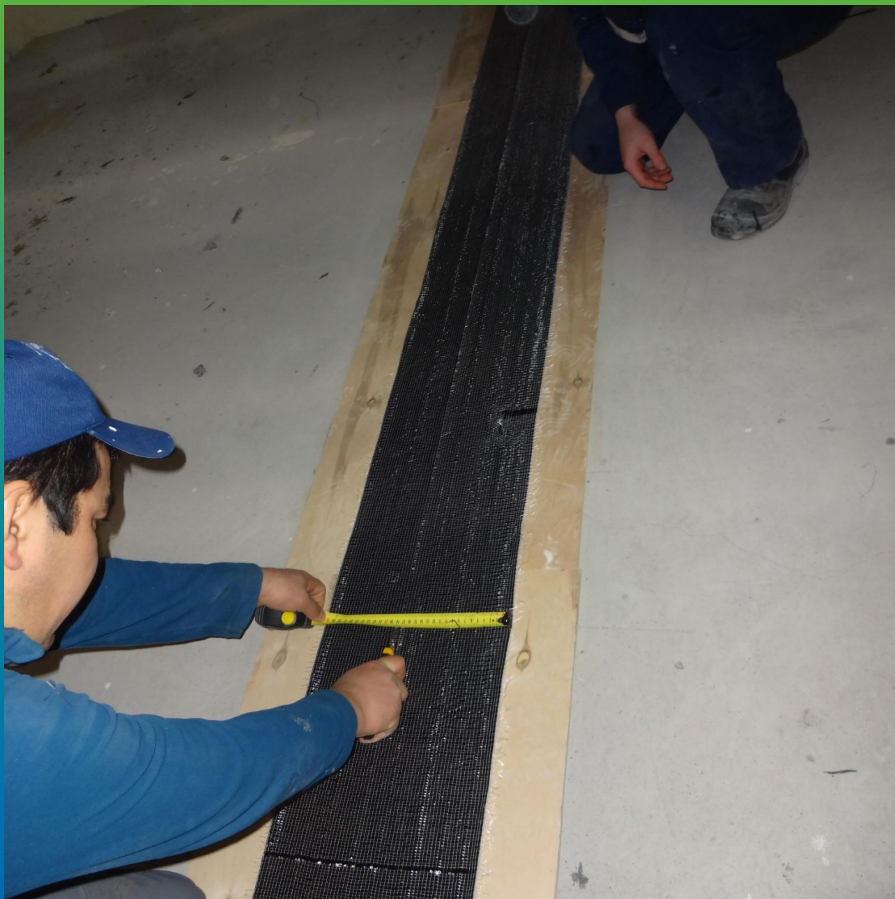
Выполнение раскроя ФАП для монтажа на конструкцию.