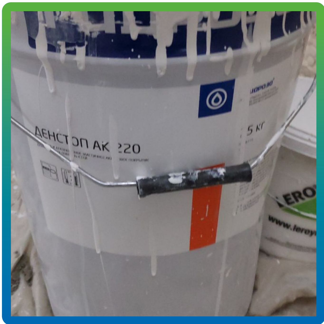
Финишная покраска декоративным и защитным составом ДенТоп АК 220.