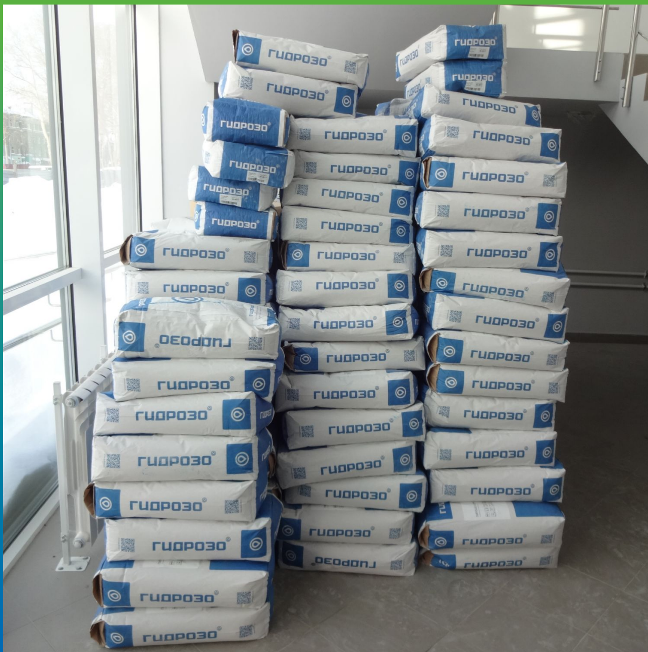
Материалы Гидрозо на объекте.