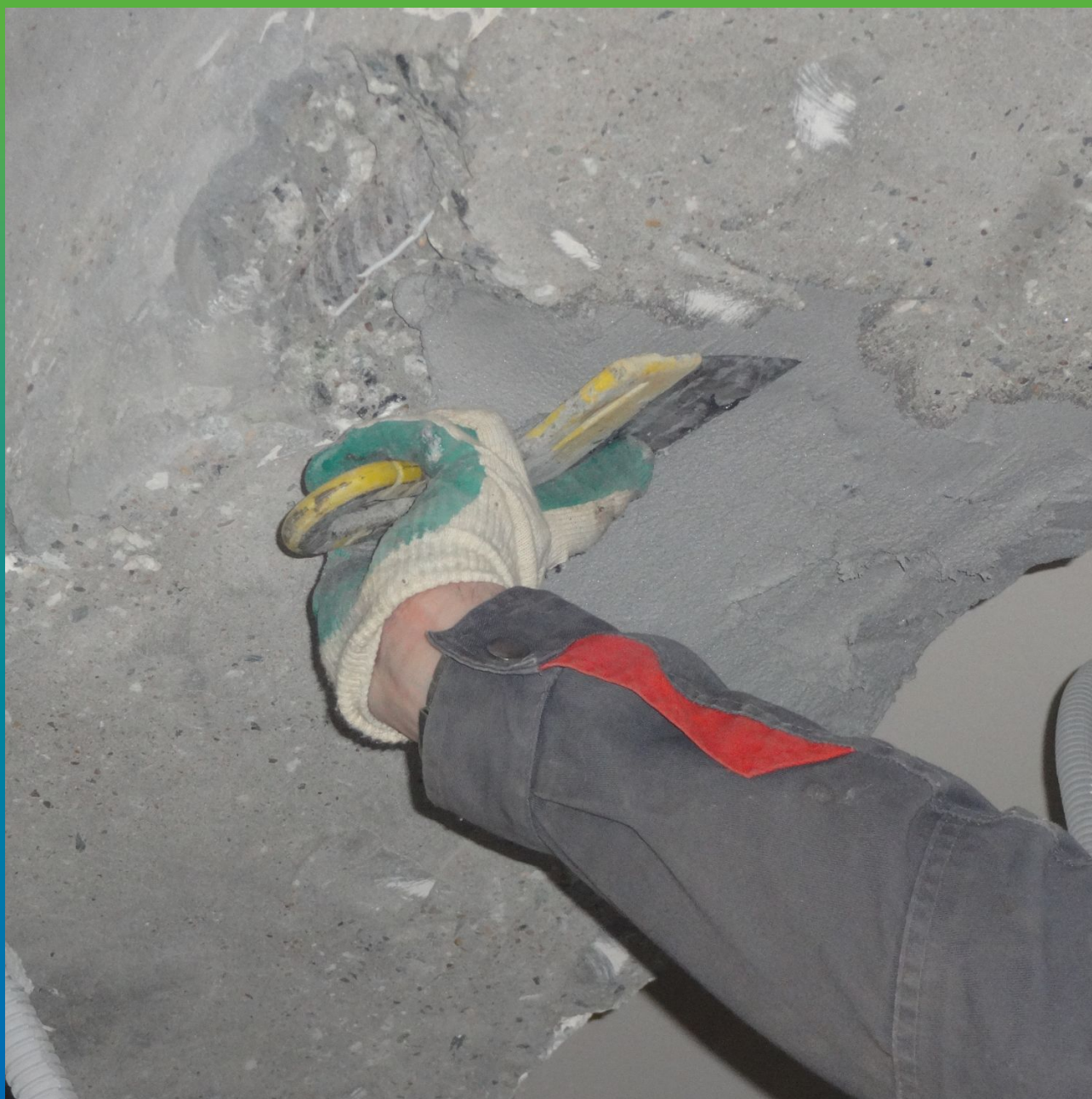
Ремонт поверхности эпоксидным составом Манопокс 331.