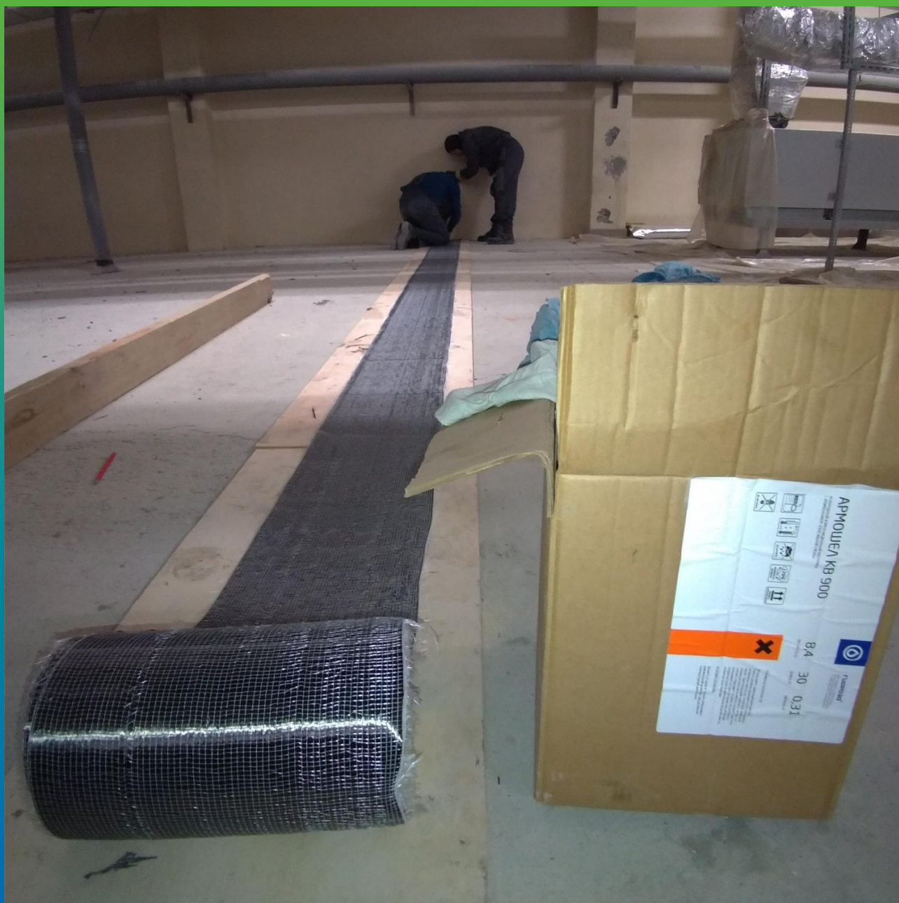
Выполнение раскроя ФАП для монтажа на конструкцию.