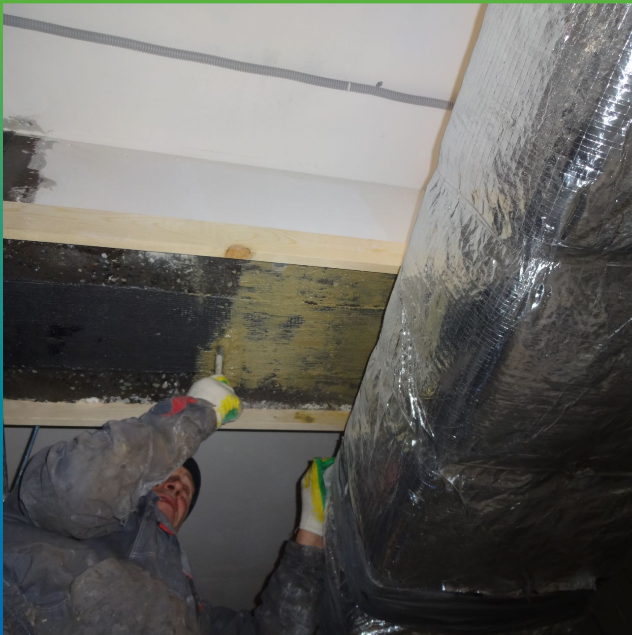
Грунтование составом Пирошел Бонд перед нанесением огнезащиты Пирошел Цем.