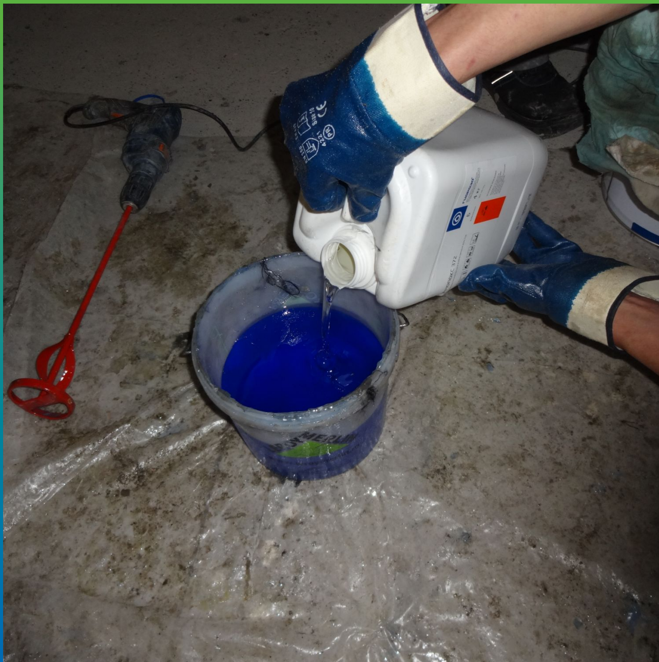
Подготовка Манопокс 372 к грунтованию поверхности и пропитке ткани Армошел.