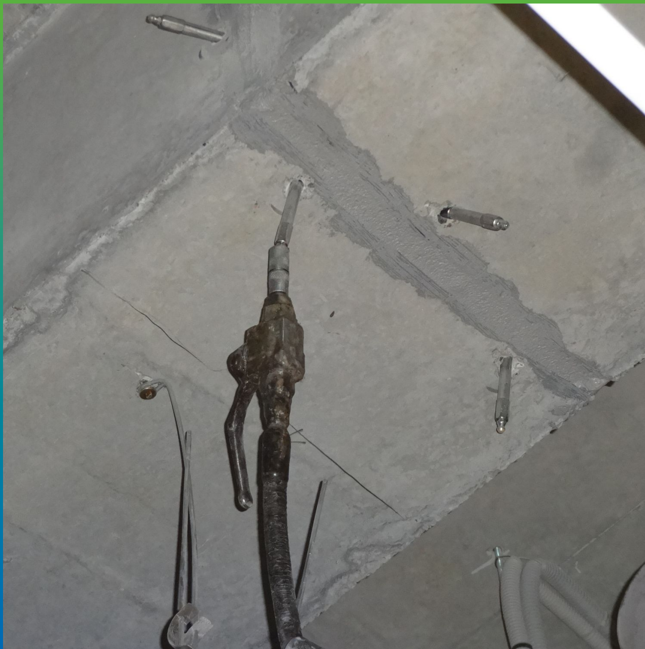
Силовое замыкание трещин инъекционным составом Манопокс 352 ЛВ в несущих балках конструкции.