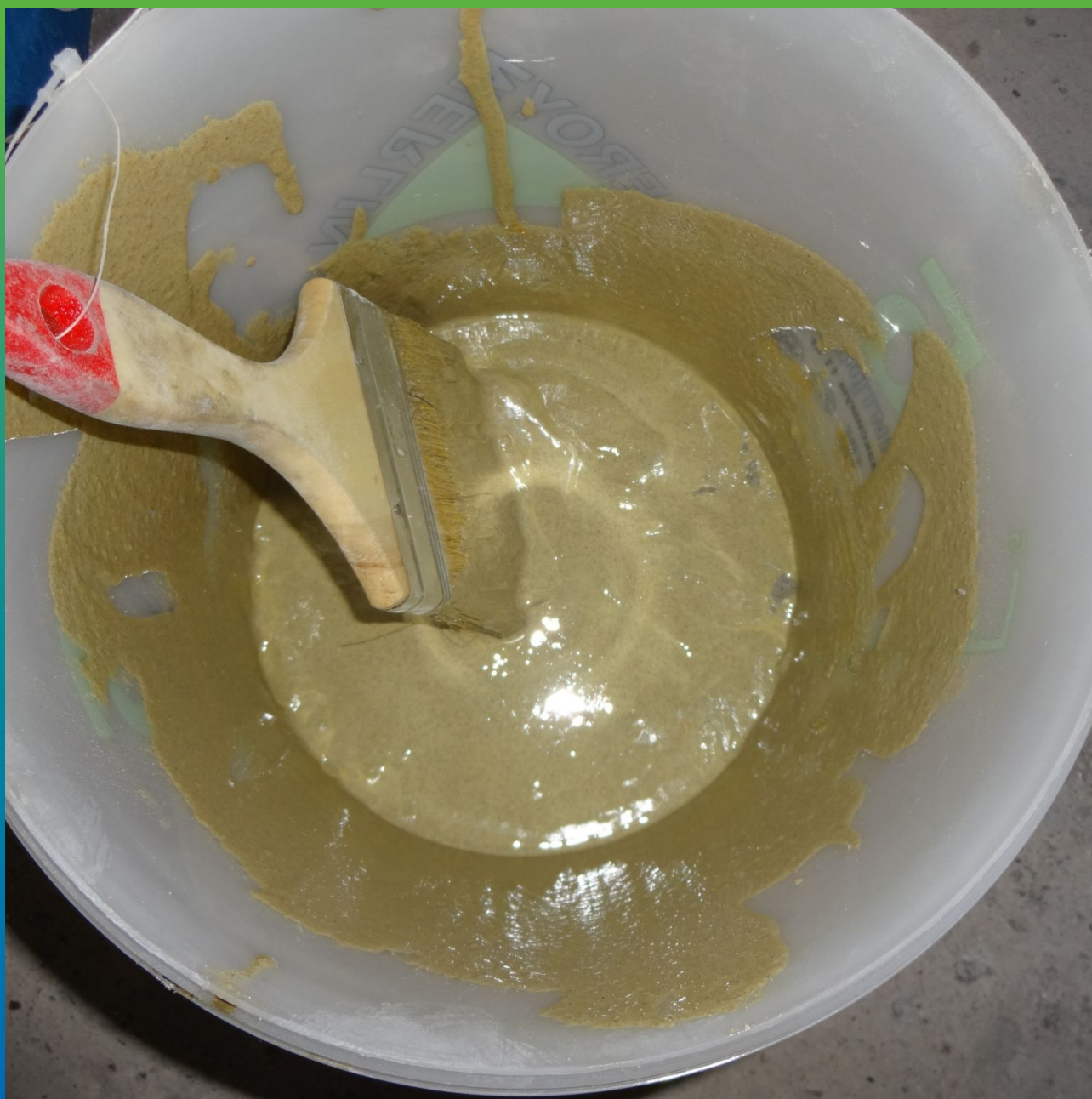
Грунтование усиленной конструкции эпоксидным грунтовочным составом Пирошел Бонд.