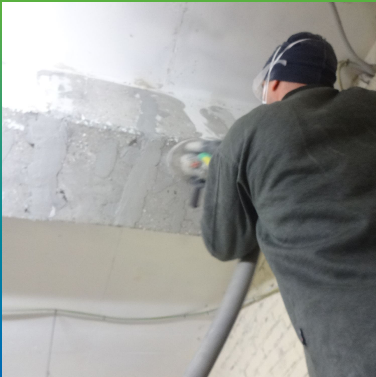
Шлифовка основания перед монтажом системы ФАП.