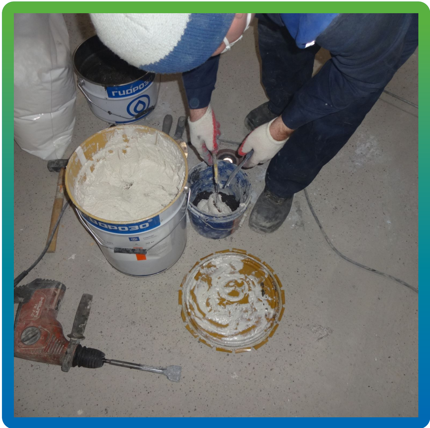
Затворение компонентов А+Б ремонтного состава Манопокс 331.