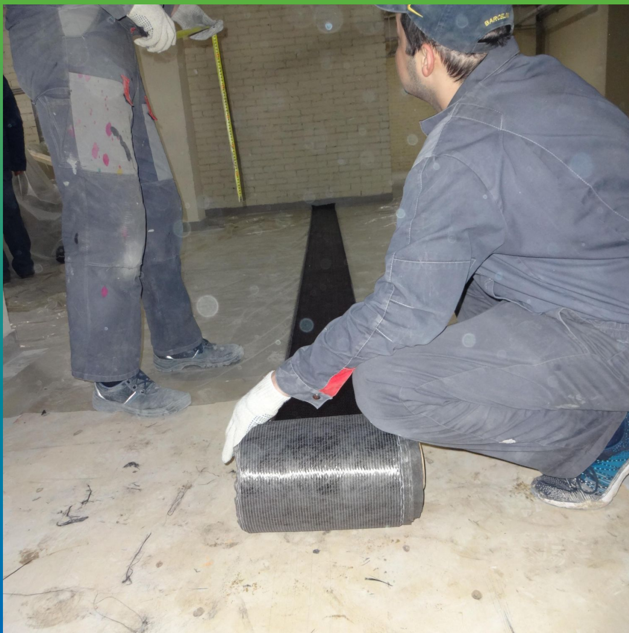
Выполнение раскроя ФАП для монтажа на конструкцию.