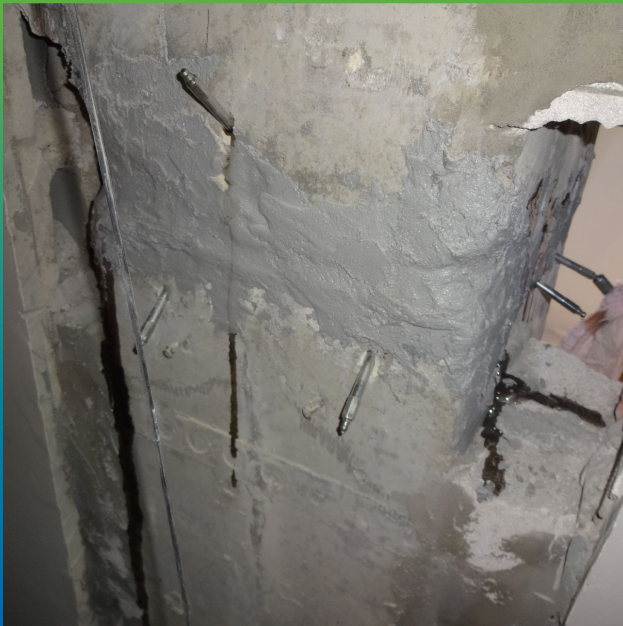
Колонны после проведения инъекционных работ.