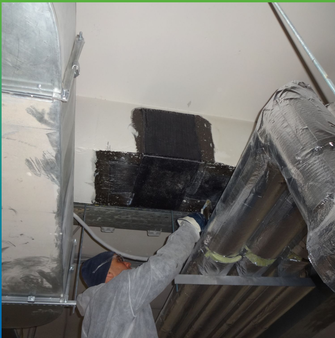
Монтаж пропитанных клеем Манопокс 372 холстов Армошел на конструкцию.