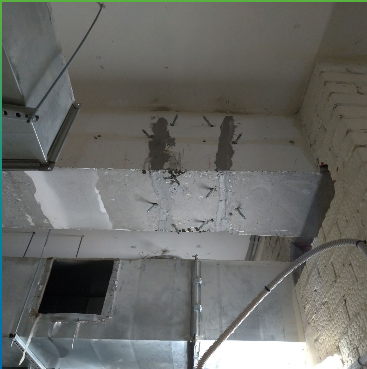
Конструкции после проведения инъекционных работ по силовому замыканию трещин.