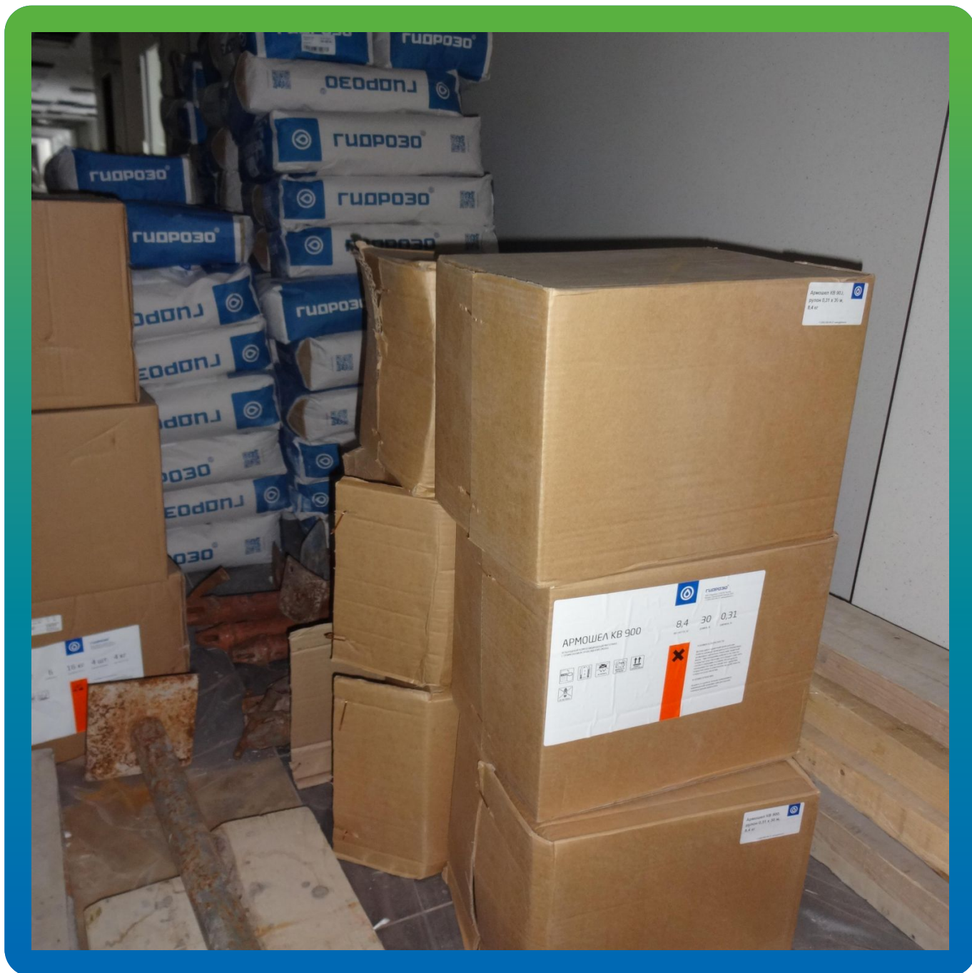
Материалы Гидрозо на объекте.