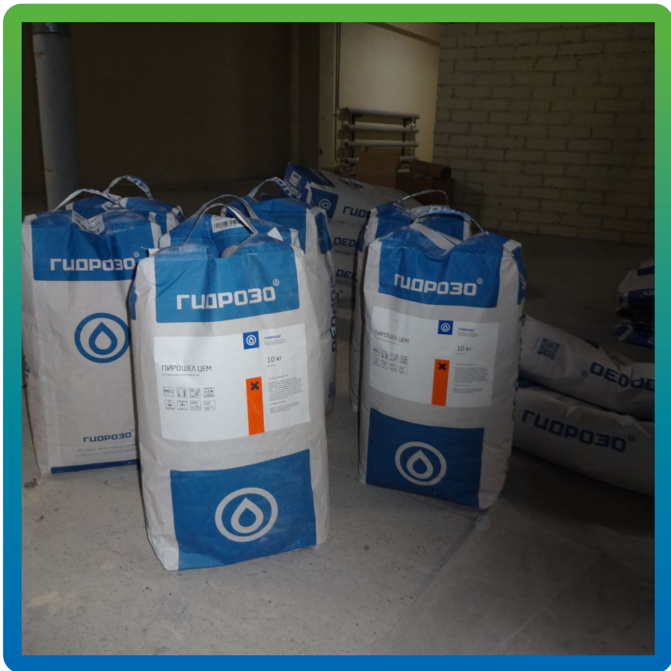
Огнезащитный состав Пирошел Бонд.