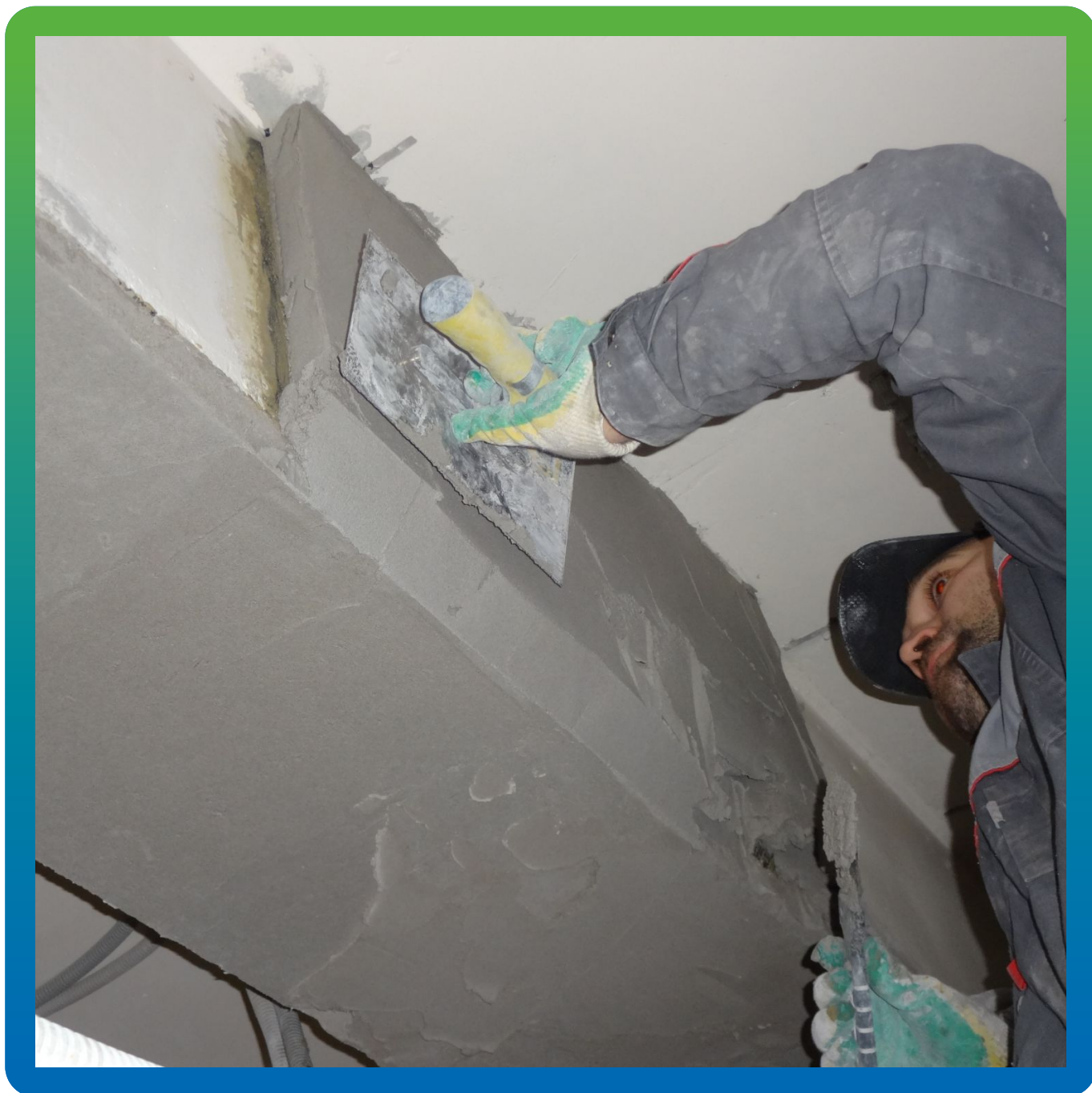
Монтаж огнезащиты Пирошел Цем.