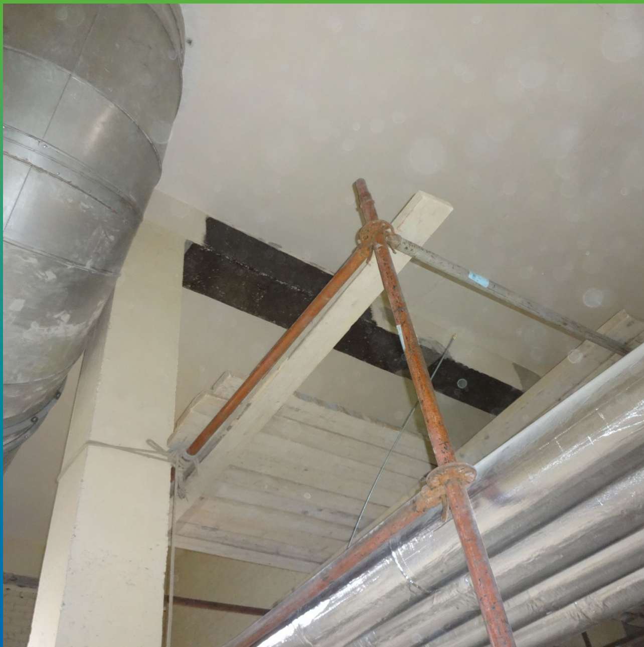
Грунтование поверхности для монтажа ФАП составом Манопокс 372.