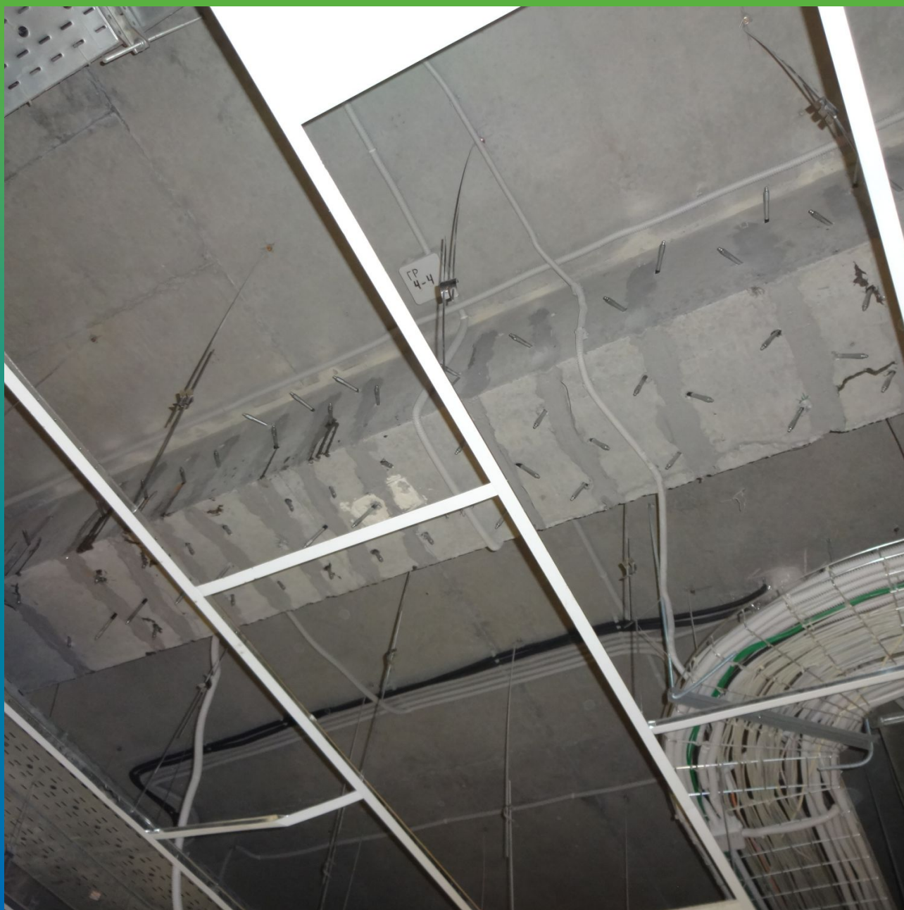
Конструкции после проведения инъекционных работ по силовому замыканию трещин.