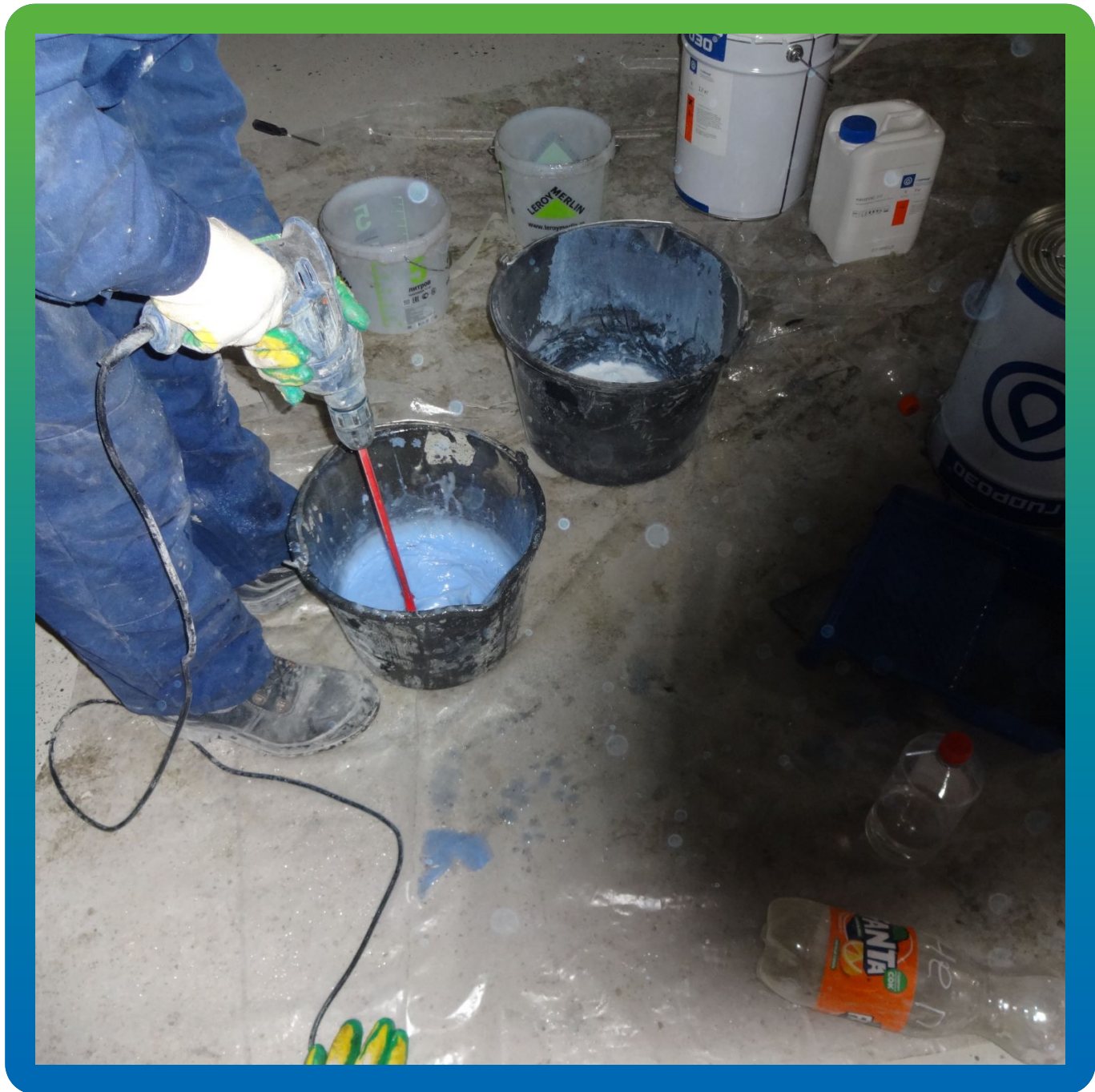
Загущение клея Манопокс 372 составом Манопокс Тикс.