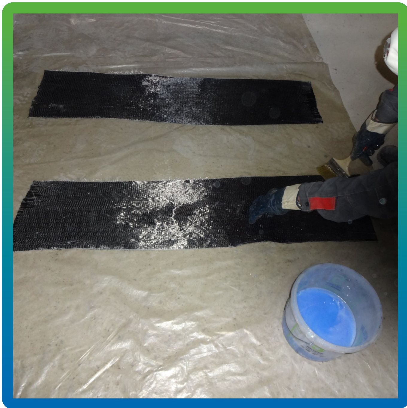
Выполнение раскроя ФАП для монтажа на конструкцию.