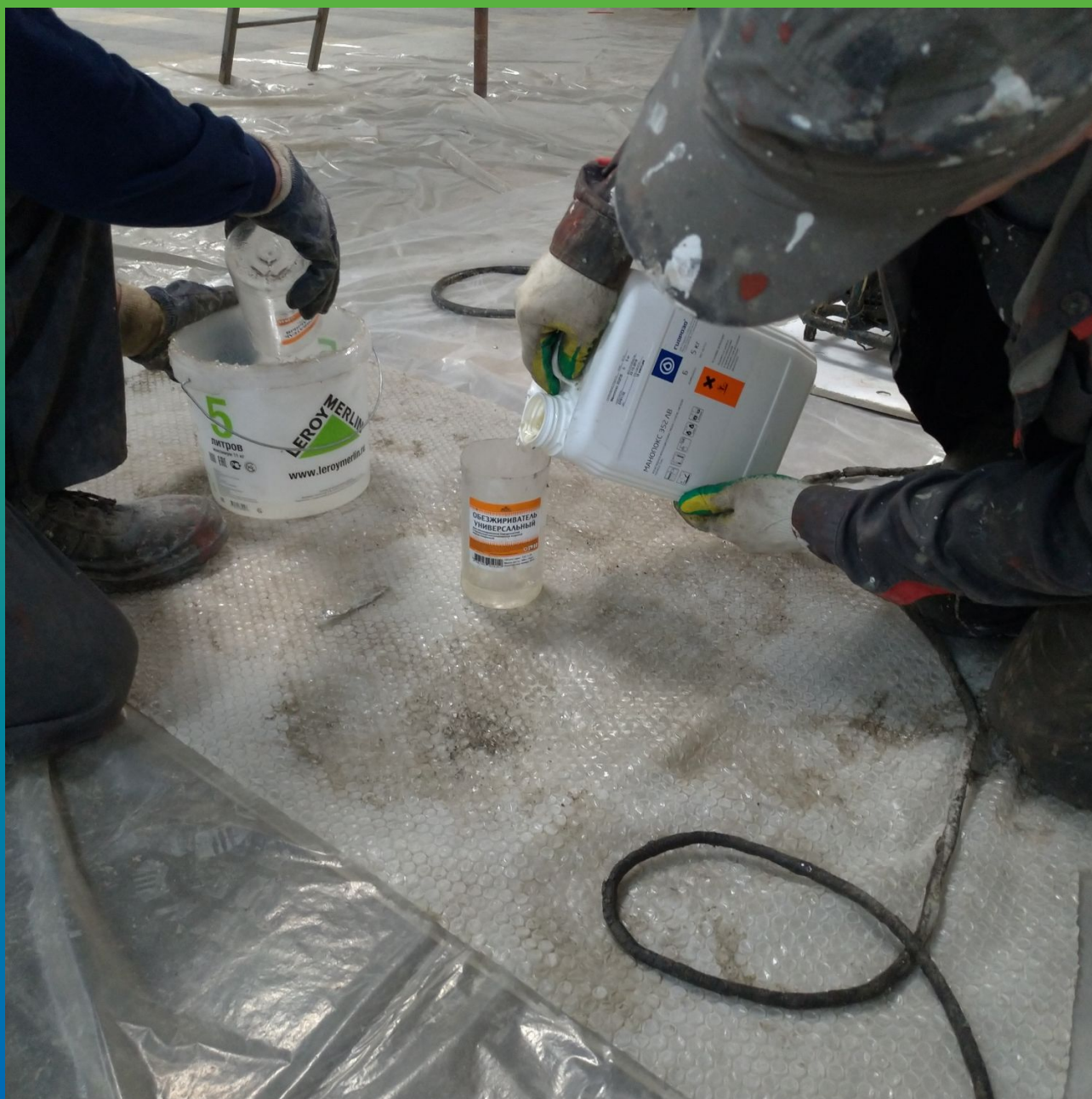
Затворение А+Б компонентов Манопокс 352 ЛВ.