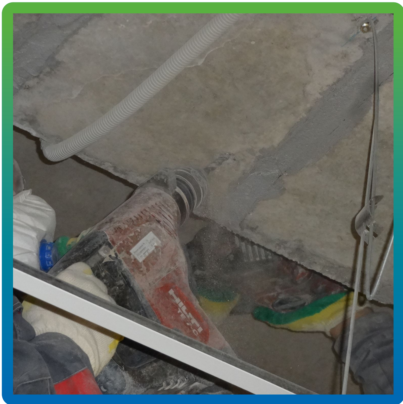
Бурение шпуров для установки пакеров.