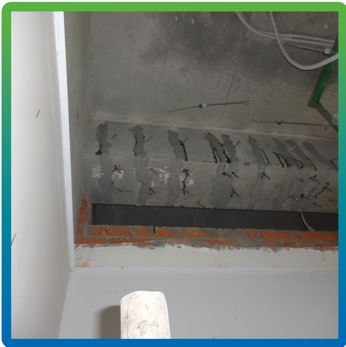
Конструкции после проведения инъекционных работ по силовому замыканию трещин.