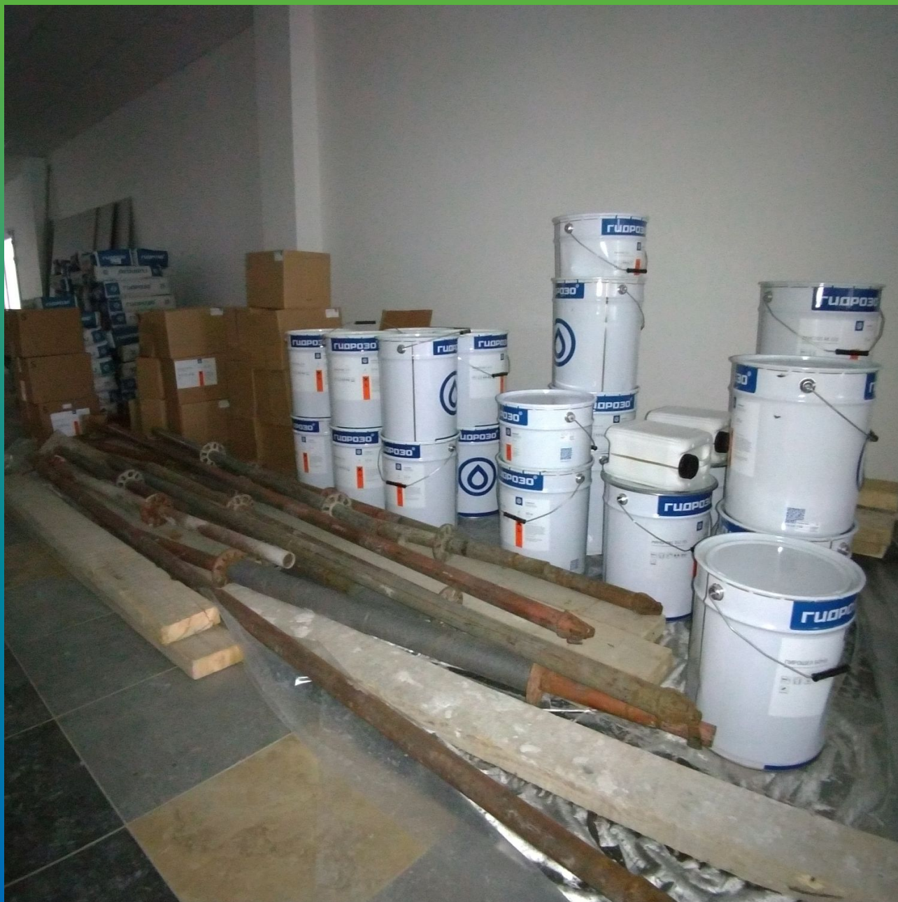
Материалы Гидрозо на объекте.