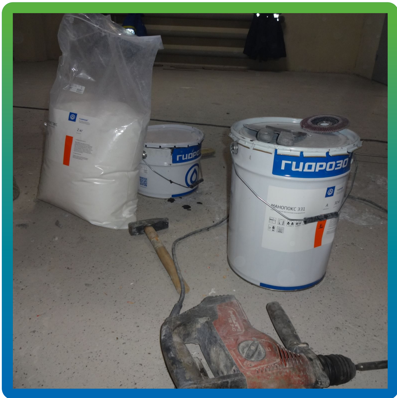
Ремонтный эпоксидный состав Манопокс 331.