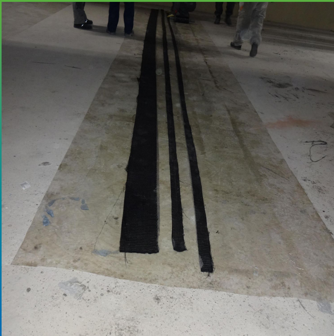
Выполнение раскроя ФАП для монтажа на конструкцию.