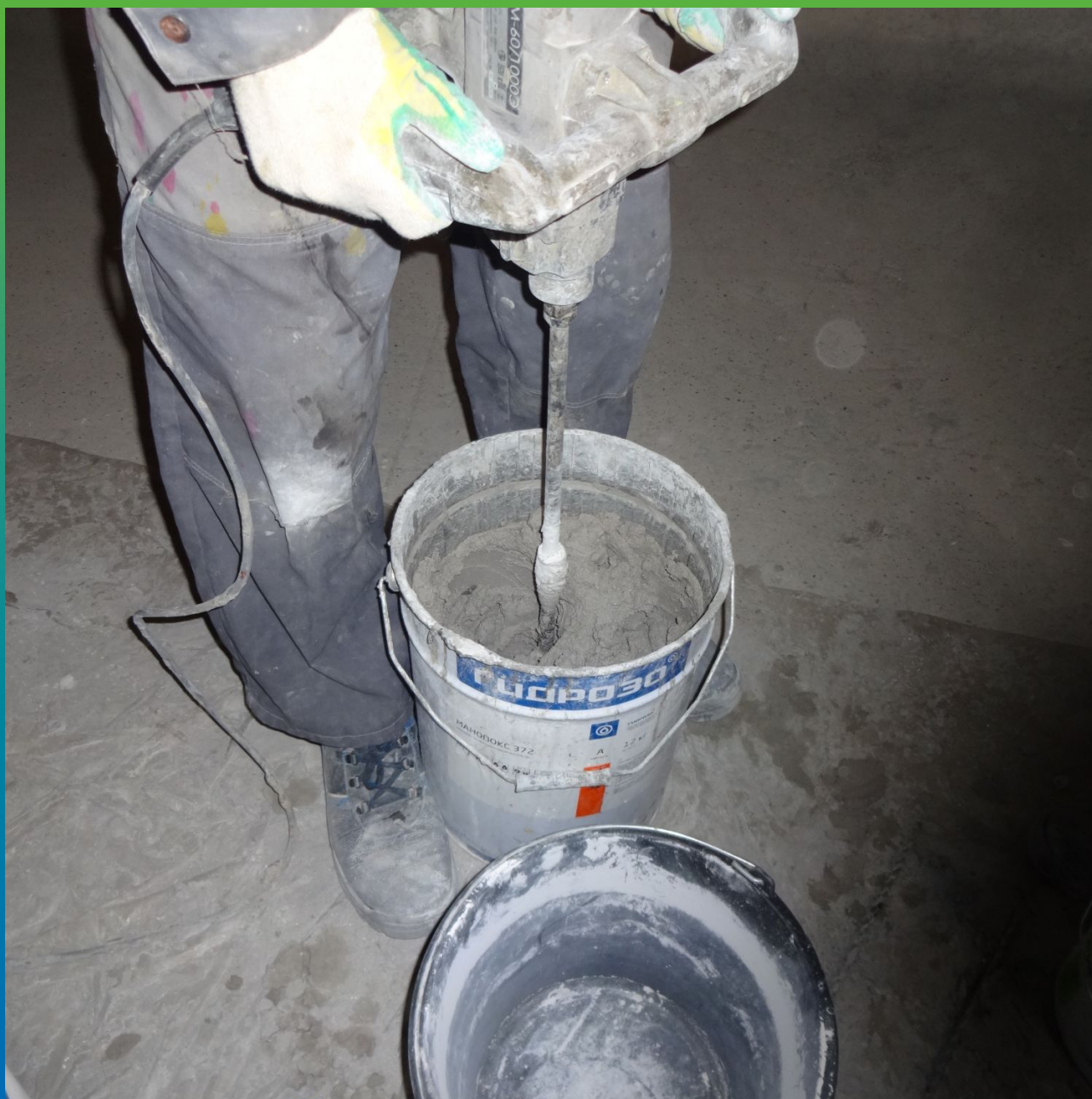
Затворение с водой огнезащитного состава Пирошел Цем.