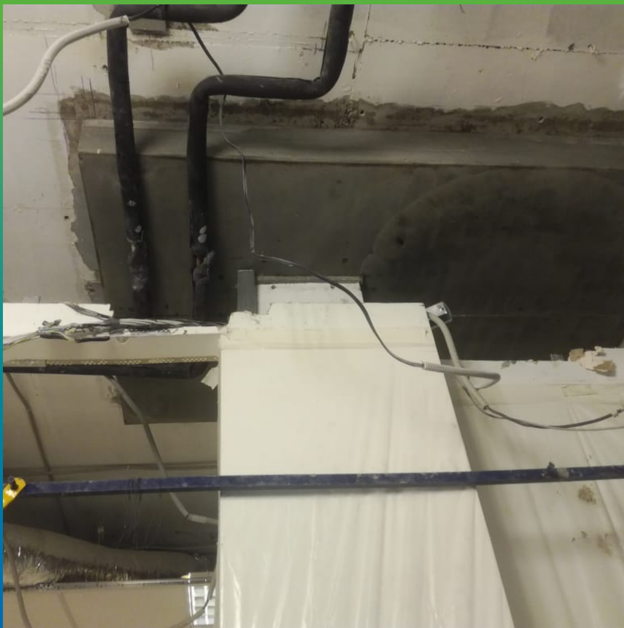
Отремонтированная несущая конструкция