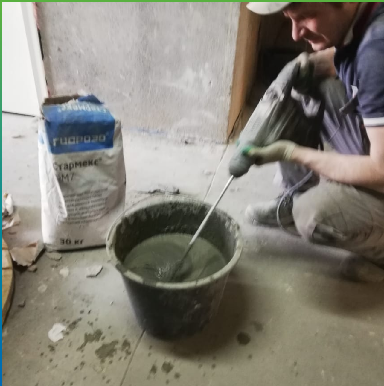
Приготовление материала Стармекс ФМ7