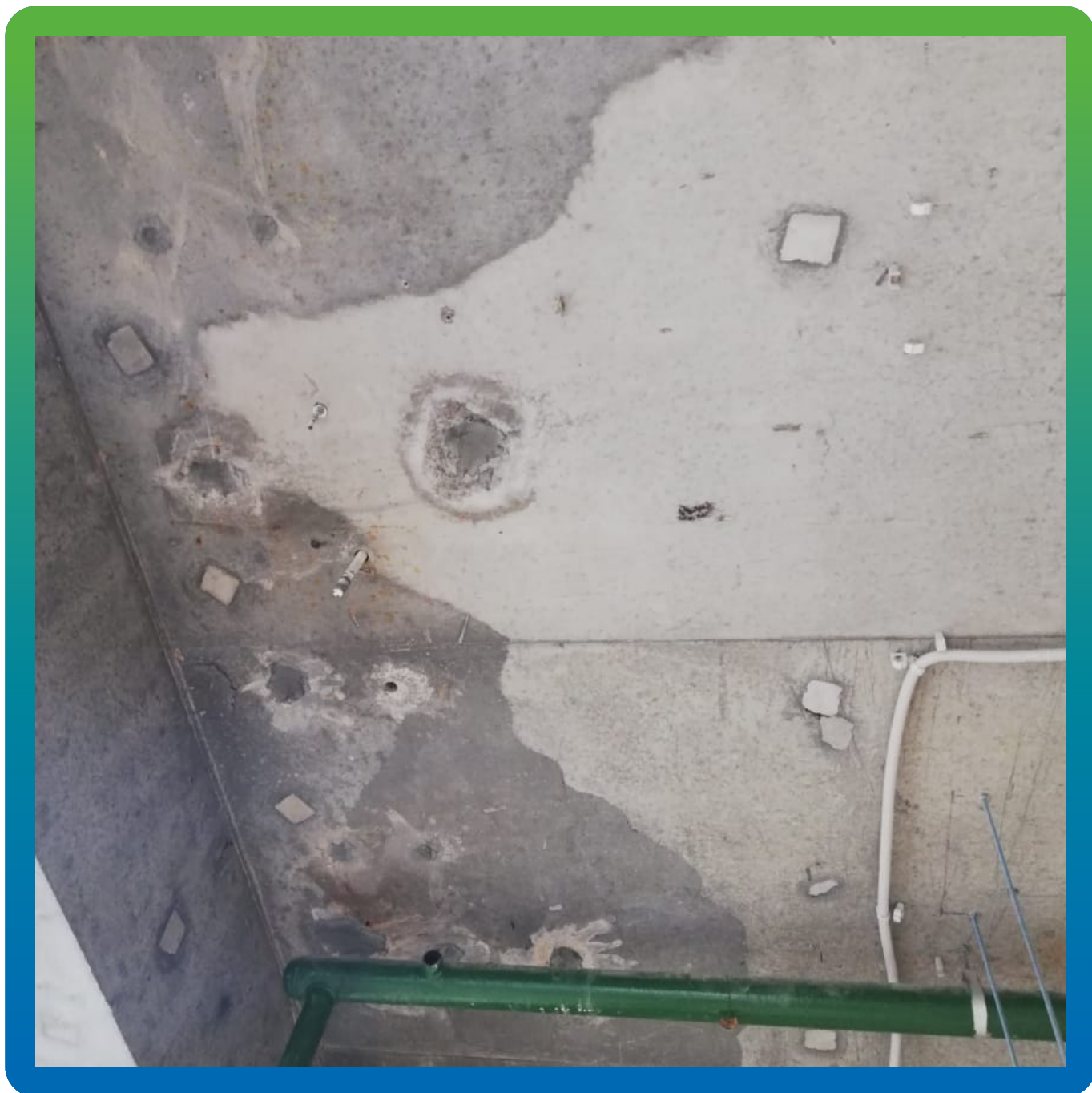
Подготовка отверстий для заливки ремонтного состава Стармекс ФМ7