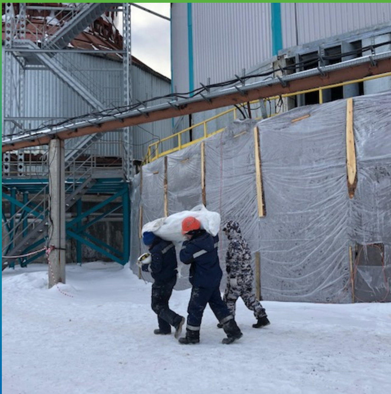
Транспортировка материала на участок. Плита покрытия машинного зала.