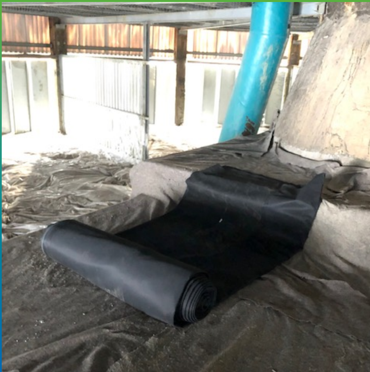
Распаковка материала Прелести СТ.