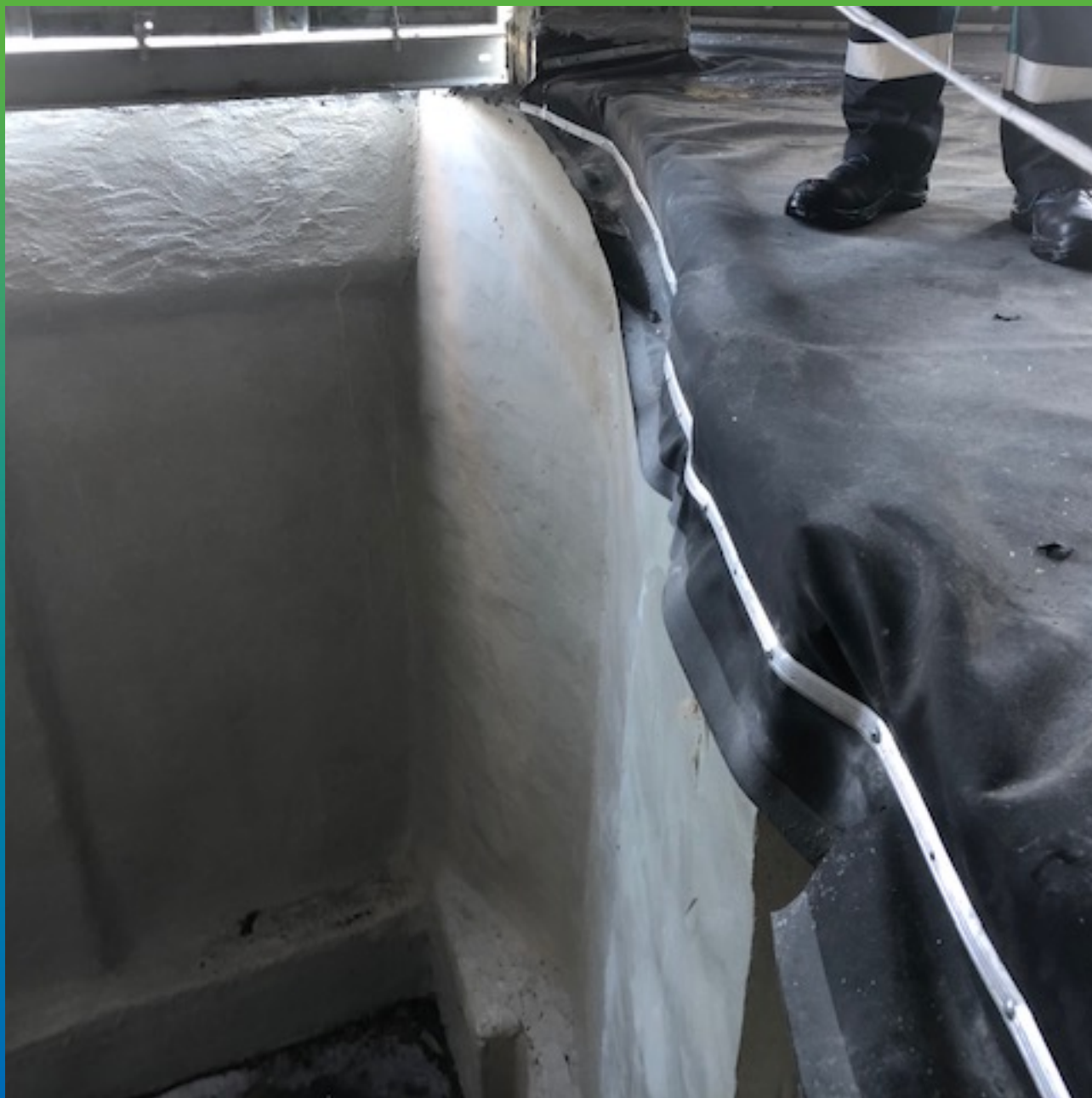
Монтаж прижимной планки по краю полотна.