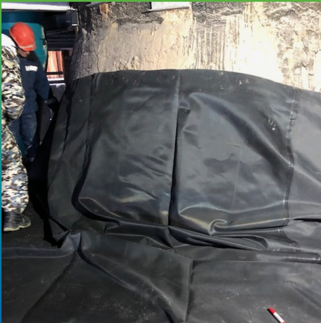
Разметка карты перед подрезкой.