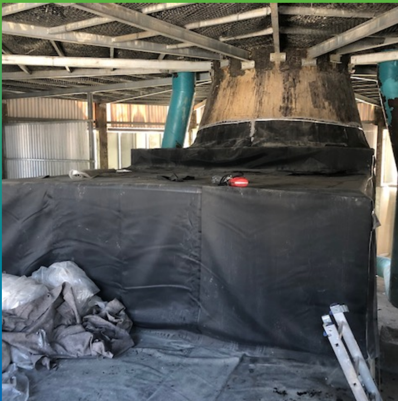
Смонтированное полотно Преласта СТ. Общий вид.