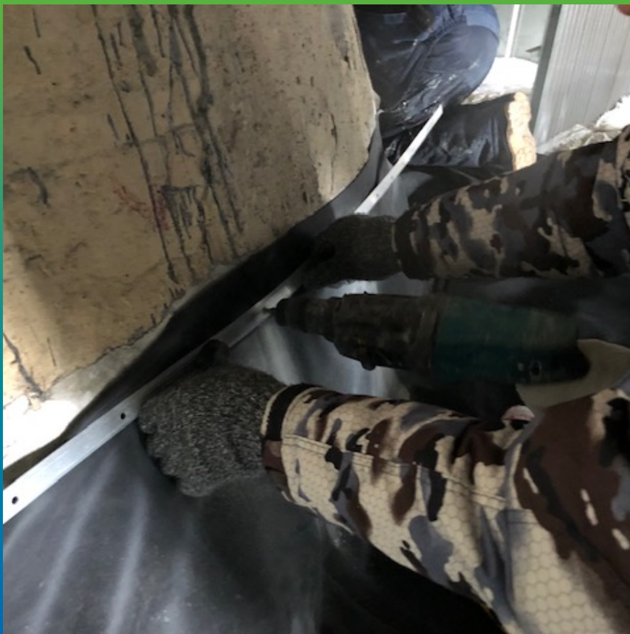
Монтаж прижимной планки по краю полотна.