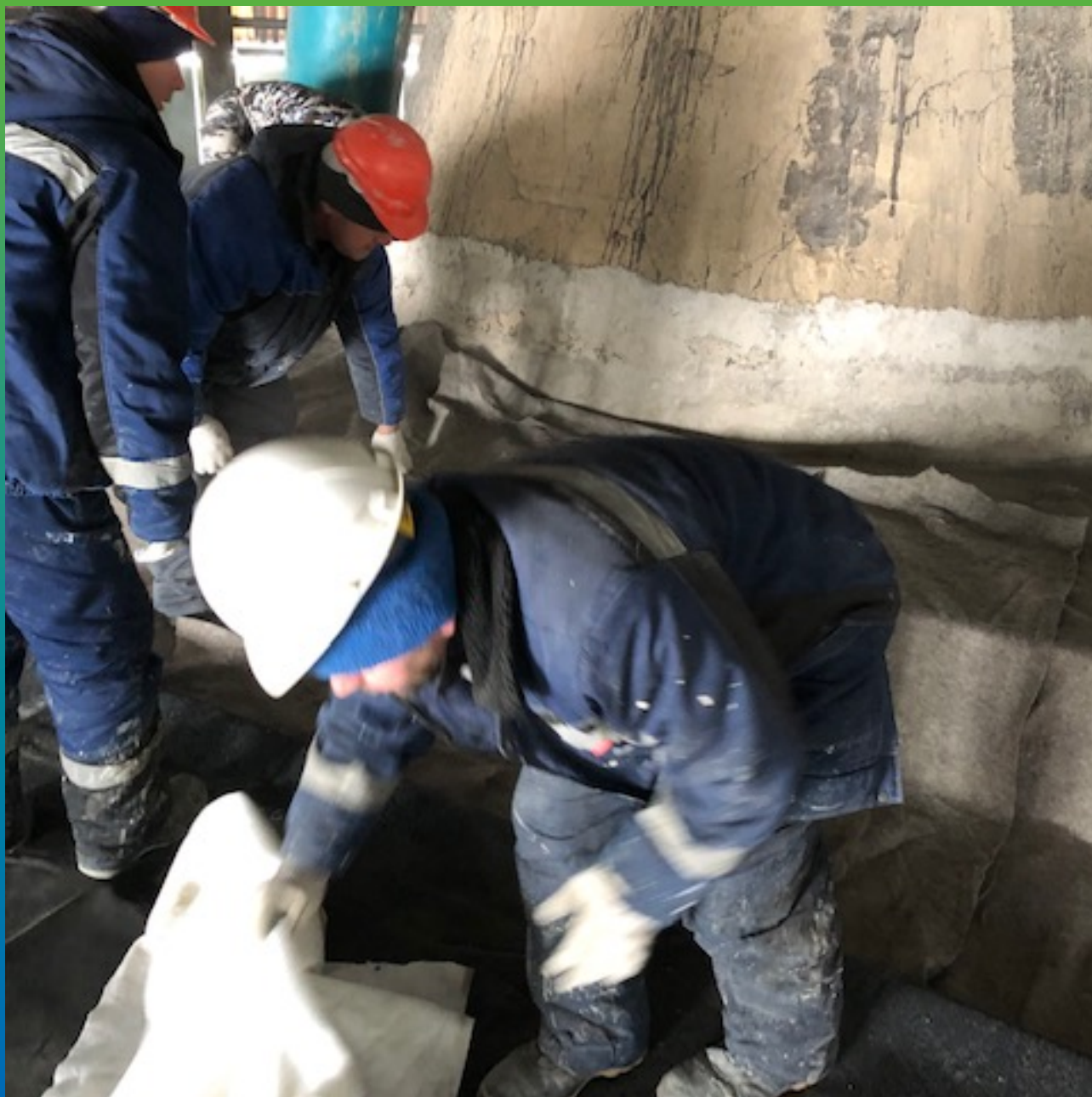
Укладка подстилающего материала.