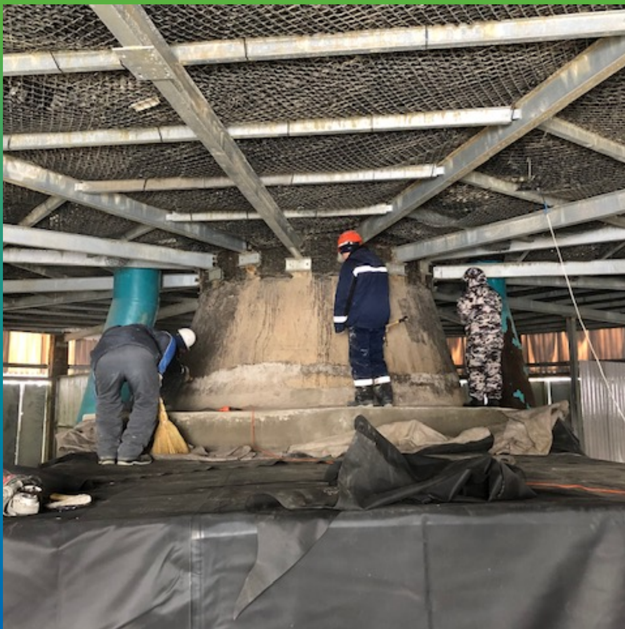
Повторная очистка основания от мусора.