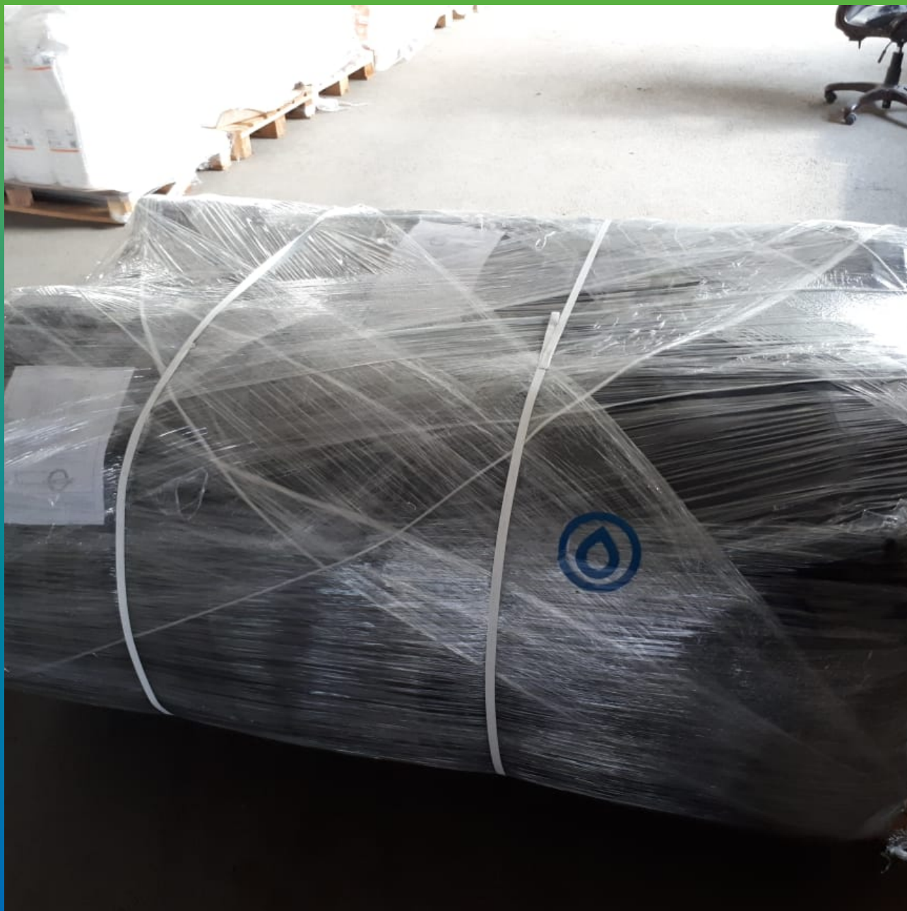
Цельносваренные полотна ЭПДМ на палете