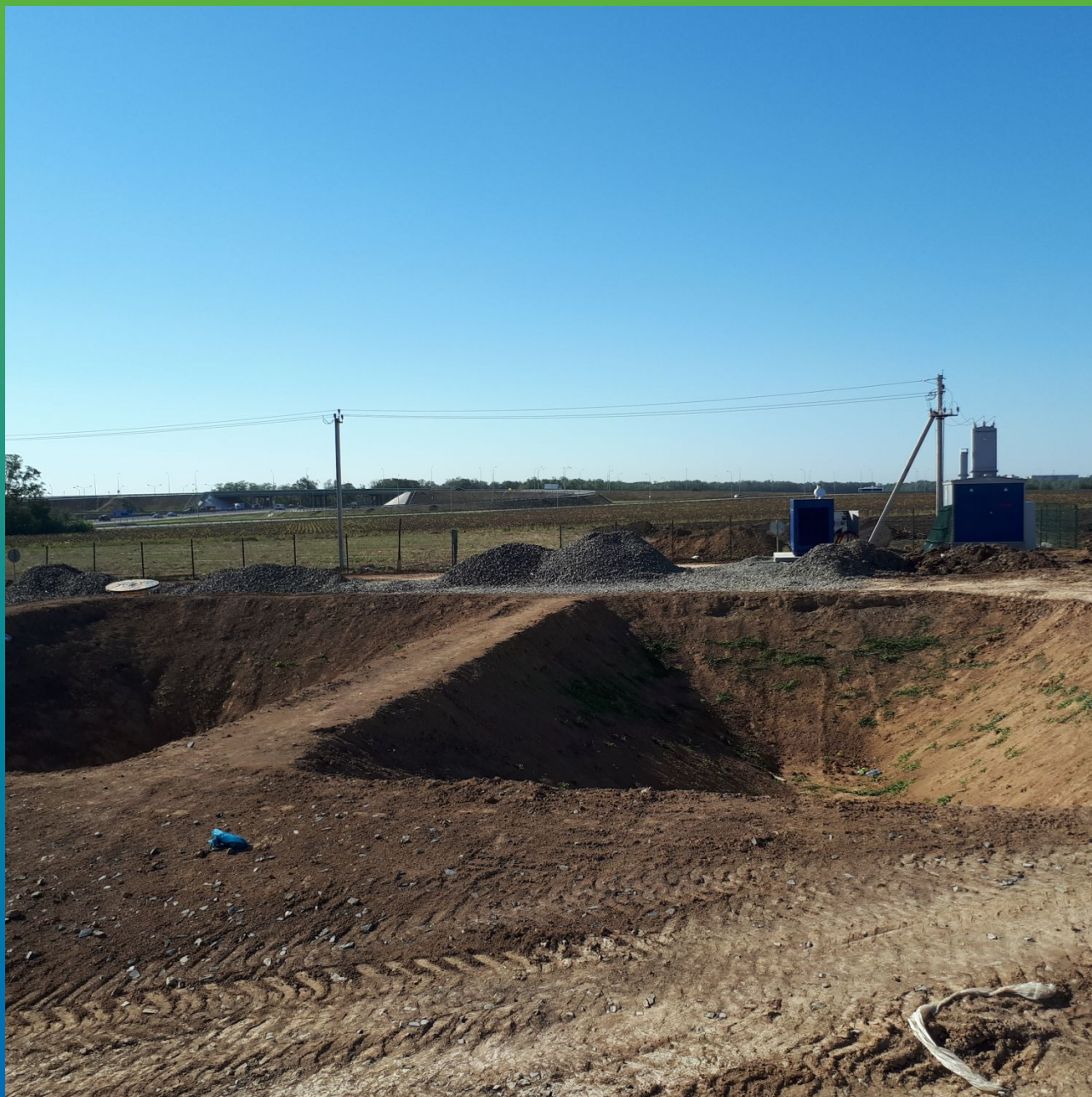
Вид пожарного водоёма до укладки ЭПДМ-мембраны