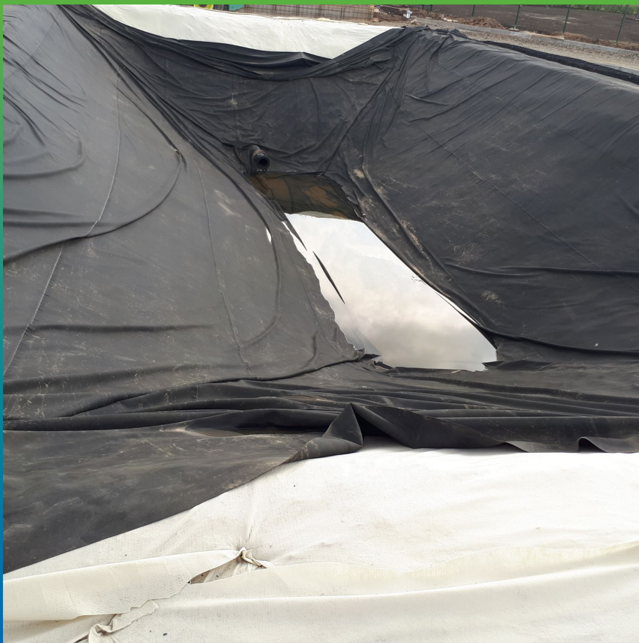
Процесс укладки полотна ЭПДМ по геотекстилю