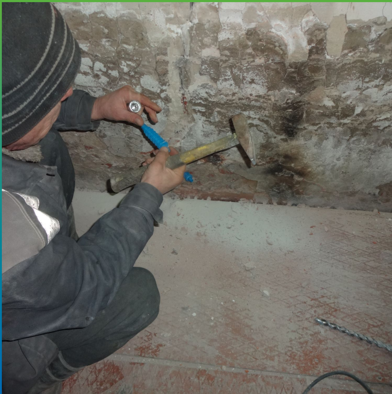
Установка пакеров БМ 2839 в пробуренные шпуры