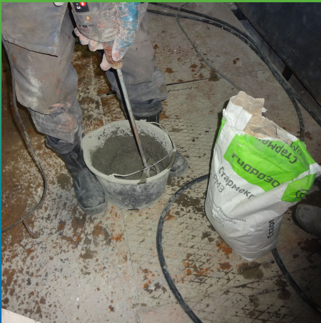
Перемешивание ремонтного состава Стармекс РМЗ до однородной консистенции