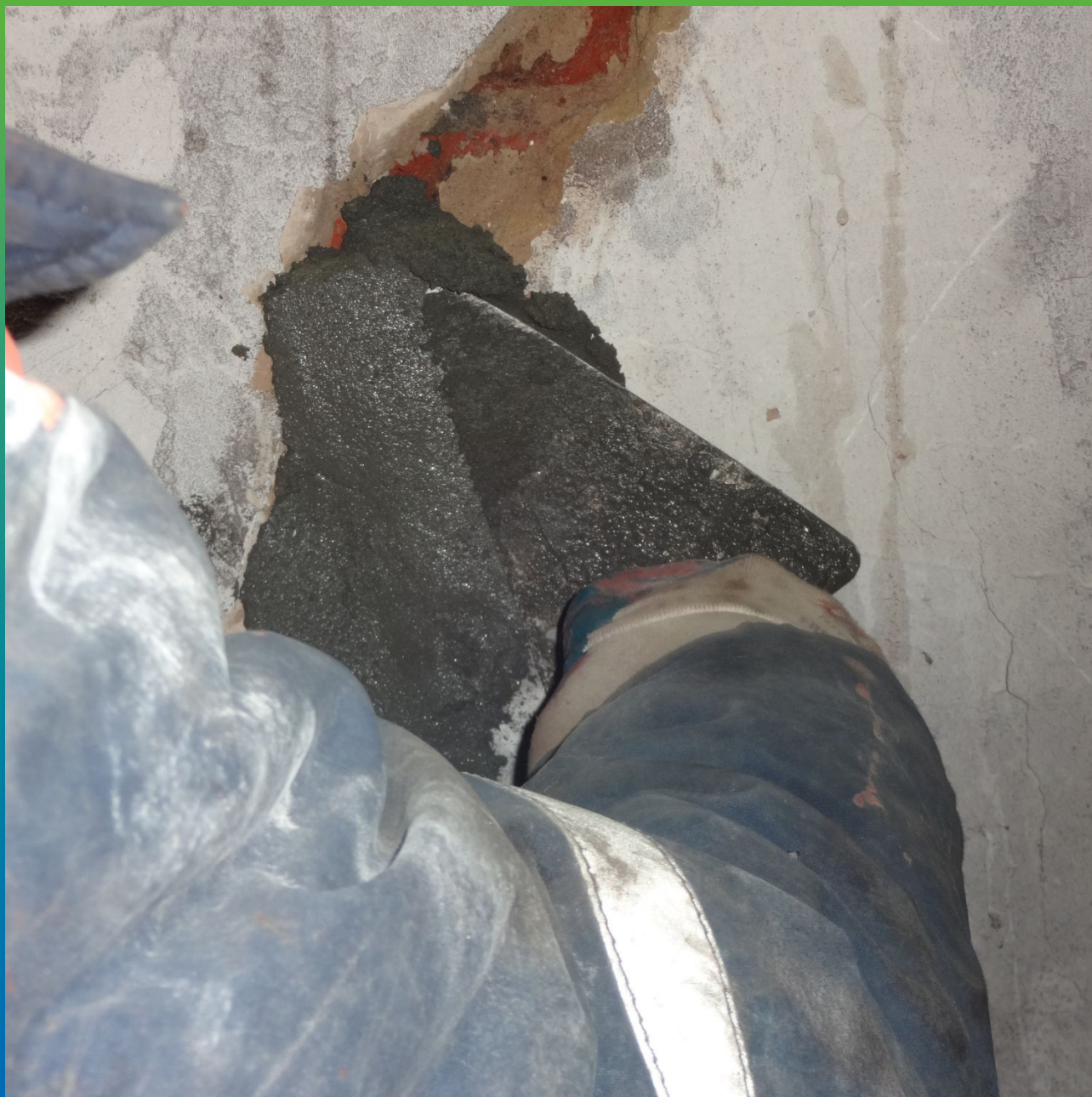
Заполнение трещин Стармекс РМЗ на всю глубину расшивки