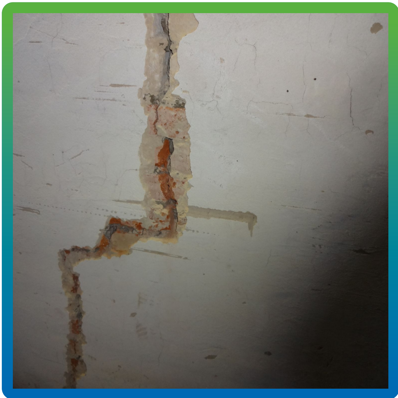
Расшивка трещин перед проведением инъекционных работ