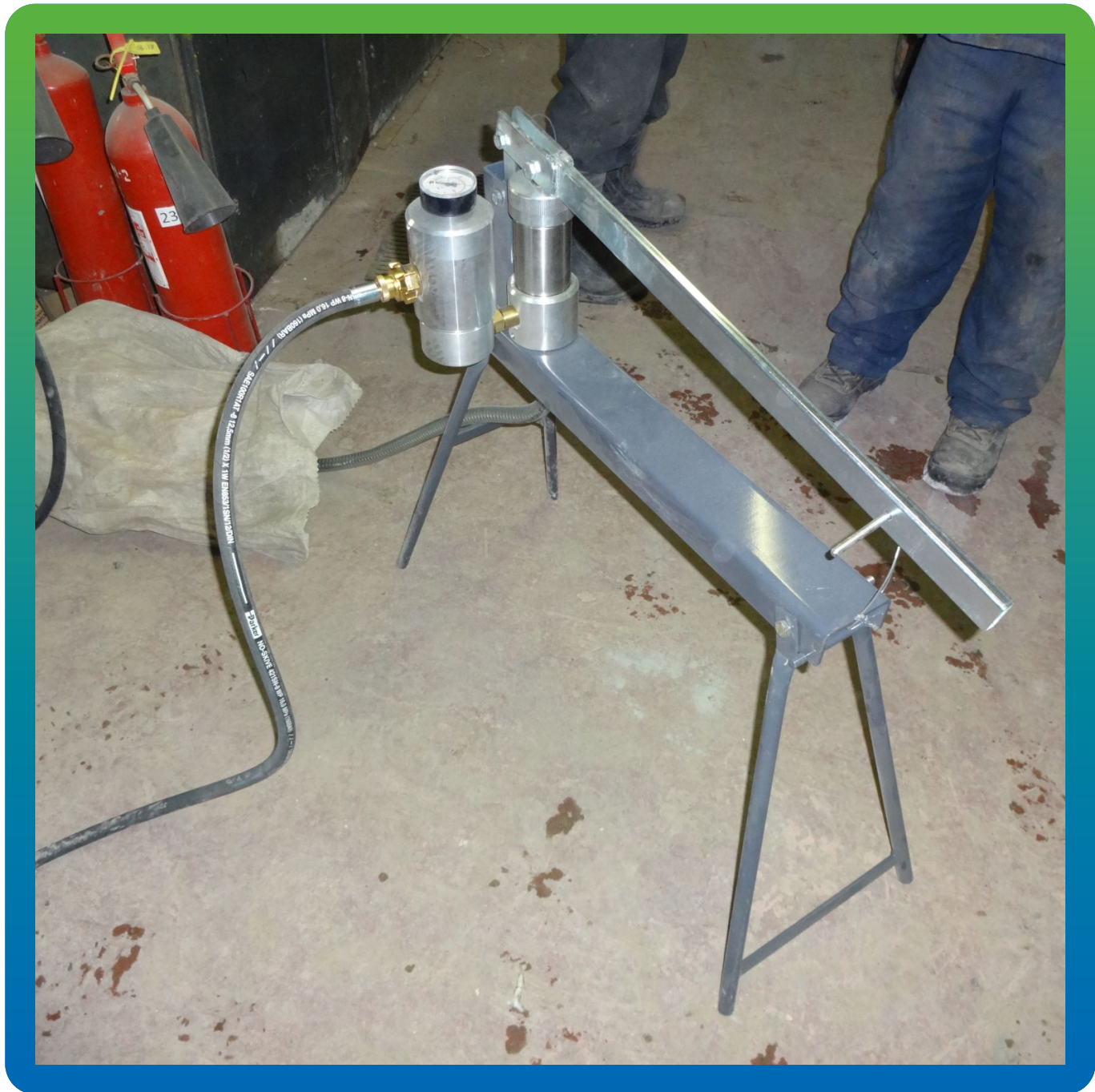
Подготовка насоса БМ 0220 к производству работ по инъектированию