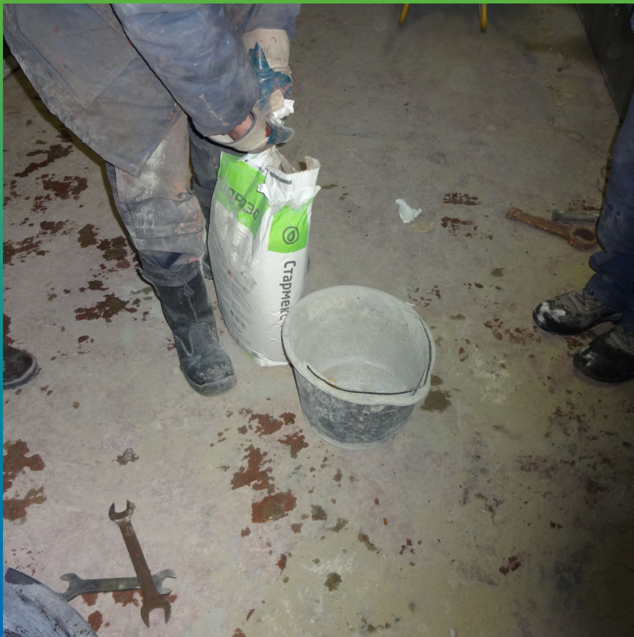
Затворение с водой ремонтного состава Стармекс РМЗ