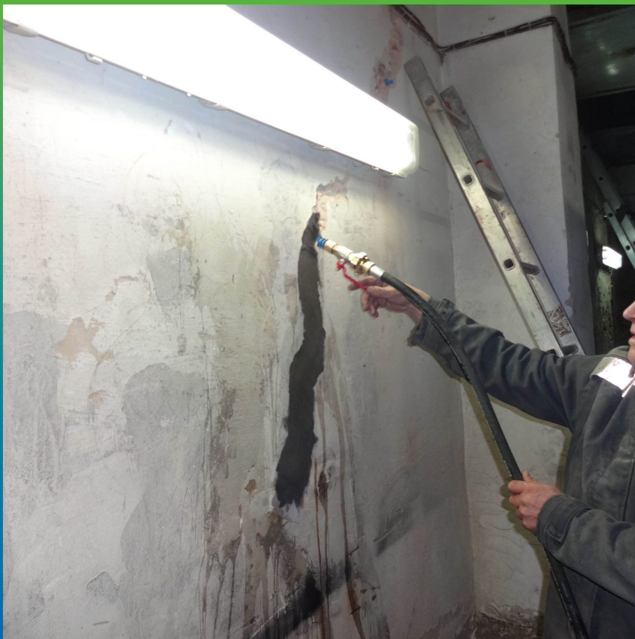
Заполнение трещин кирпичной кладки инъекционным минеральным составом Маноцем Грут