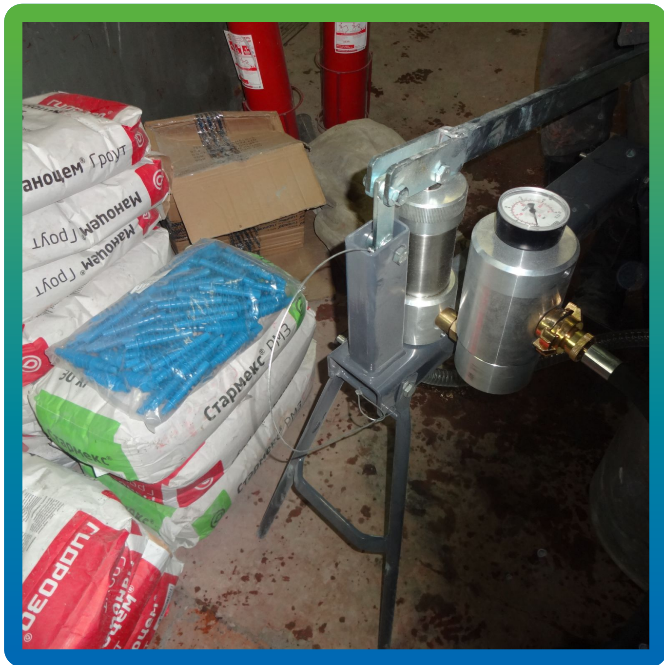
Материалы "Гидрозо" на объекте