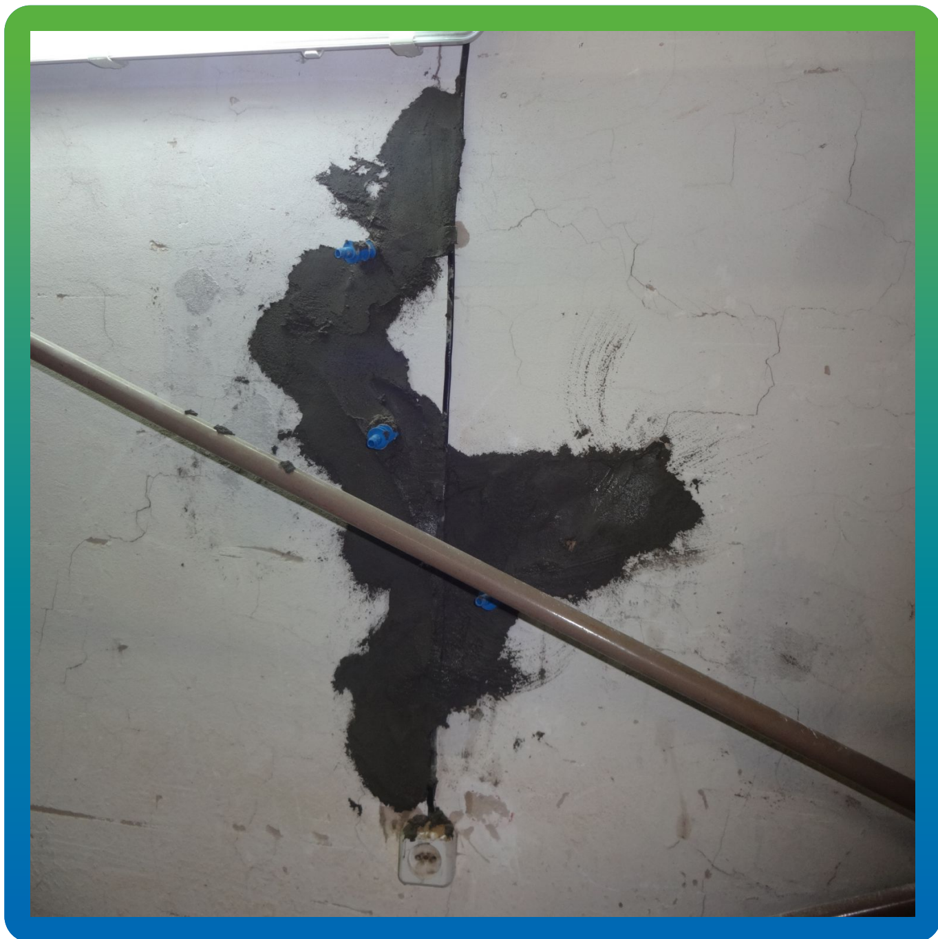
Отремонтированная трещина с установленным пакерами БМ 2839