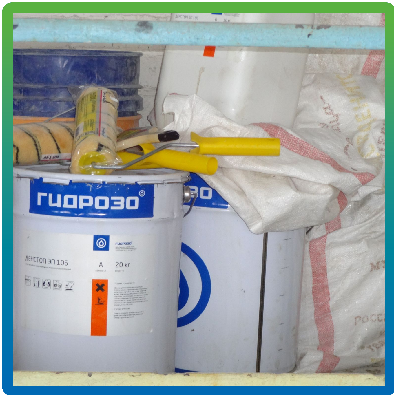
Грунтовочный состав ДенСтон ЭП 106