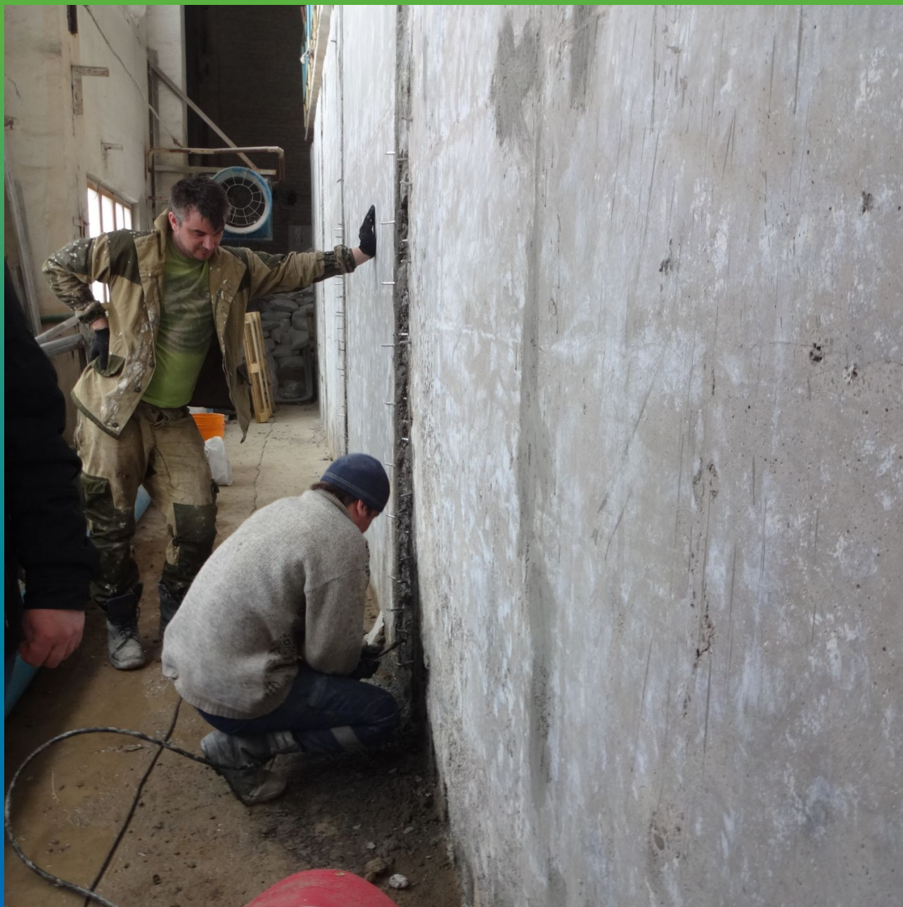
Остановка активных протечек 1К составом Манопур У Флекс