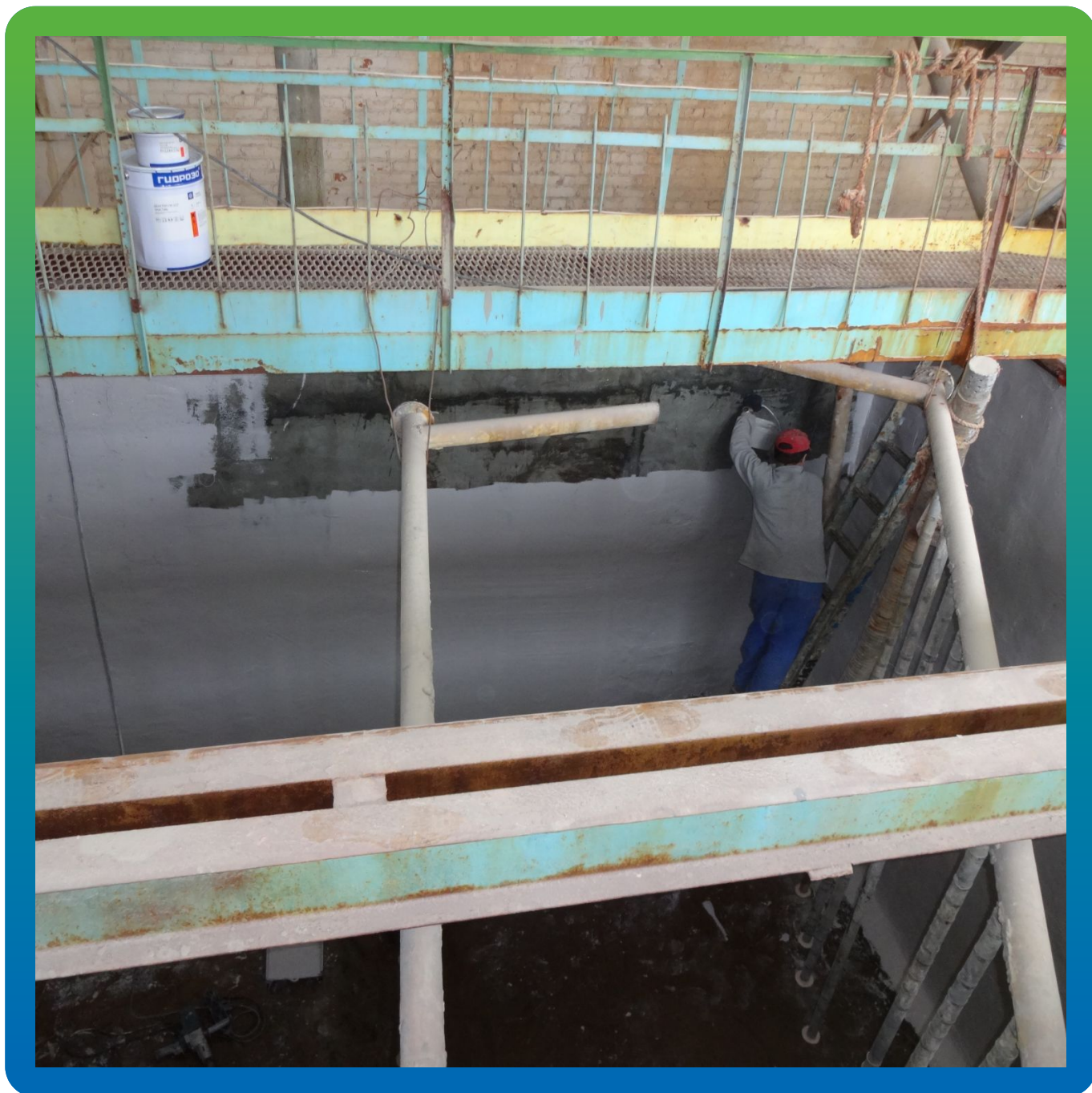
Нанесение на стены ДенТоп ПУ 227 Эластик