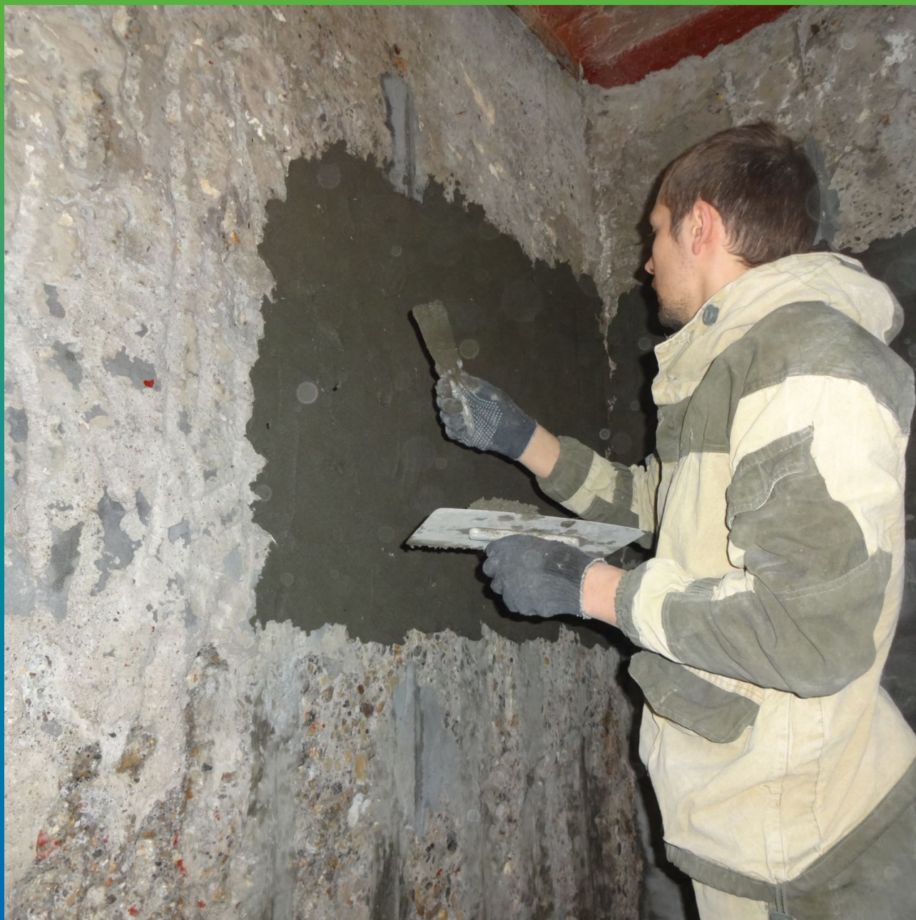
Выравнивание поверхности бака Стармекс РМЗ