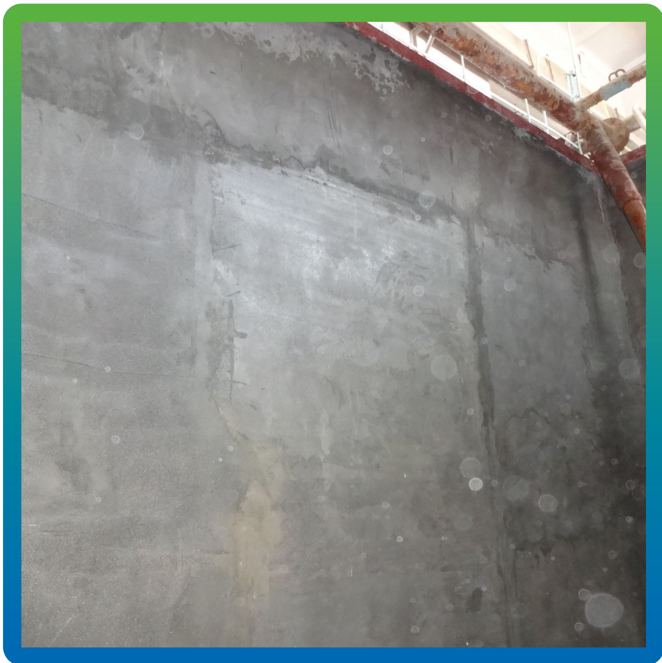
Поверхность бака перед нанесением грунтовки ДенсТоп ЭП 106