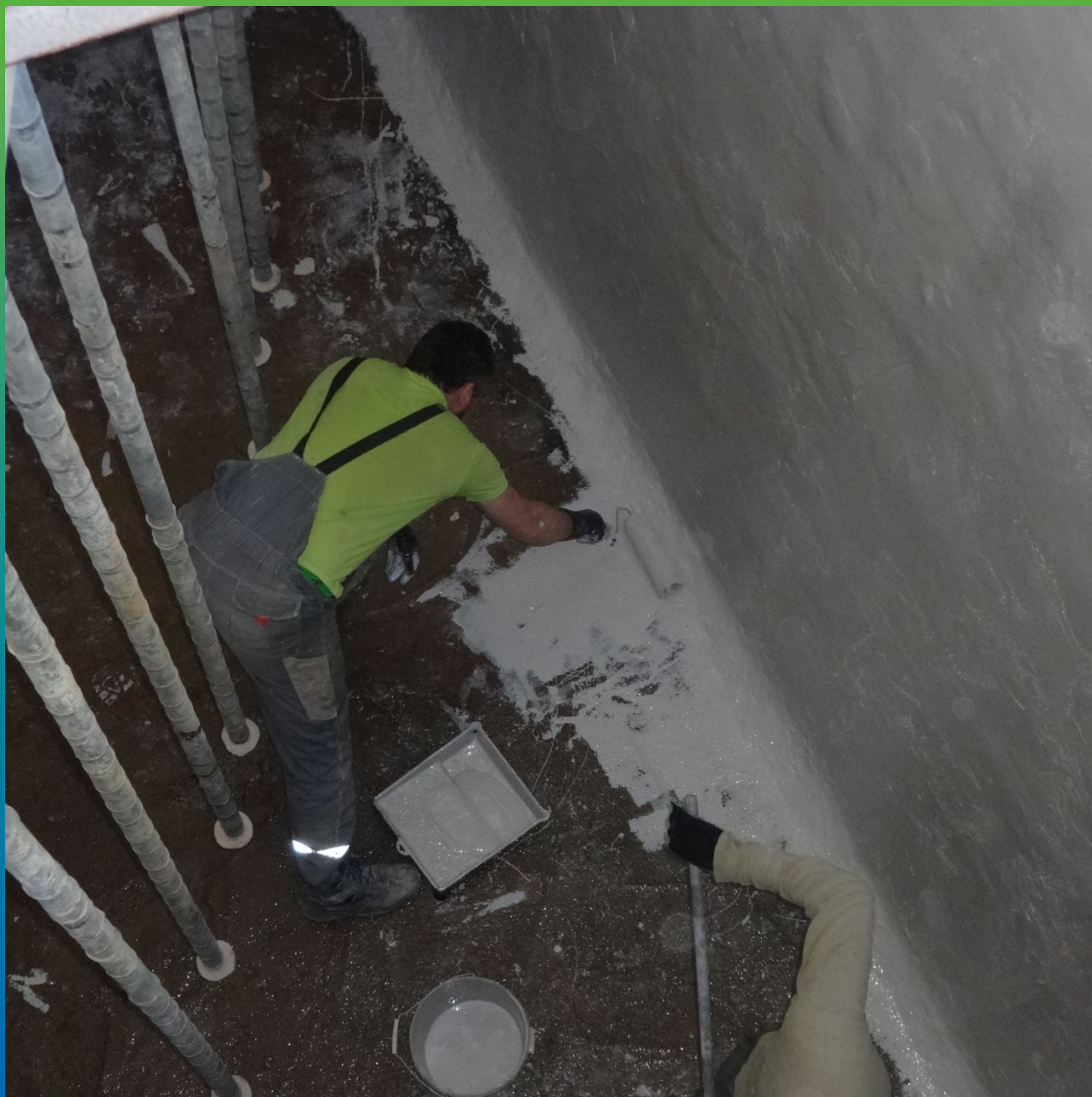
Нанесение на днище ДенсТоп ПУ 227 Эластик