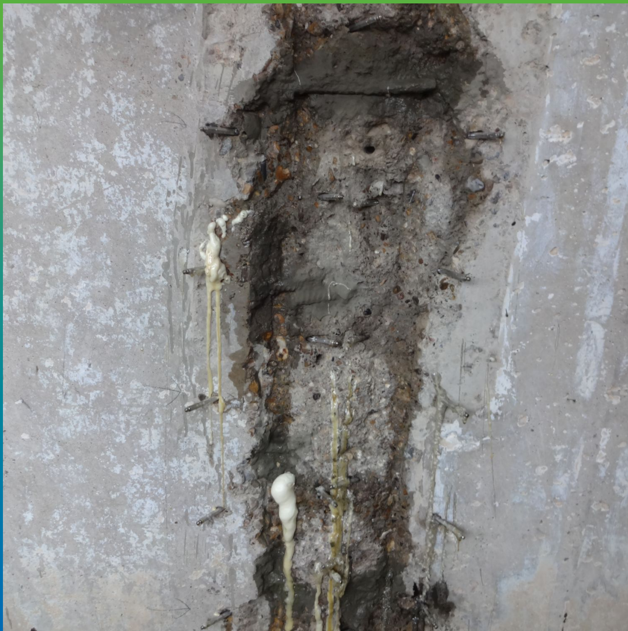
Участок инъектирования после выполнения работ