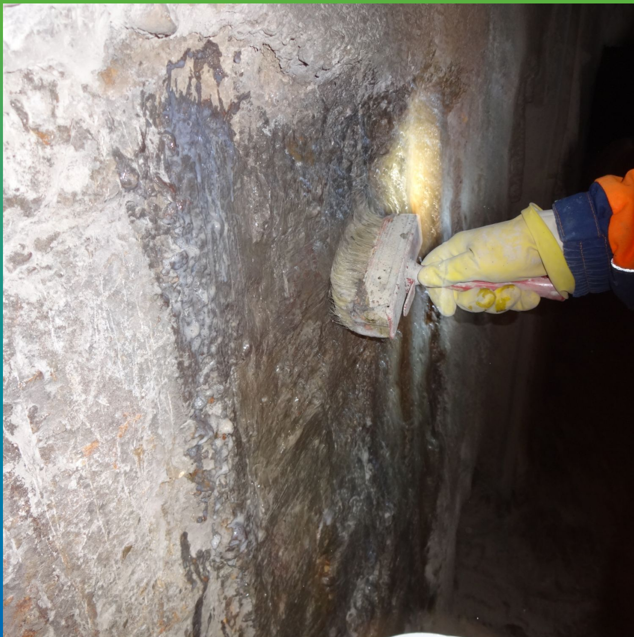
Грунтование засоленного основания составом Маногард ПСМ