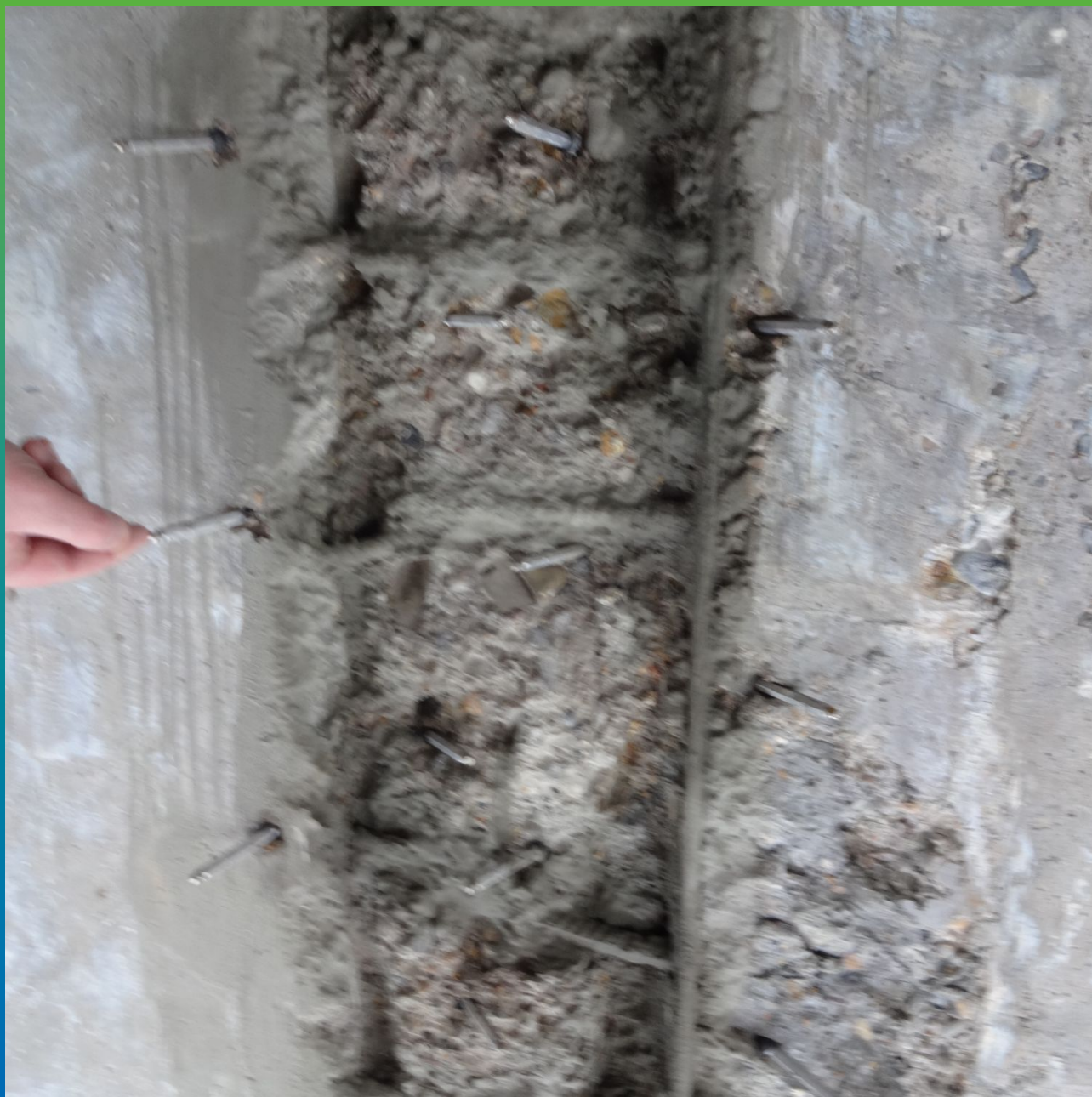
Установка пакеров по внешней стороне бака