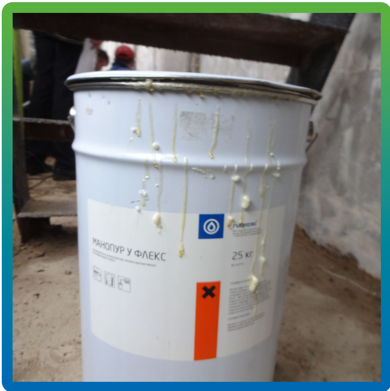
1К Гидроактивный состав Манопур У Флекс перед началом работ по устранению протечек