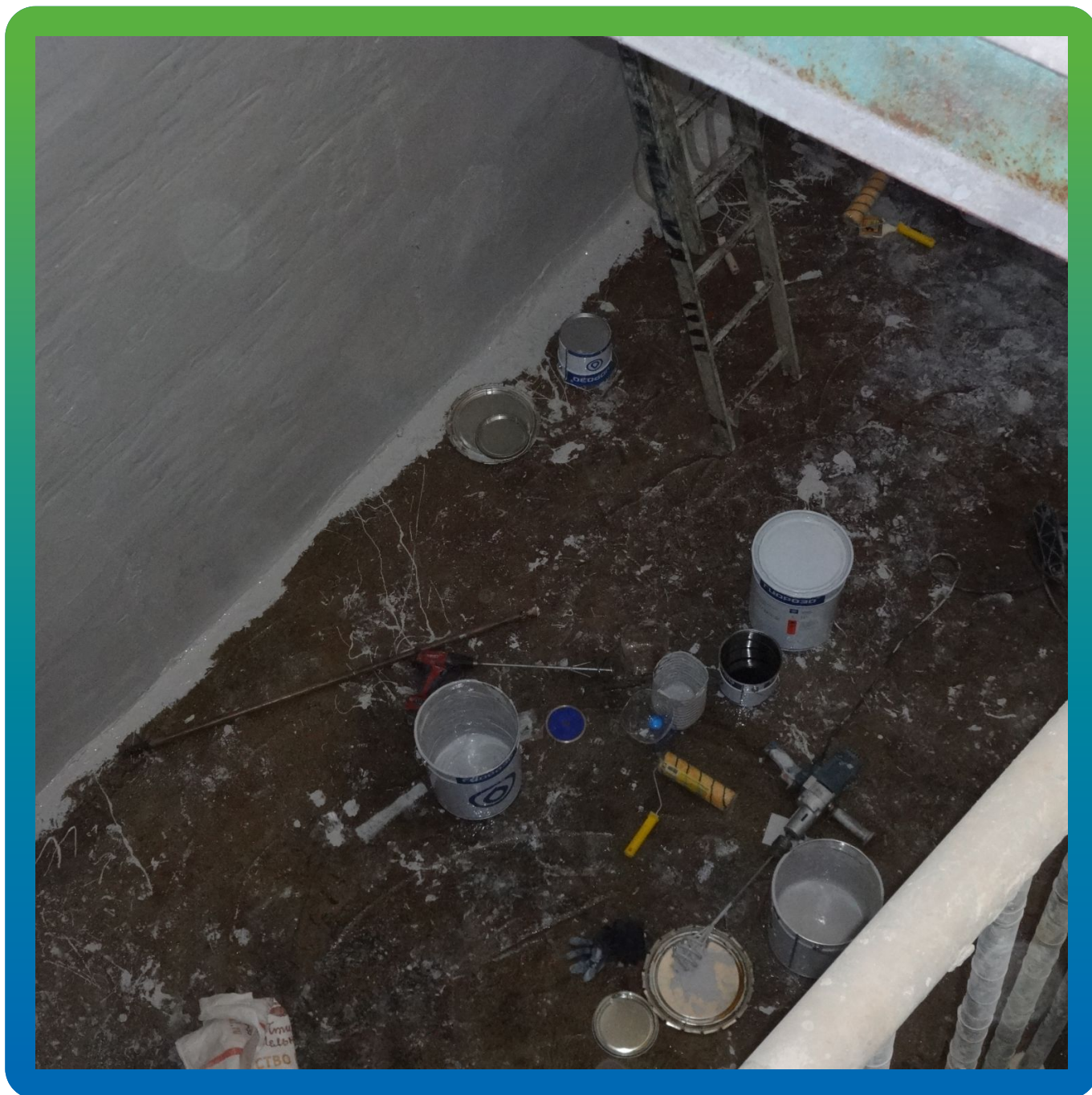
Подготовка к нанесению ДенсТоп ПУ 227 Эластик на днище