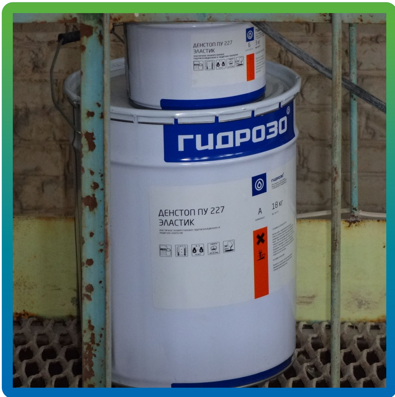
Защитное эластичное покрытие ДенТоп ПУ 227 Эластик