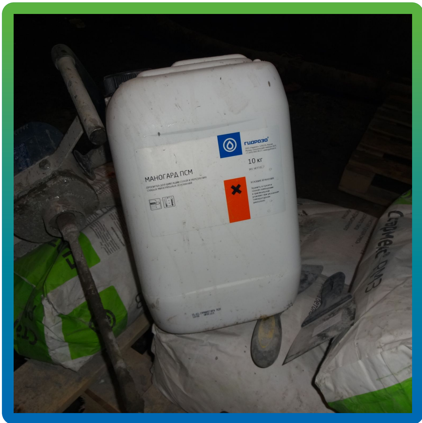
Нанесение состава Стармекс ПСМ на внутреннюю поверхность бака