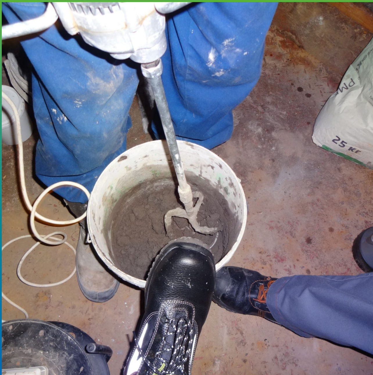
Затворение с водой ремонтного состава Стармекс РМЗ