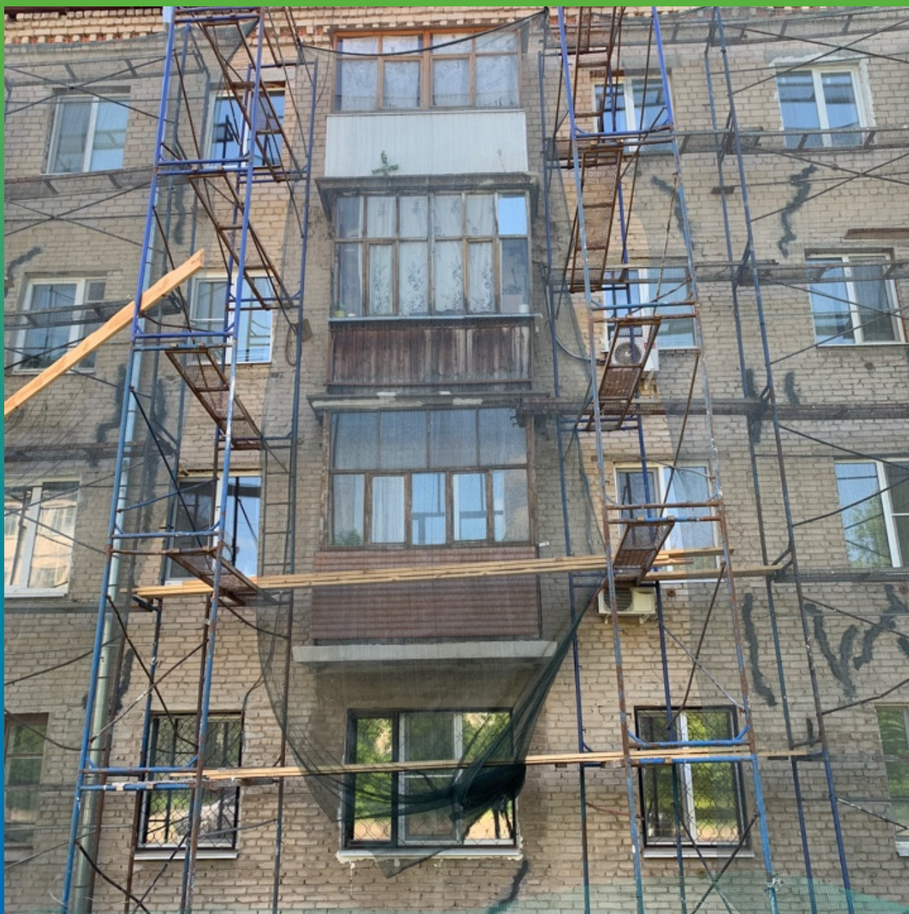
Трещины, подготовленные к инъектированию