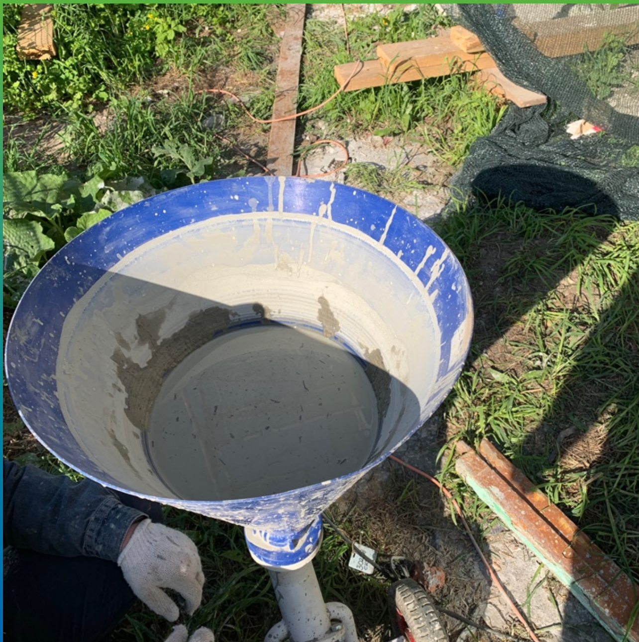
Подготовленный раствор Маноцем Гроут во время прокачки