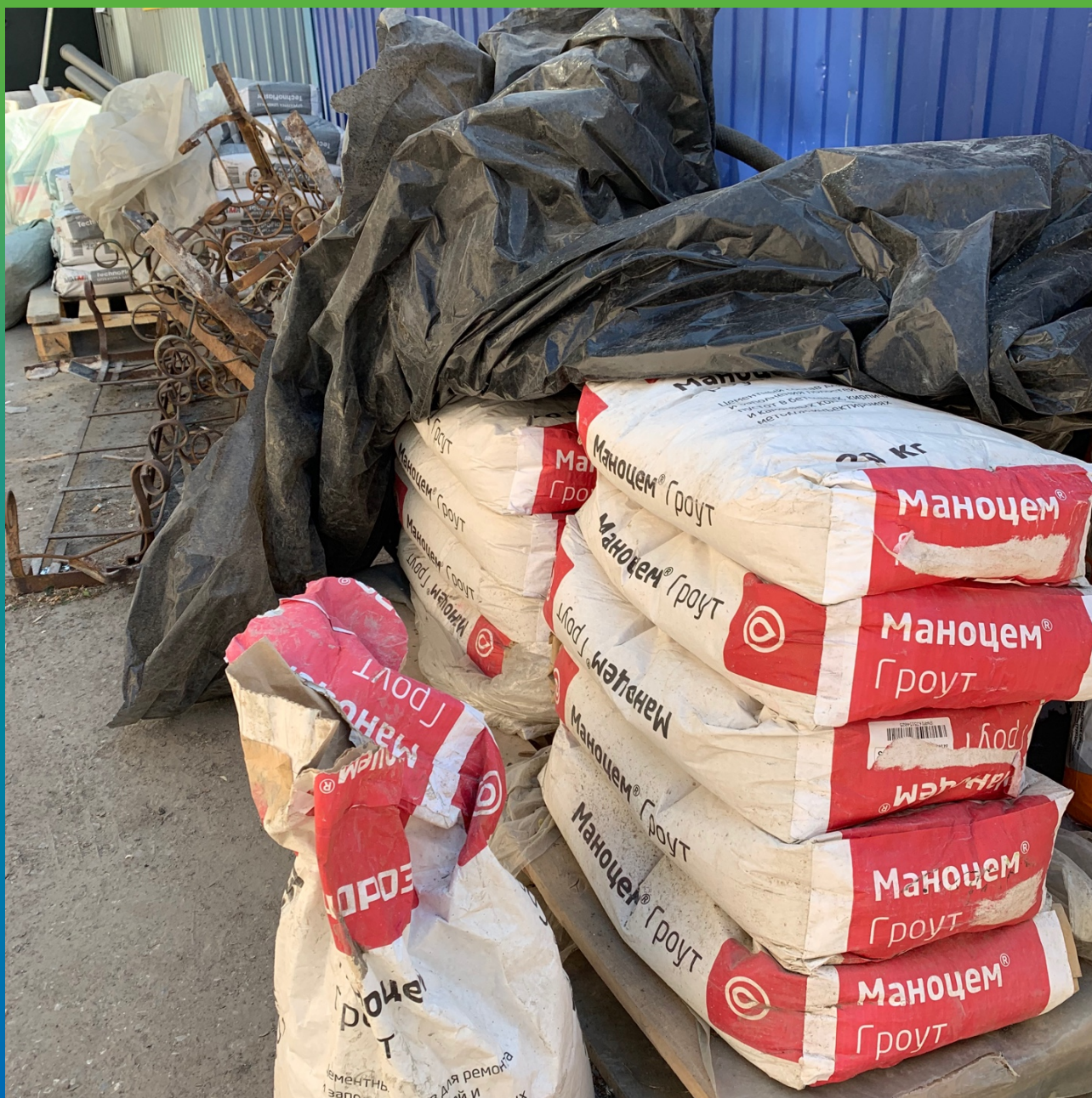
Инъекционный материал Маноцем Гроут на объекте