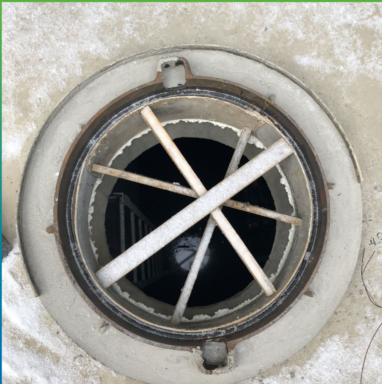
Вид схватившегося состава.