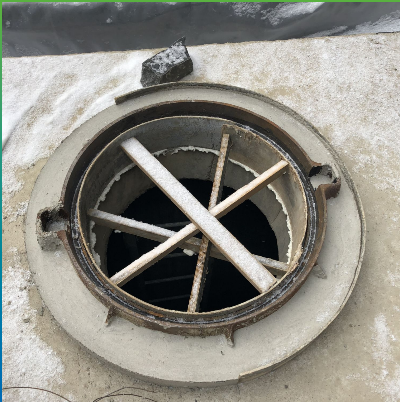
Вид схватившегося состава через пару часов после подливки. Демонтаж опалубки