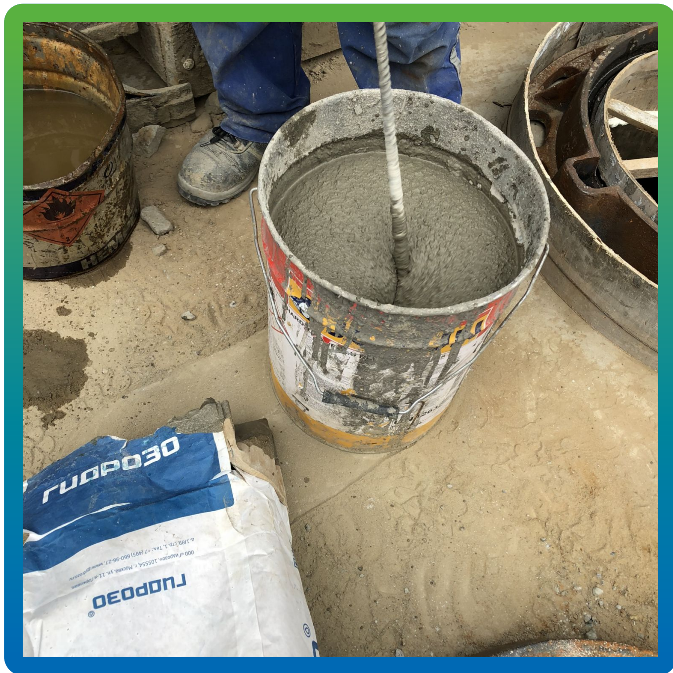
Вид окончательного смешанного и однородного материала