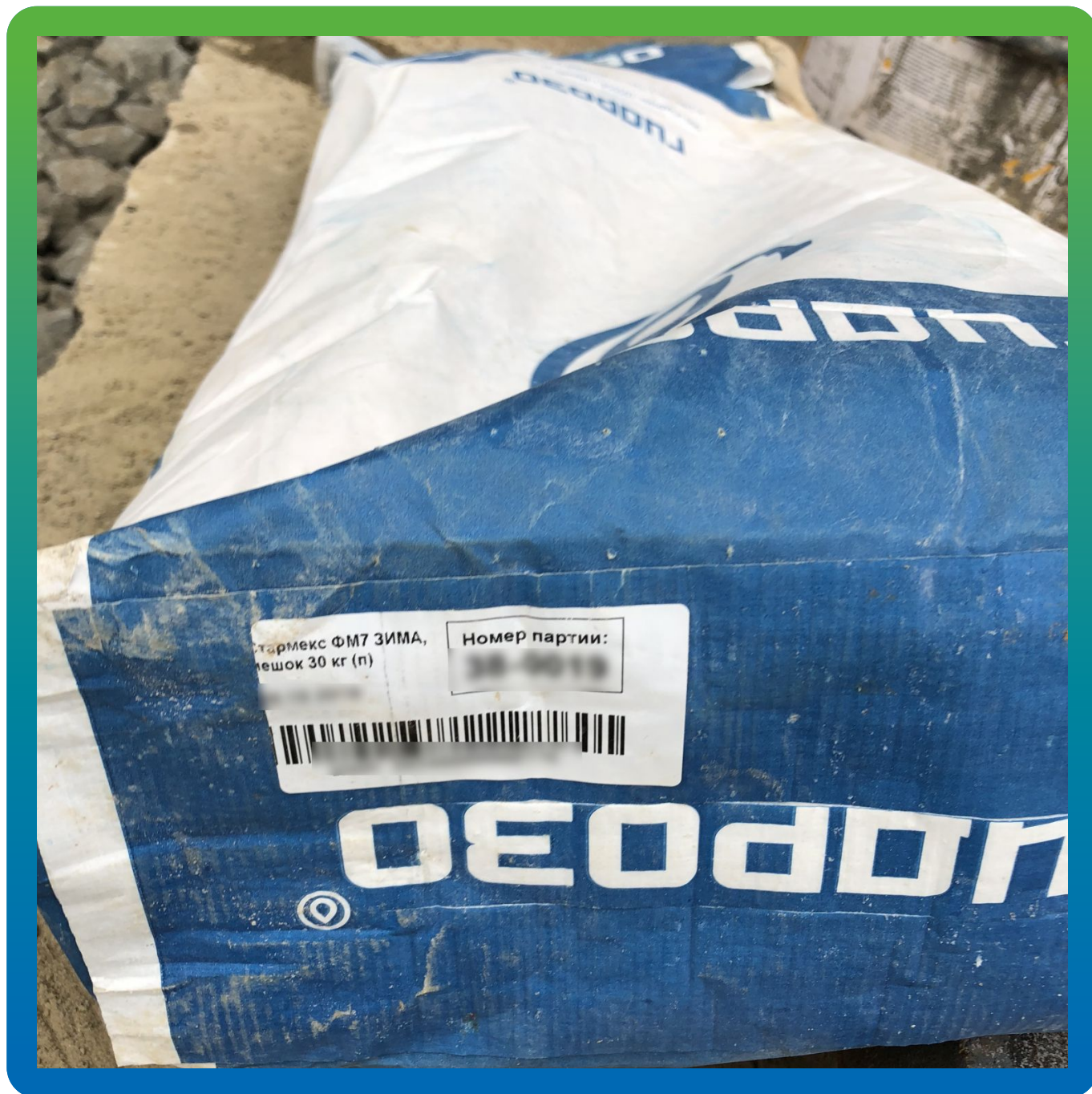
Материала на участке "Стармекс ФМ7 Зима"