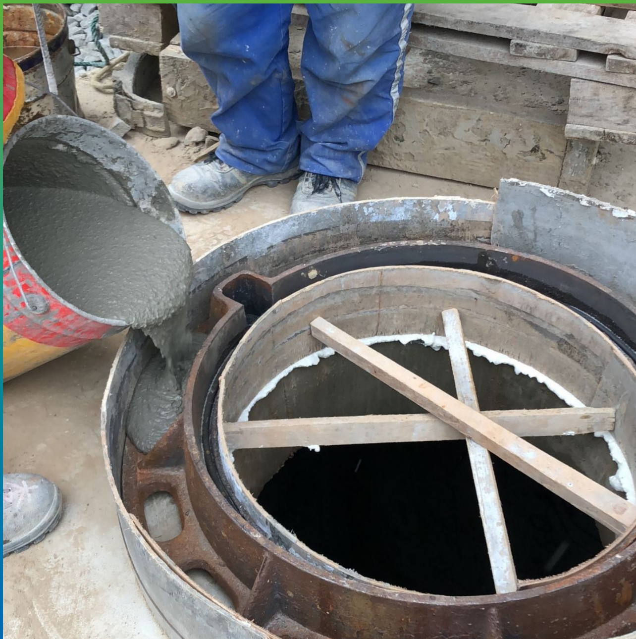
Процесс подливки готового материала в опалубку вокруг люка