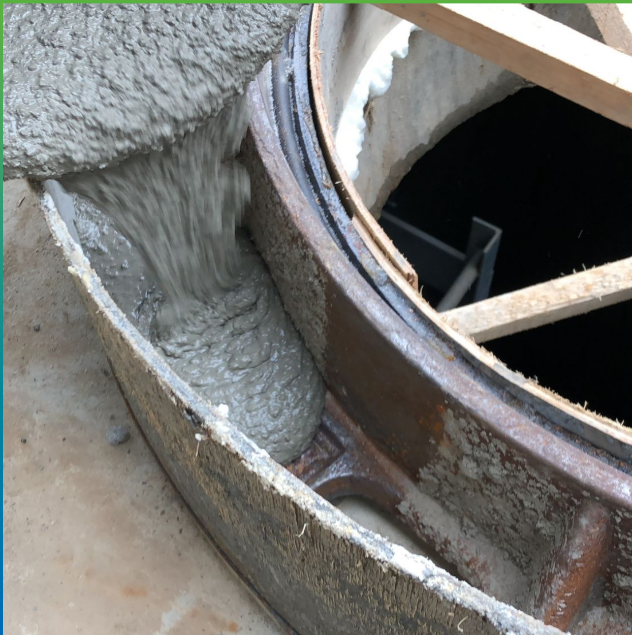
Процесс заливки материала в опалубку