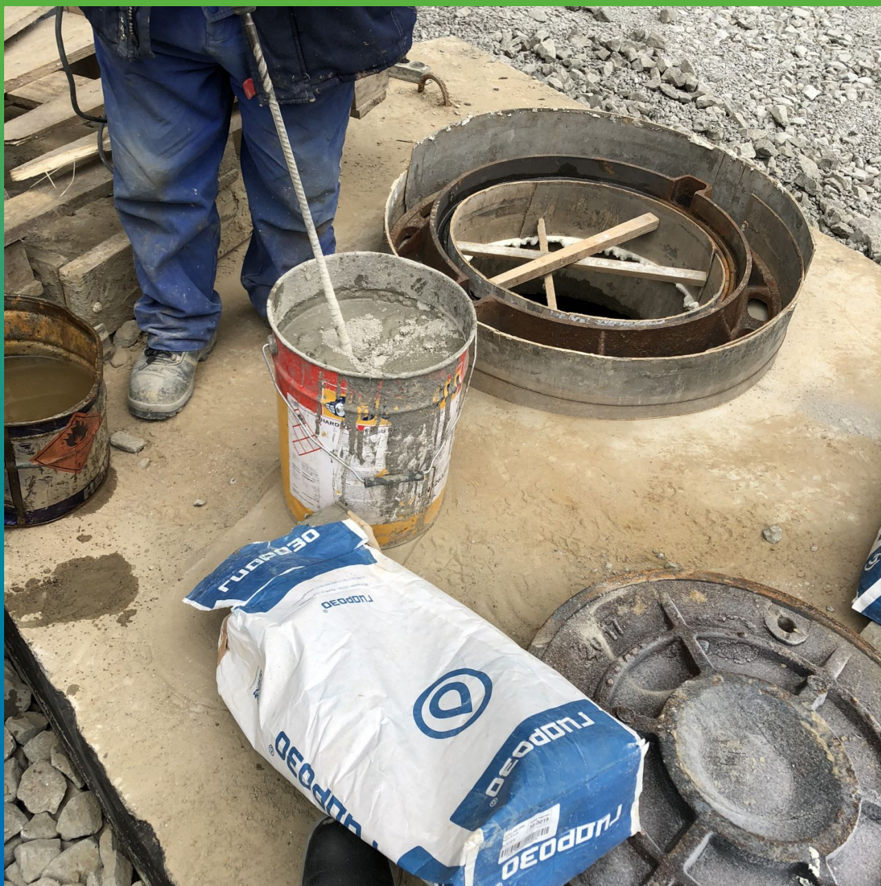
Процесс смешивания материала с горячей водой