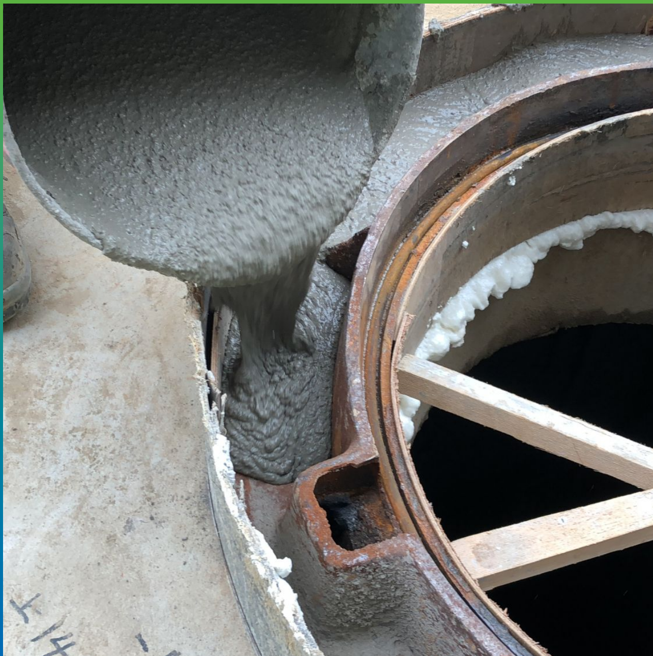
Процесс заливки материала в опалубку