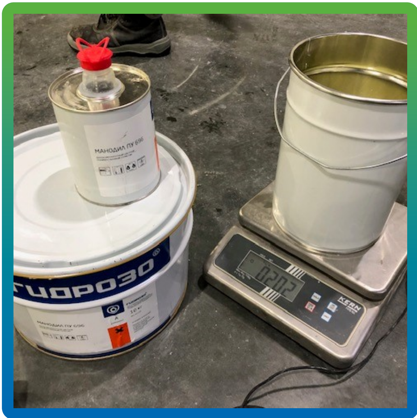
Материалы на участке производства работ "Манодил ПУ 696"