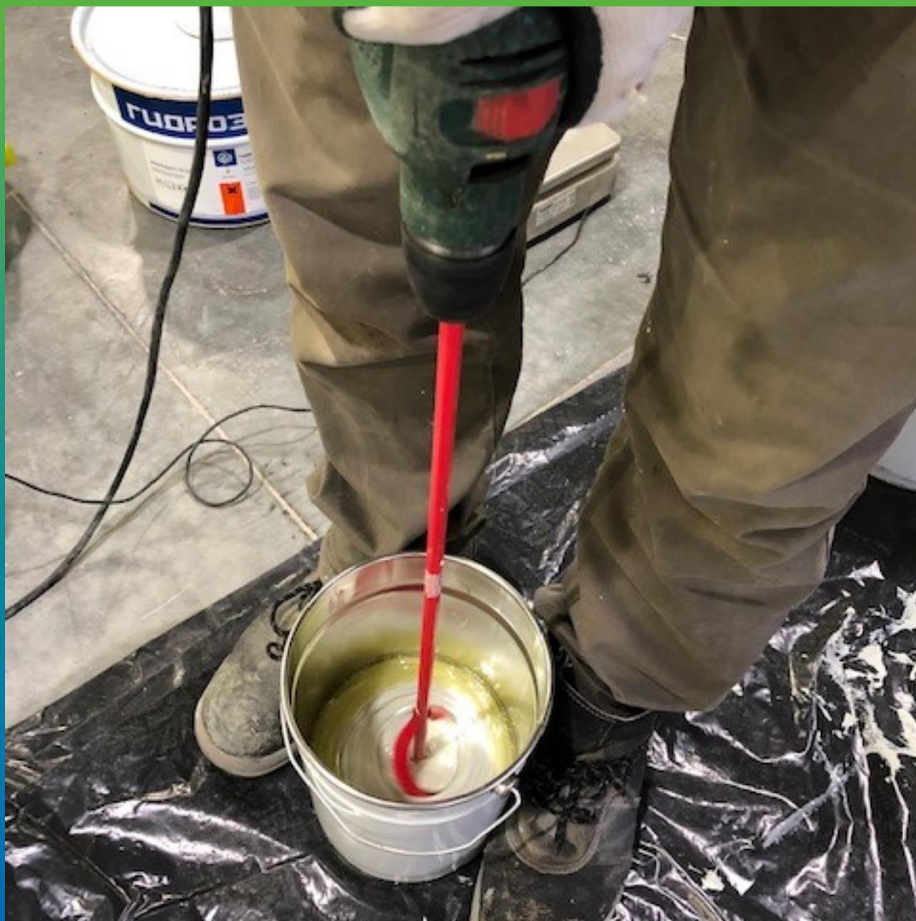
Процесс перемешивания компонентов в однородную массу