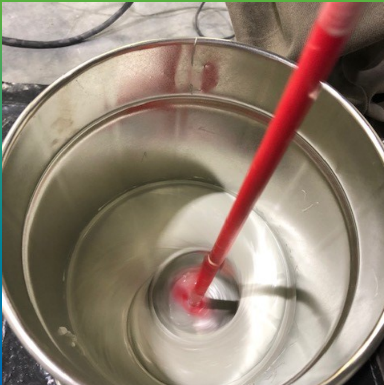
Процесс смешивания компонентов. Частный вид