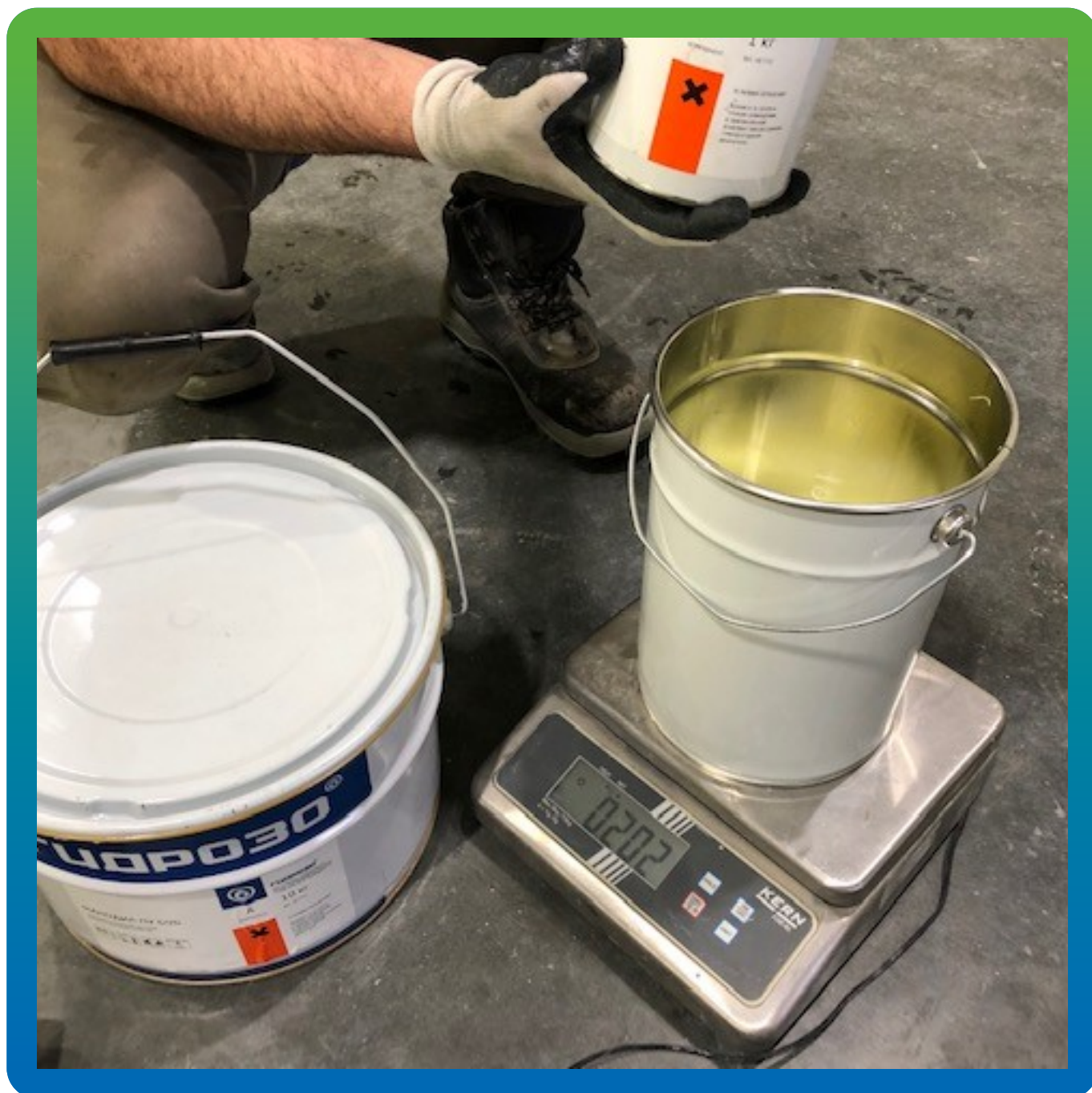
Смешивание в отдельной таре компонентов А+Б