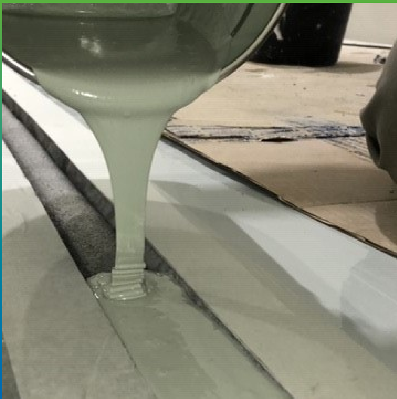
Заливка герметика в шов