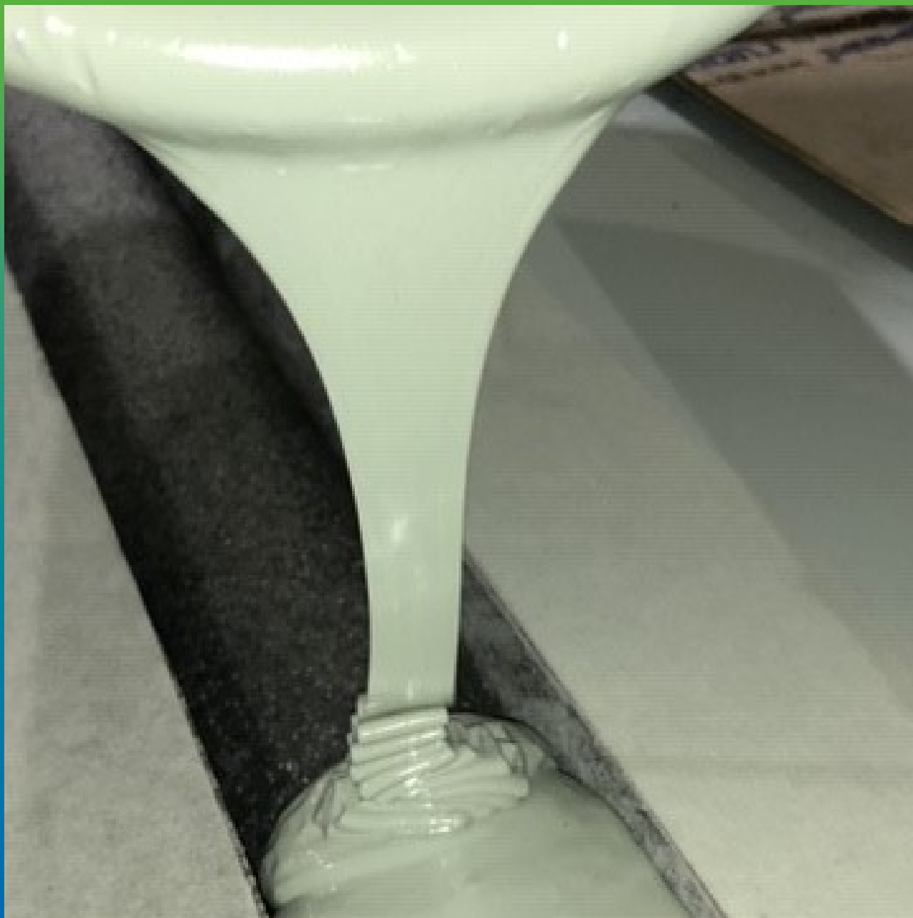
Заливка герметика в шов. Другой вид