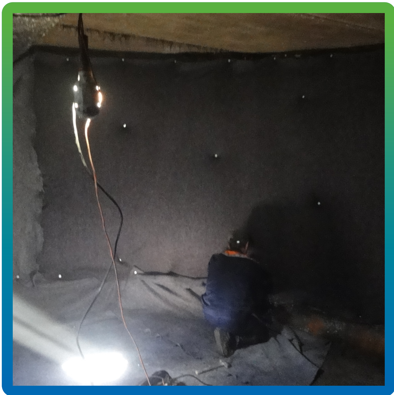
Монтаж защитного слоя и гетекстиля