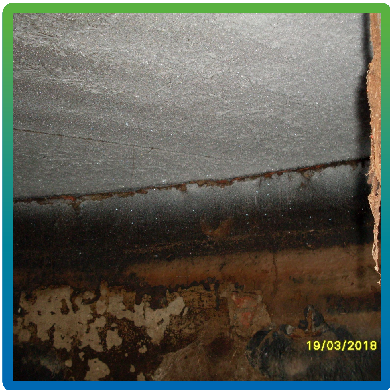
Первоначальный вид поверхности