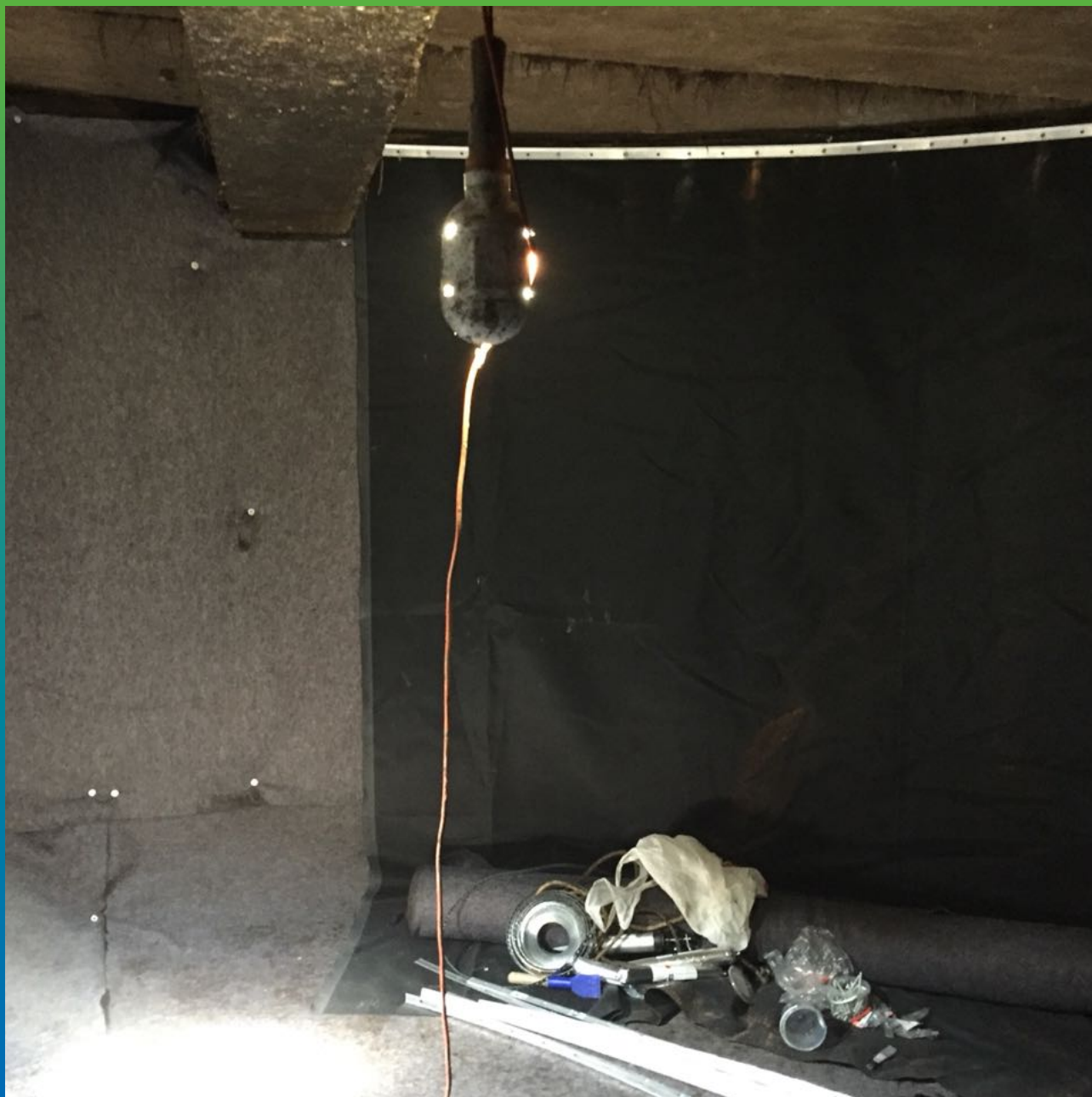
Монтаж ЭПДМ мембраны Прелести СТ 1.2мм