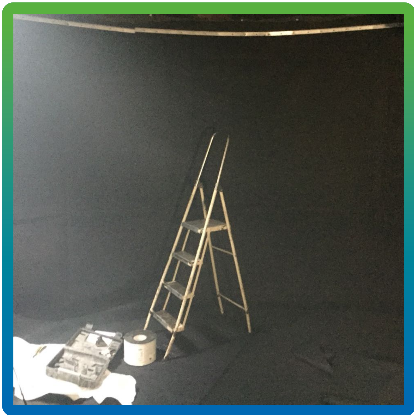
Финальный вид смонтированной ЭПДМ мембраны