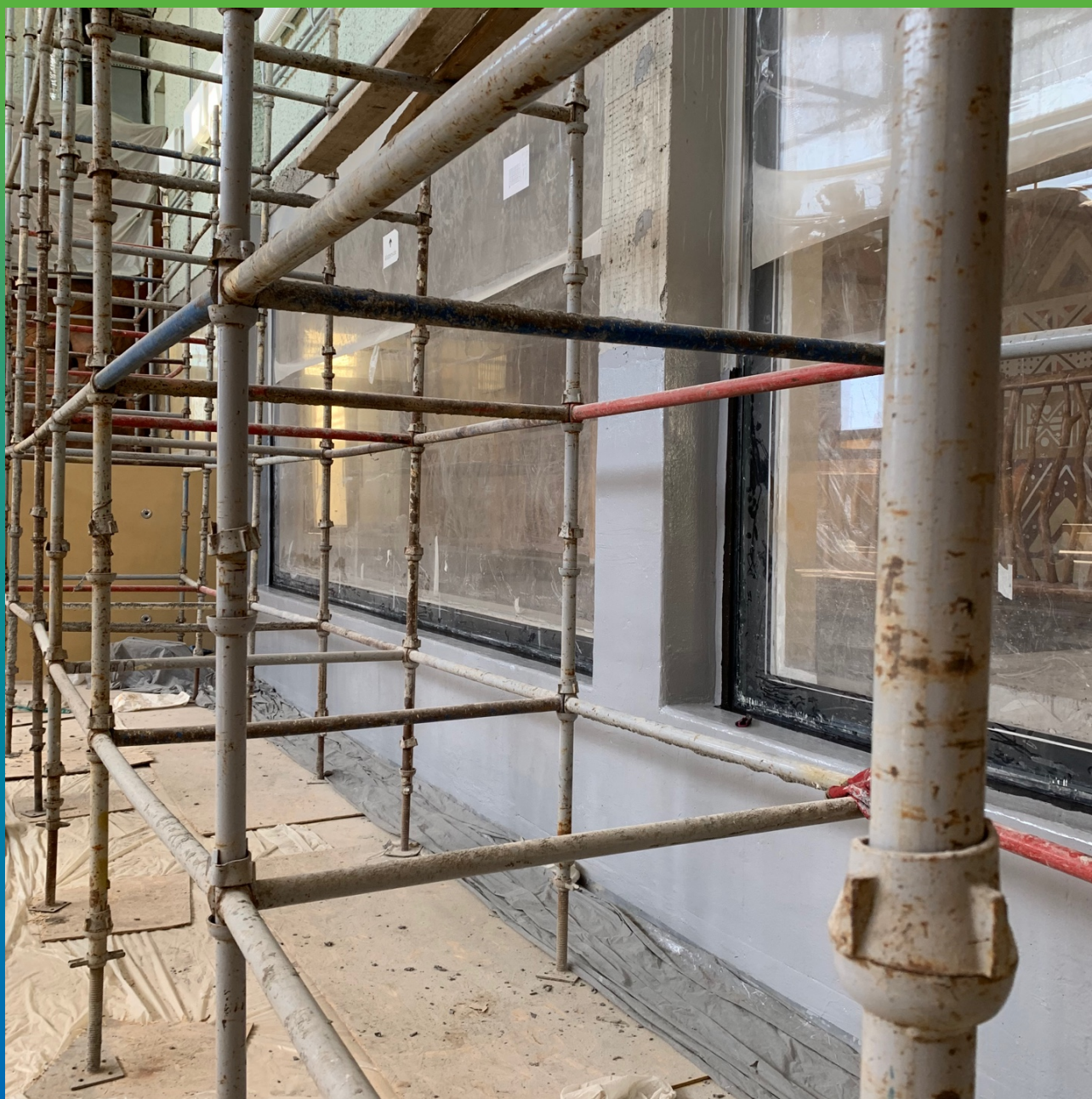
Нанесенное защитное покрытие ДенТоп ЭП 201