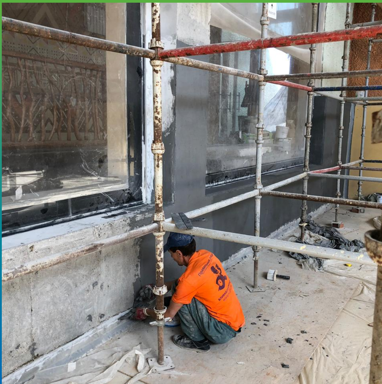
Нанесение Манопокс 331 на поверхность