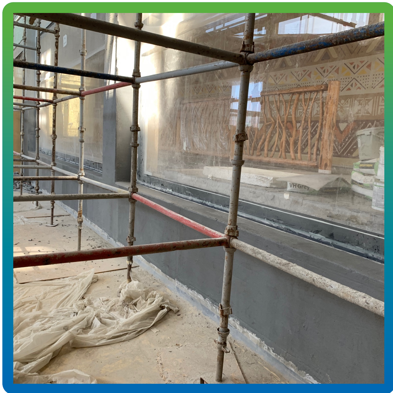
Поверхность, оштукатуренная составом Манопокс 331