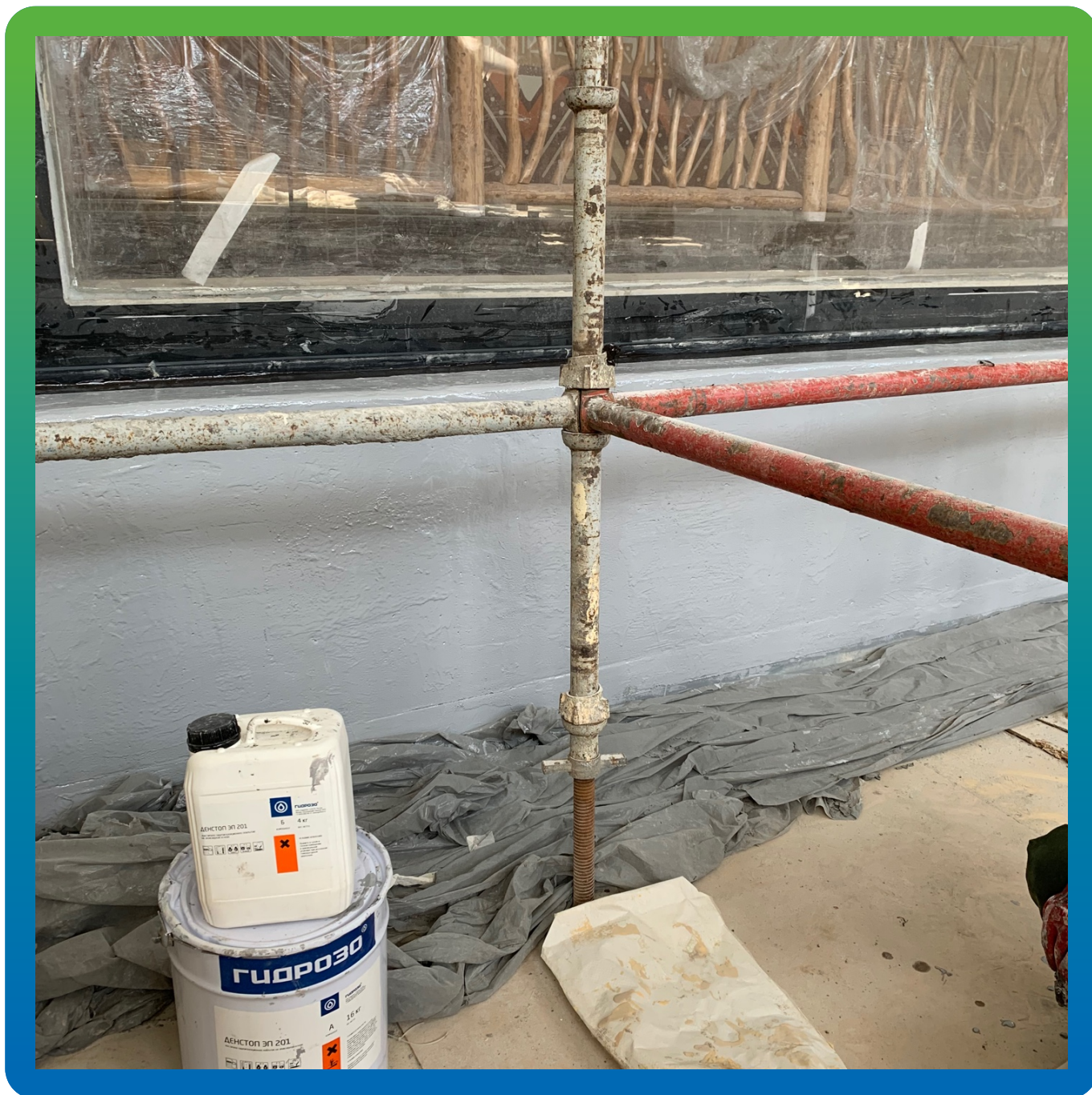
Денстоп ЭП 201, нанесенный на оштукатуренную поверхность