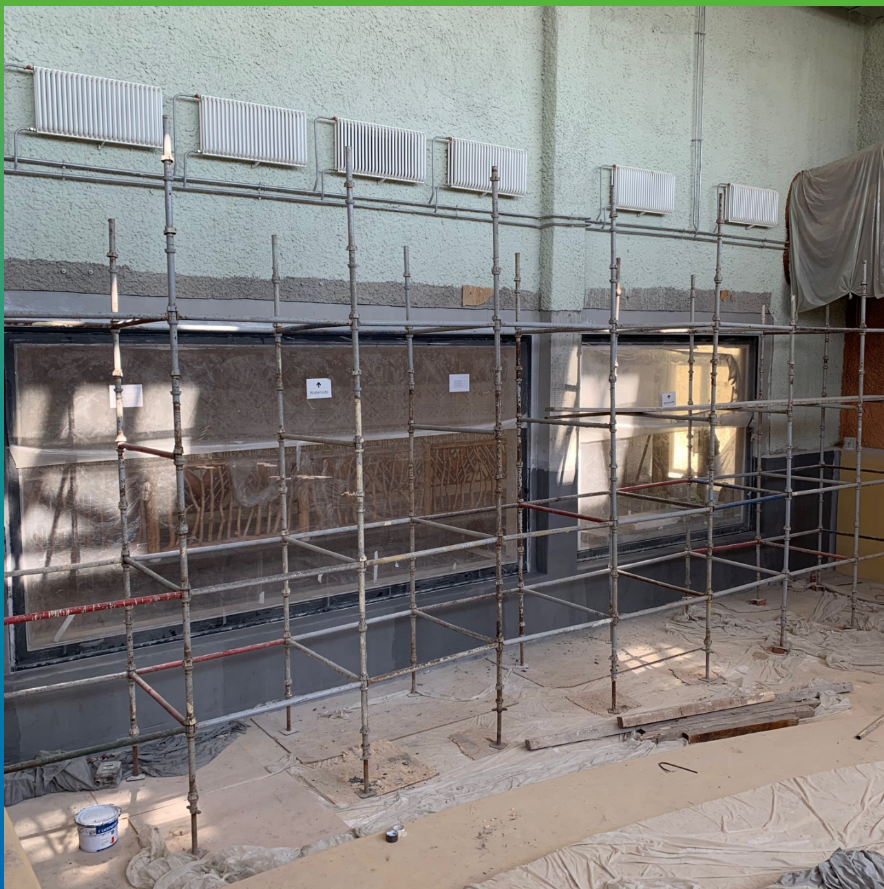
Поверхность, оштукатуренная составом Манопкс 331