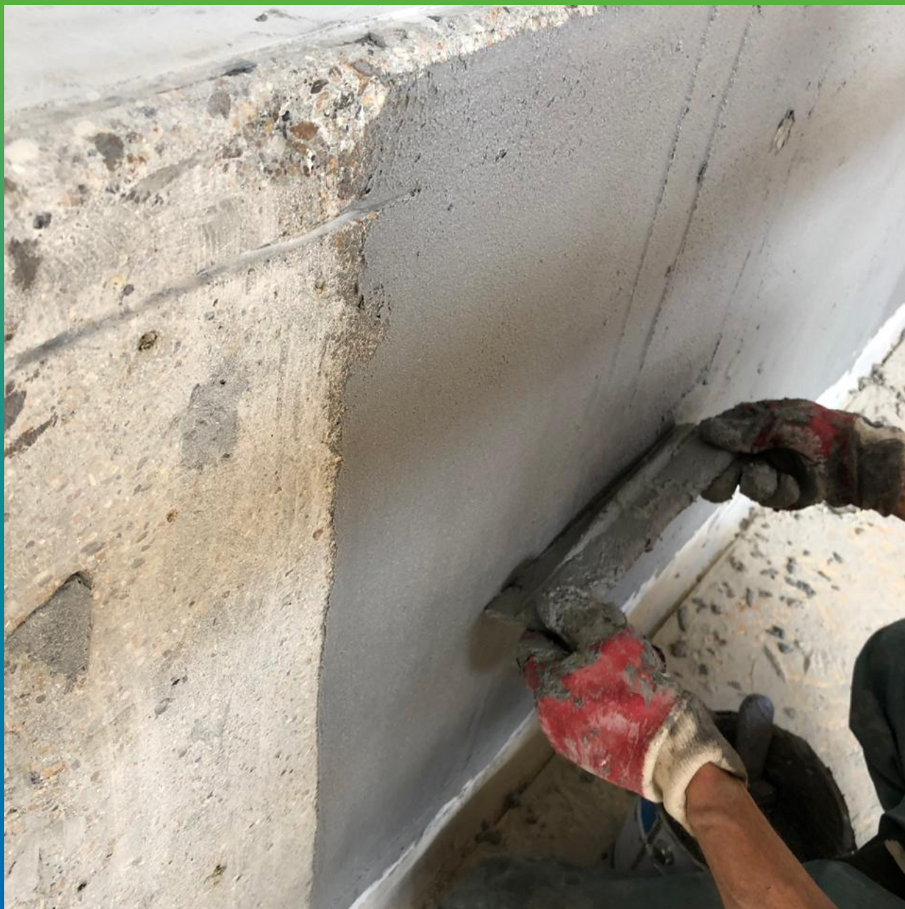
Оштукатуривание поверхности составом Манопокс 331