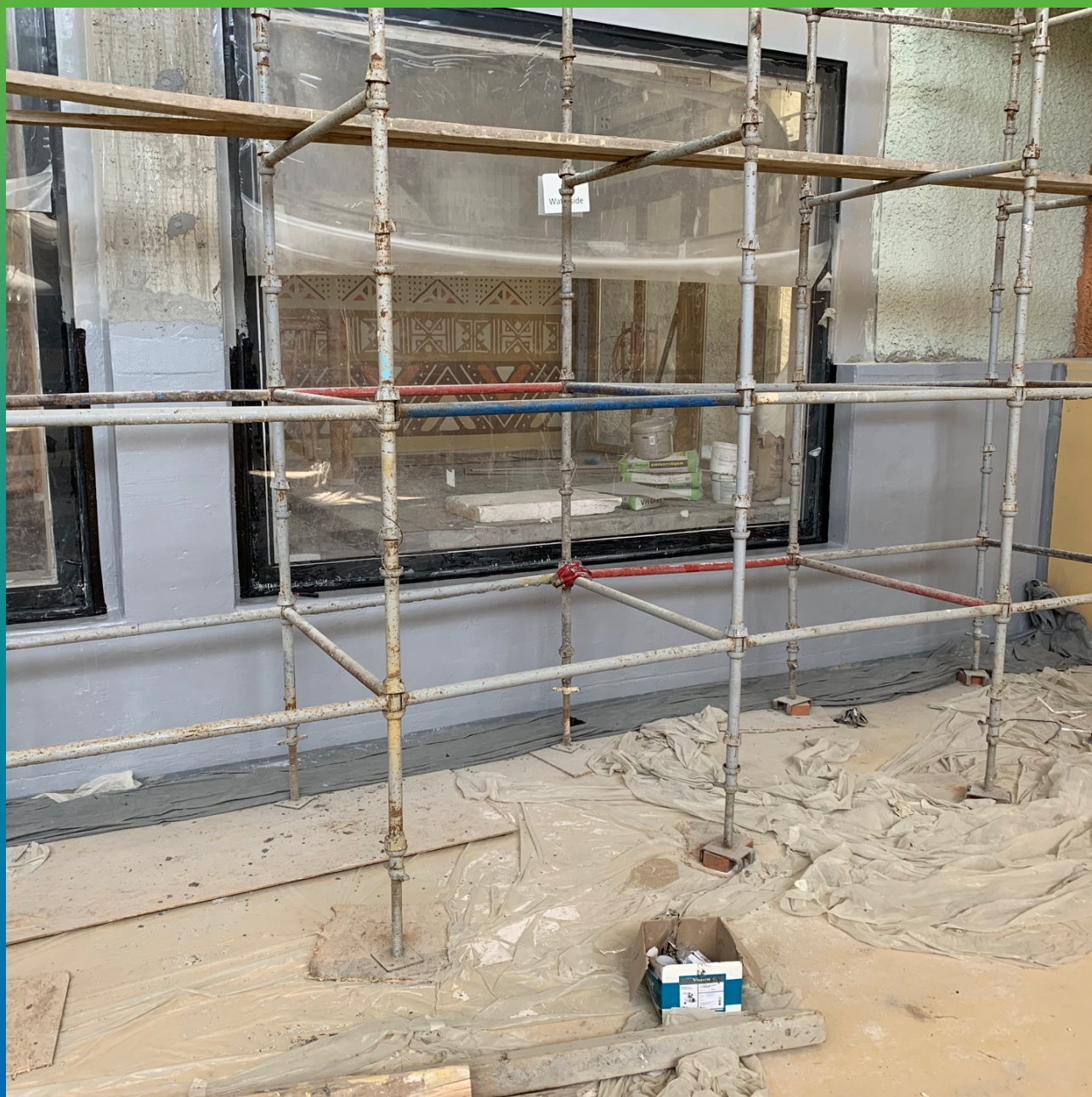
Денстоп ЭП 201, нанесенный на оштукатуренную поверхность