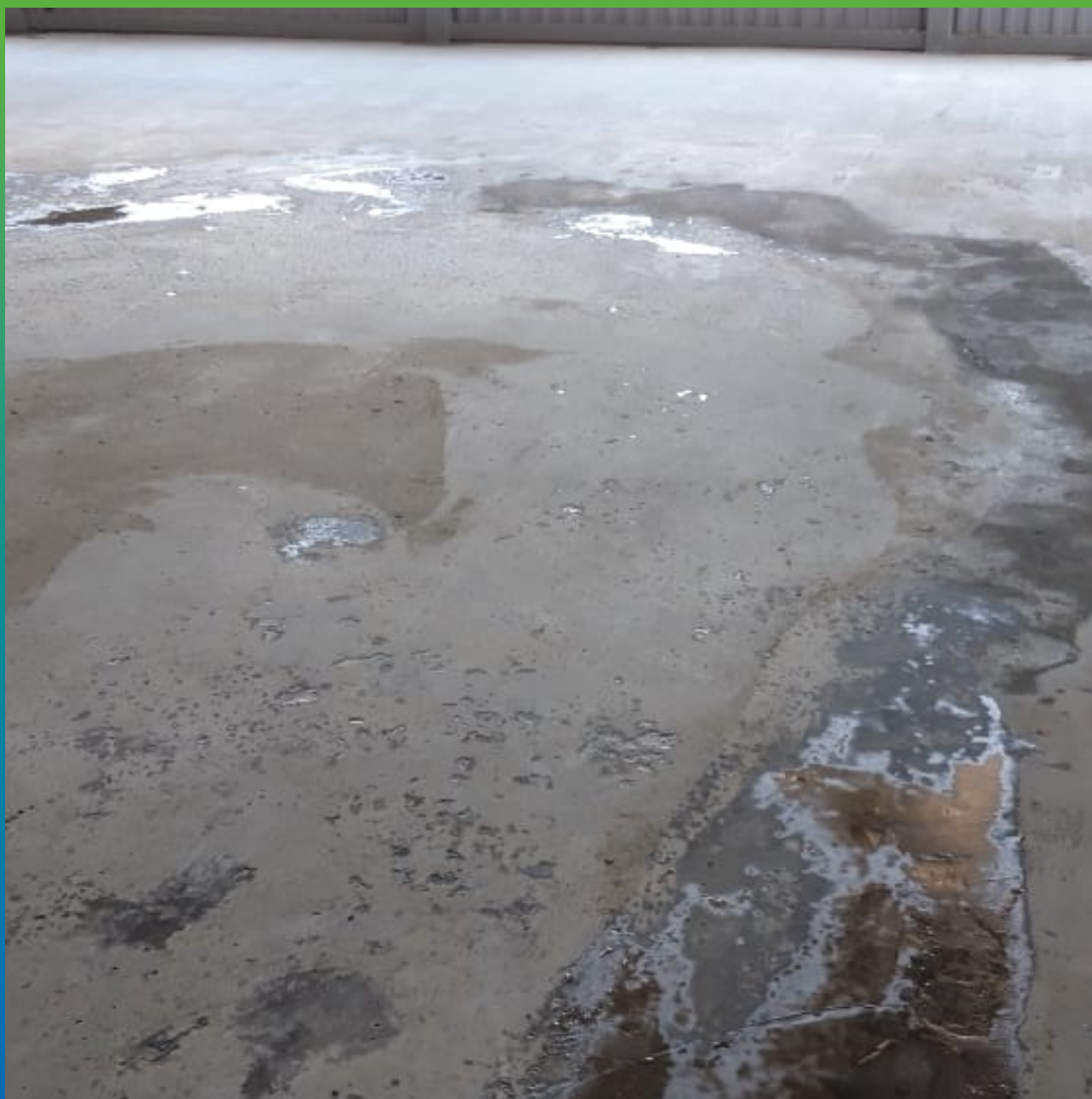
Выравнивание дефектов пола с помощью Стармекс РМЗ и ДенсТоп ЭП 104