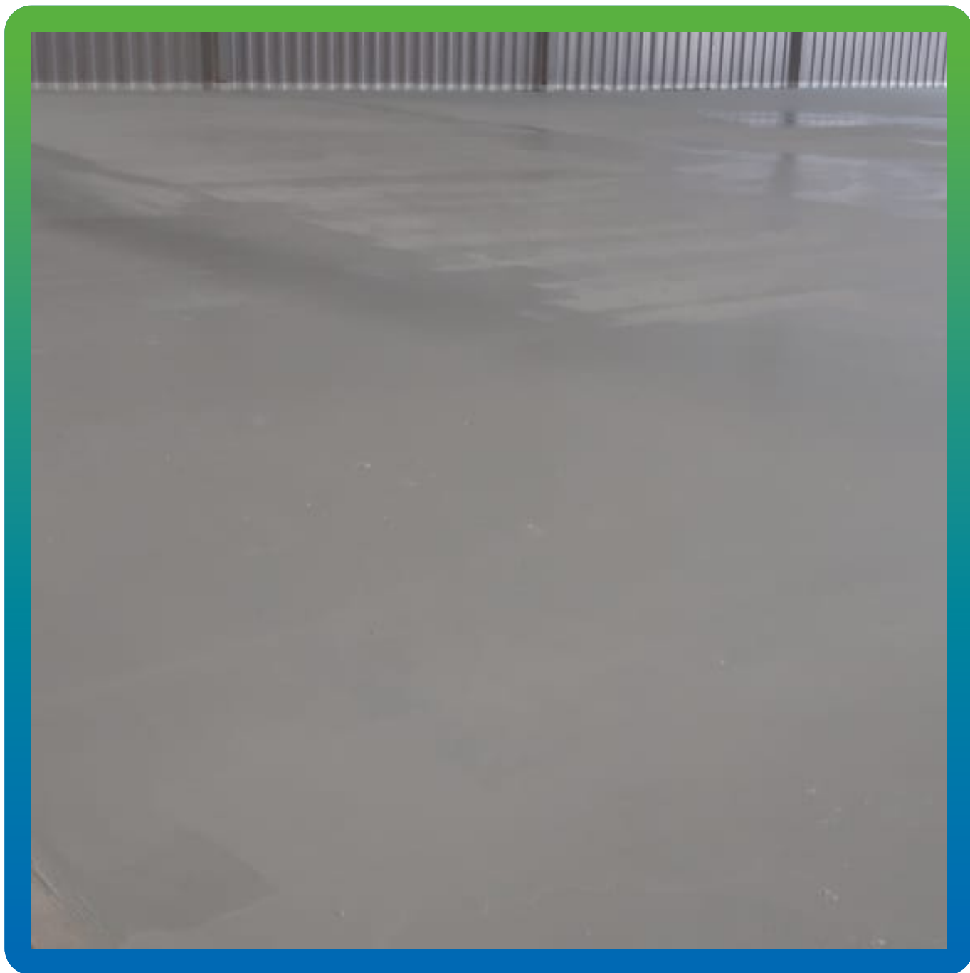
Финишный вид ДенсТоп ЭП 205