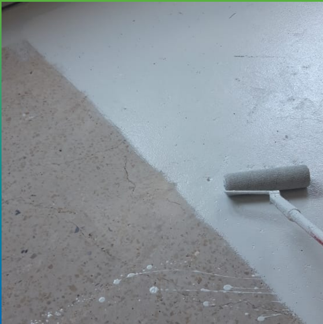
Нанесение ДенсТоп ЭП 205 валиком