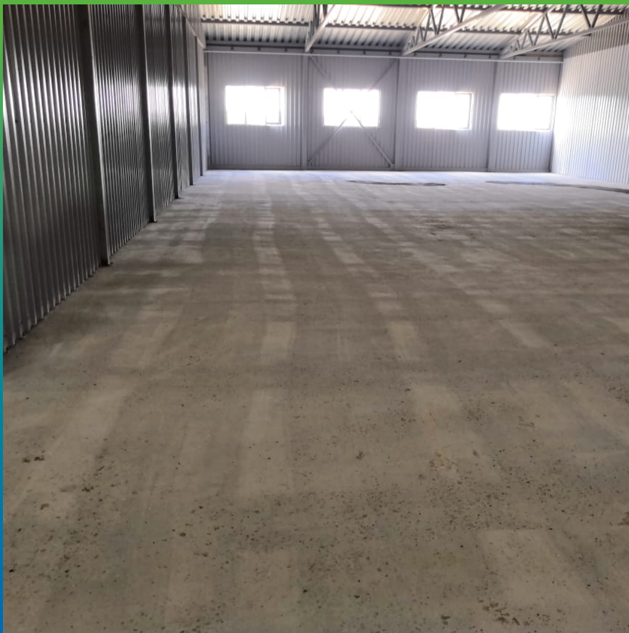
Вид подготовленной поверхности бетонного пола