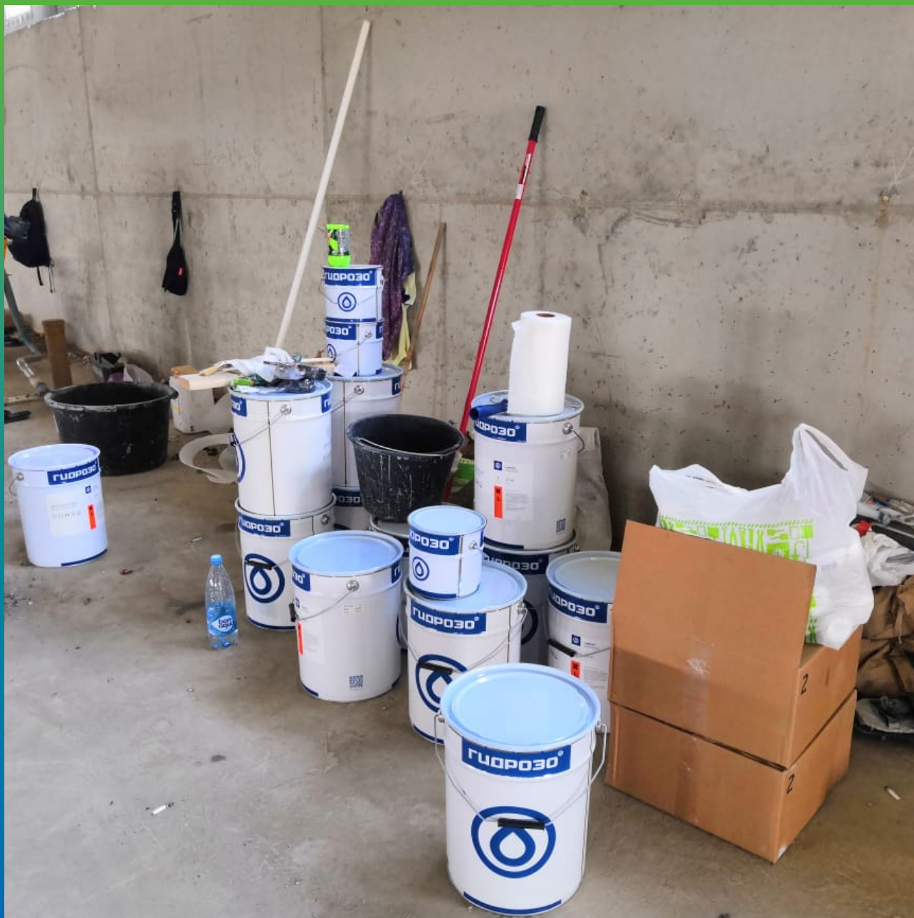
Эпоксидное покрытие на водной основе ДенТоп ЭП 205 на объекте