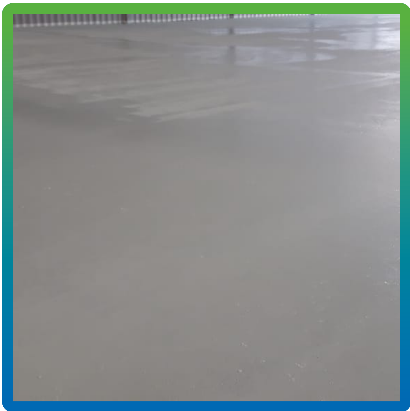
Поверхность пола после нанесения двух слоев