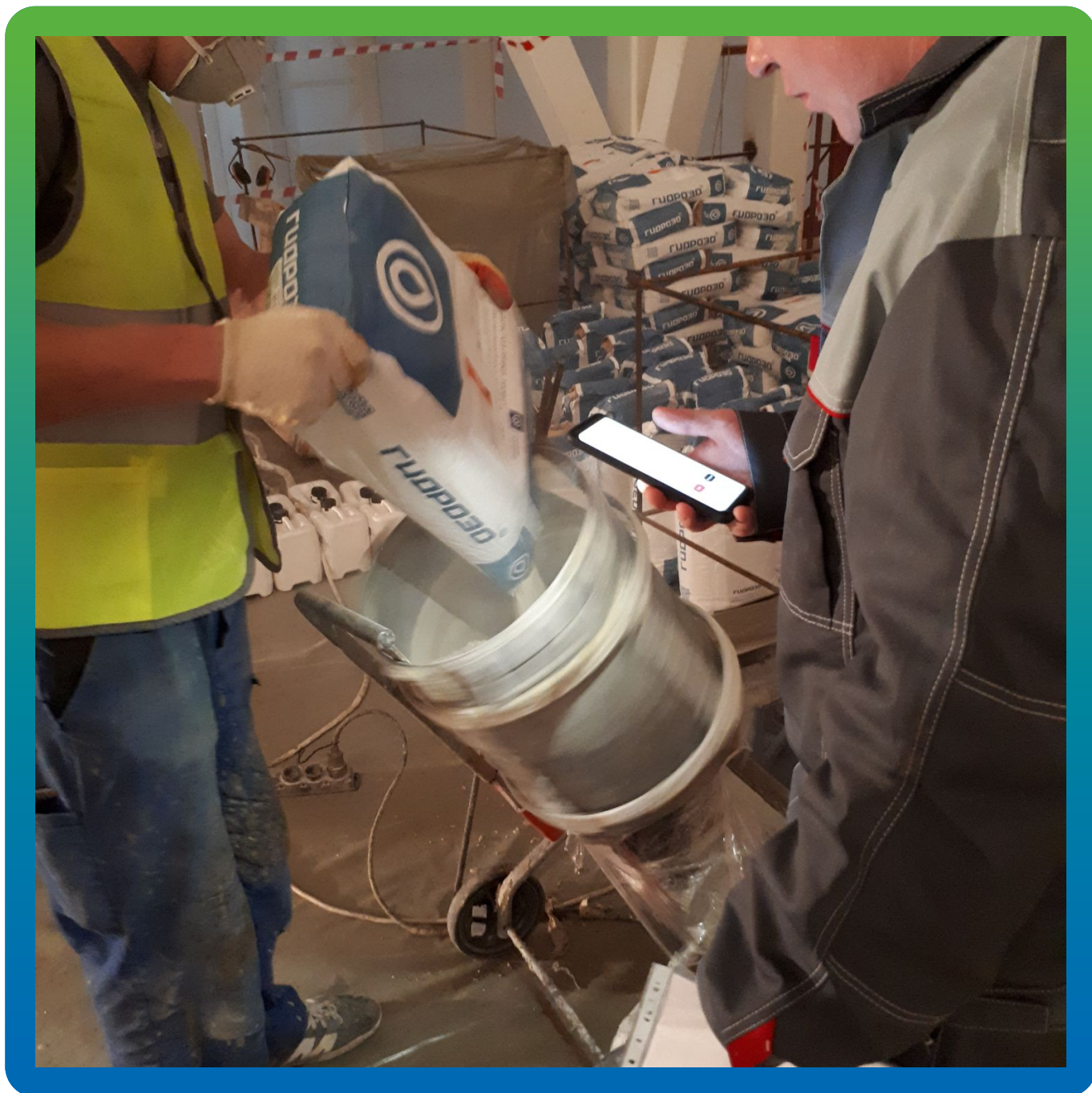
Смешивание компонентов ДенсТоп ПМ 605 Тровел