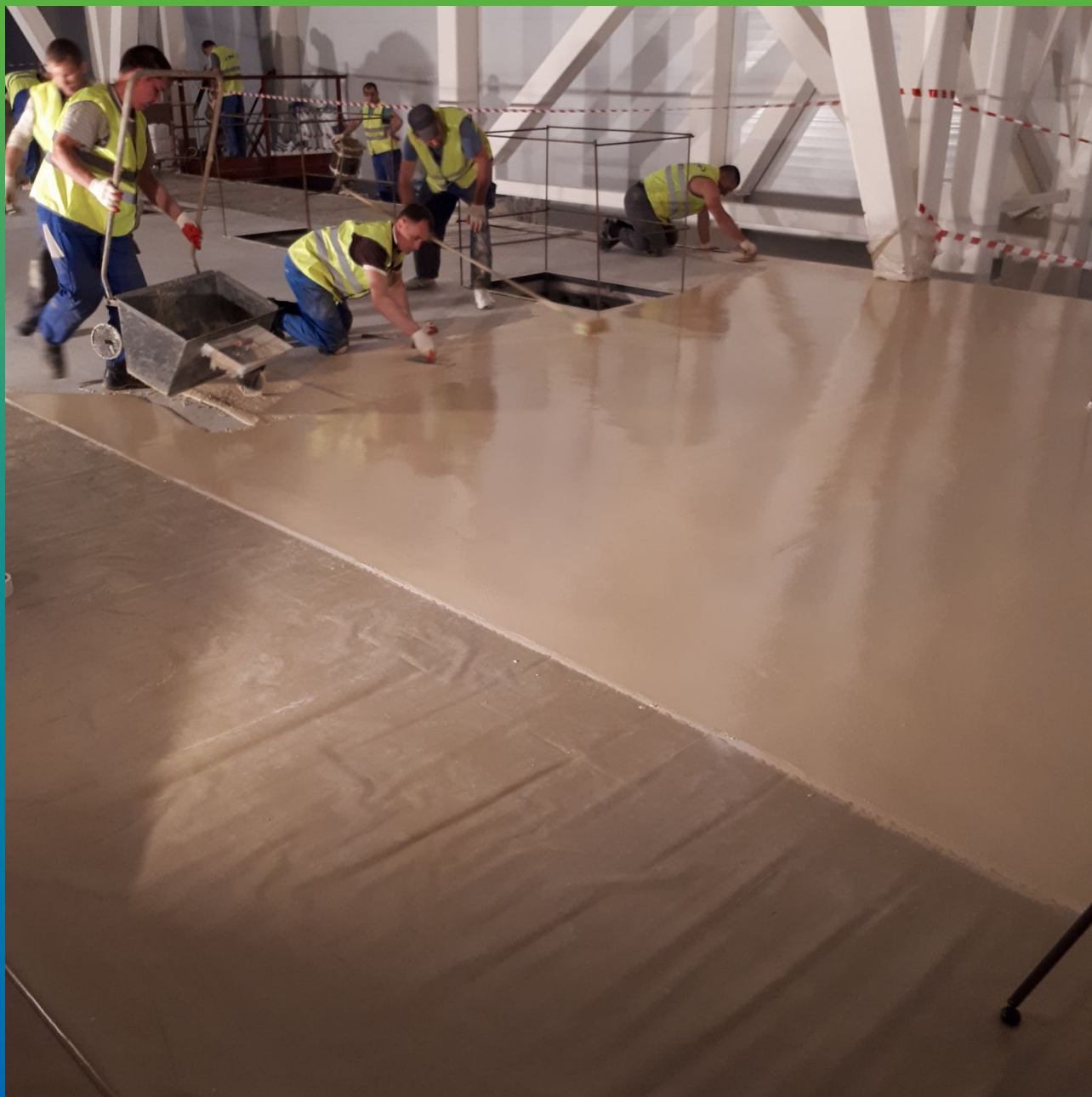
Укладка материала на соседней захватке