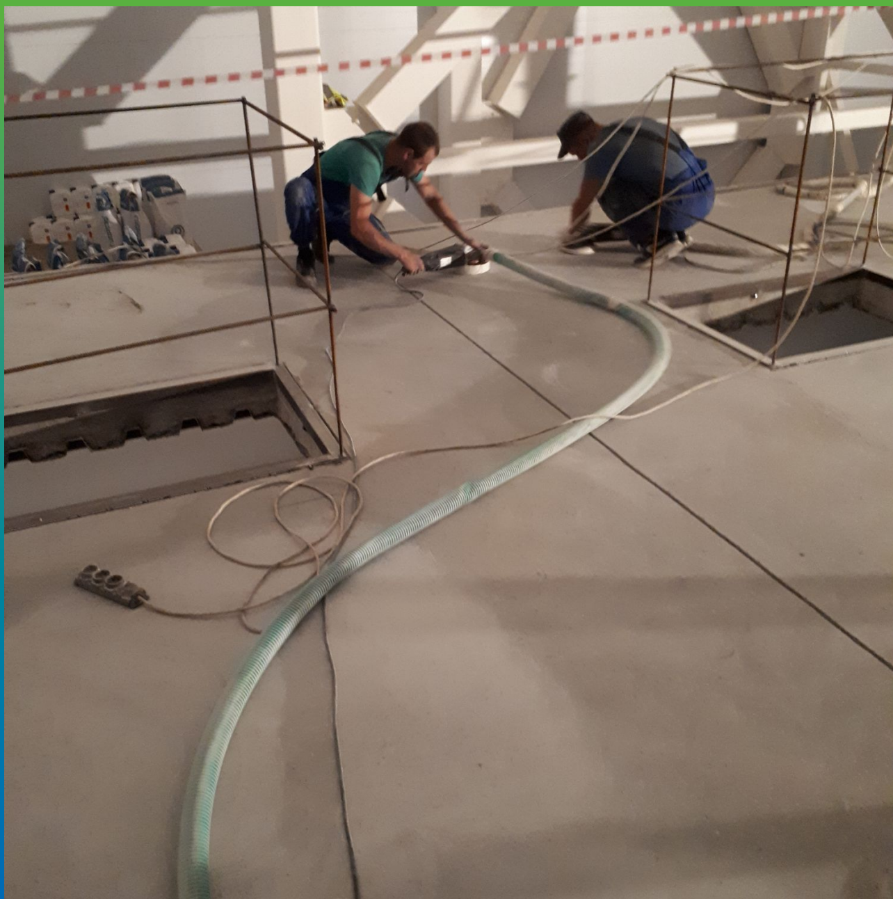
Подготовка поверхности перед укладкой полимерцементного покрытия