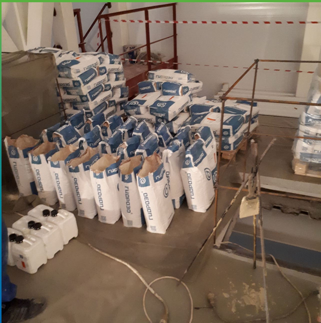
Подготовленный материал перед смешиванием