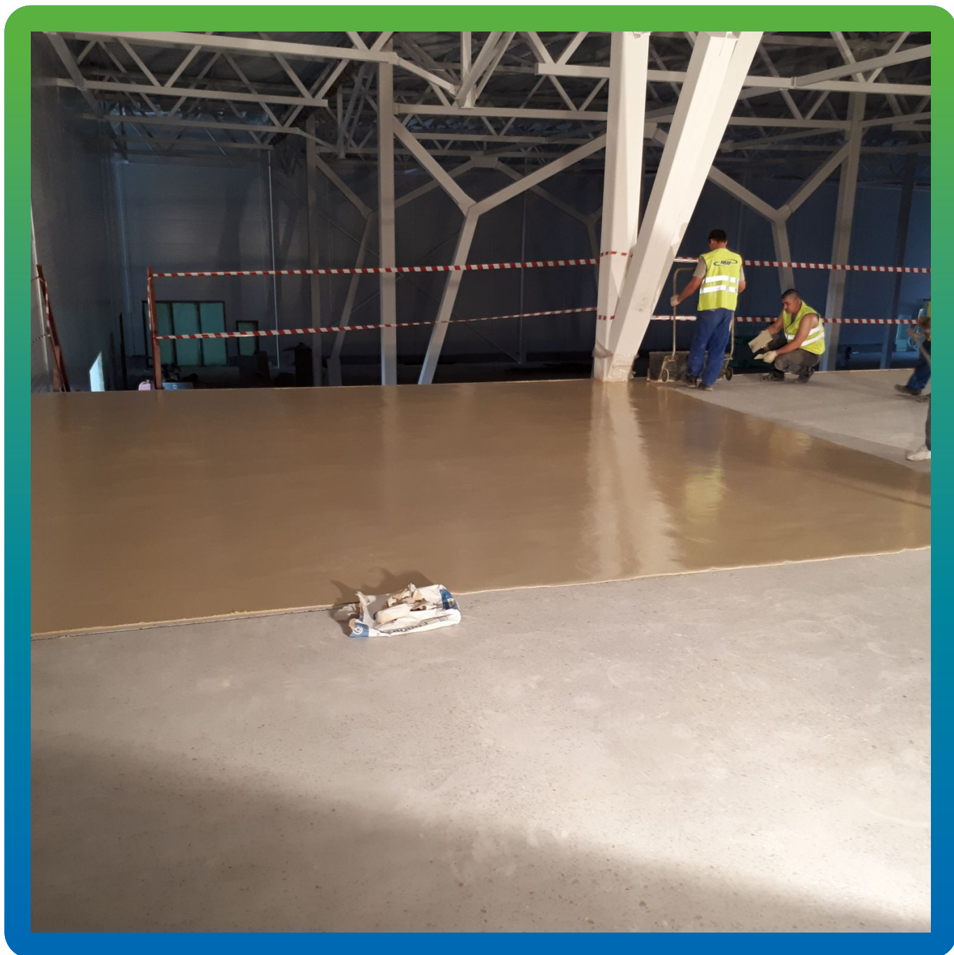
Процесс укладки материала