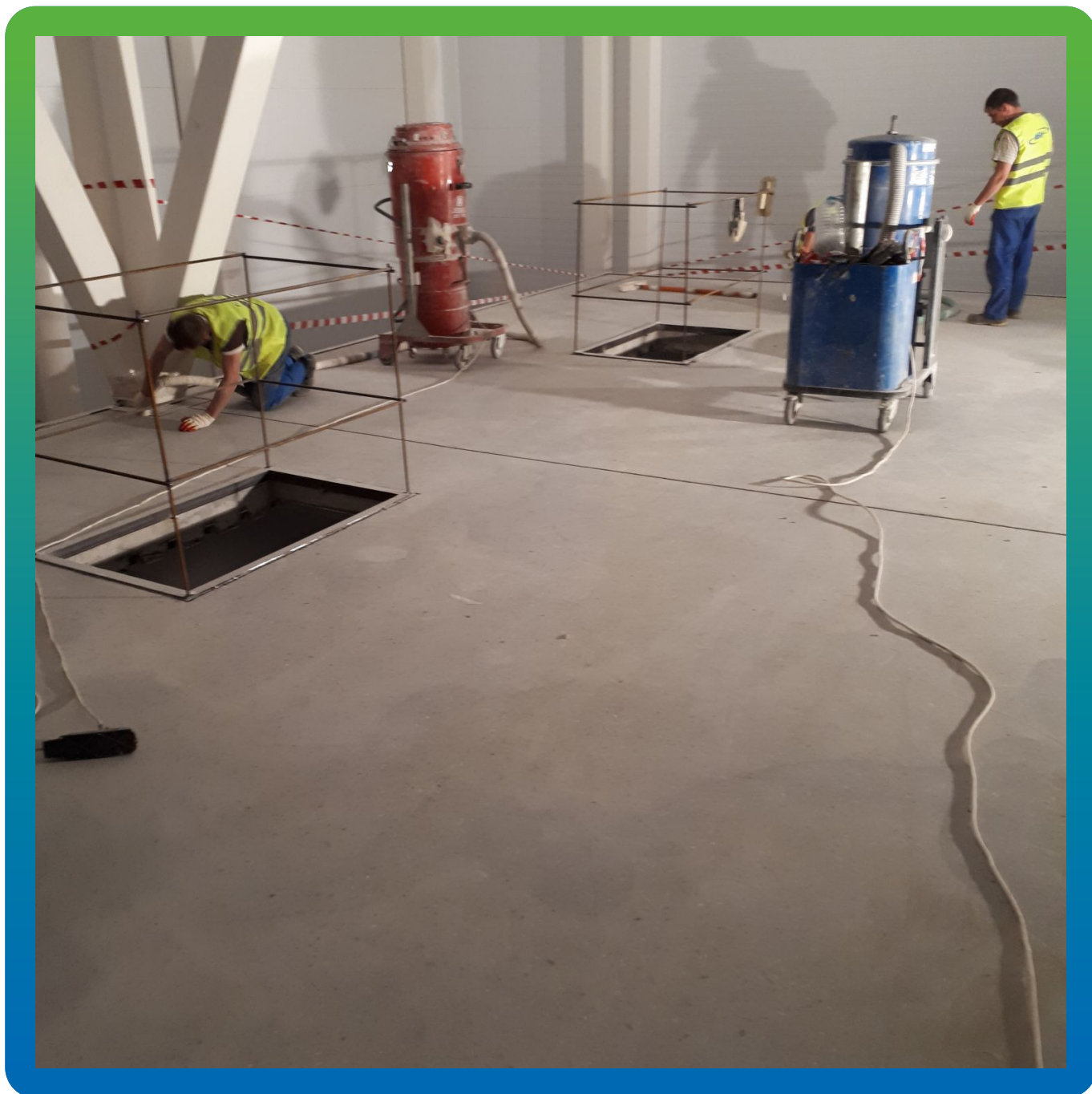
Обеспыливание поверхности бетонного пола и штроб