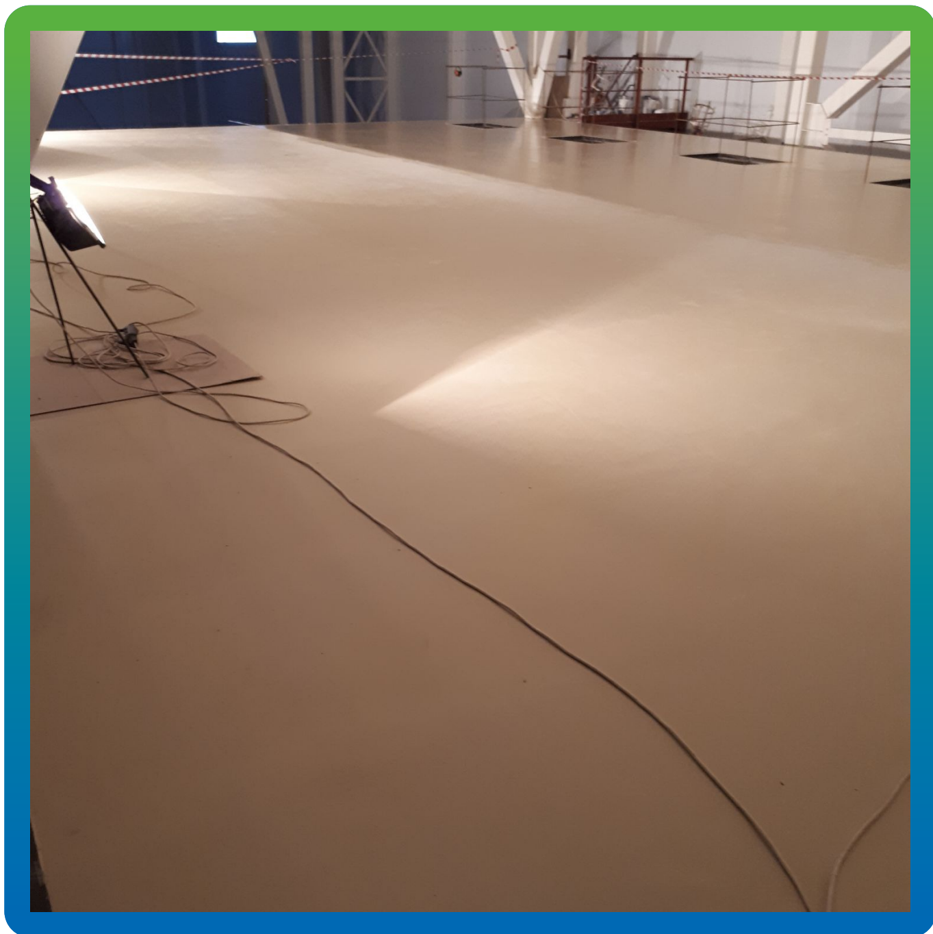
Финишный вид ДенсТоп ПМ 605 Тровел