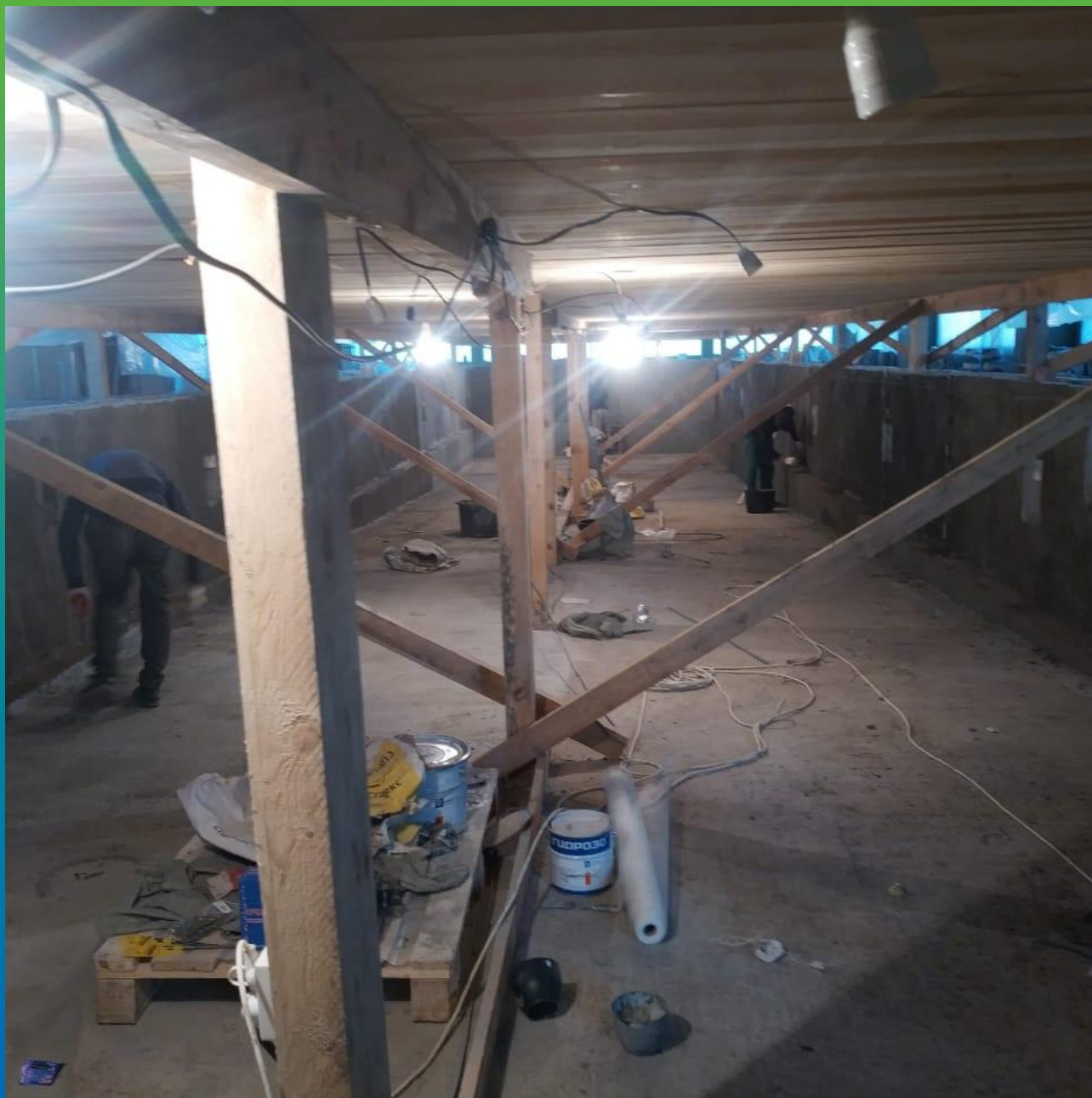
Нанесение второго слоя гидроизоляции Стармекс Сил Флекс