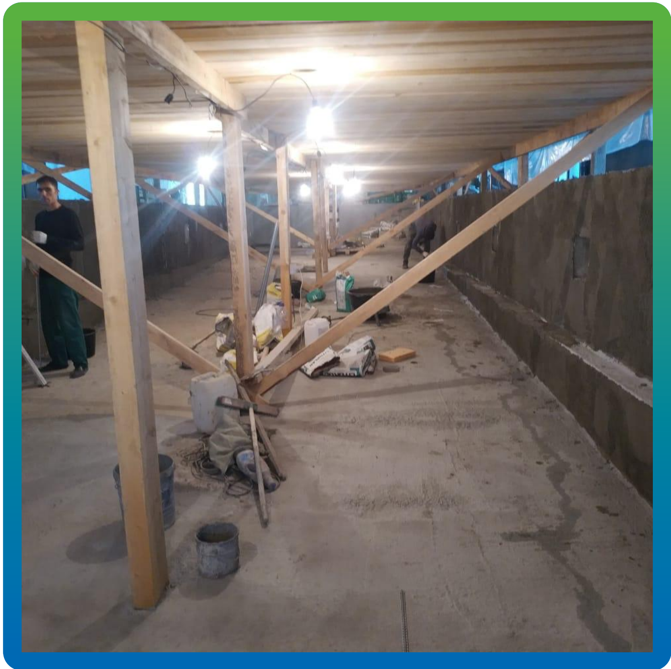
Площадная гидроизоляция составом Стармекс Сил Флекс