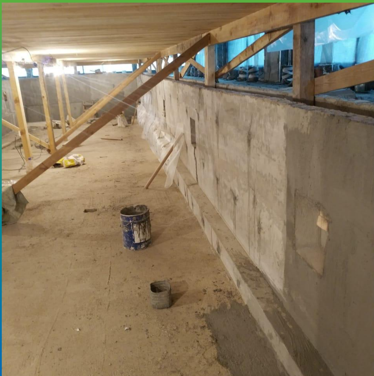
Площадная гидроизоляция составом Стармекс Сил Флекс