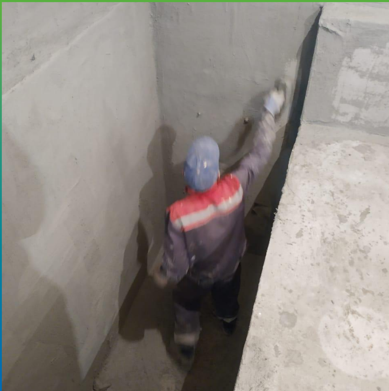
Площадная гидроизоляция составом Стармекс Сил Флекс в два слоя