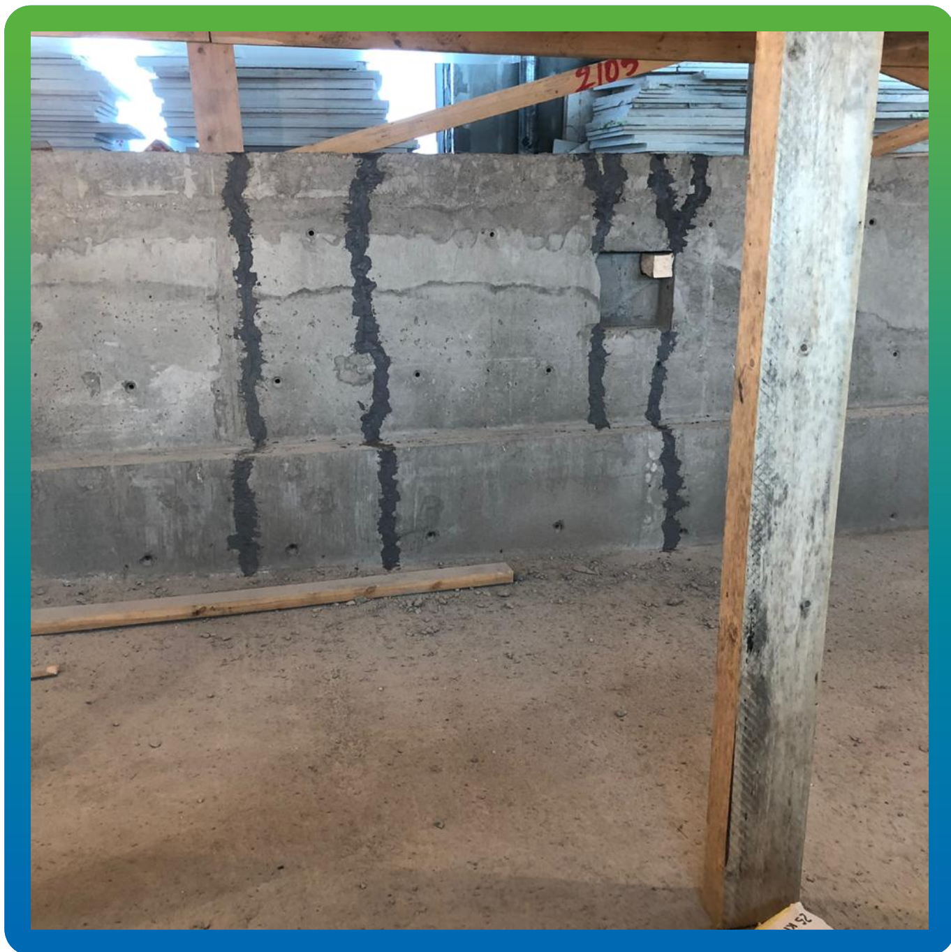
Ремонт трещин чаши бассейна