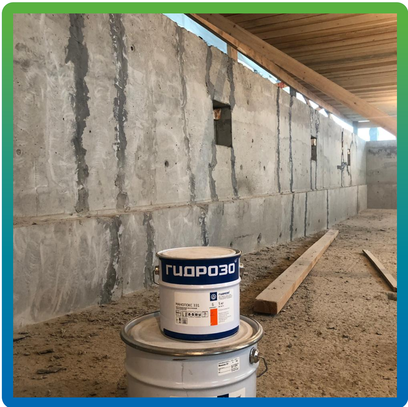
Ремонт трещин стен чаши бассейна эпоксидным составом Манопокс 331