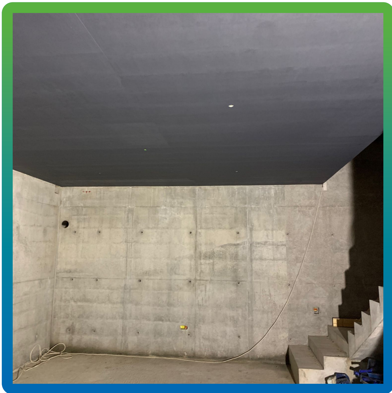
Состав ДенсТоп ЭП 205, нанесенный на бетонную поверхность