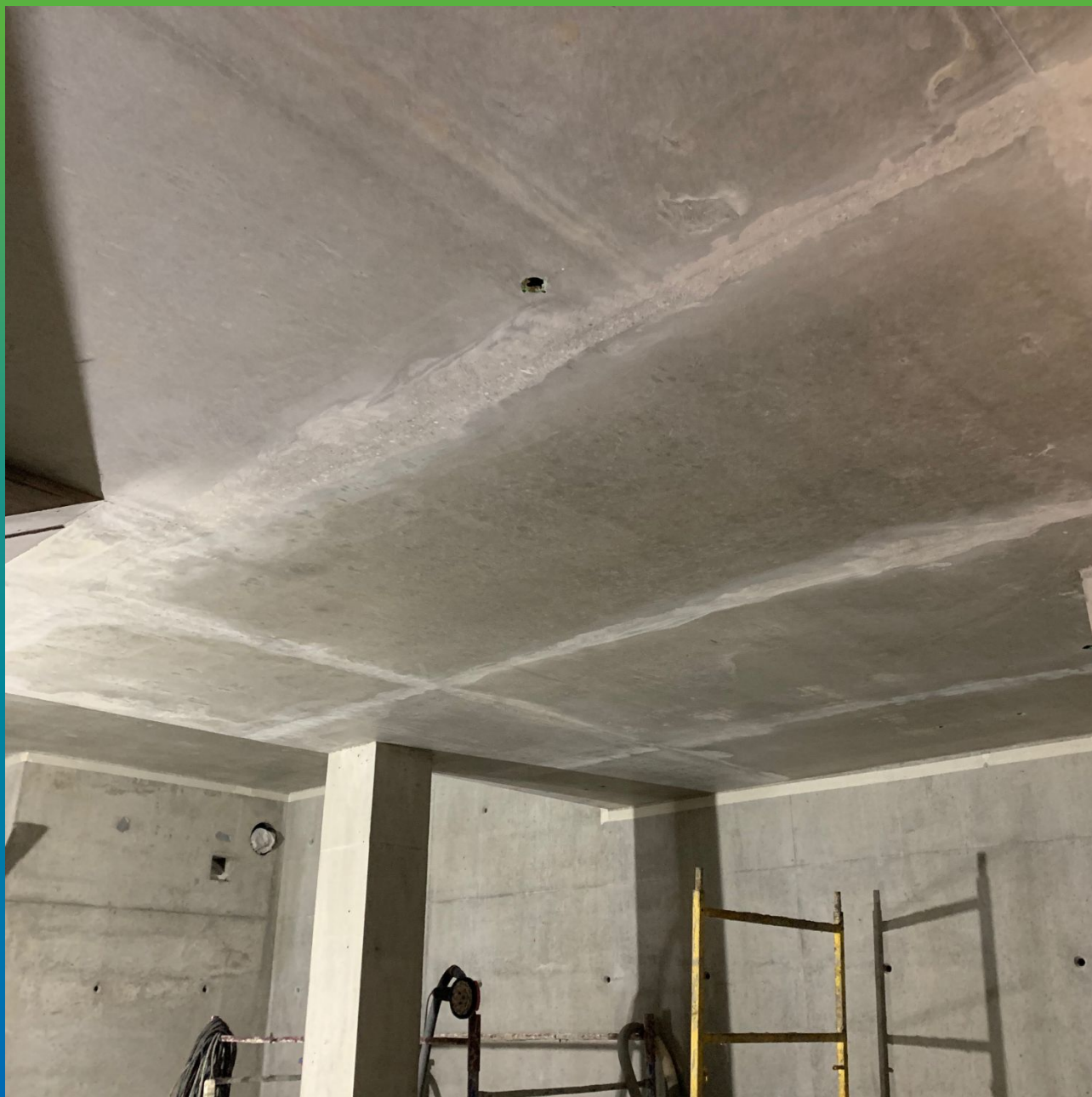
Вид подготовленной поверхности потолка под нанесение состава Денстоп ЭП 205