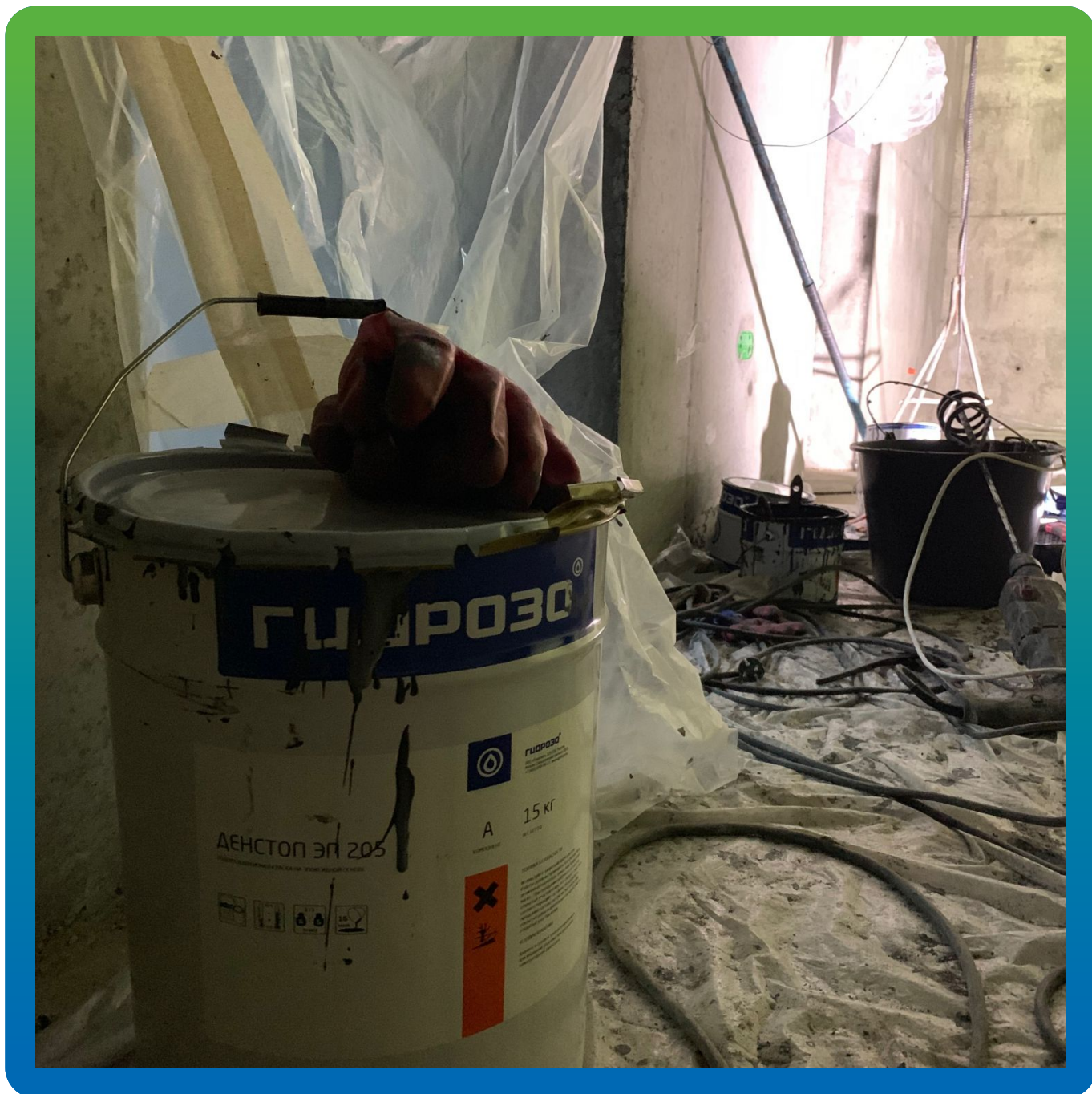
Материал на объекте