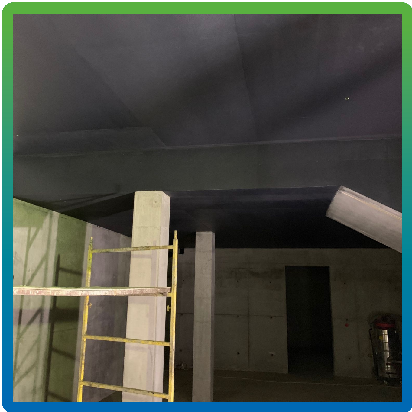
Водоразбавляемая краска ДенсТоп ЭП 205, нанесенная в 3 слоя