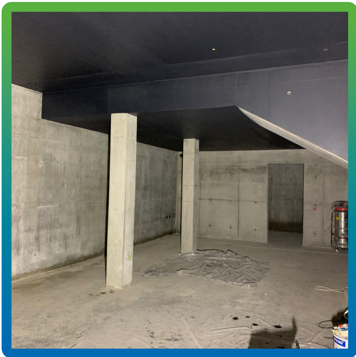
Состав ДенсТоп ЭП 205, нанесенный в 3 слоя