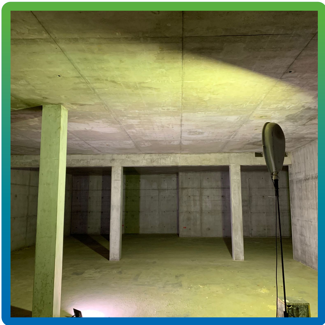
Вид подготовленной поверхности потолка под нанесение состава Денстоп ЭП 205