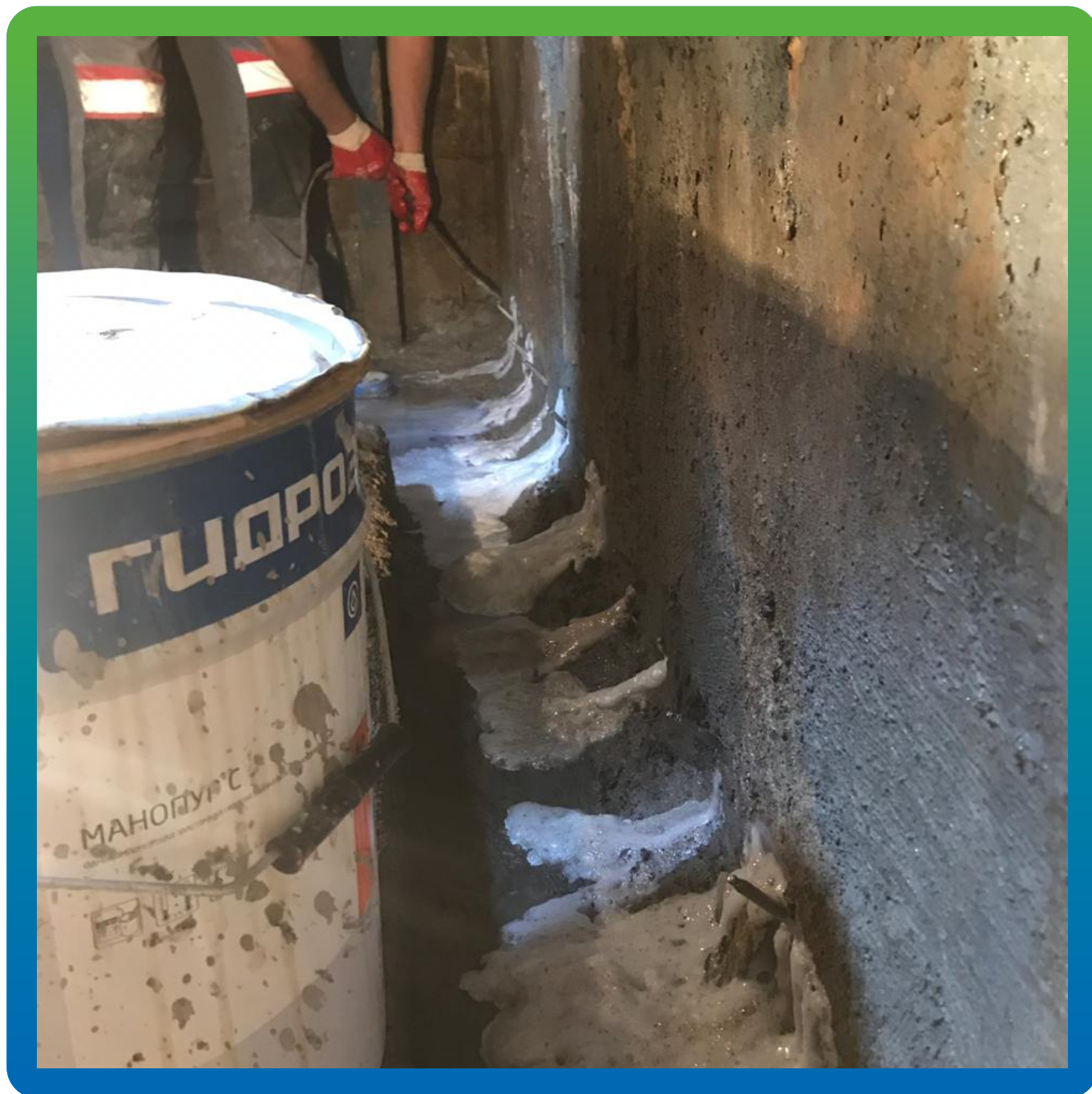
Инъектирование холодных швов составом Манопур С