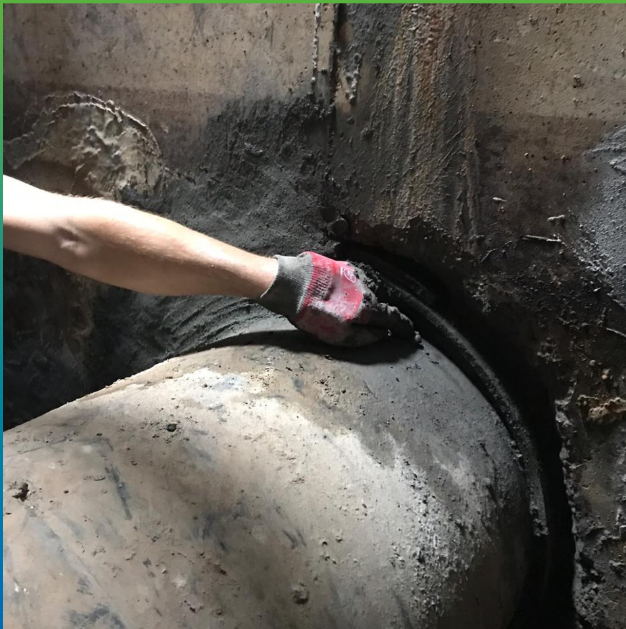
Зачеканка ввода коммуникаций составом Стармекс Чекан