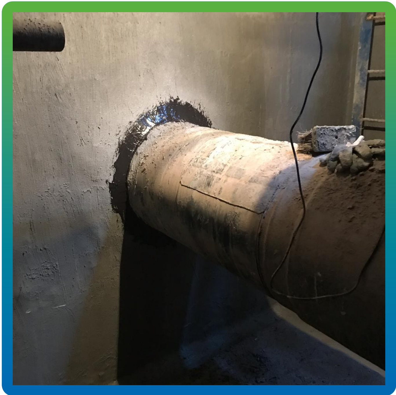
Выполненные гидроизоляционные работы в приемной камере