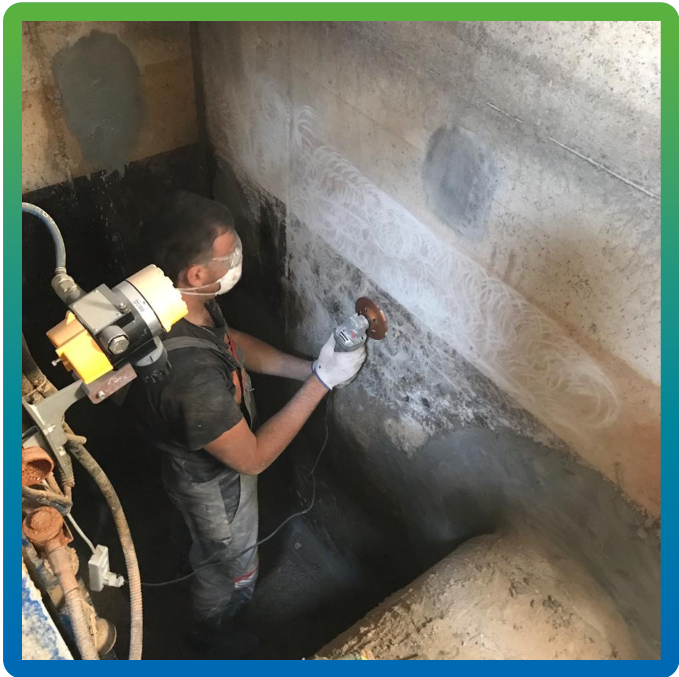
Шлифовка стен для нанесения состава Стармекс Сил