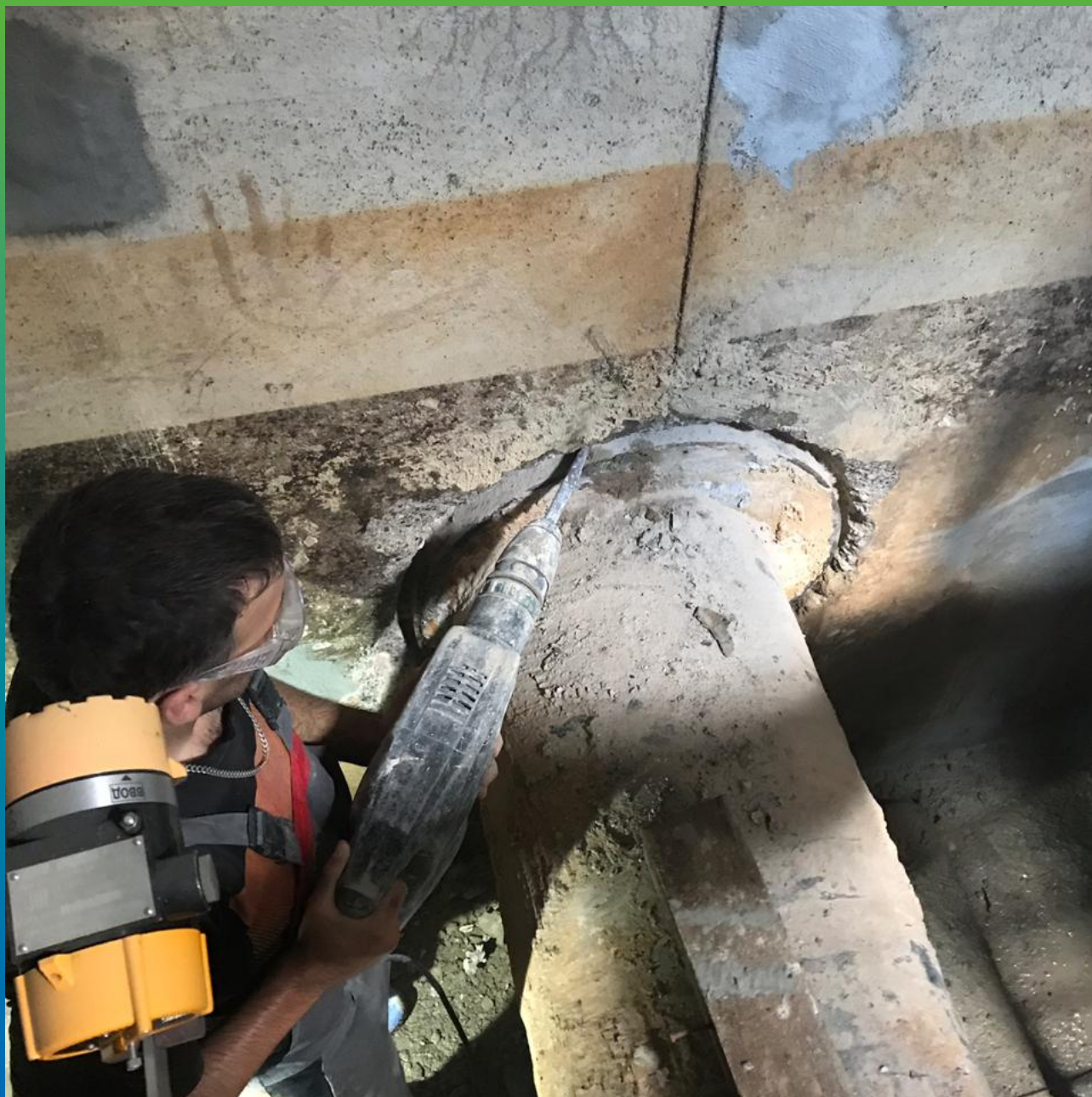
Расшивка стыка ввода коммуникаций