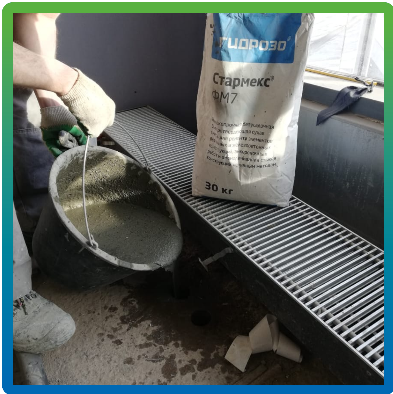
Подливка лотков Стармекс ФМ7