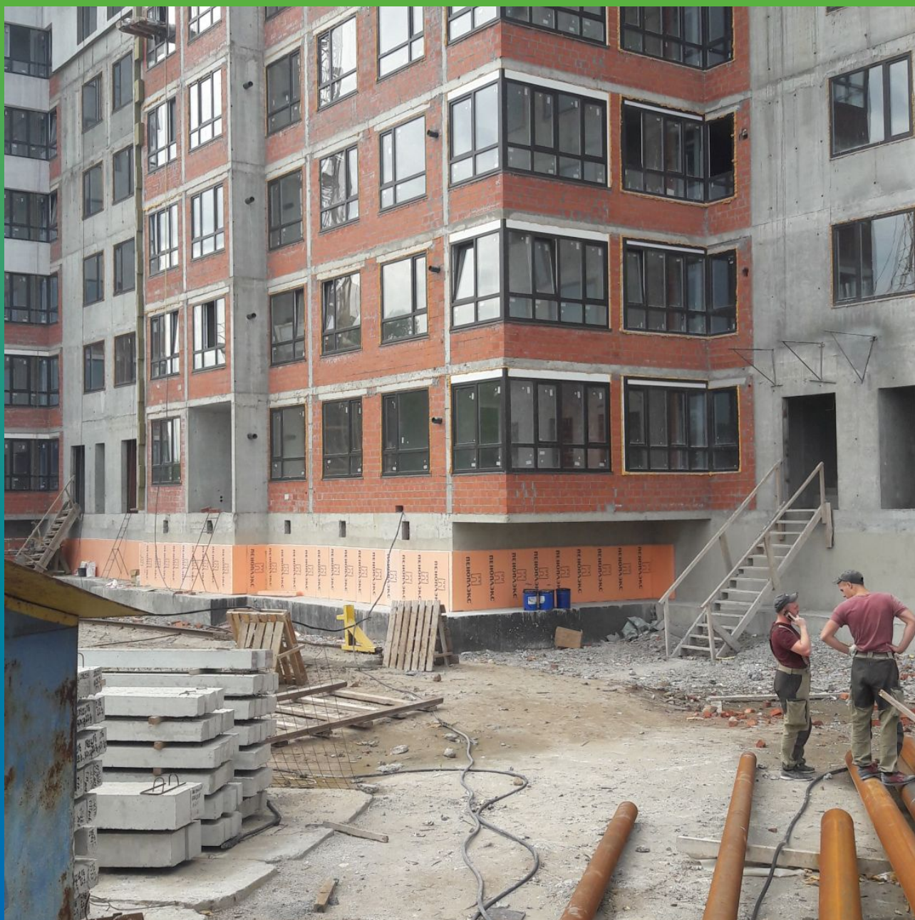
Вид после нанесения материала Стармек Сил