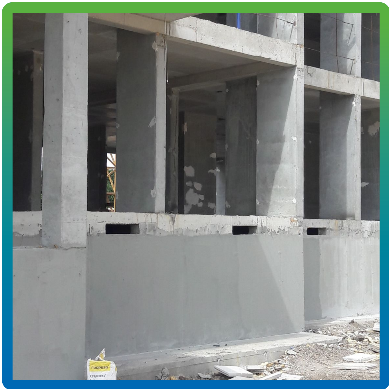
Внешний вид площадки после нанесения Стармек Сил