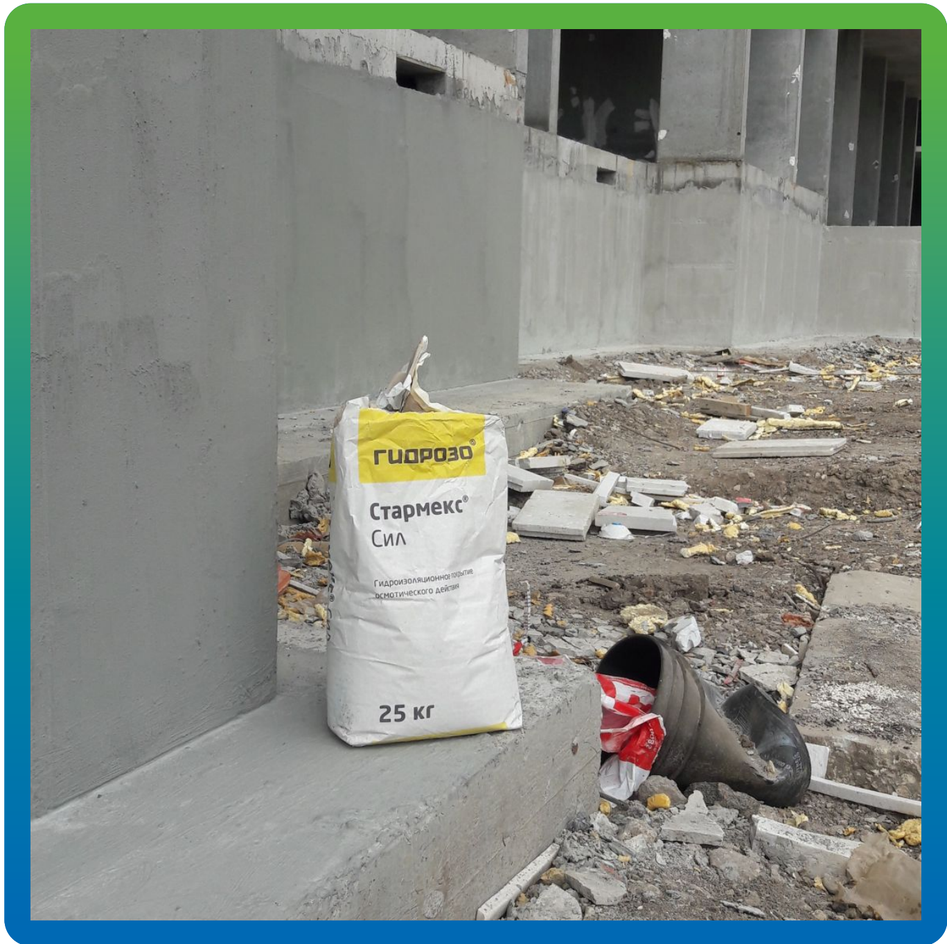
Гидроизоляционный состав Стармекс Сил на объекте