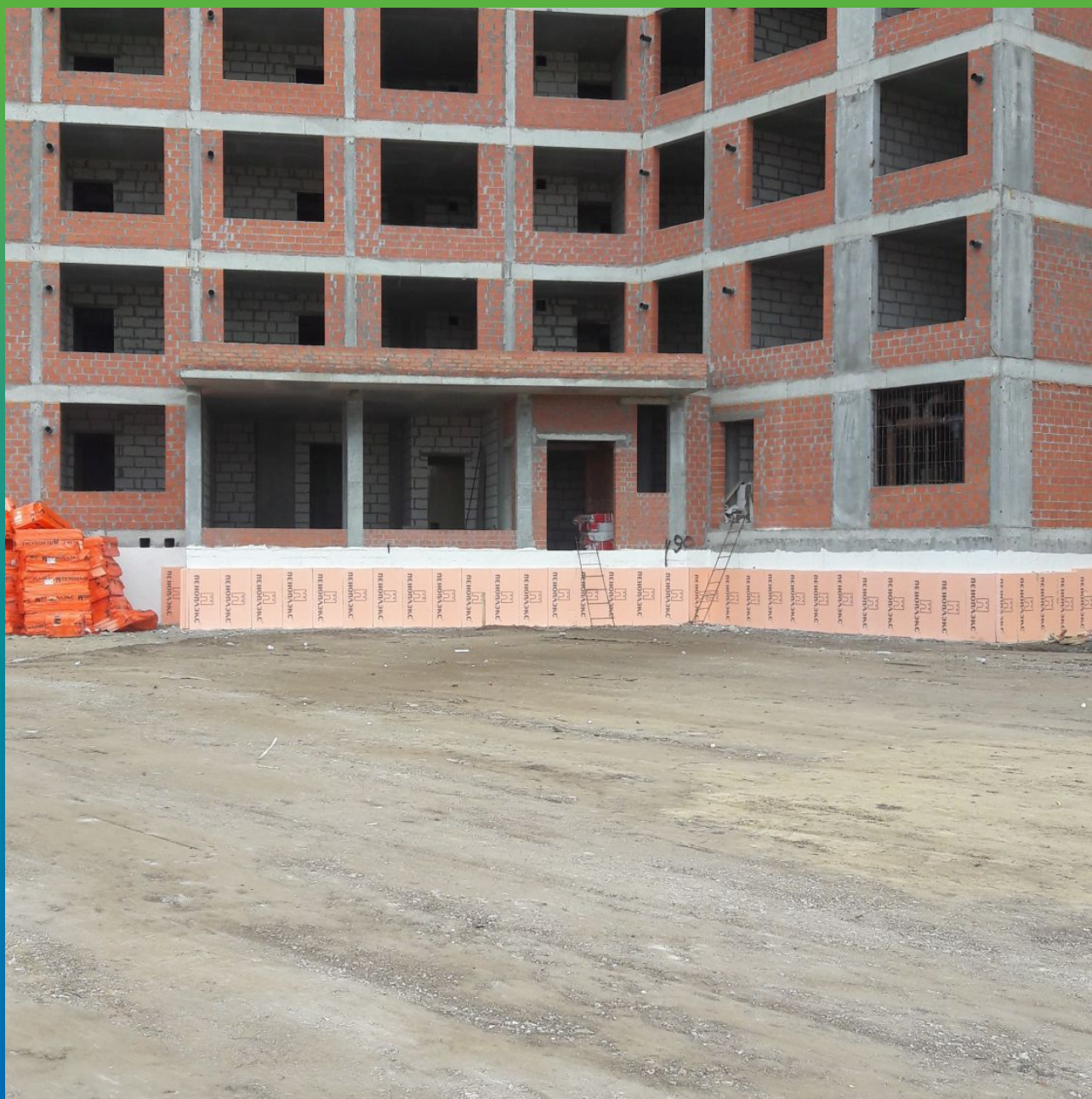
Общий вид объекта