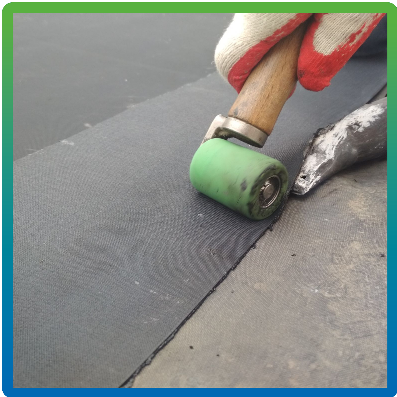
Соединение полотен между собой лентой Термобонд