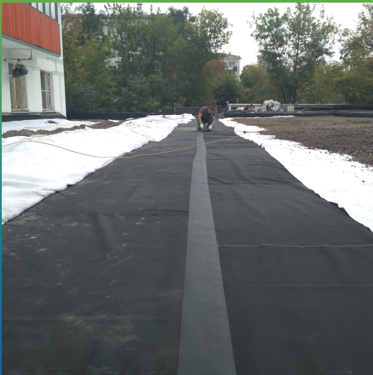
Соединение полотен между собой лентой Термобонд