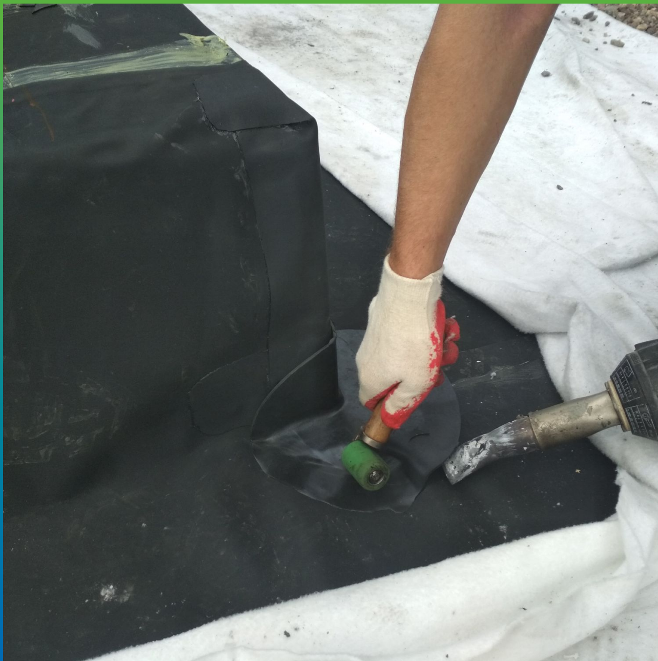
Монтаж внешнего угла ТПО системы Термобонд