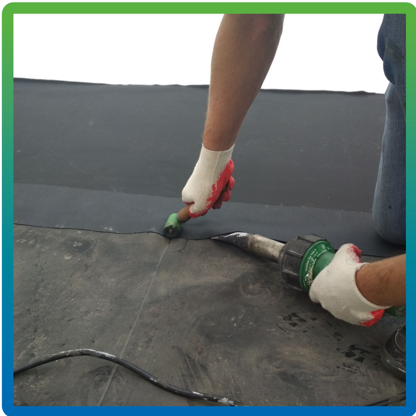
Соединение полотен между собой лентой Термобонд