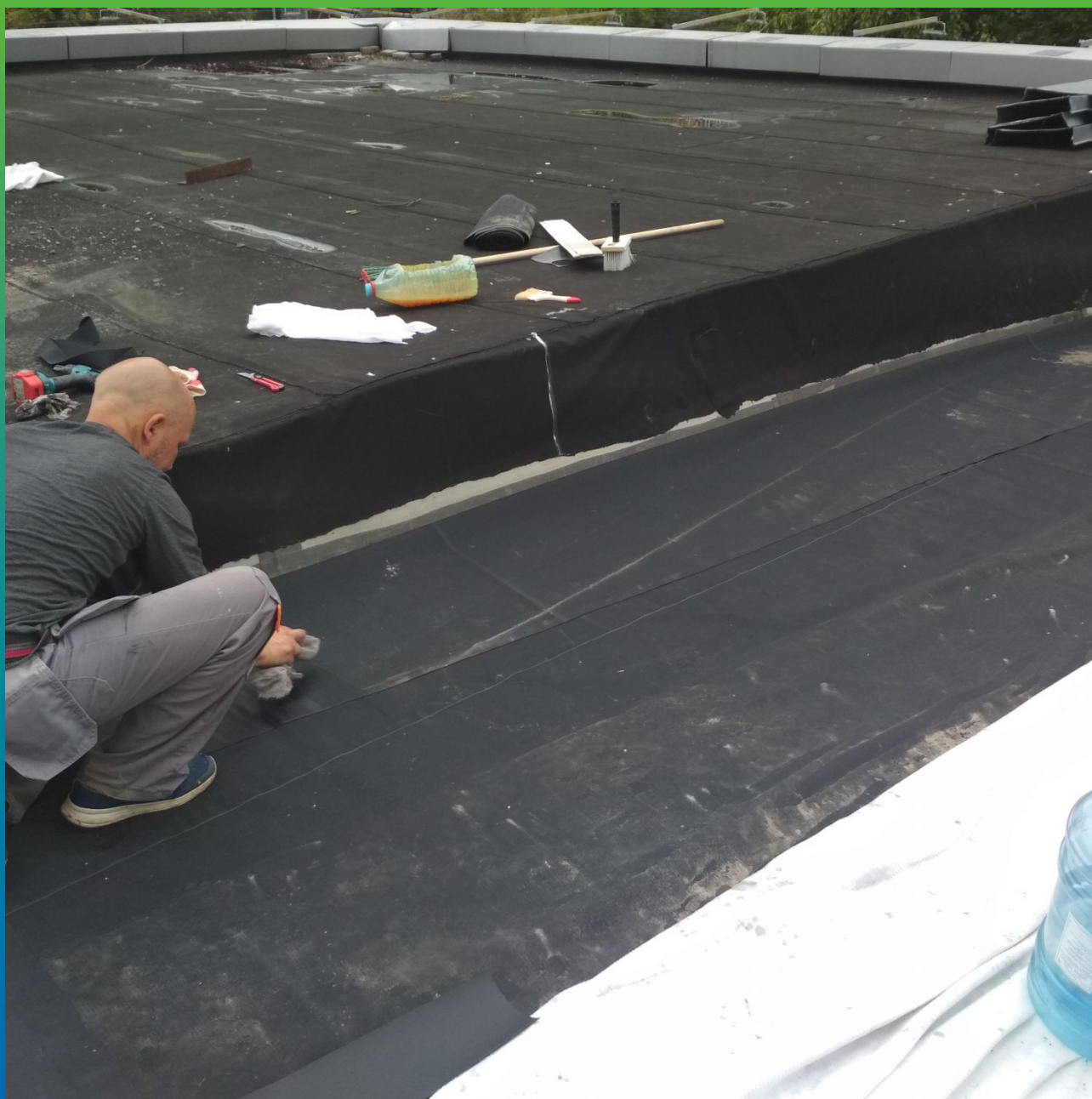
Удаление пыли и грязи с поверхности мембраны перед началом приклеивания