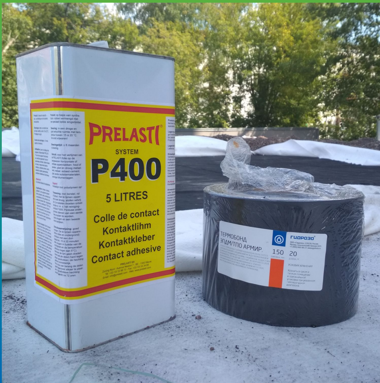
Материалы для монтажа мембраны