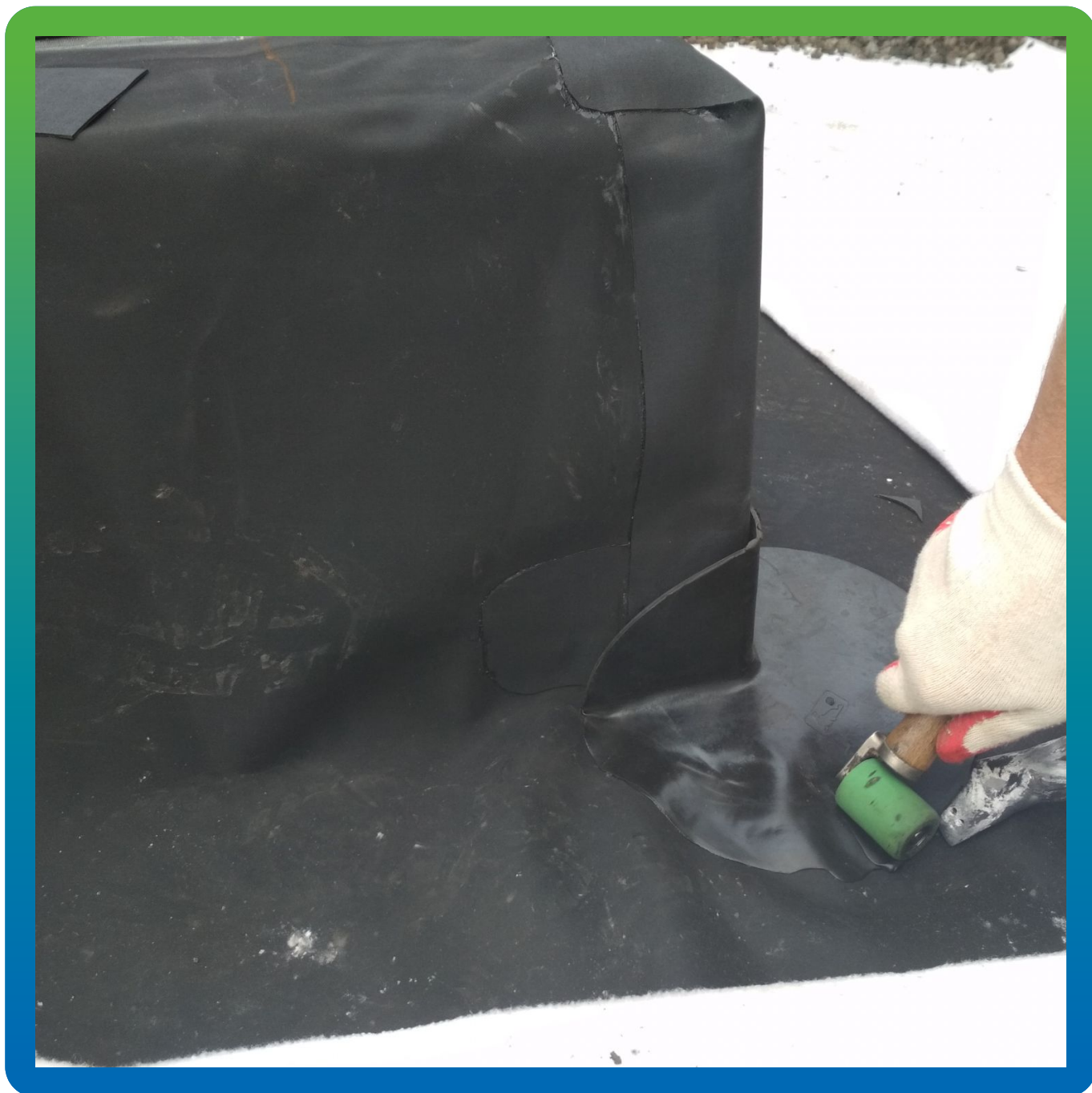
Монтаж внешнего угла ТПО системы Термобонд