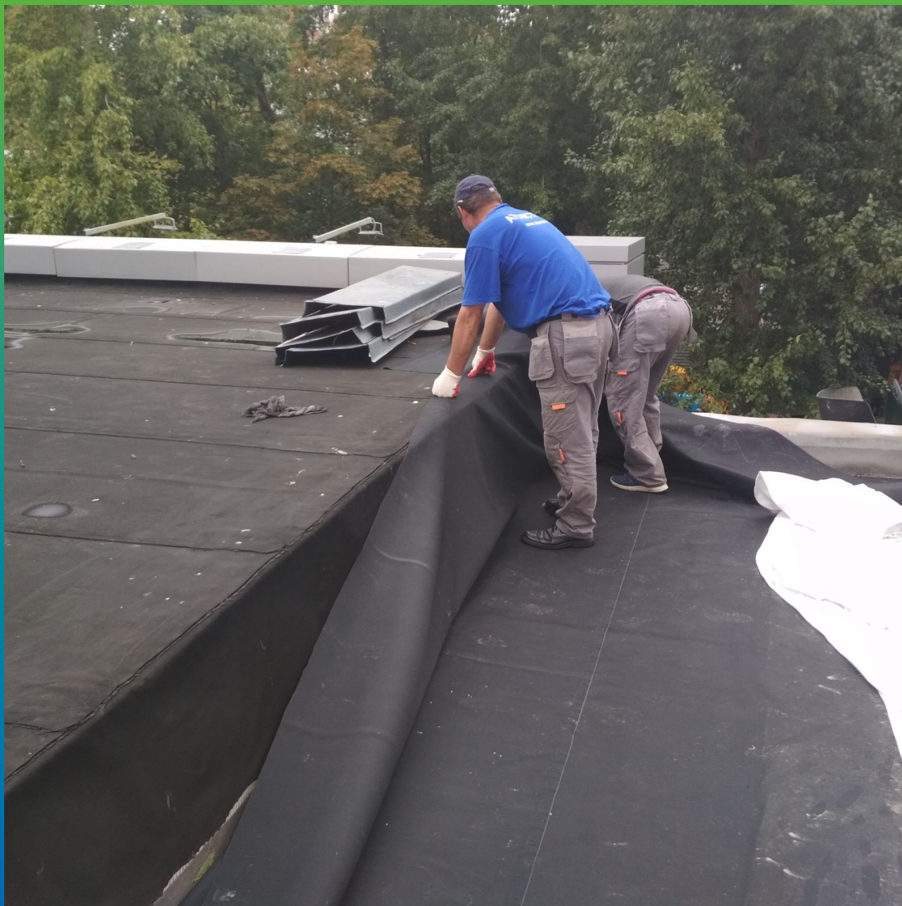
Монтаж мембраны в местах примыканий