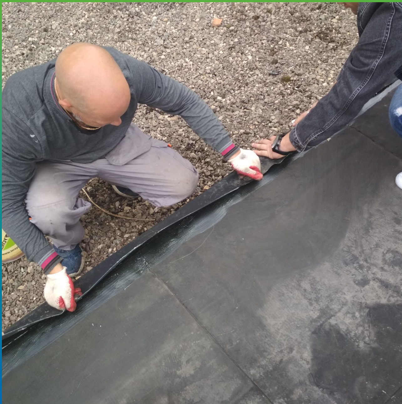
Монтаж мембраны в местах примыканий на Адгезив П400