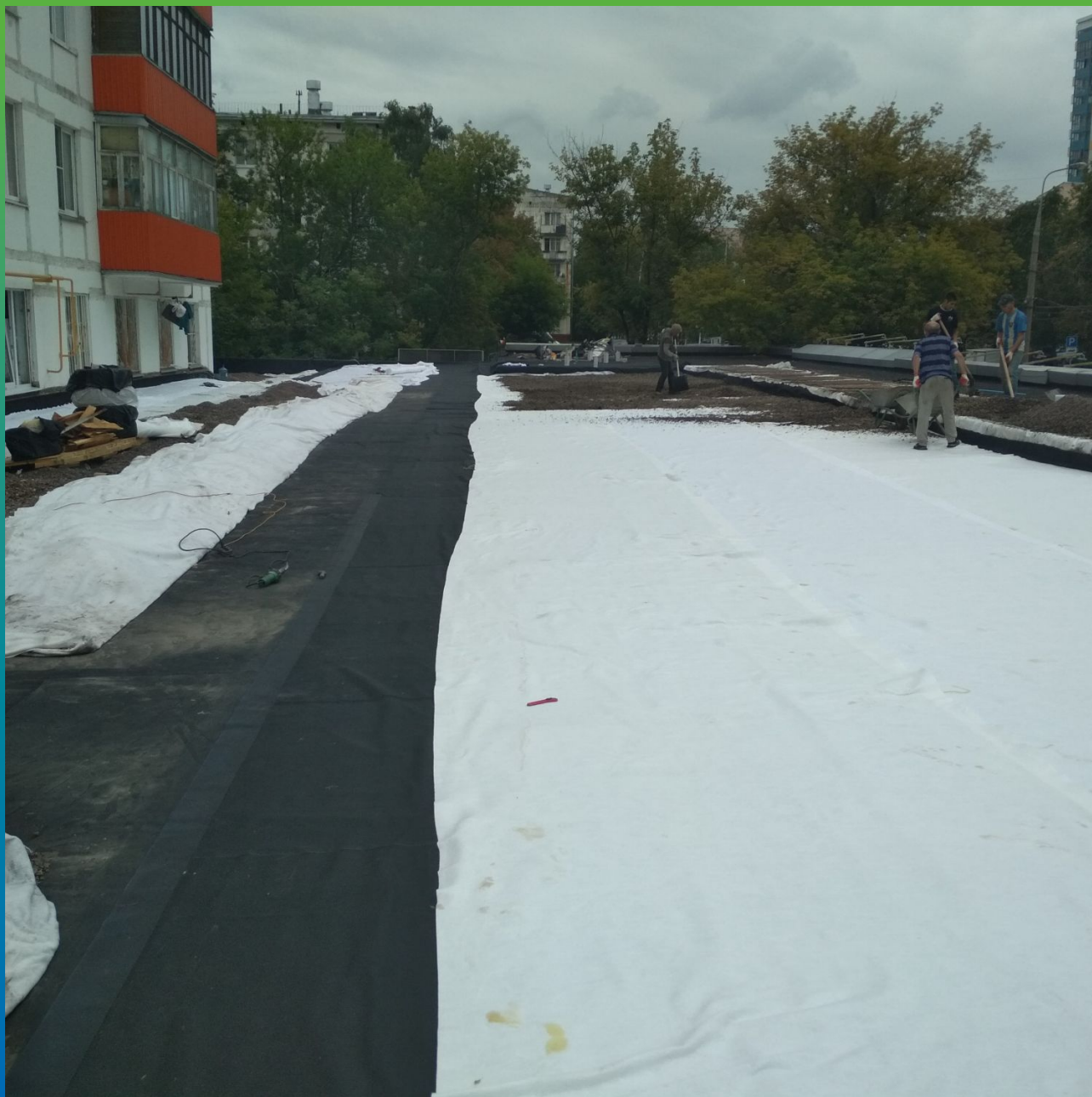
Укладка защитного слоя из геотекстиля поверх ЭПДМ Мембраны Прелести