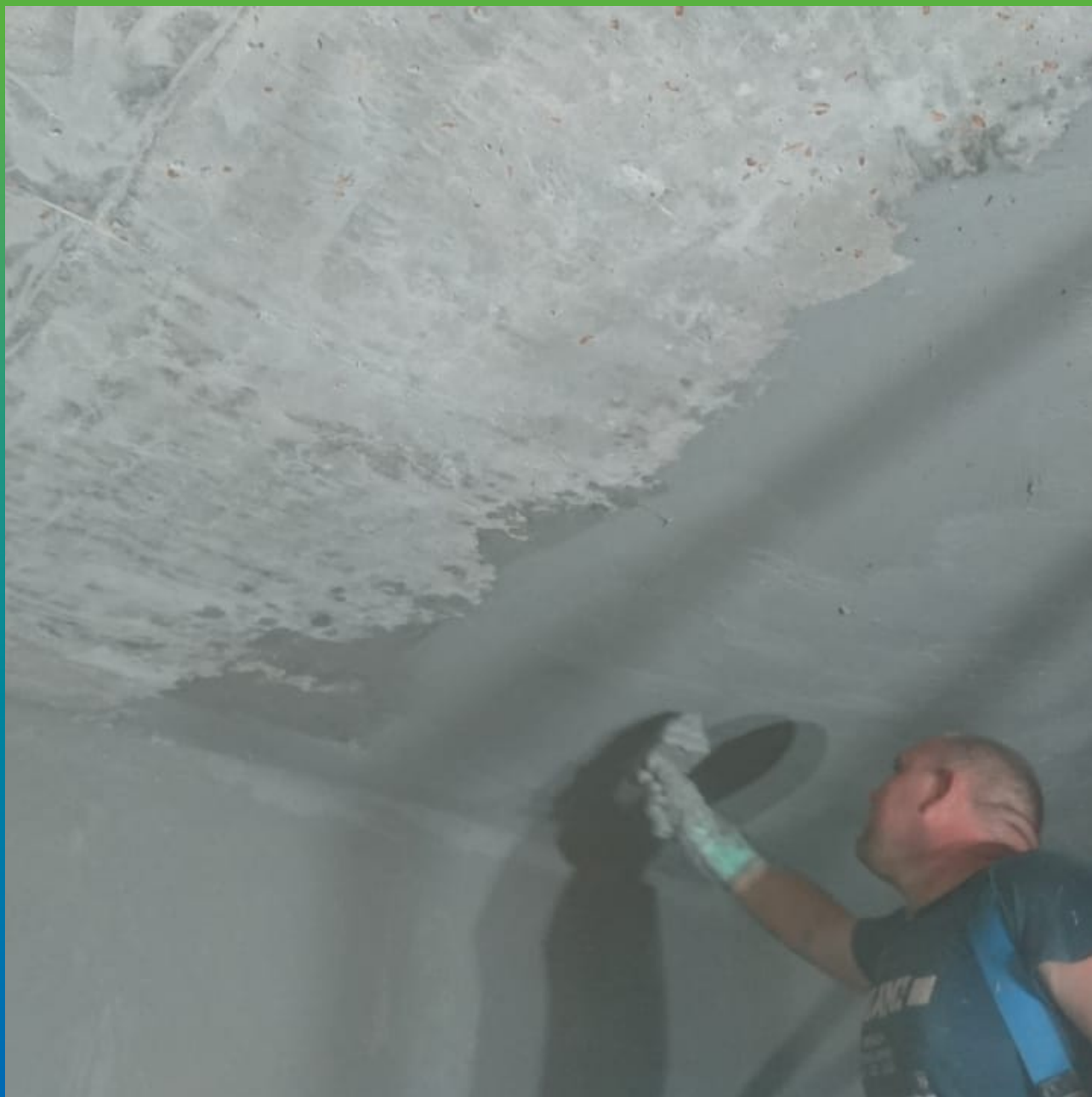
Нанесение Стармекс Сил на потолочную поверхность