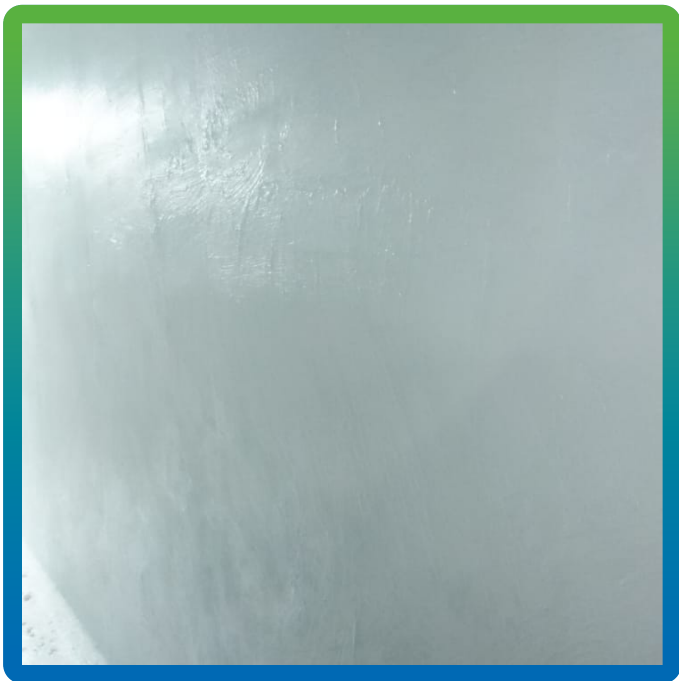
Эластичная гидроизоляция Стармекс Сил Флекс на стенах