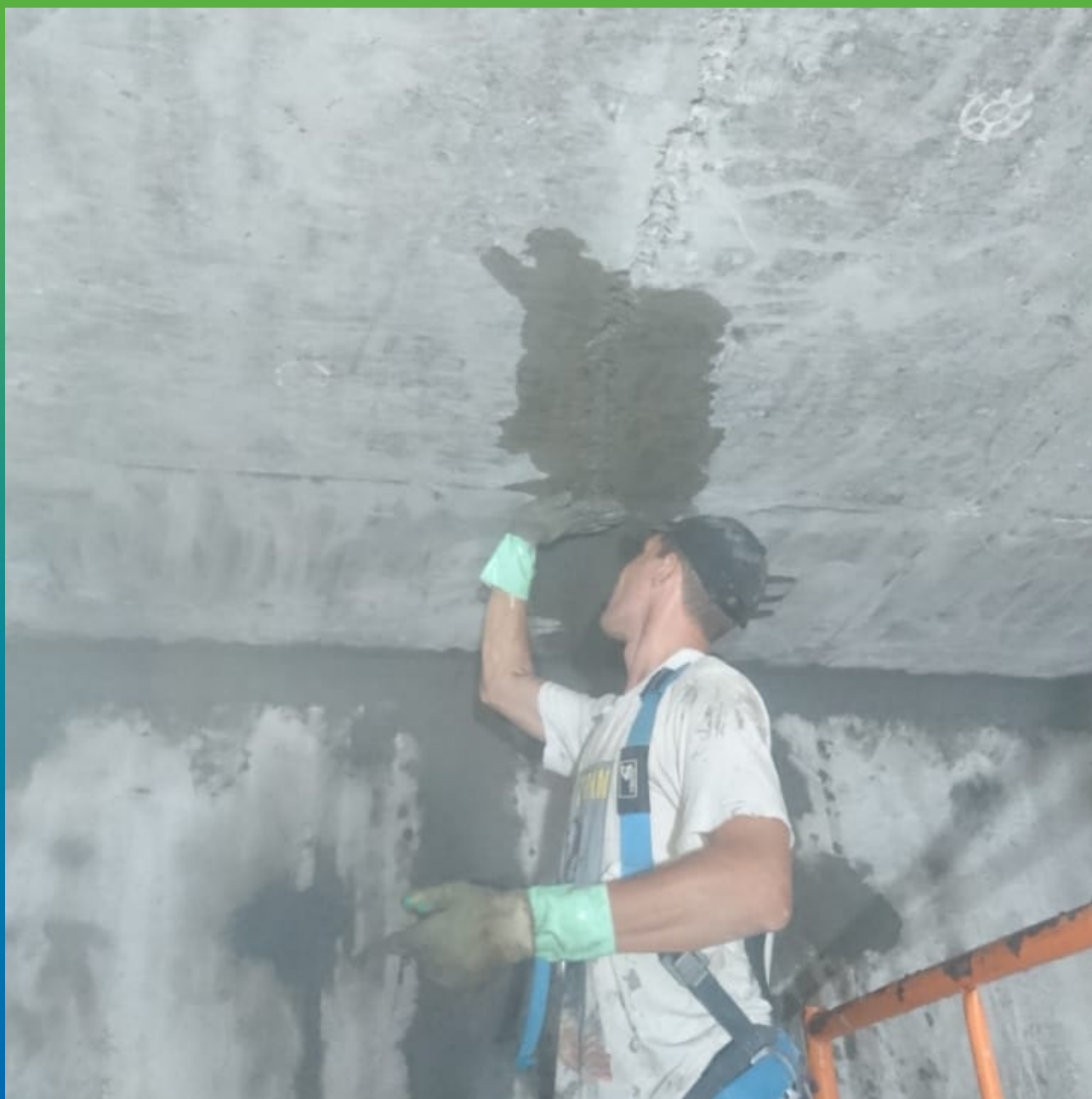
Чеканка расшитых трещин рем. составом Стармекс РмЗ