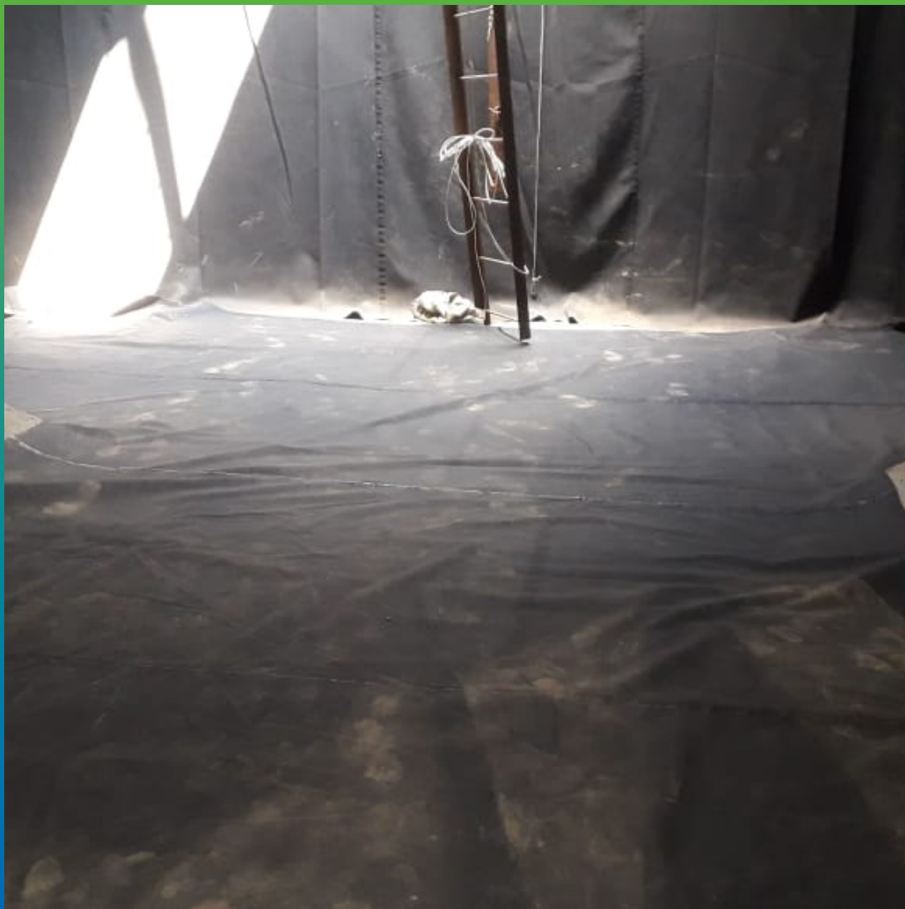
Общий финишный вид