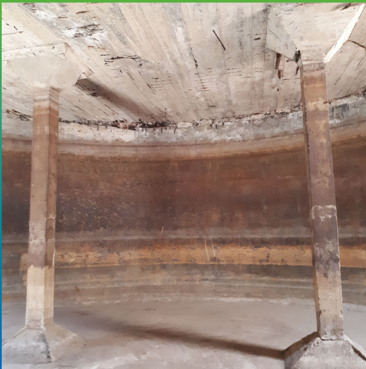
Вид резервуара до ремонта