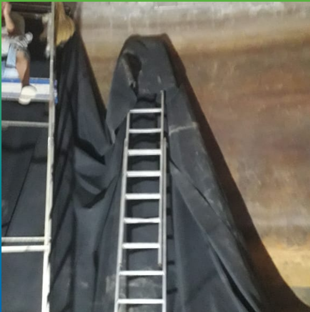
Начало монтажа цельносваренного полотна ЭПДМ по периметру стен