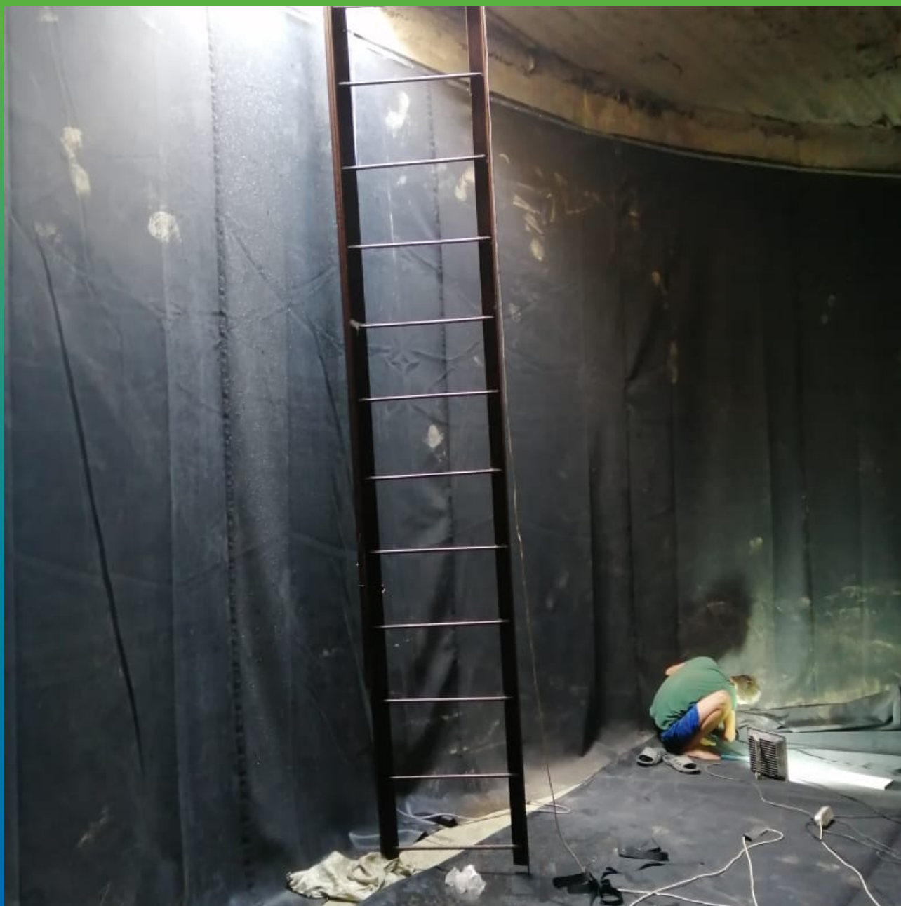
Процесс сварки с помощью ленты Термобонд полотна основания с полотном стены