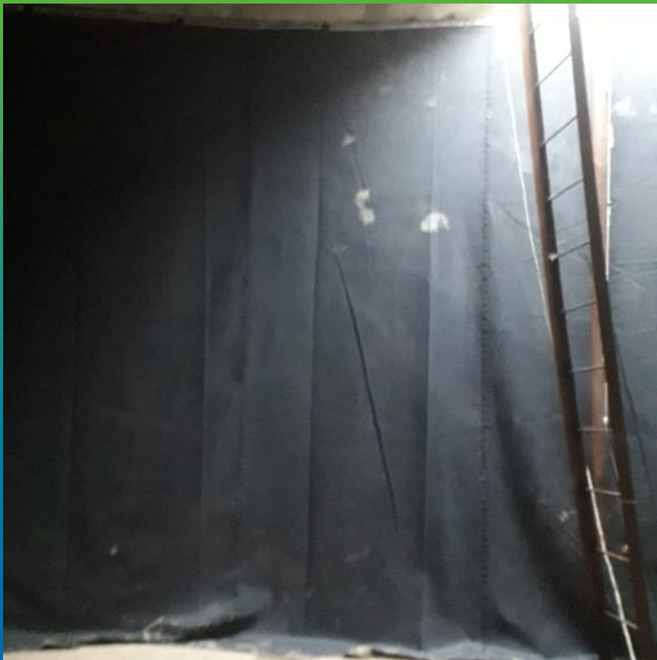
Закрепленное полотно ЭПДМ по периметру стены