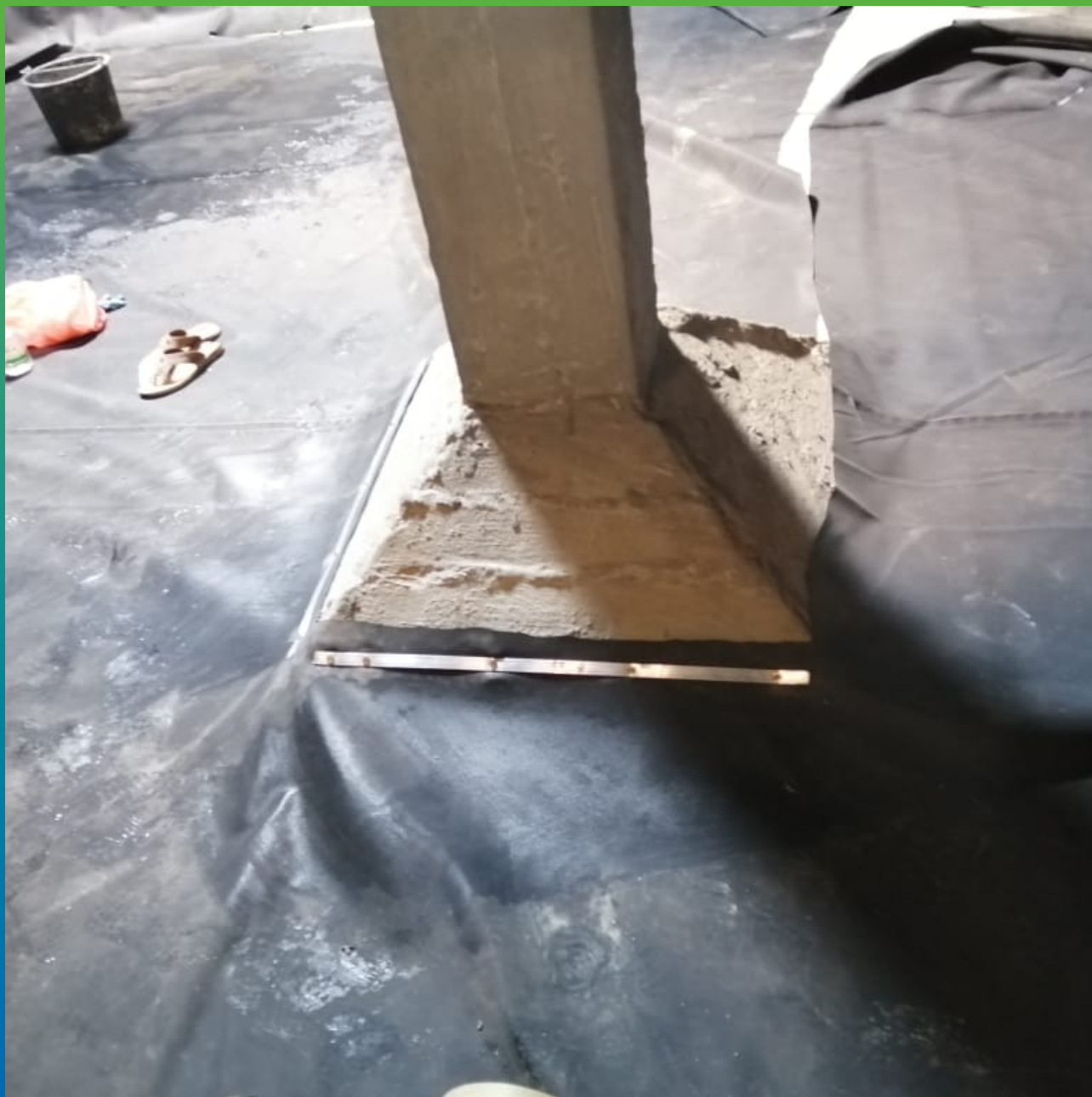
Герметизация по периметру колонны