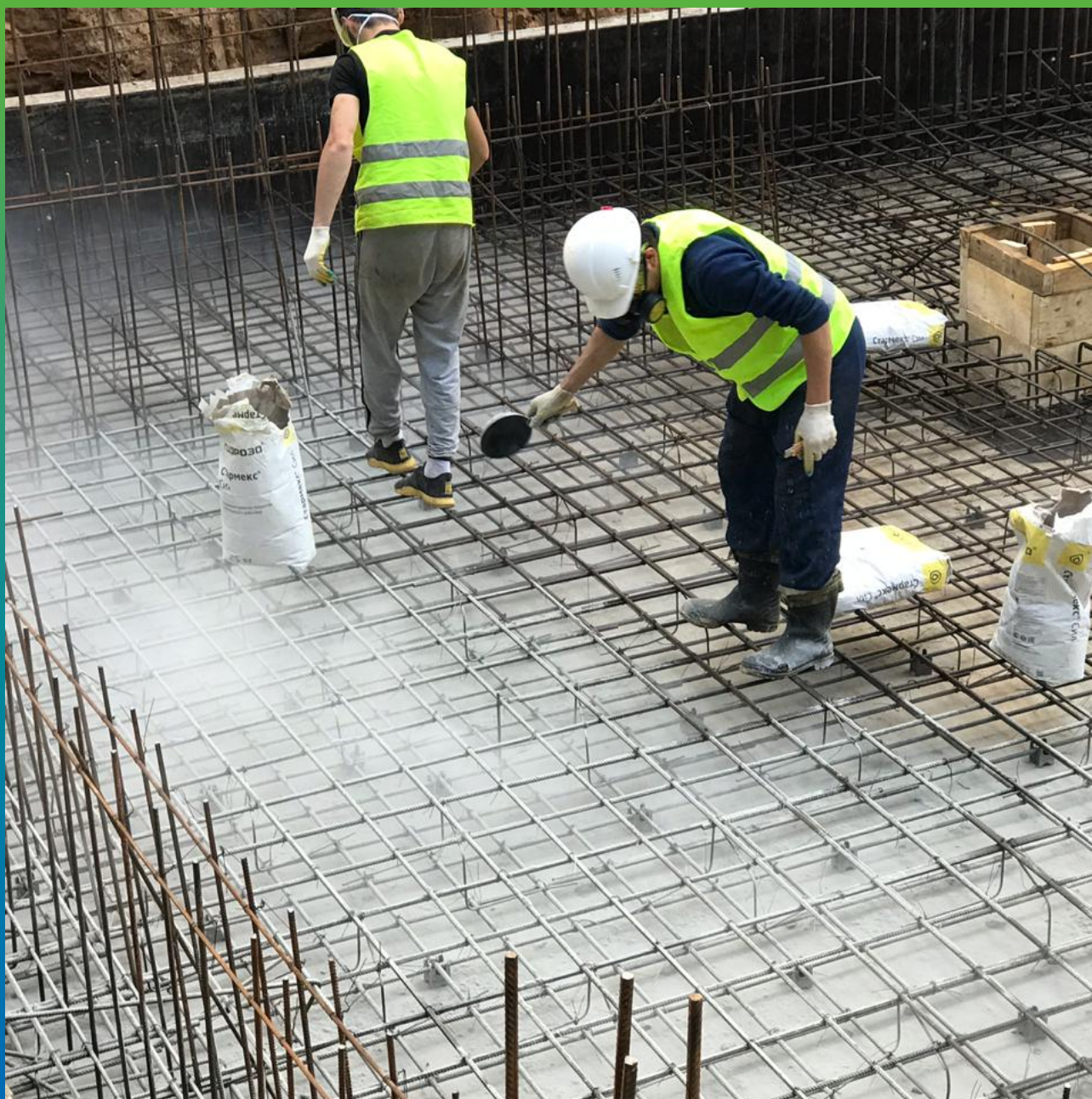
Гидроизоляция плиты основания Стармекс Сил методом просыпка