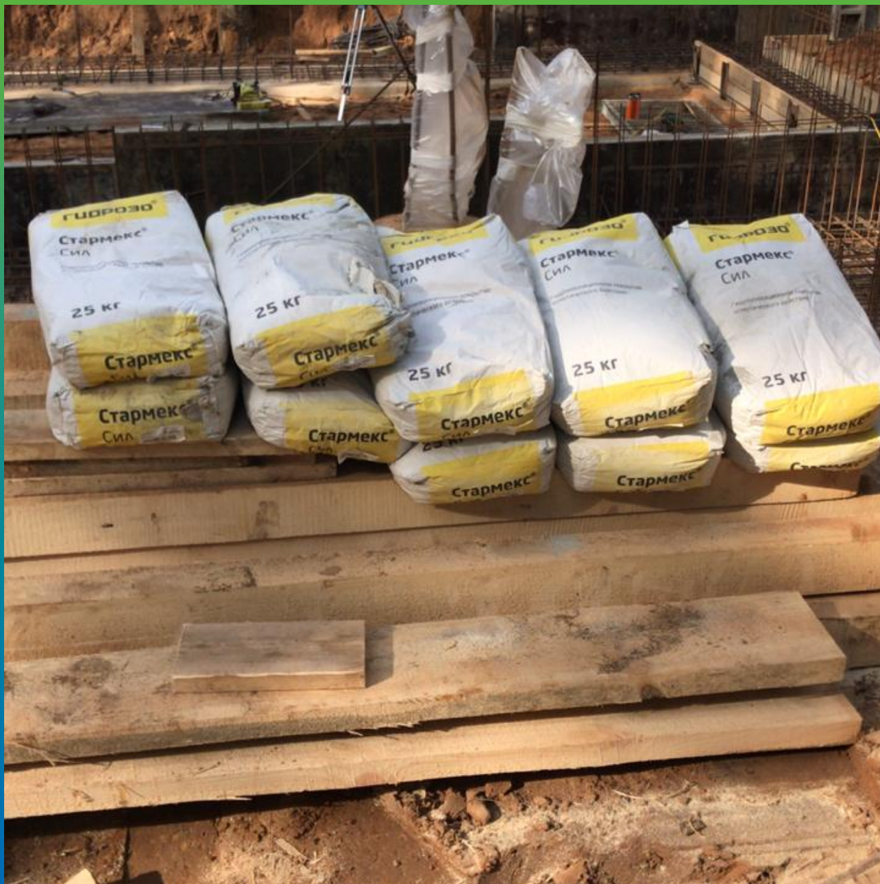
Гидроизоляционный состав Стармекс Сил