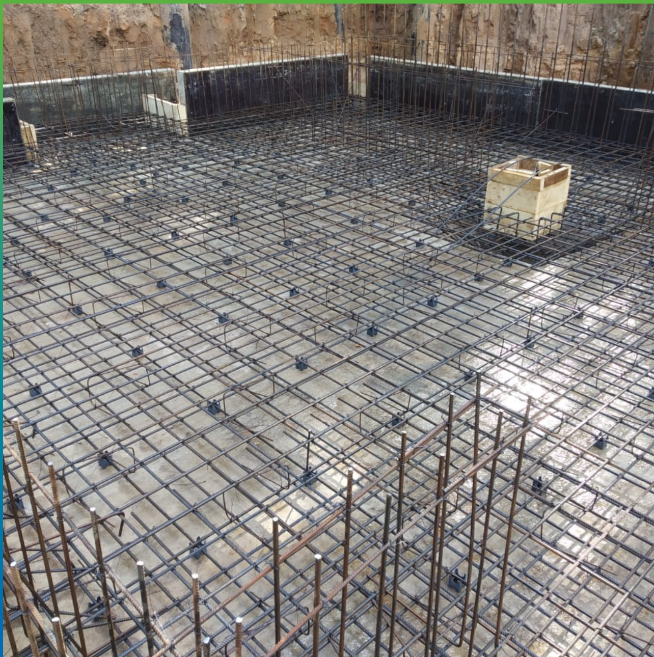
Подготовленное основание под гидроизоляцию.