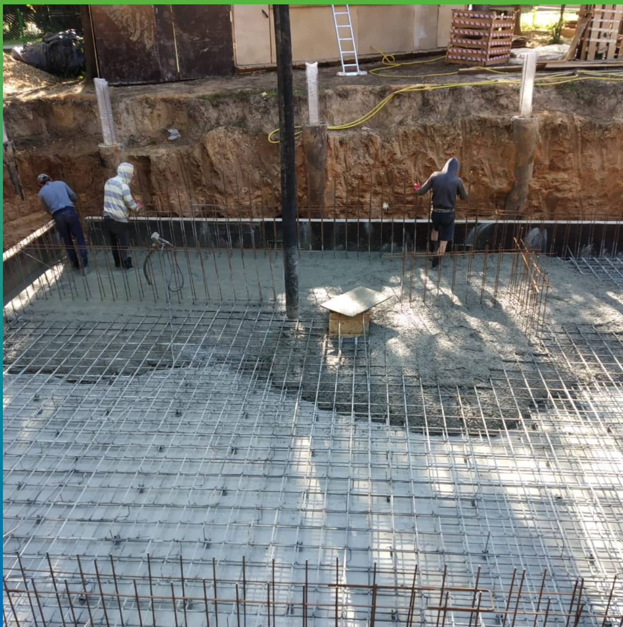
Заливка бетона на гидроизоляционный слой