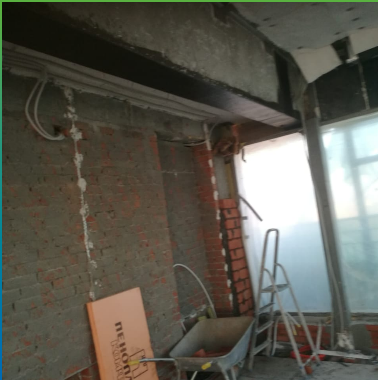
Усиление в продольном направлении.