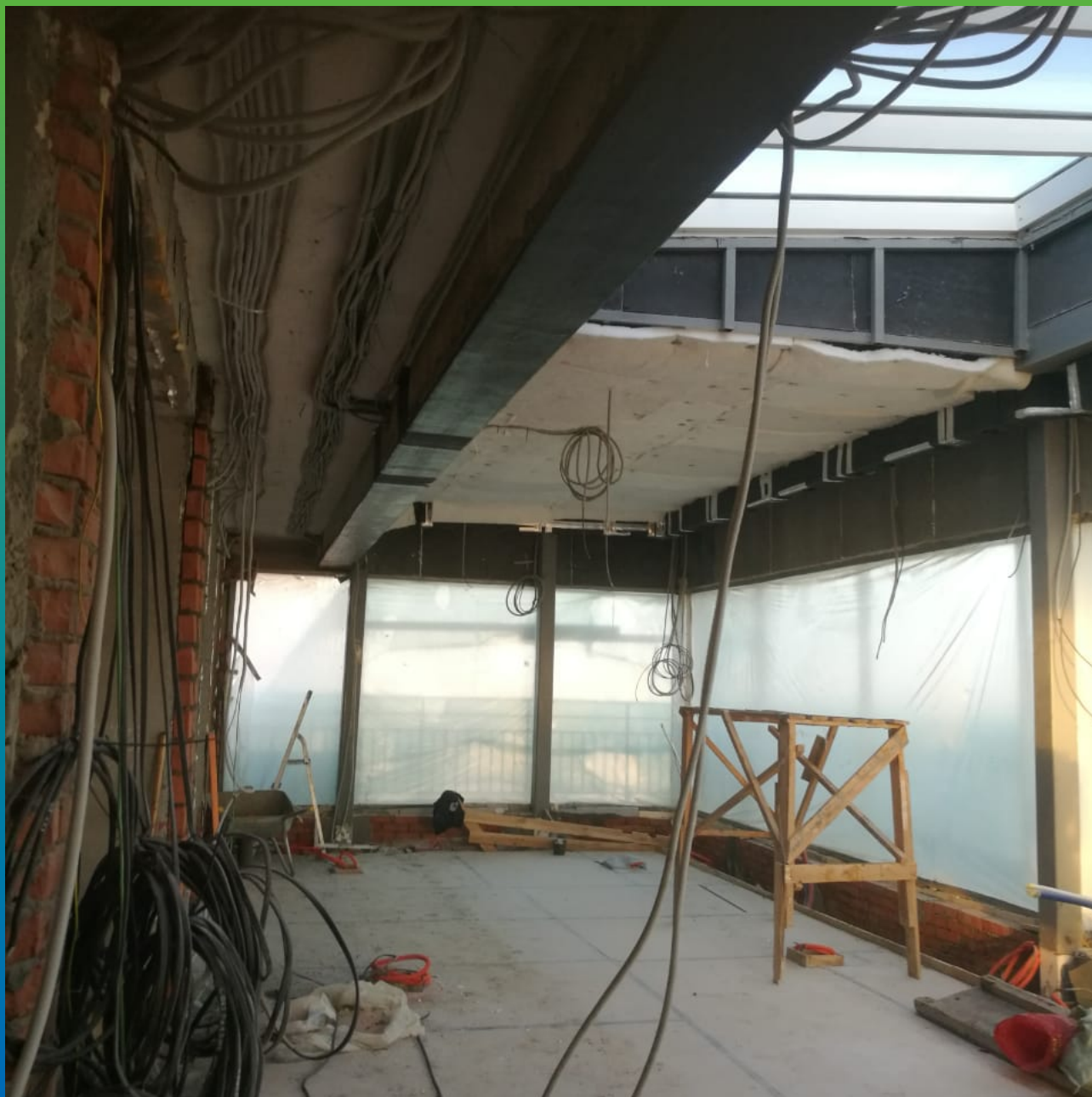
Усиление в продольном направлении.