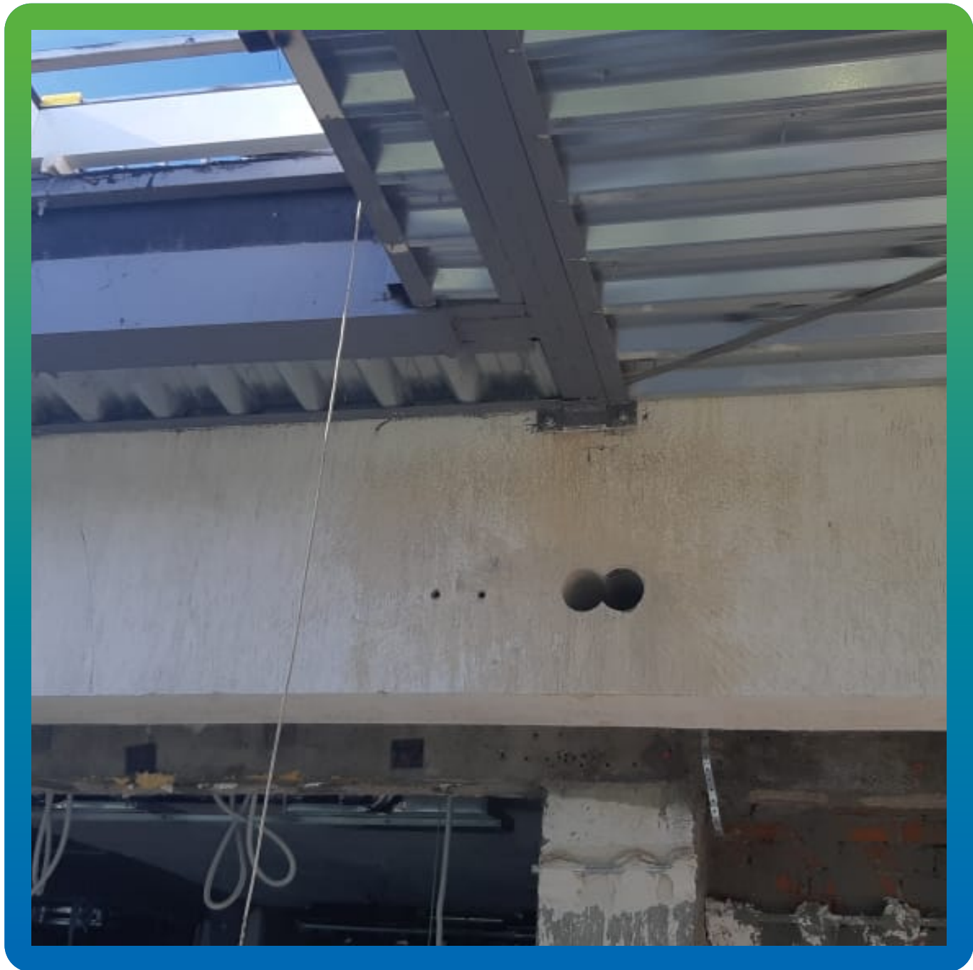
В несущей балке вырублены отверстия под ввод коммуникаций.