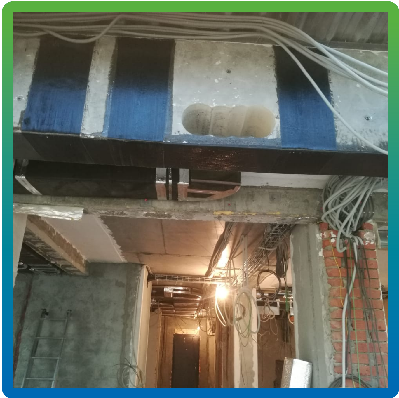
Усиление в поперечном направлении.