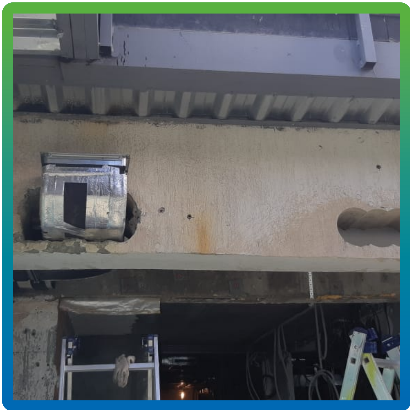
В несущей балке вырублены отверстия под ввод коммуникаций.