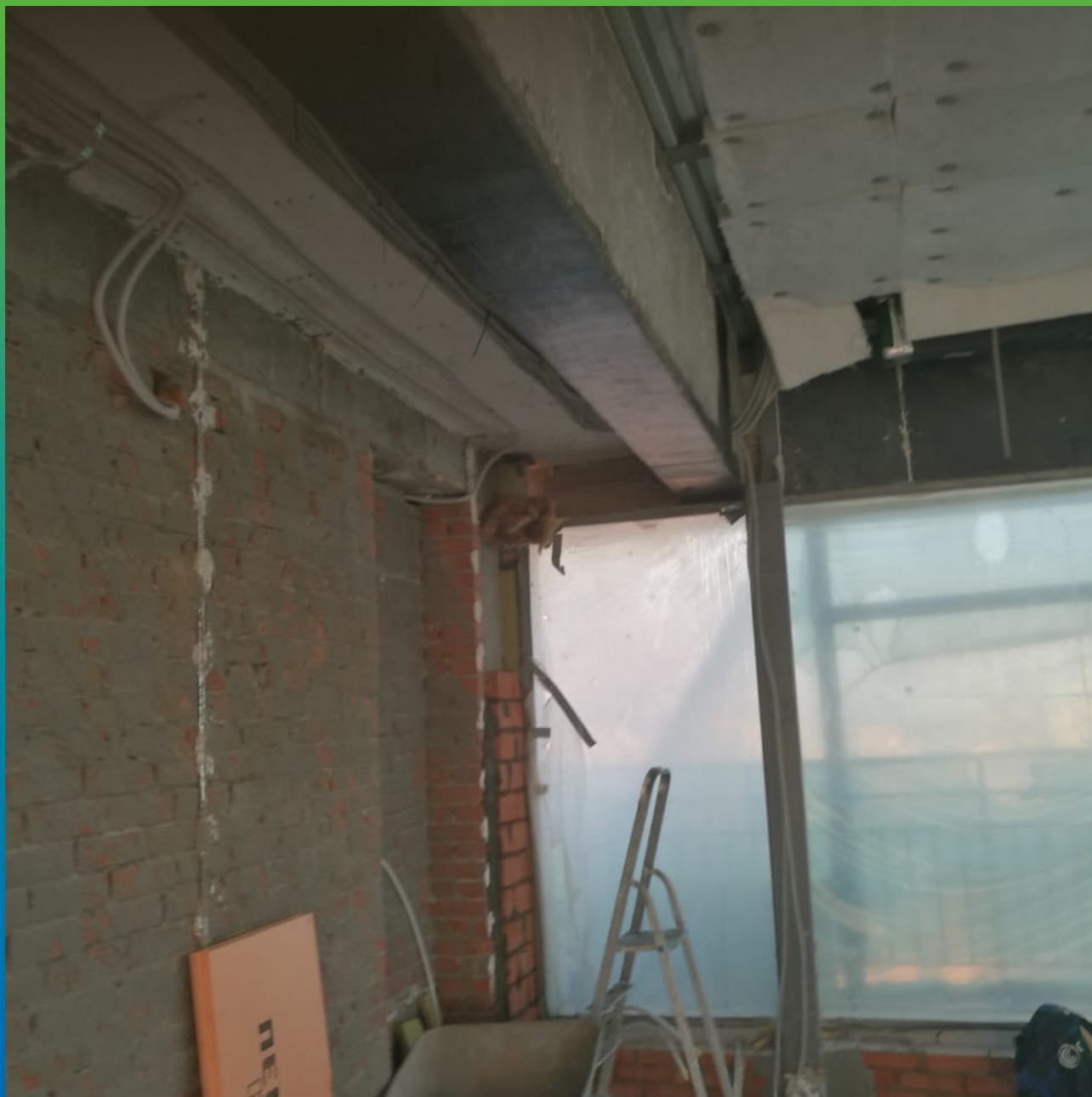
Усиление в продольном направлении.