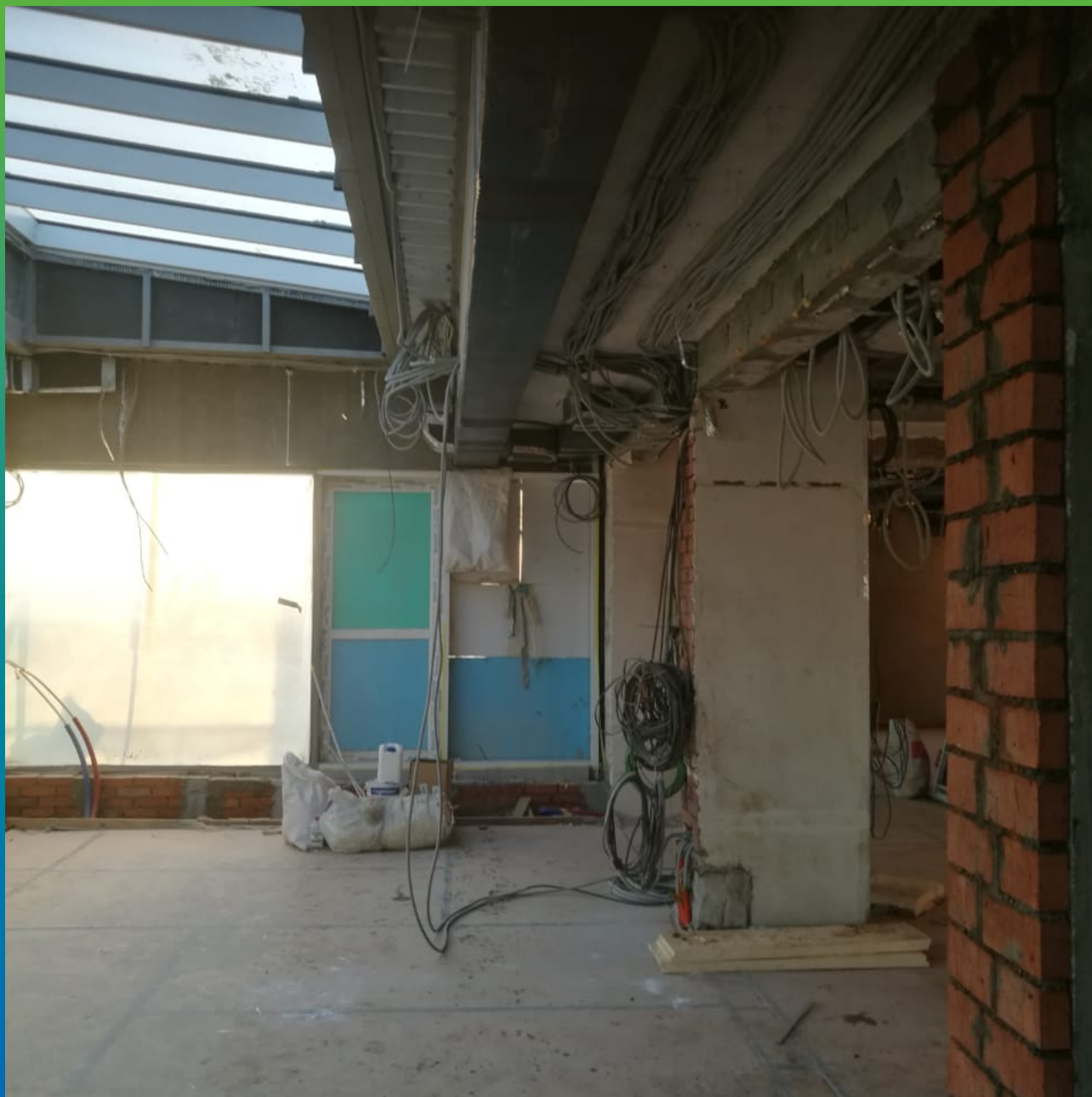
Усиление в продольном направлении.