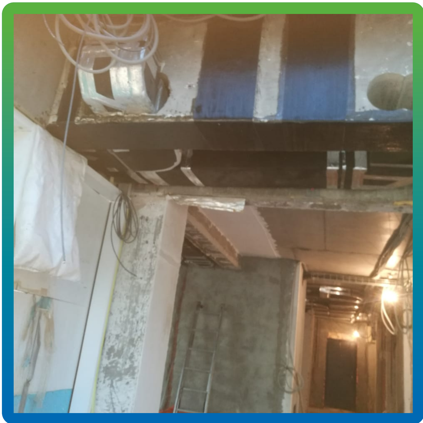
Усиление в поперечном направлении.