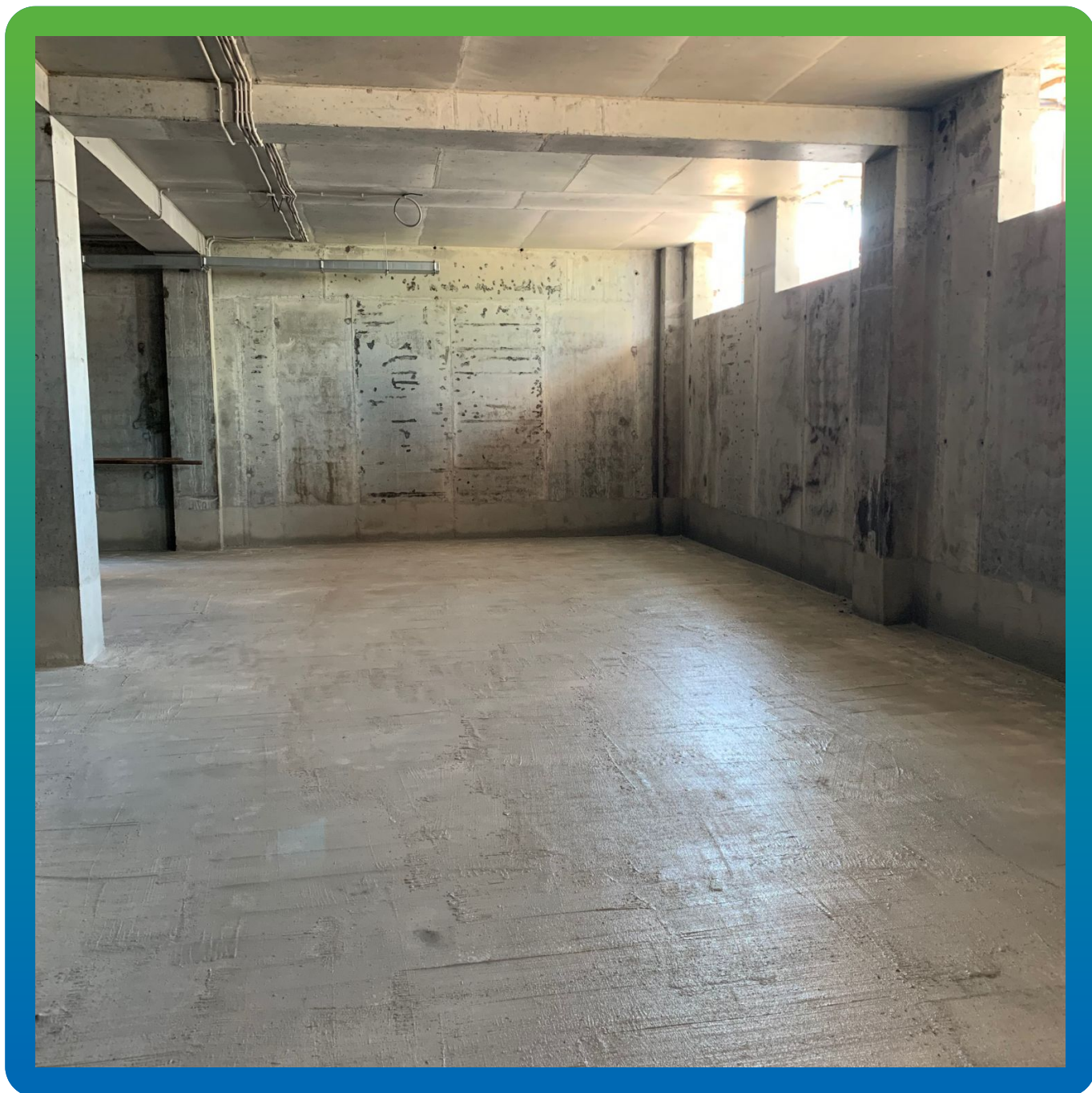
Стармекс Сил, нанесенный в 2 слоя