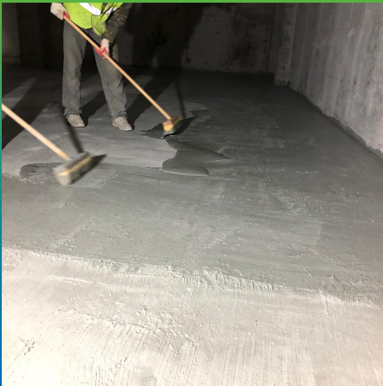
Нанесение состава Стармекс Сил на фундаментную плиту