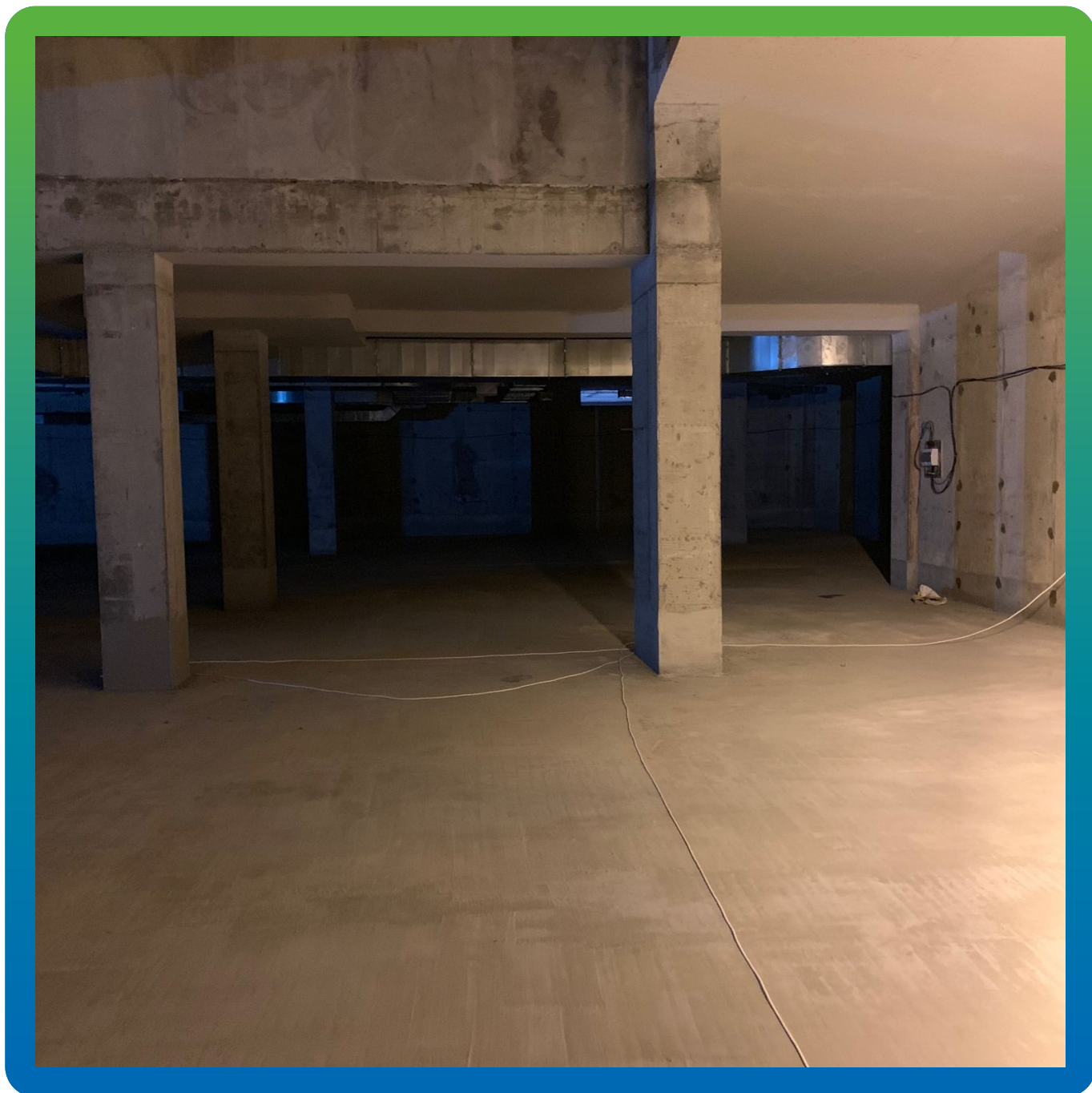
Стармекс Сил, нанесенный в 2 слоя