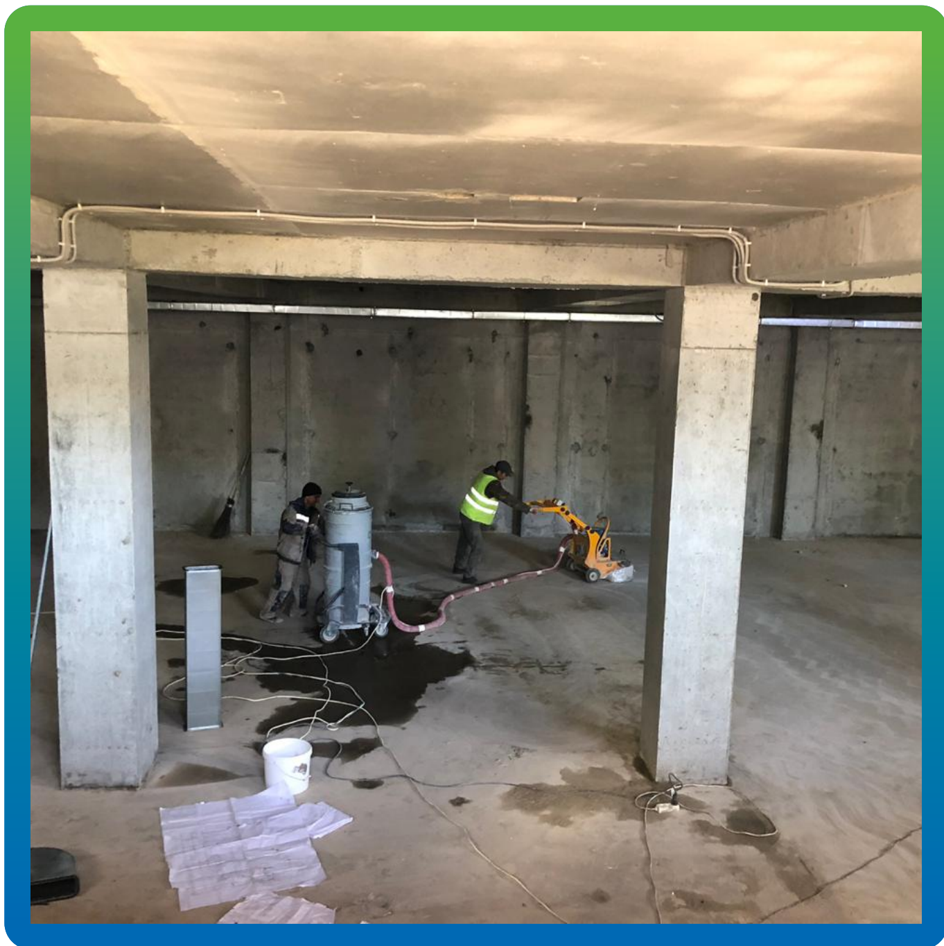
Подготовка основания под нанесение гидроизоляции