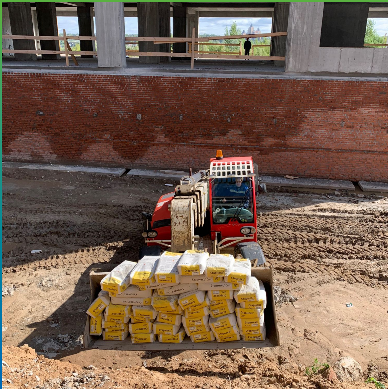
Доставка материала на объект