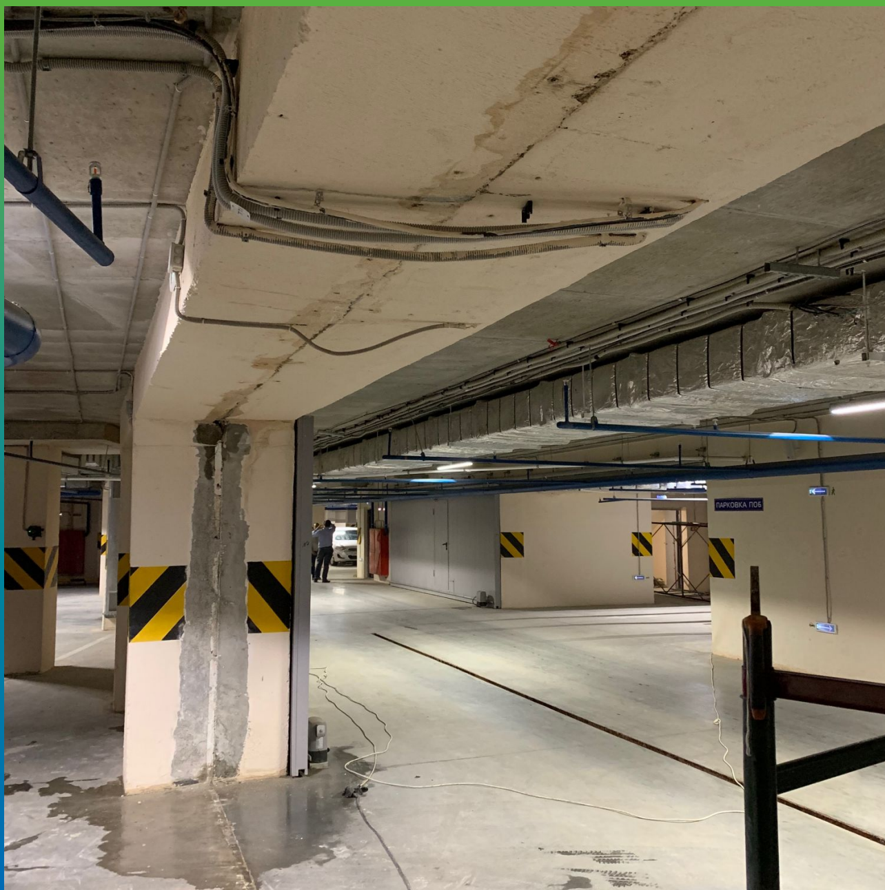
Деформационные швы до проведения работ по водоотведению и гидроизоляции