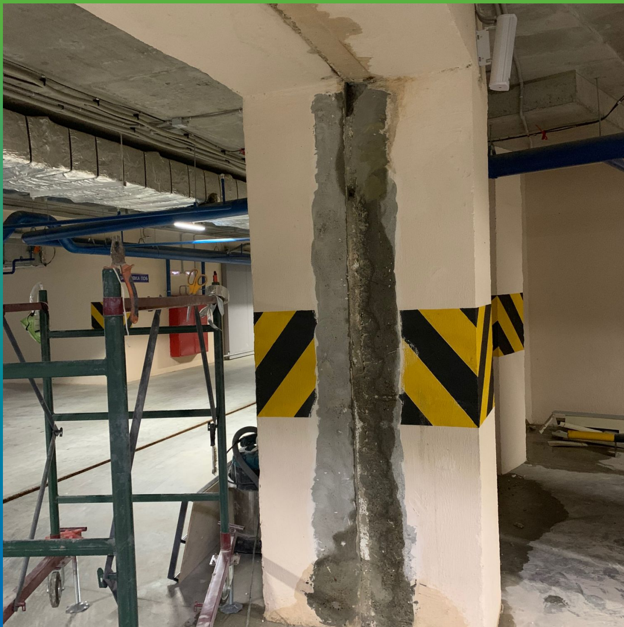
Деформационные швы до проведения работ по водоотведению и гидроизоляции