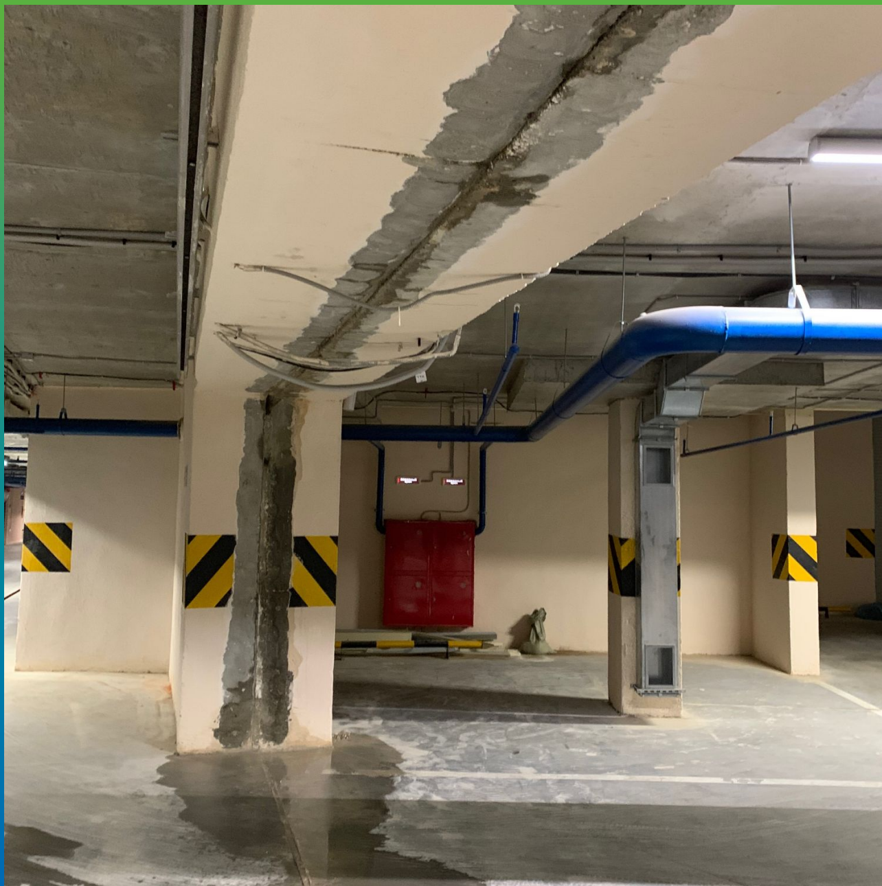
Деформационные швы до проведения работ по водоотведению и гидроизоляции