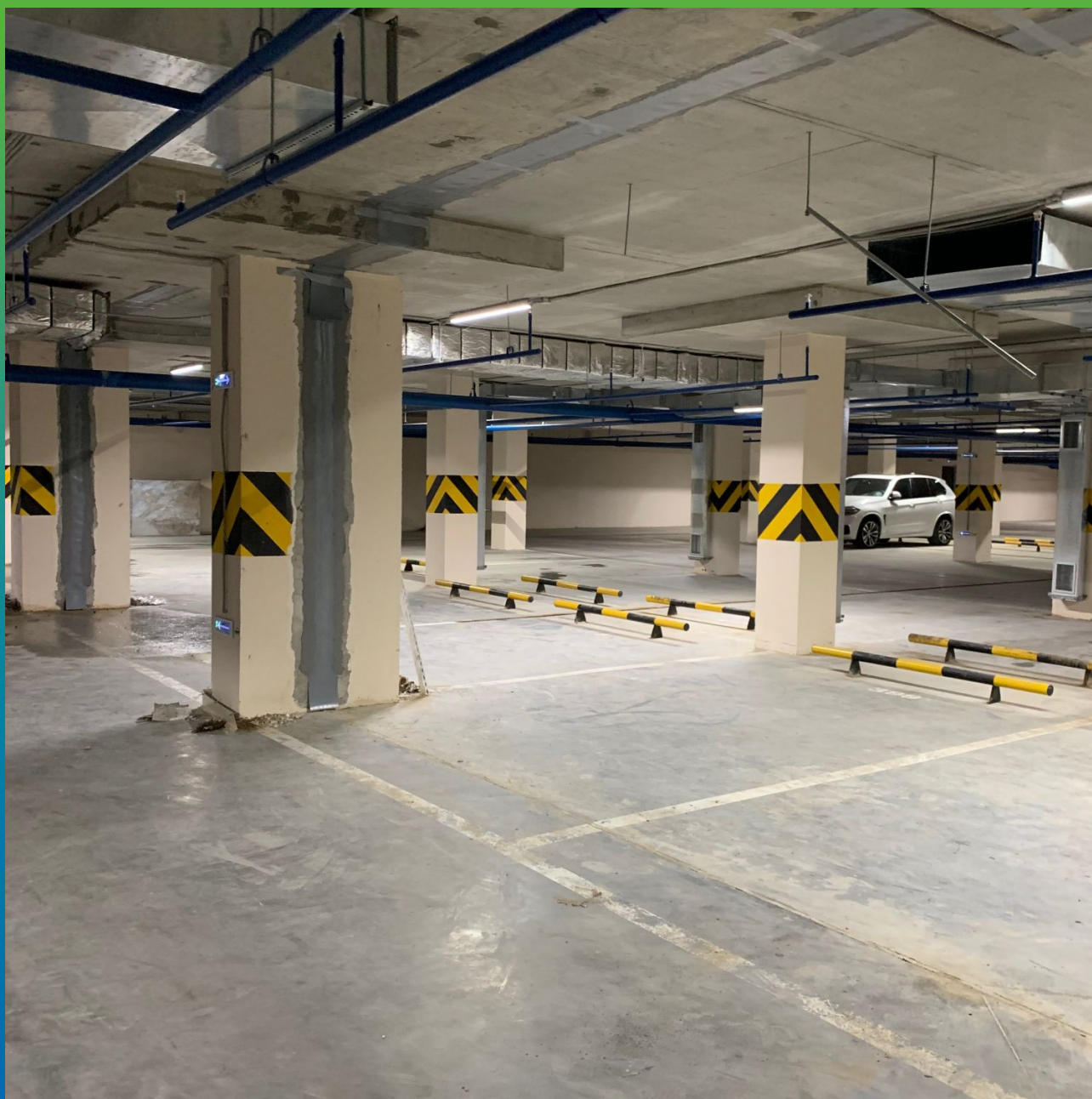
Деформационные швы после проведения работ