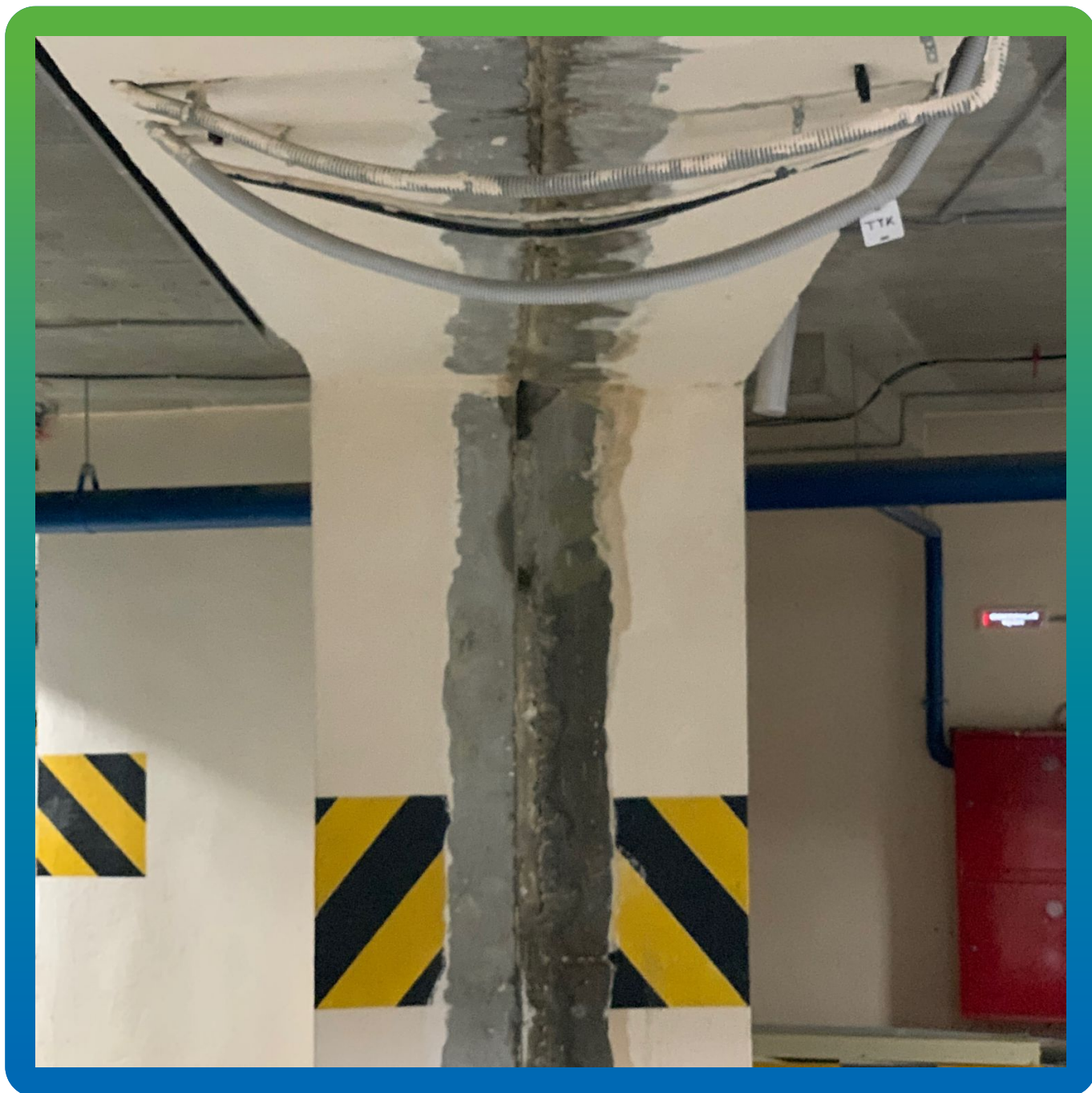
Деформационные швы до проведения работ по водоотведению и гидроизоляции