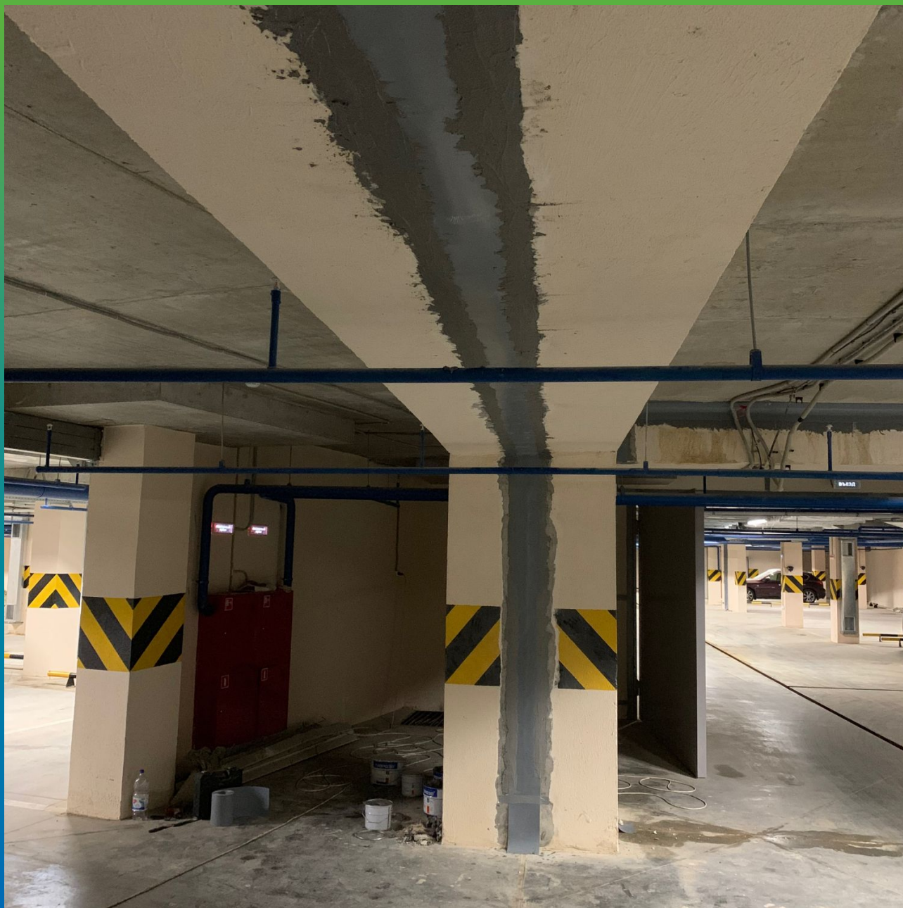
Деформационные швы после проведения работ