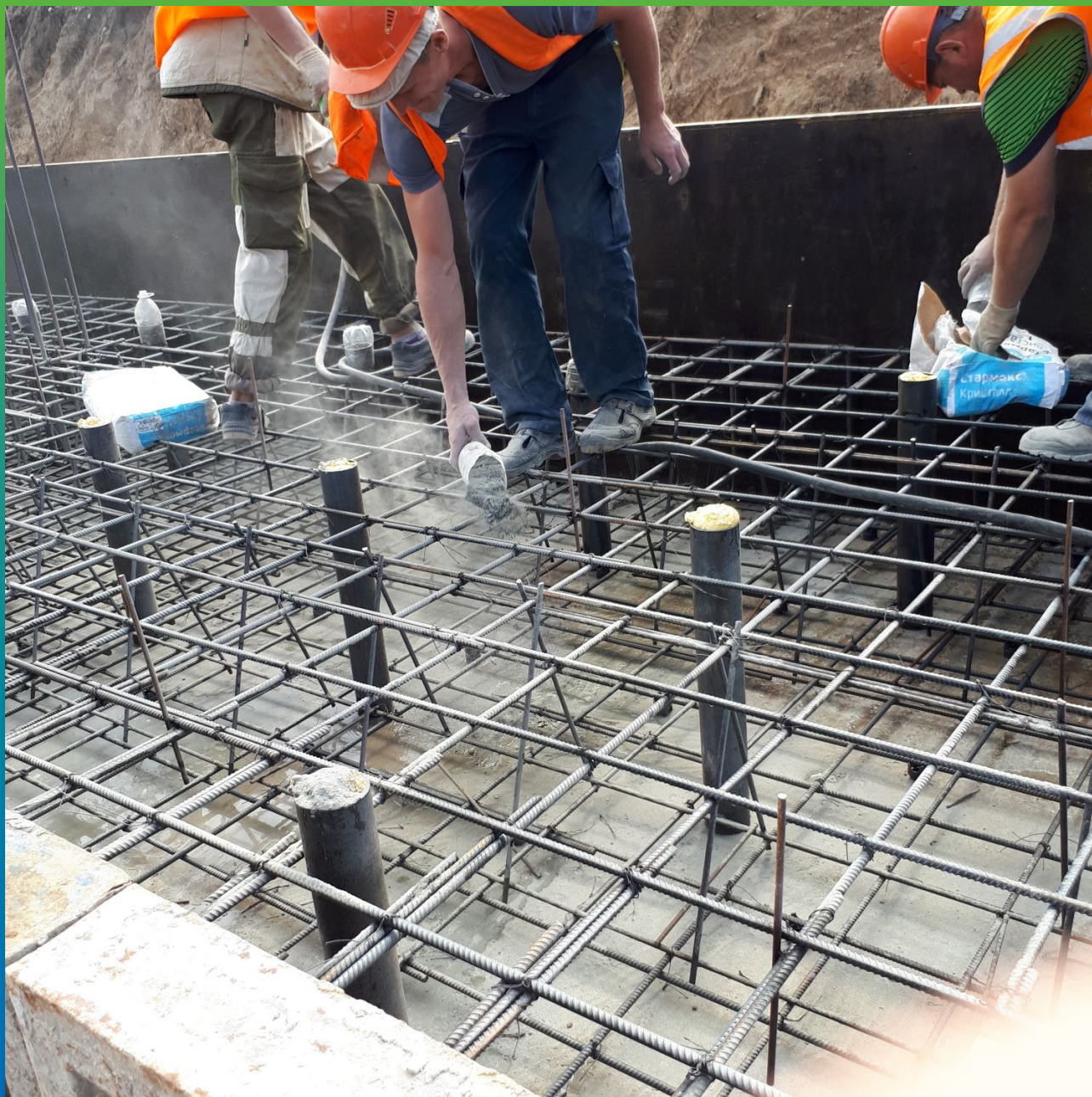
Просыпка сухой смеси Стармакс Кристалл по бетонной подготовке