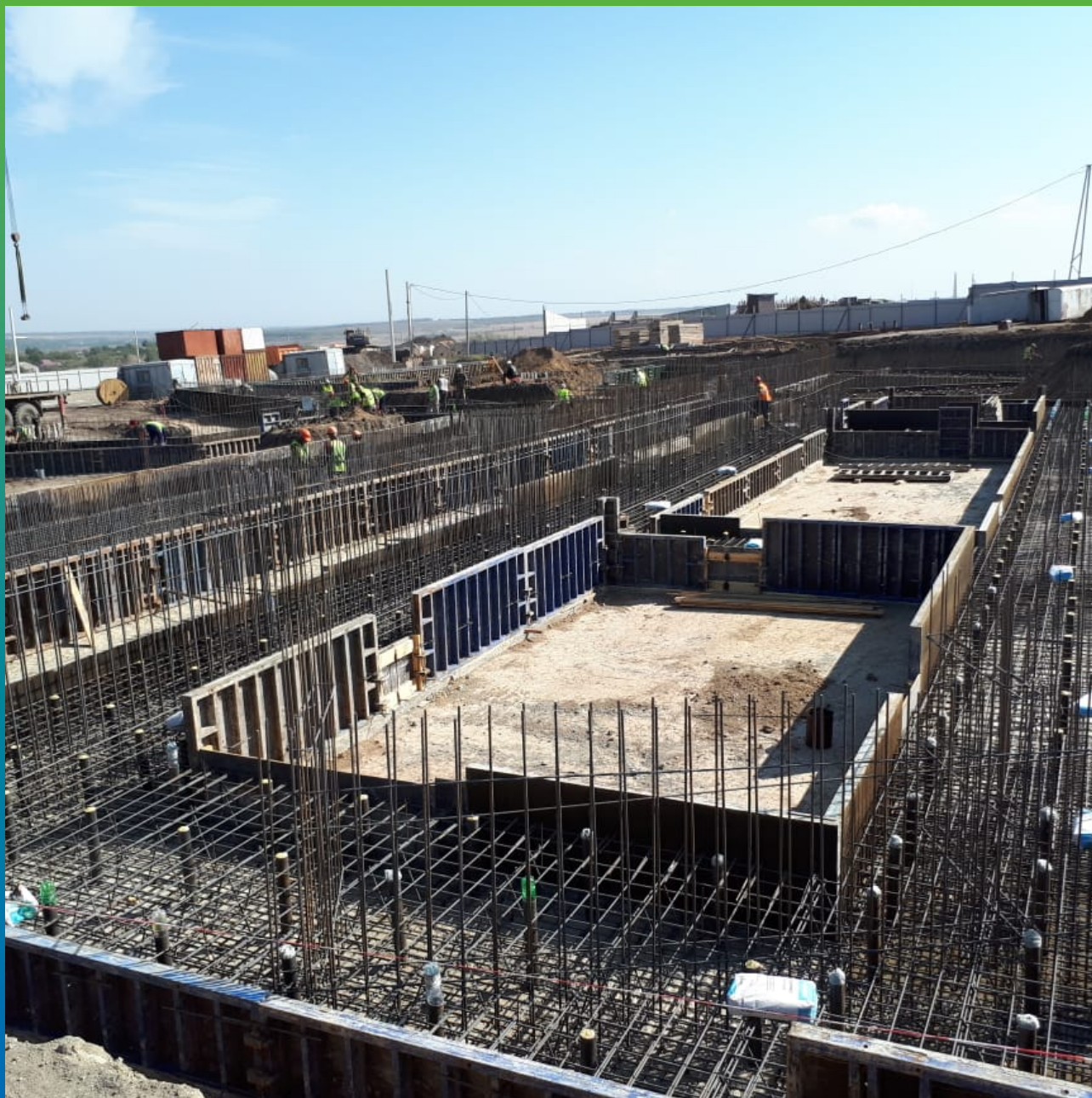
Подготовленный материал Гидрозо на объекте