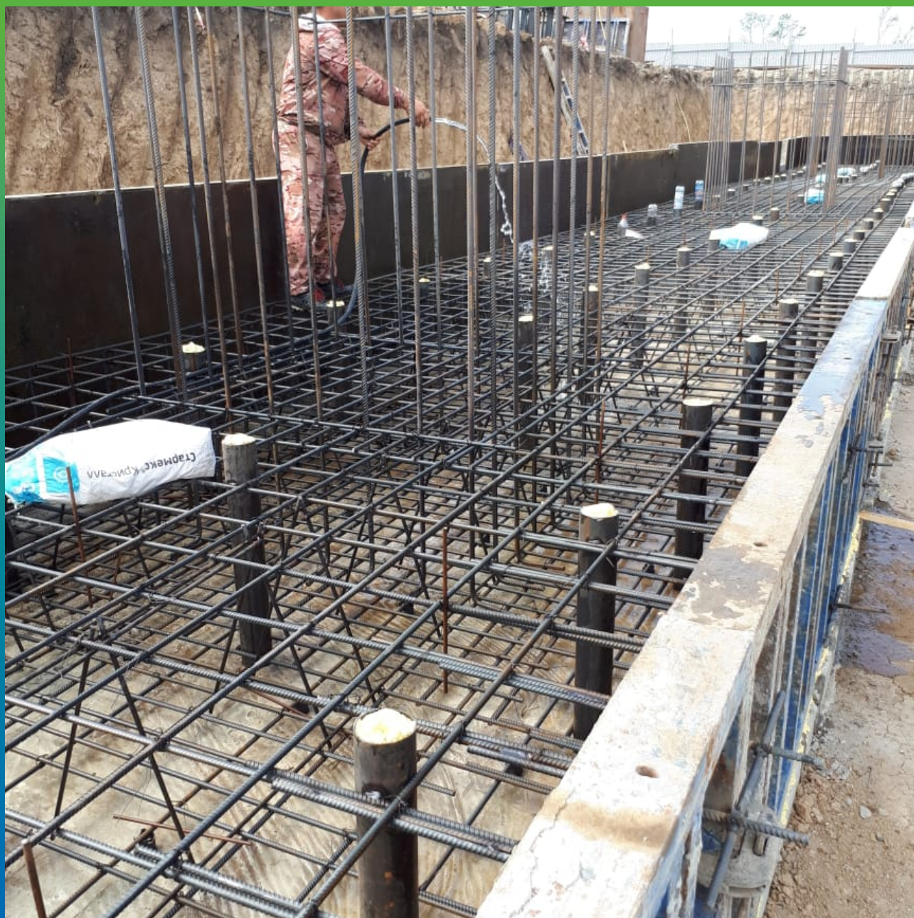
Увлажнение бетонной подготовки перед просыпкой