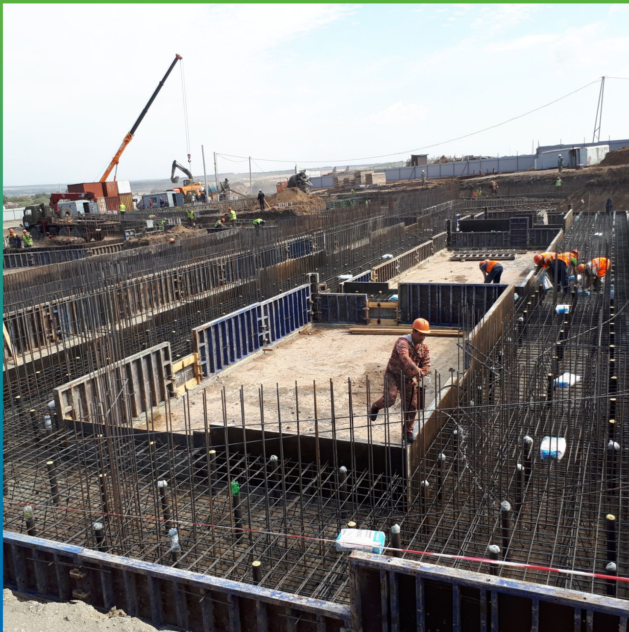
Гидроизоляция методом просыпки по бетонной подготовке