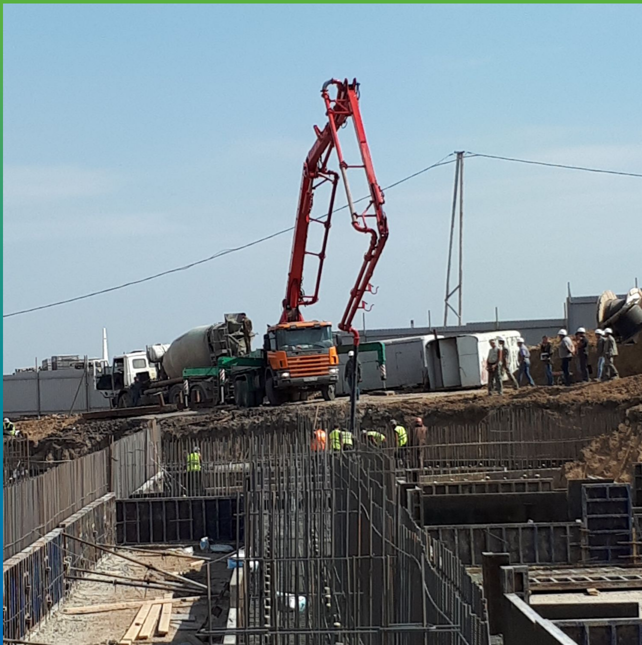
Заливка бетонной подушки после просыпки по подбетонке Стармекс Кристалл