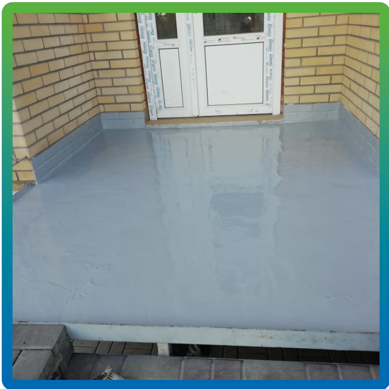
Свежеуложенная мастика ДенТоп МС 351 на входную группу.