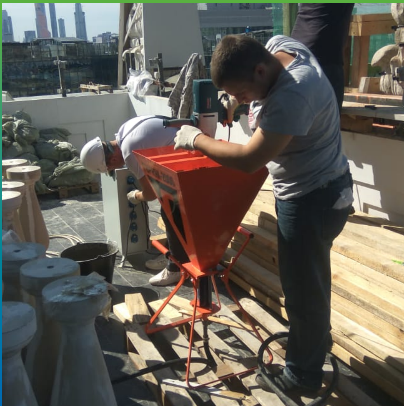
Подготовка инъекционного состава