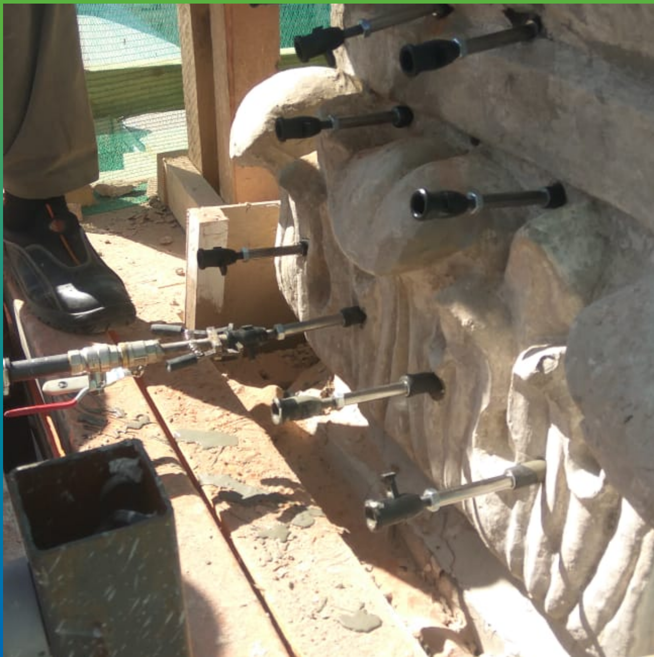
Прокачка инъекционного состава Маноцем Грут