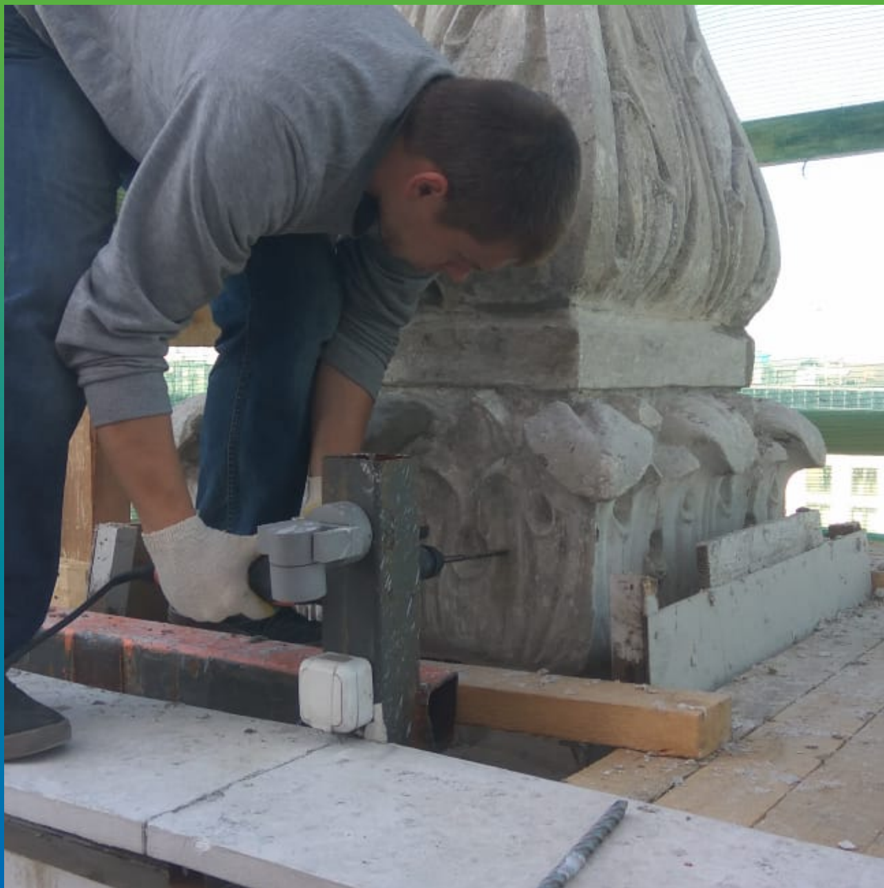
Пробурирование шпуров для адгезионных пакеров