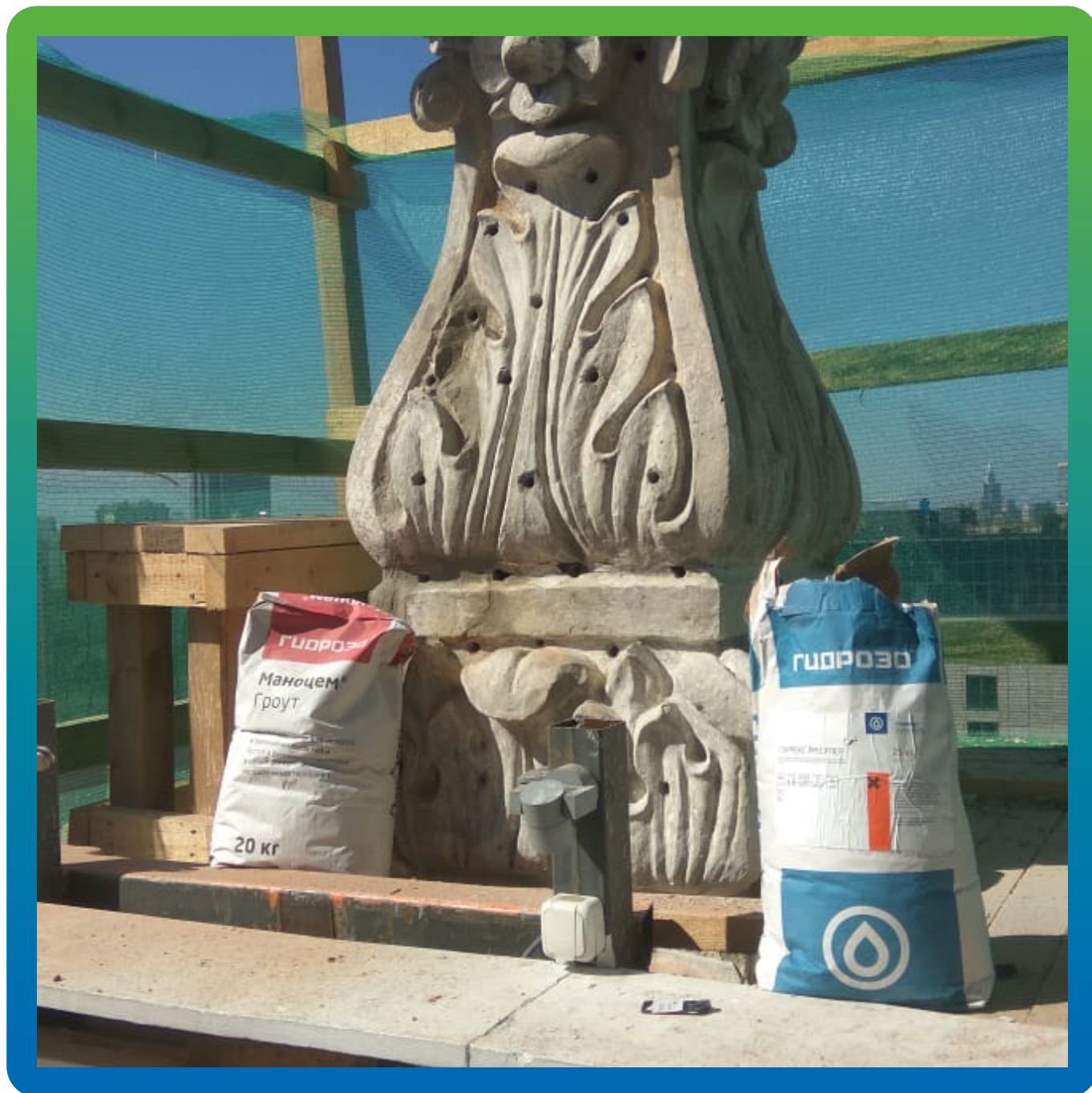
Вид статуи после прокачки Маноцем Грунт