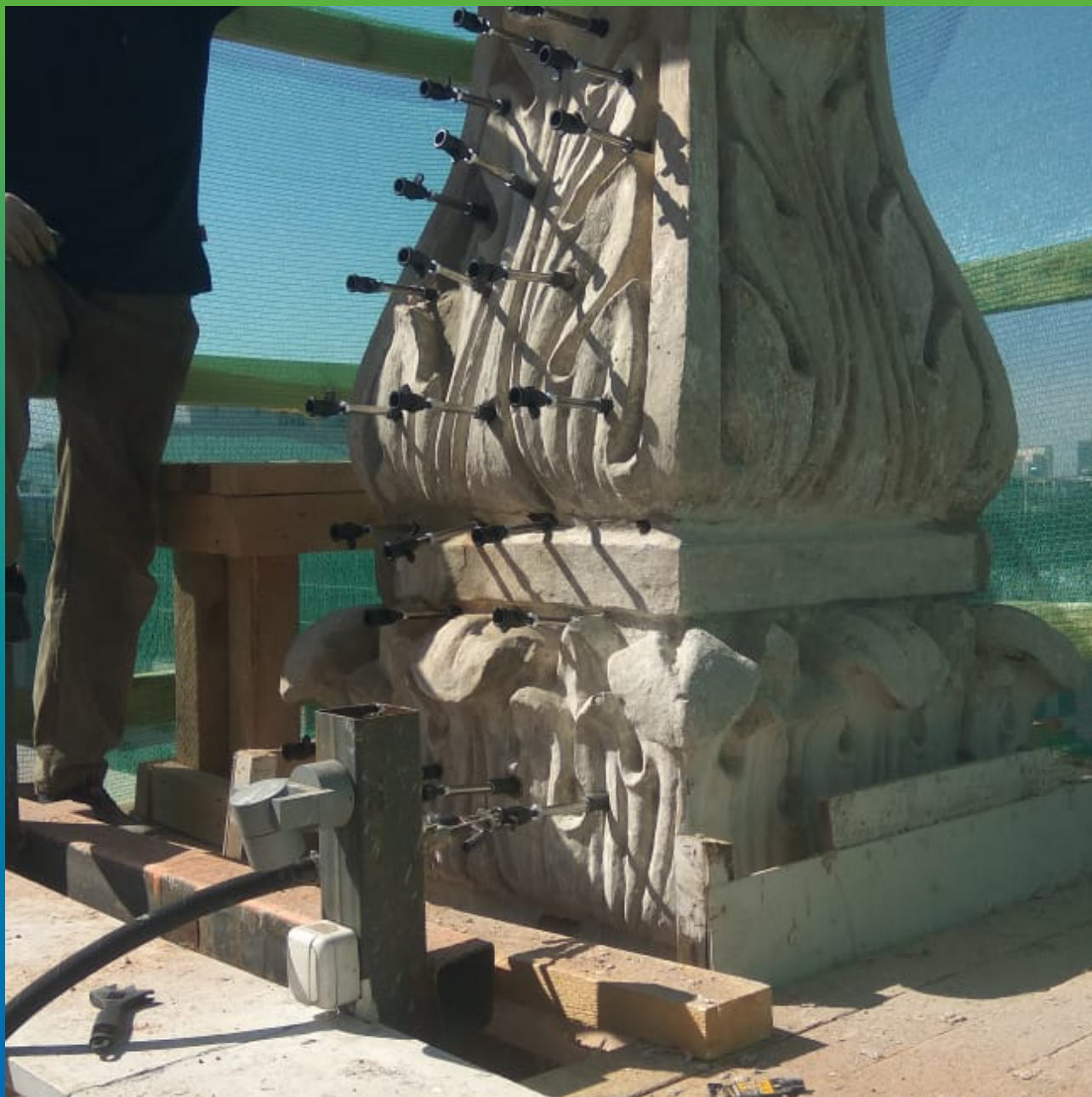
Установка инъекционных пакеров