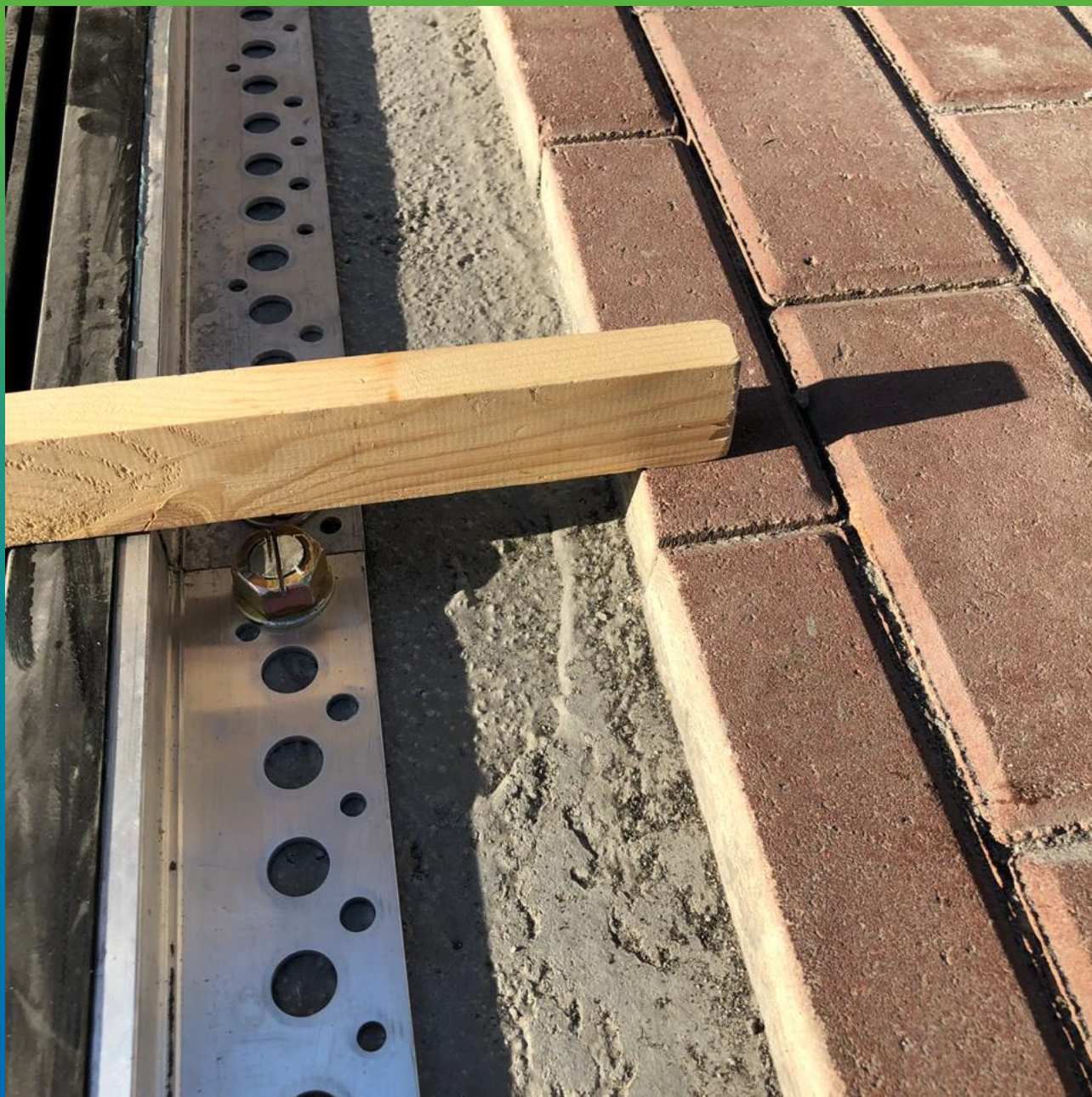
Горизонтальное выравнивание деформационного шва с брусчаткой