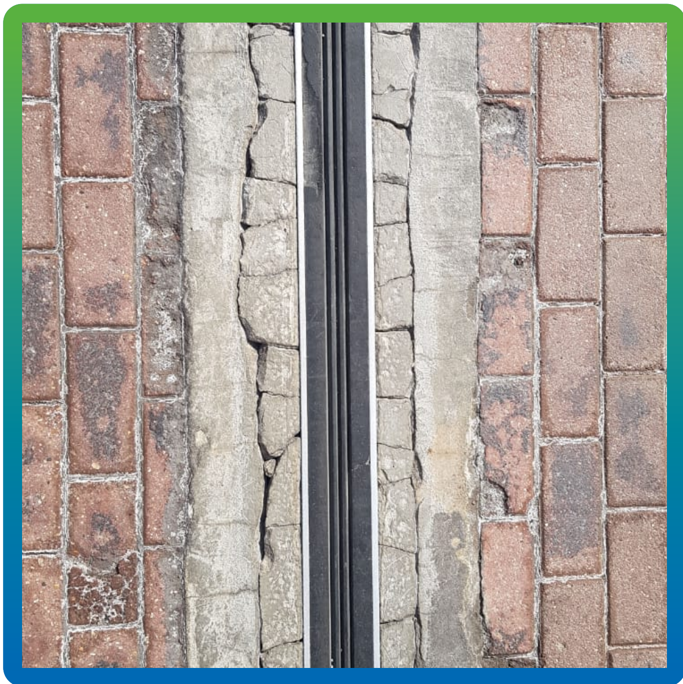
Вид деформационного шва до ремонта