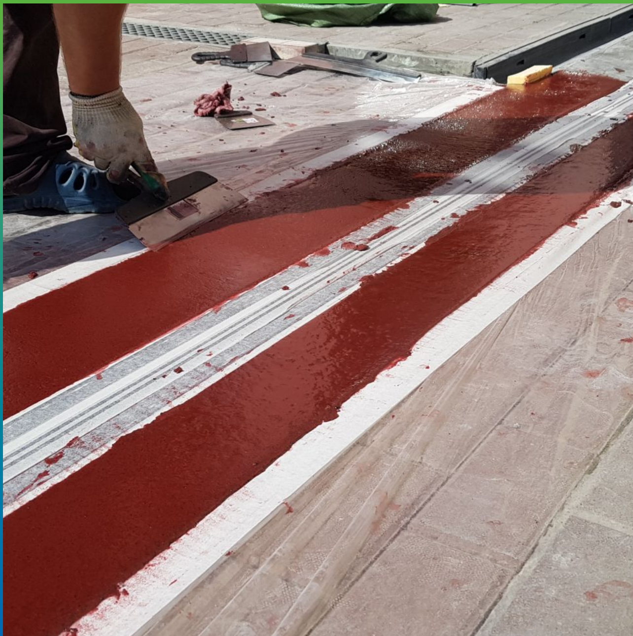
Выравнивание материала шпателем