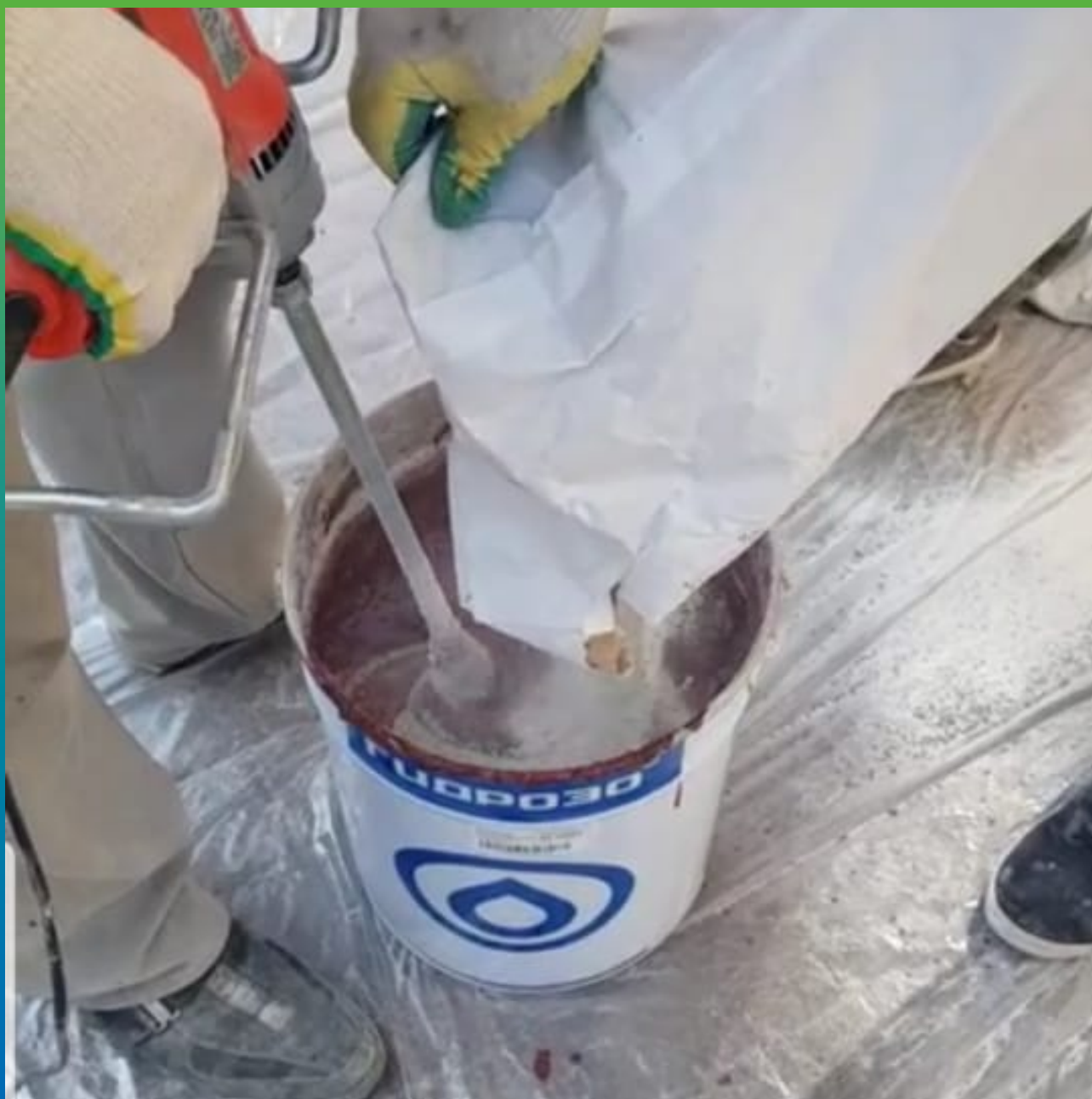
Подготовка состава перед монтажом