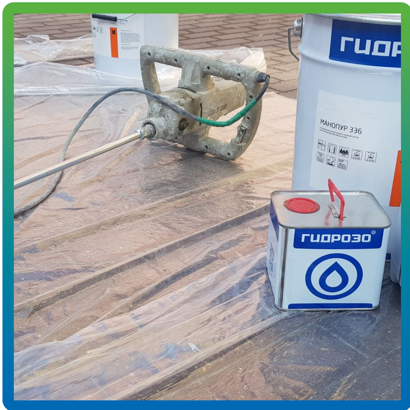
Материал Манопур 336 на объекте