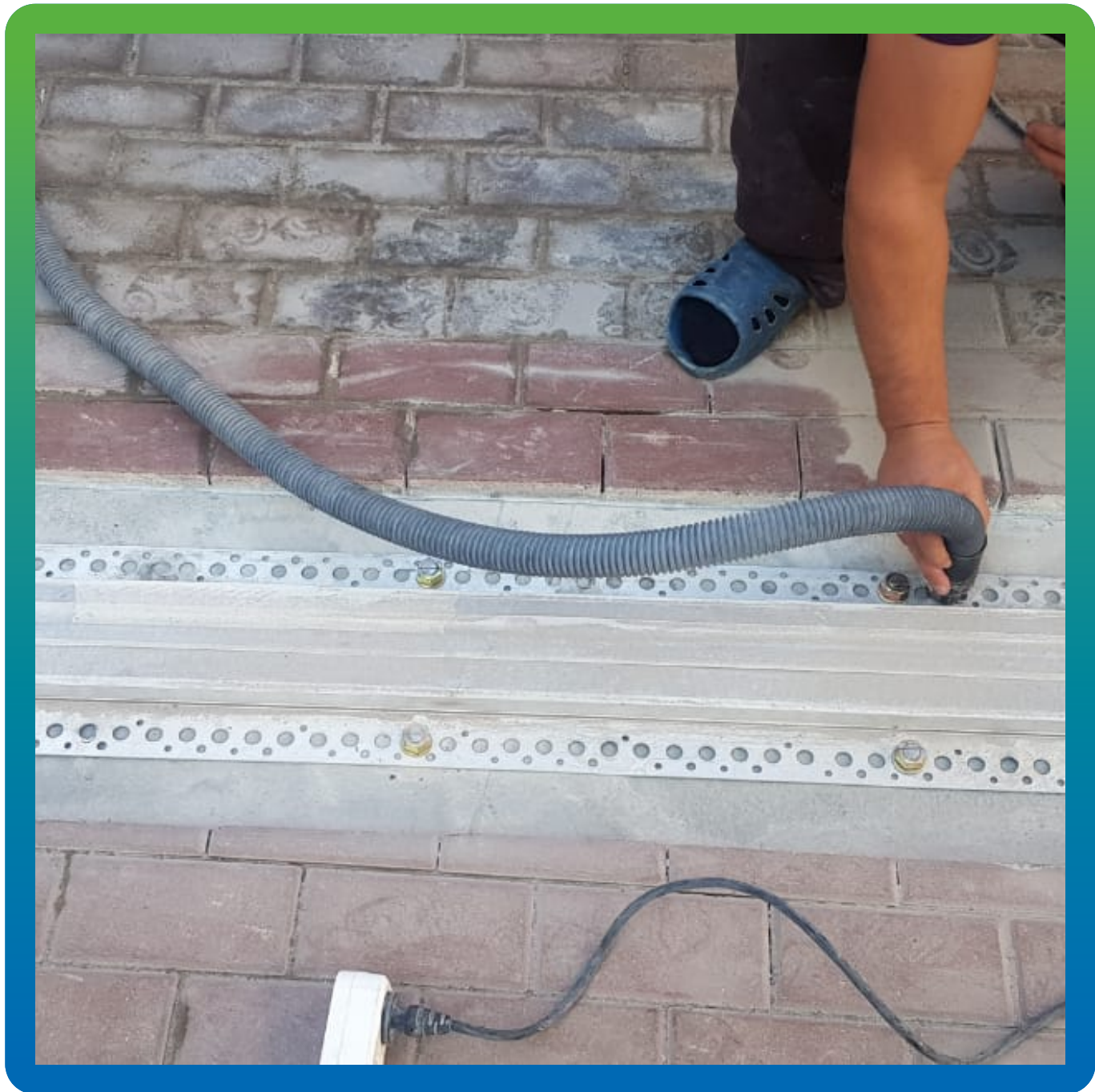
Обеспыливание и подготовка поверхности перед укладкой состава