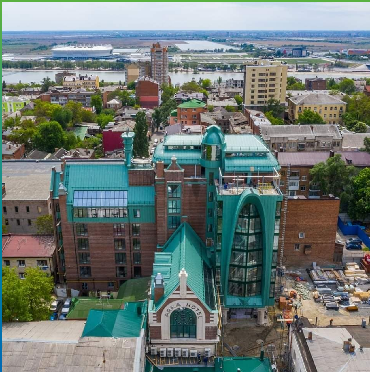
ARKA HOTEL BY GINZA PROJECT 4*