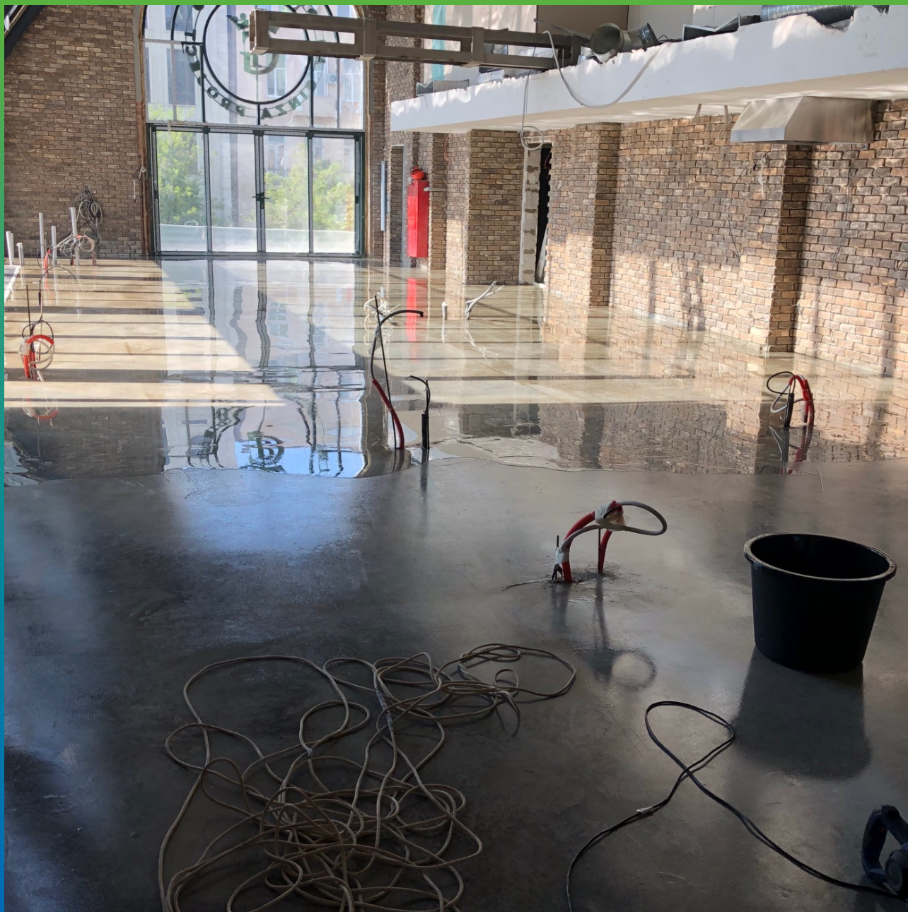
Прозрачная эпоксидная смола ДенТоп ЭП 400 толщиной 2 мм