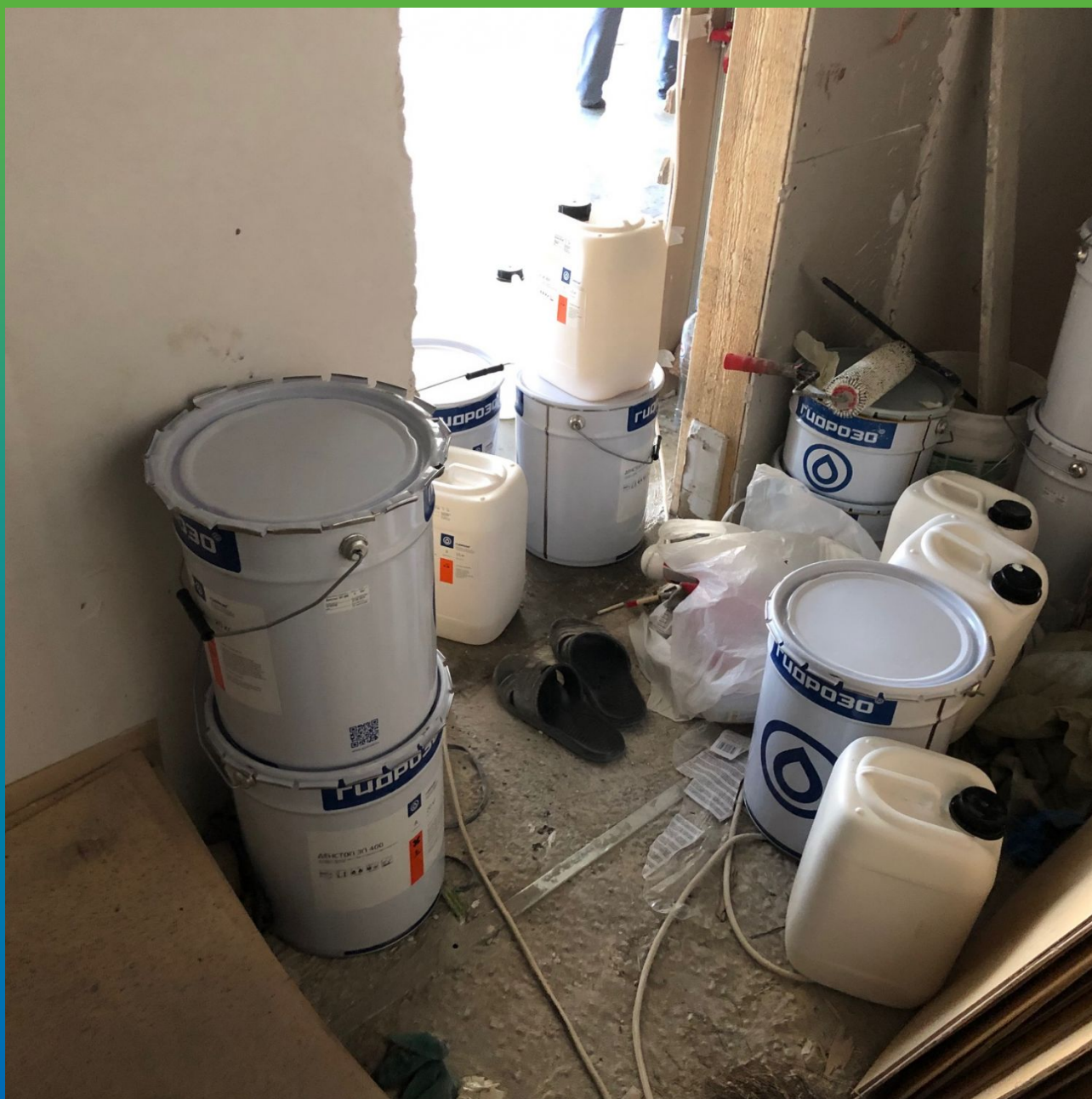
Материал Гидрозо на объекте