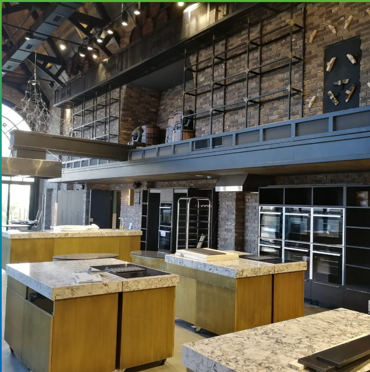
Общий вид ресторана Gastro Space