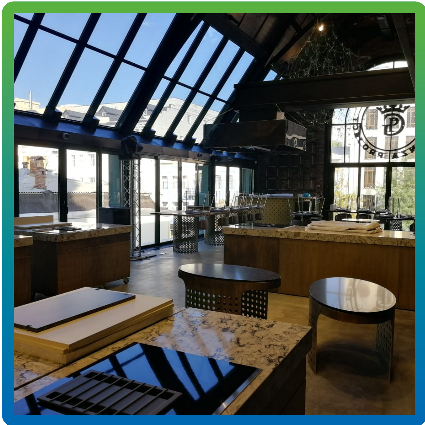
Общий вид ресторана