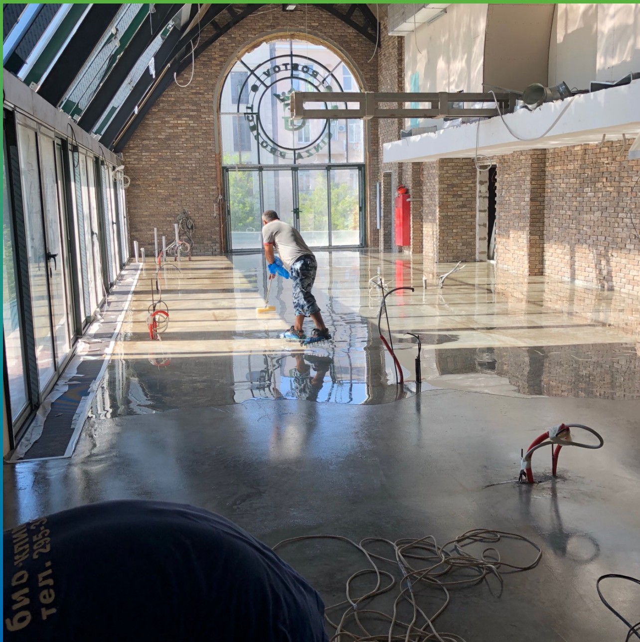
Процесс укладки прозрачной эпоксидной смолы ДенсТоп ЭП 400 поверх праймера ДенсТоп ЭП 100