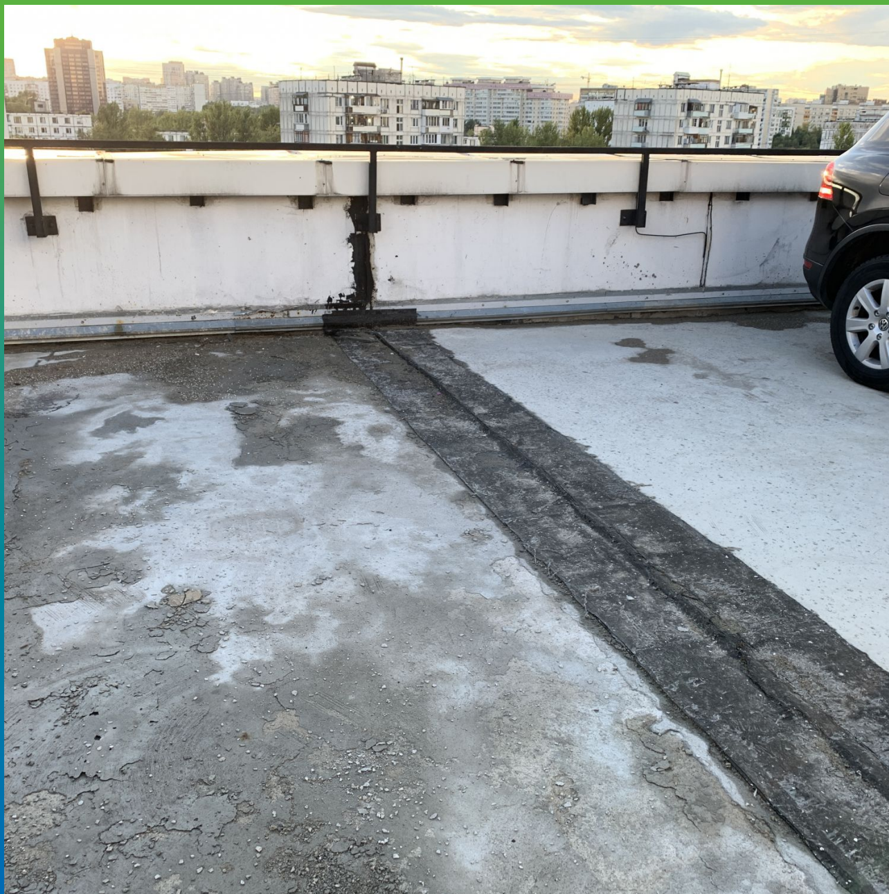
Деформационный шов до начала работ