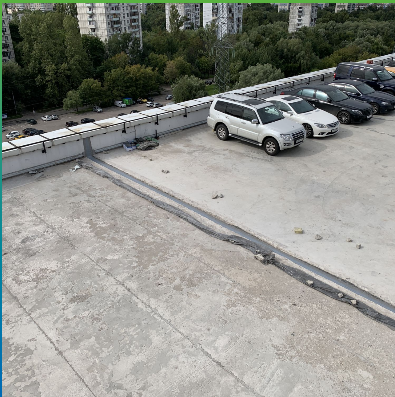
Смонтированная лента Манодил Про на клей Манопокс 331