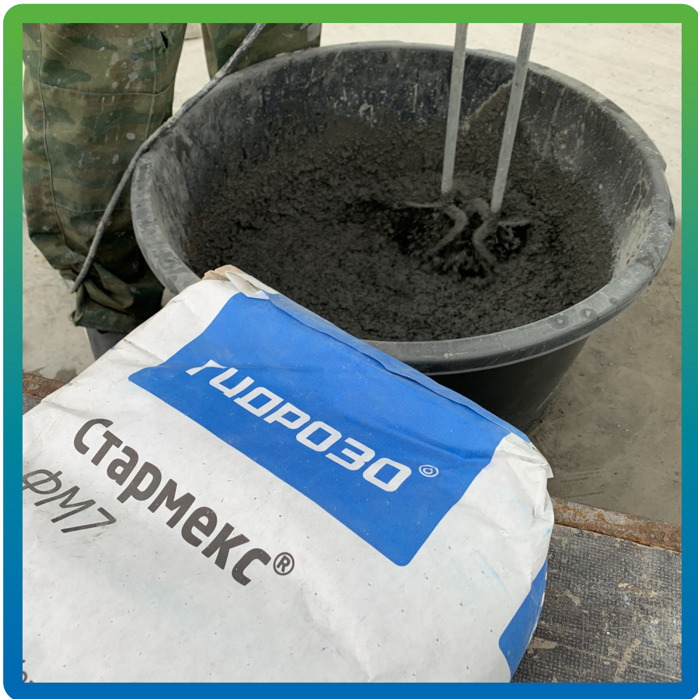
Приготовление безусадочного высокопрочного ремонтного состава наливного типа Стармекс ФМ7