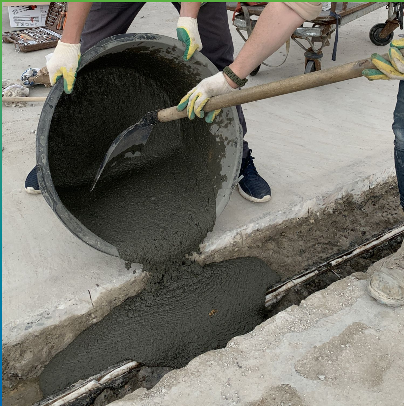
Ремонт основания для последующего монтажа гидроизоляционной ленты