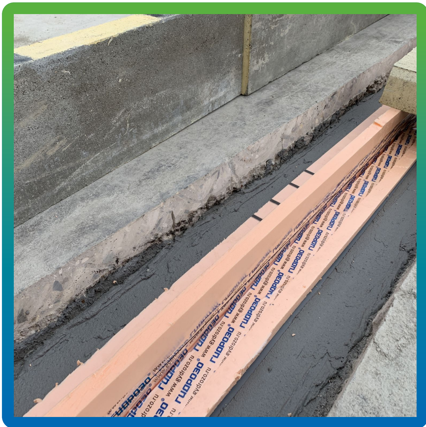
Опалубка для заливки Стармекс ФМ7