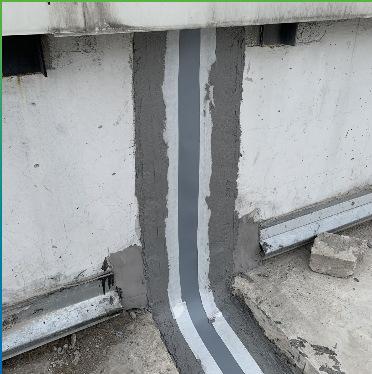
Монтаж ленты Манодил Про на парапеты