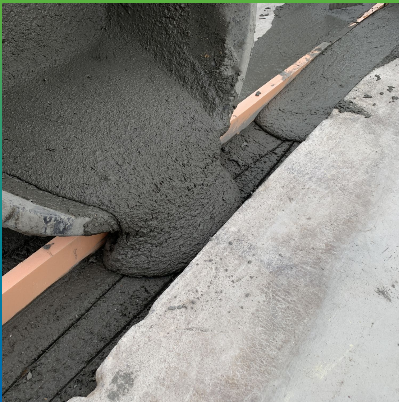
Заполнение кромок деформационного шва