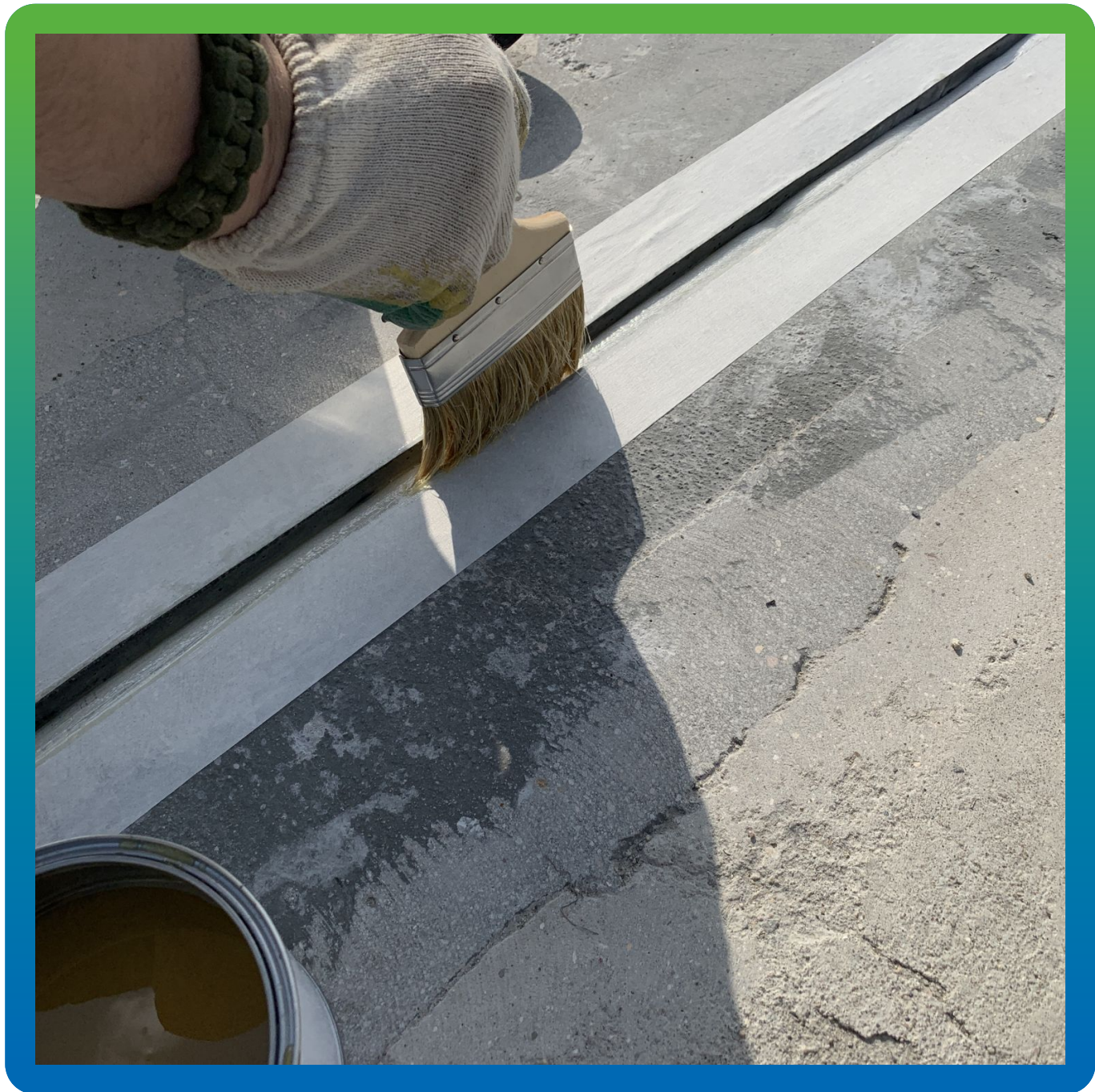
Грунтование поверхности деформационного шва составом Манодил ПУ 90