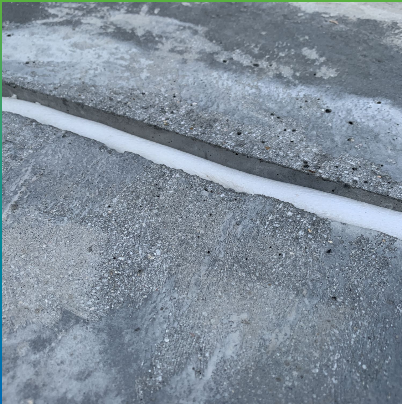
Монтаж профиля из вспененного полиэтилена для ограничения глубины шва