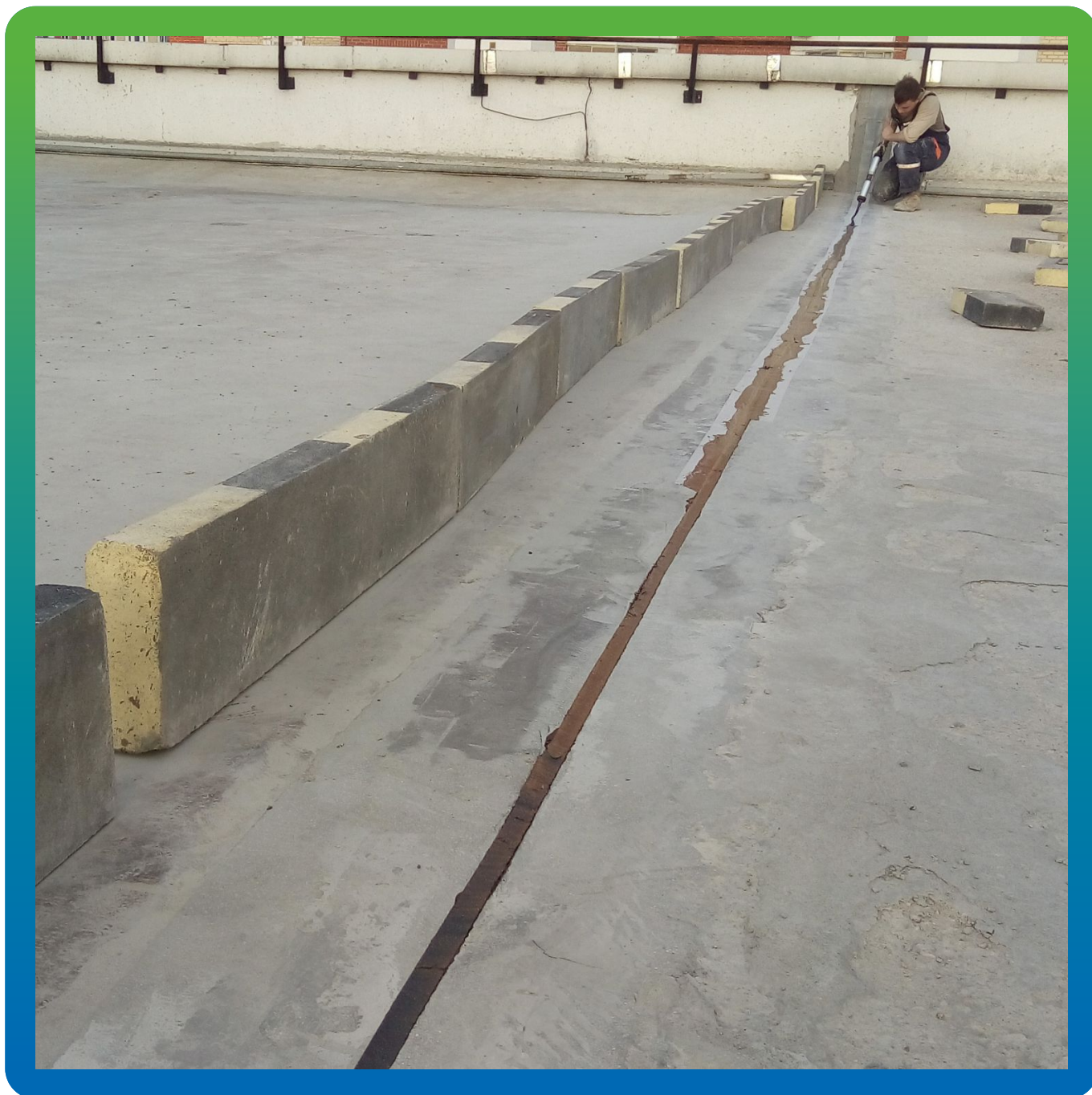
Нанесение герметика в деформационный шов