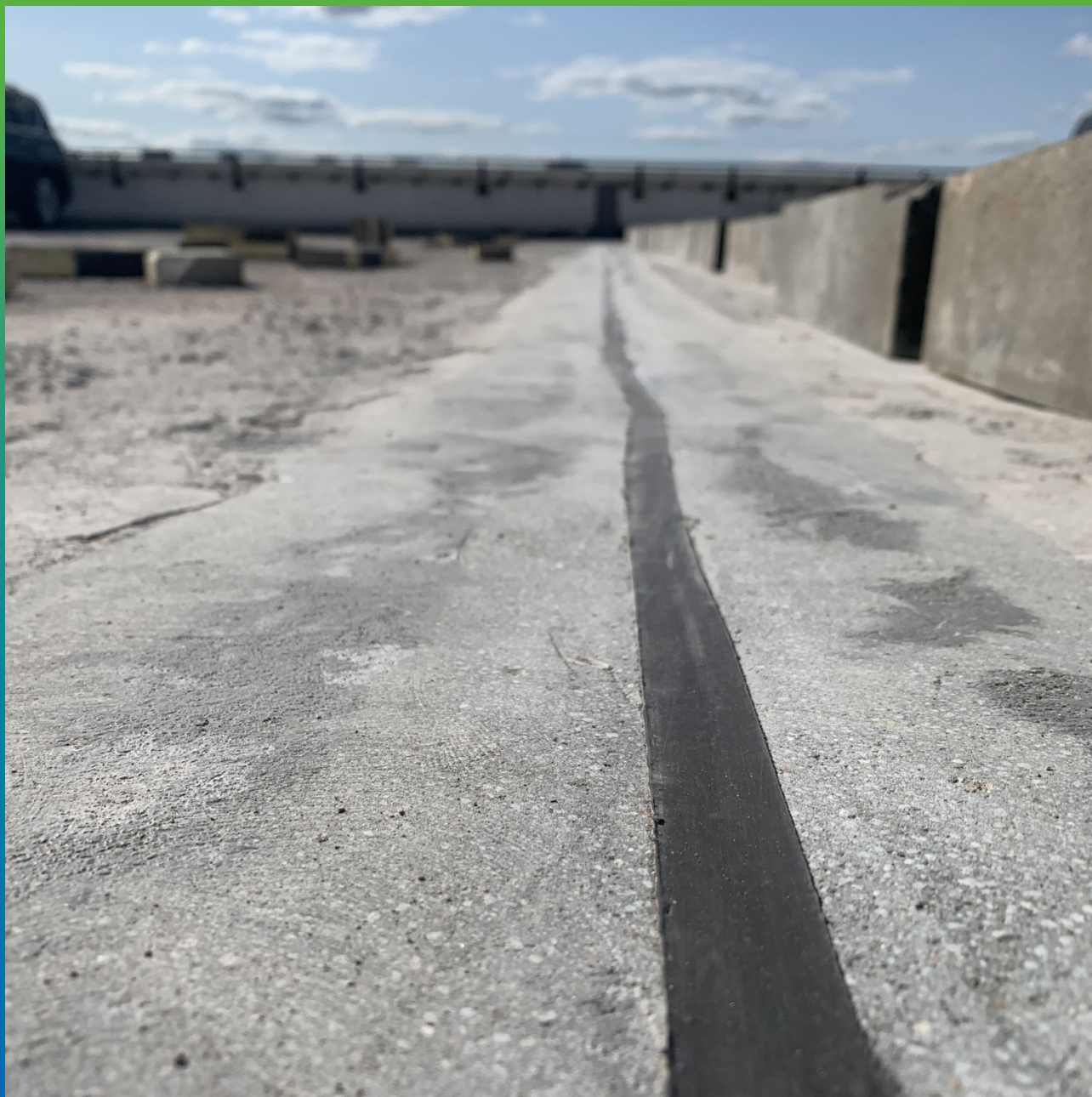
Вид на гидроизолированный деформационный шов