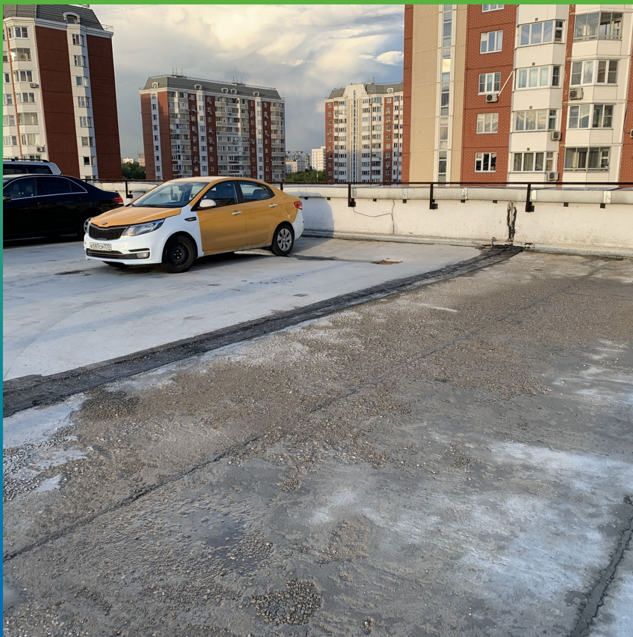
Деформационный шов до начала работ