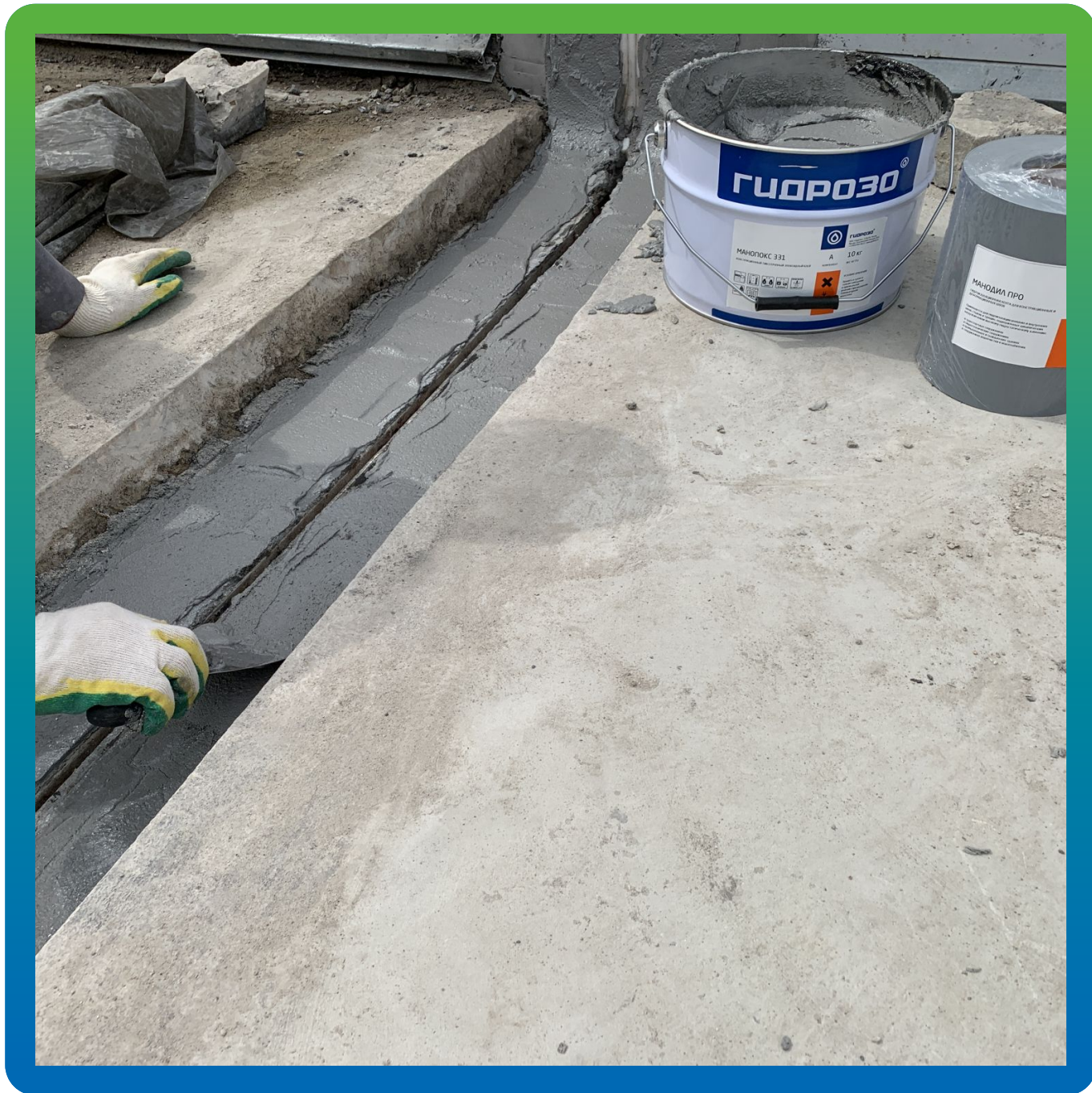
Нанесение Манопокс 331 на выровненное основание