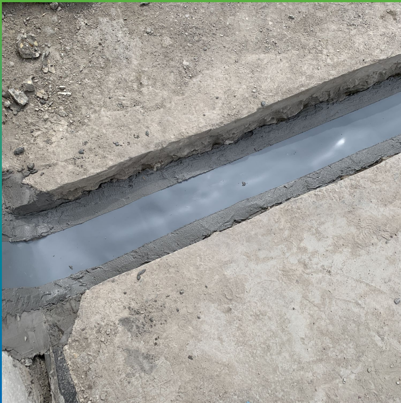
Смонтированная лента Манодил Про на клей Манопокс 331