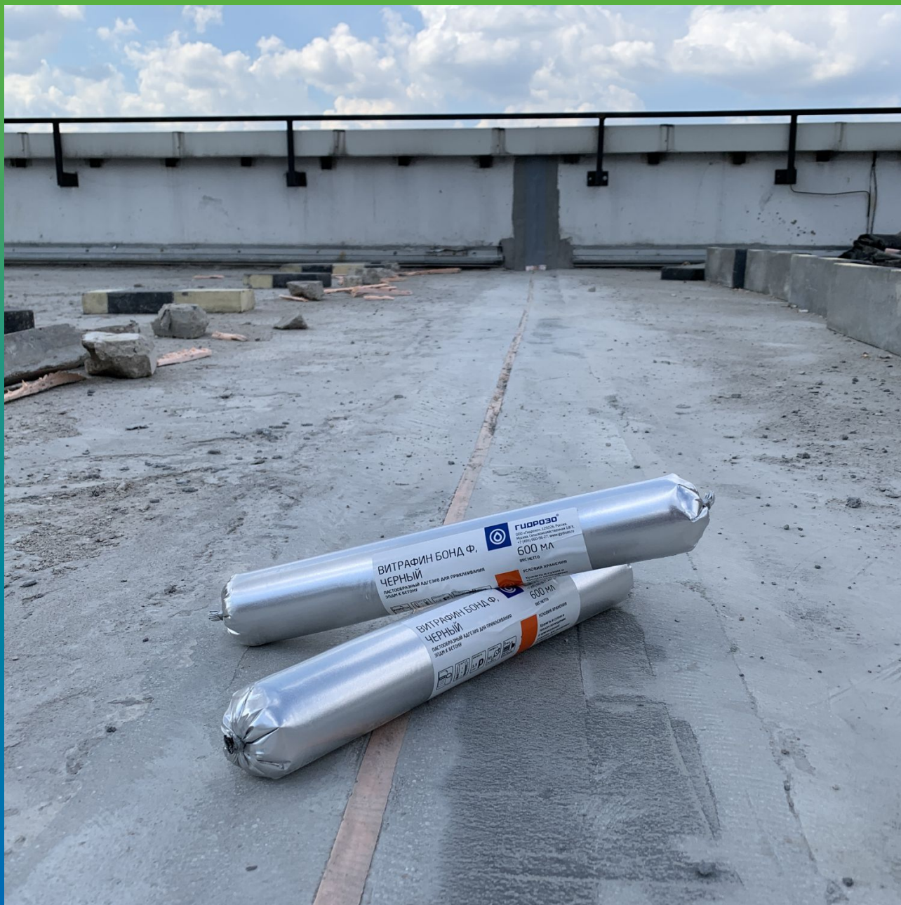
Герметик Витрафин Бонд Ф