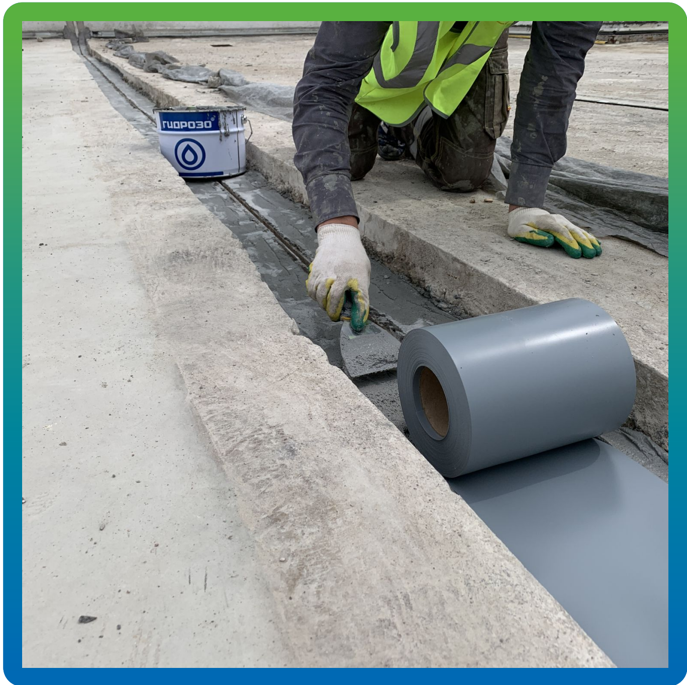
Монтаж ленты Манодил Про 1 мм