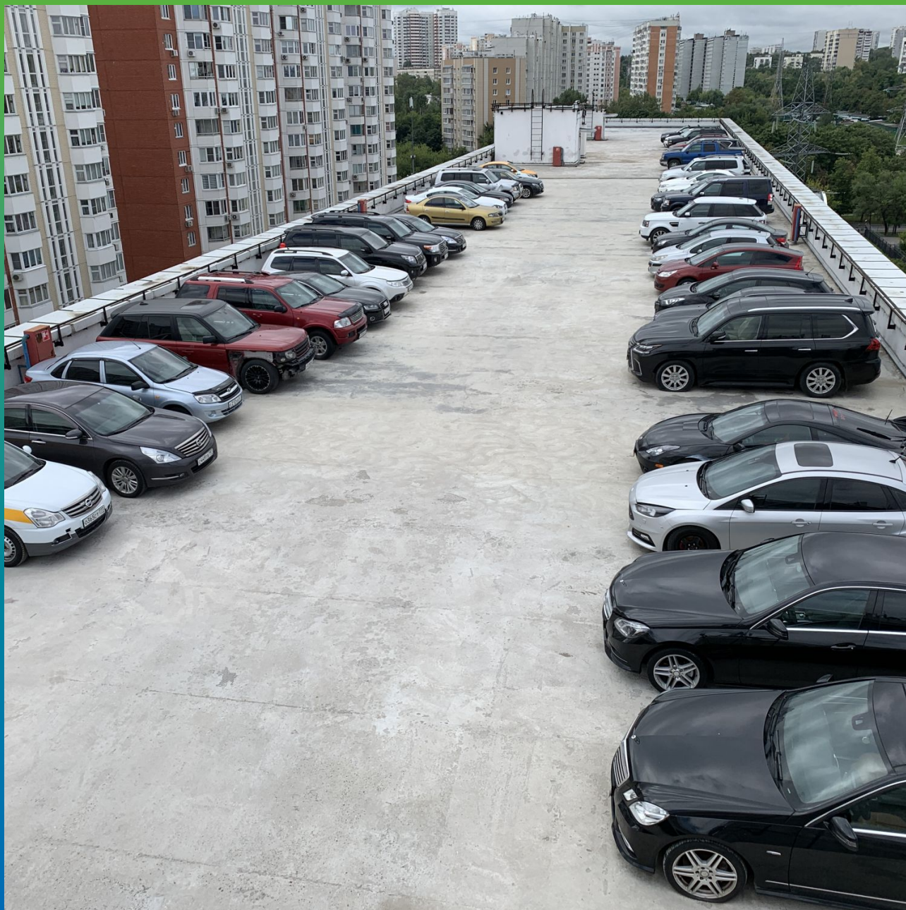
Общий вид на паркинг до начала производства работ