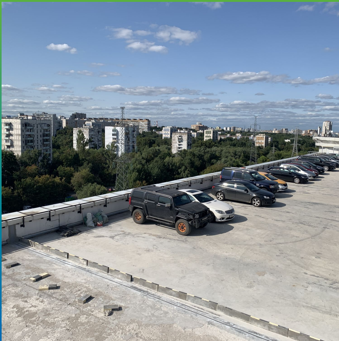
Вид на гидроизолированный деформационный шов