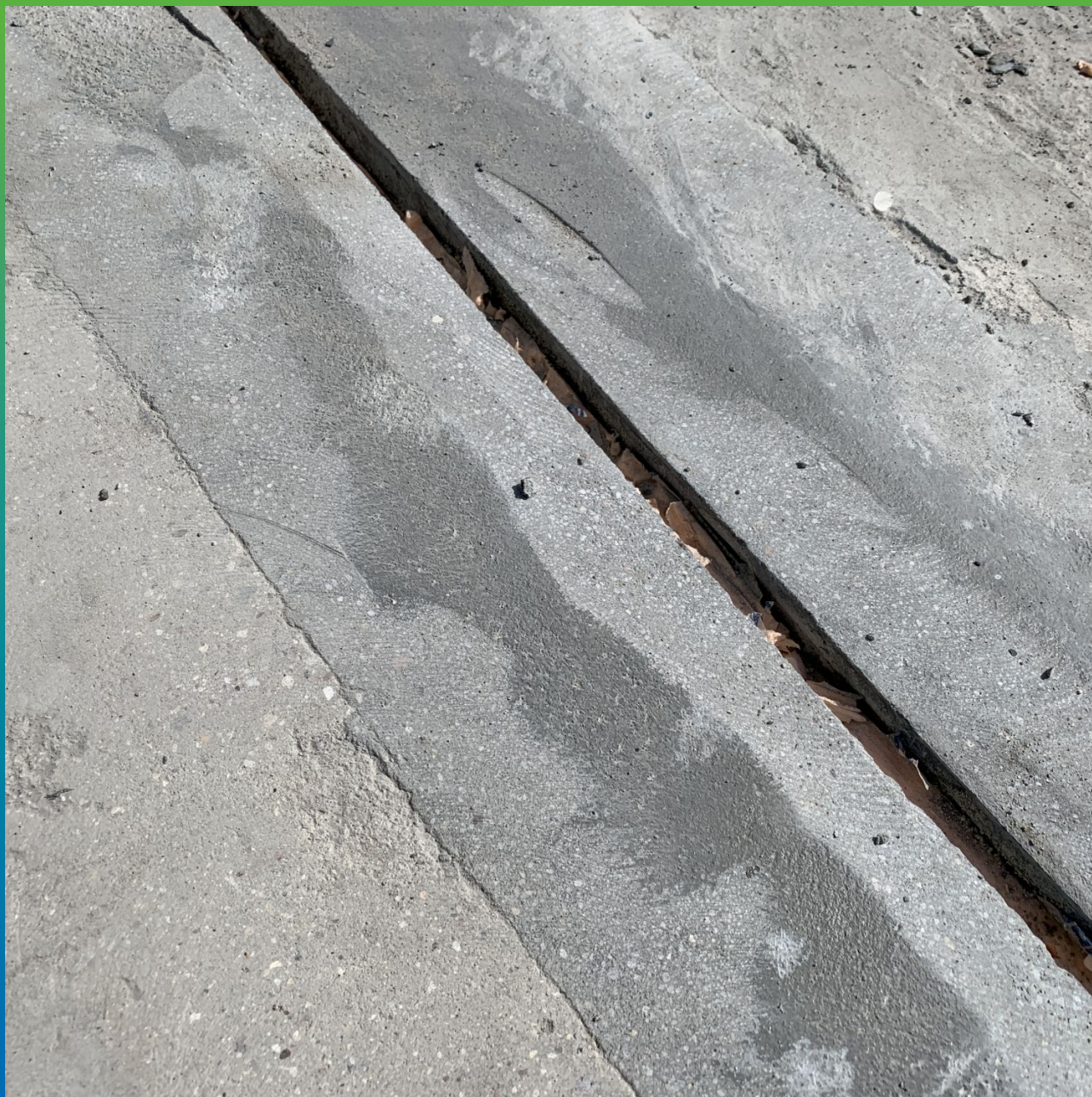
Очистка шва от опалубки