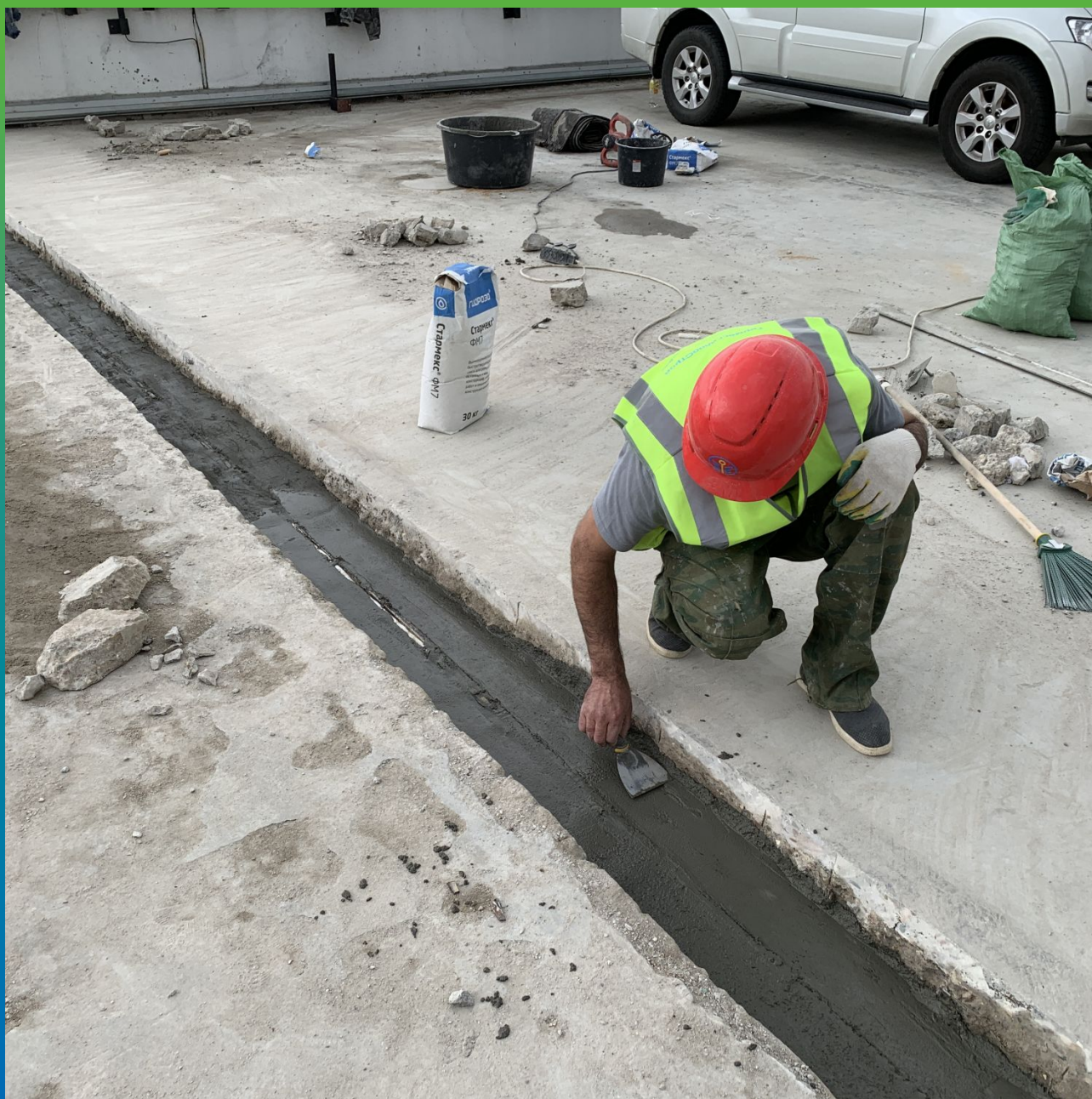
Ремонт основания для последующего монтажа гидроизоляционной ленты