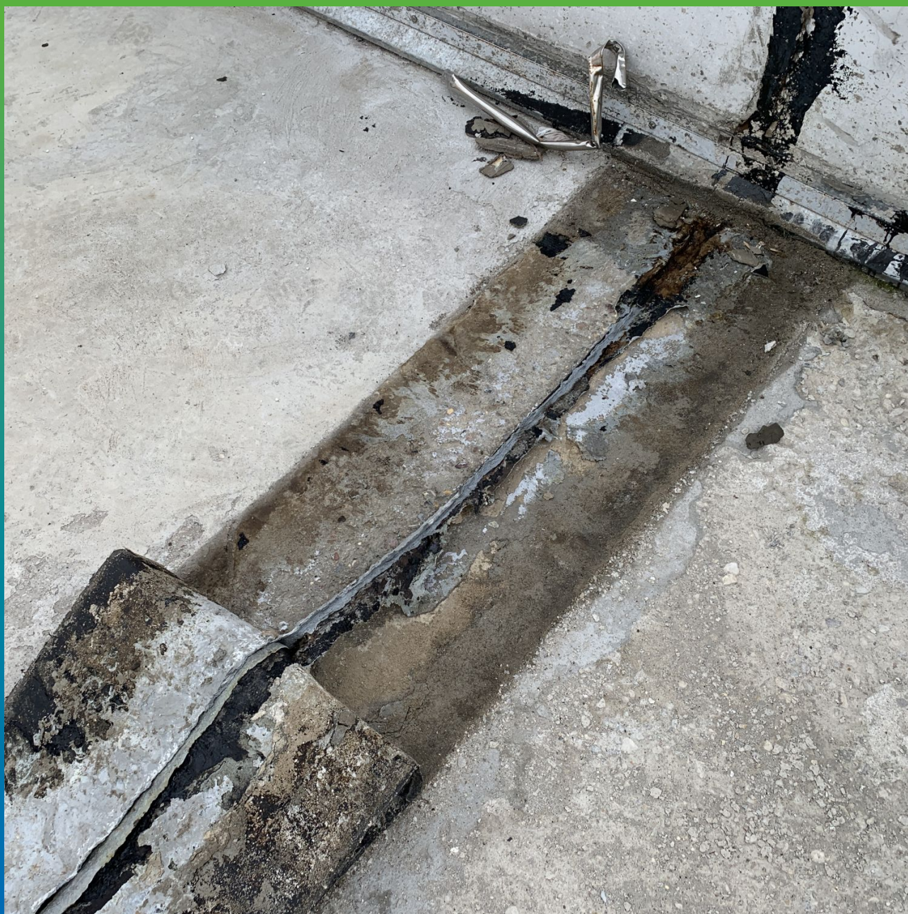
Демонтаж старой изоляции