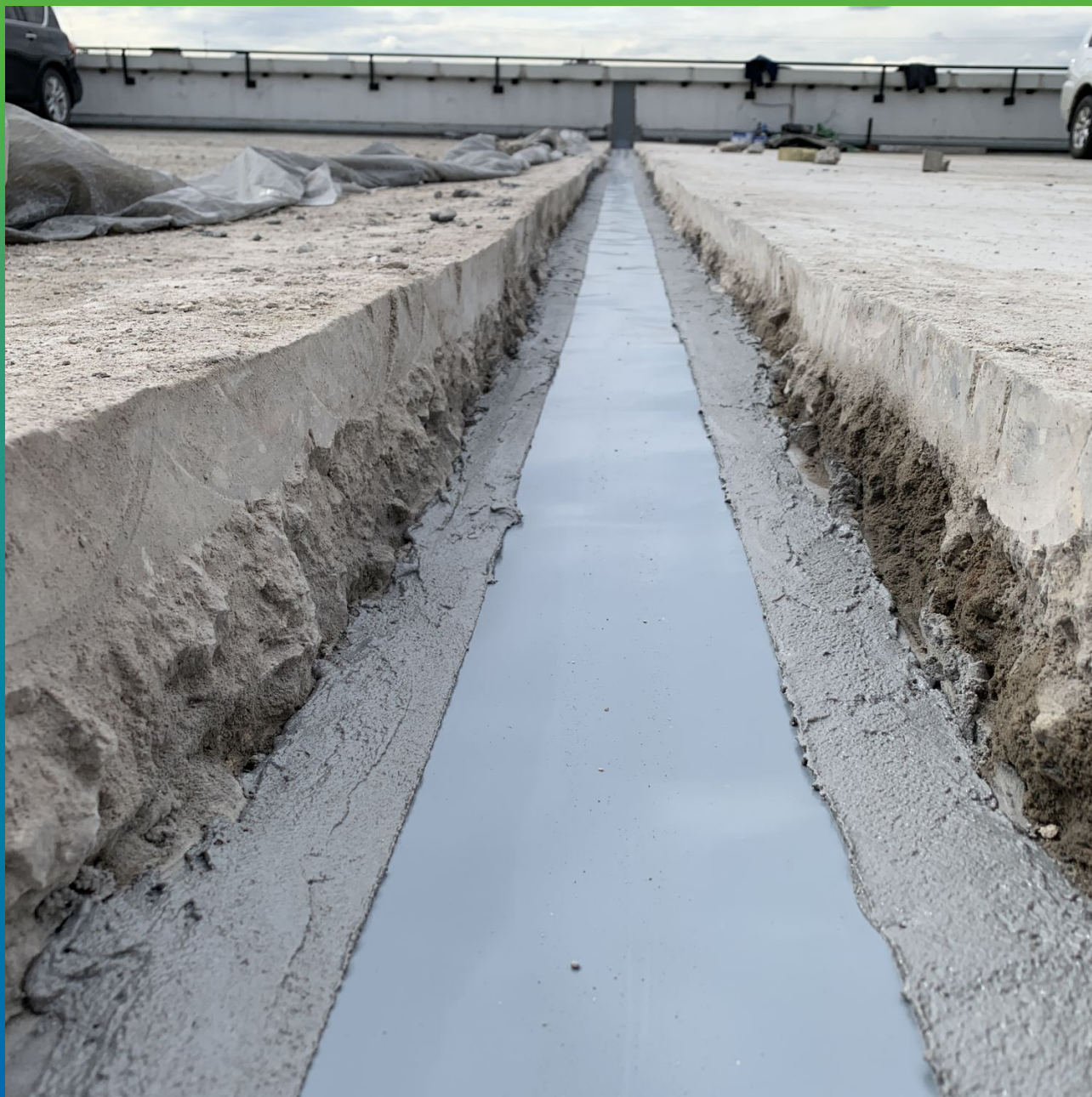
Смонтированная лента Манодил Про на клей Манопокс 331