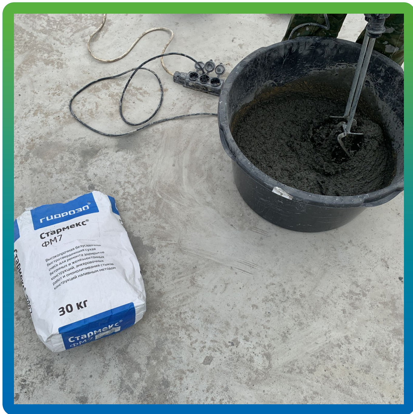
Приготовление безусадочного высокопрочного ремонтного состава наливного типа Стармекс ФМ7