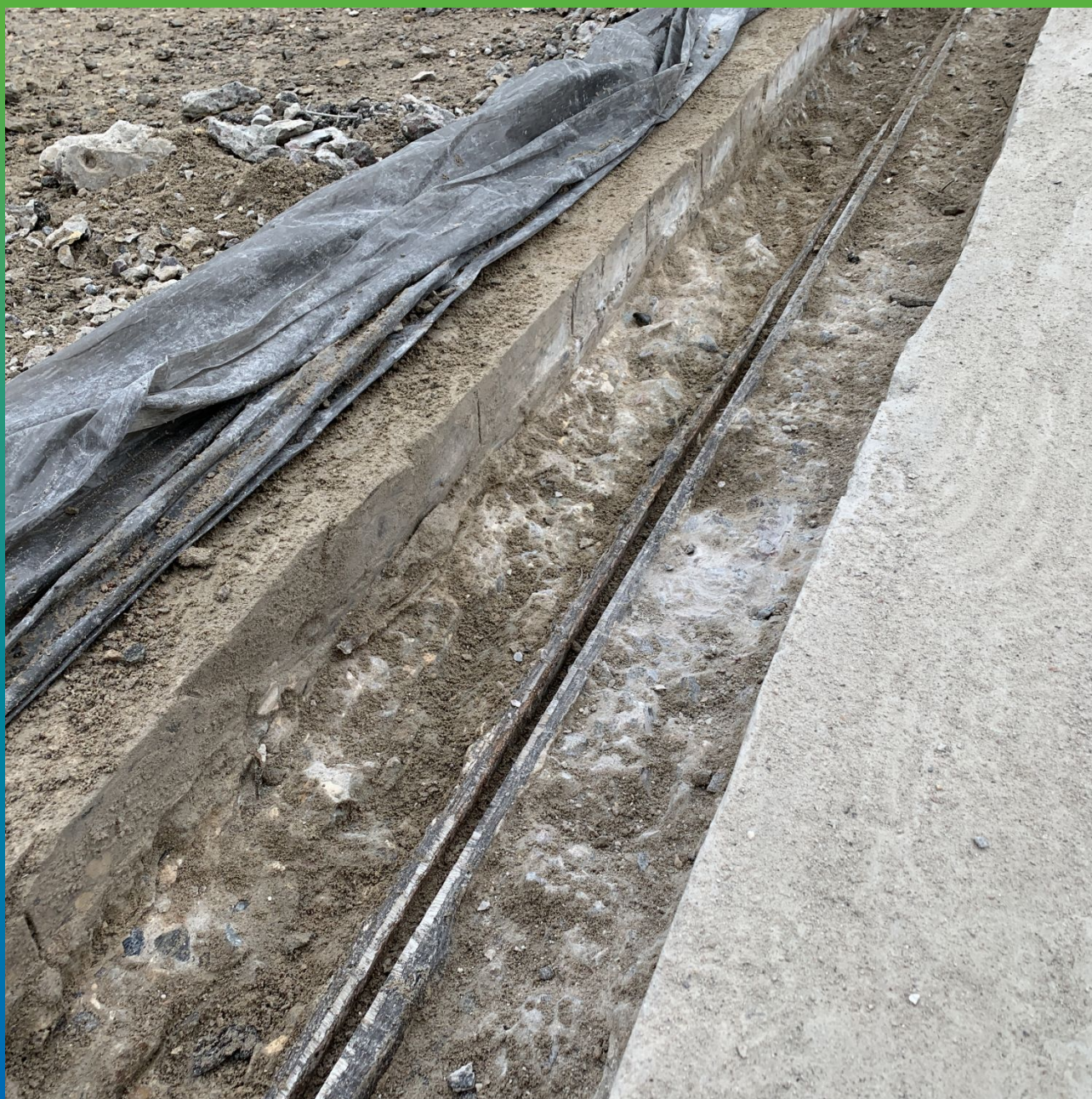
Шов, подготовленный к следующему этапу работ