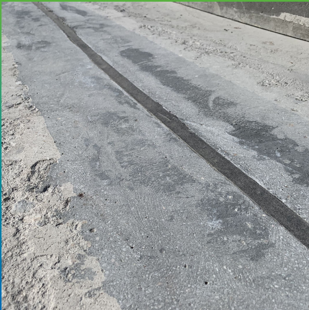
Вид на гидроизолированный деформационный шов