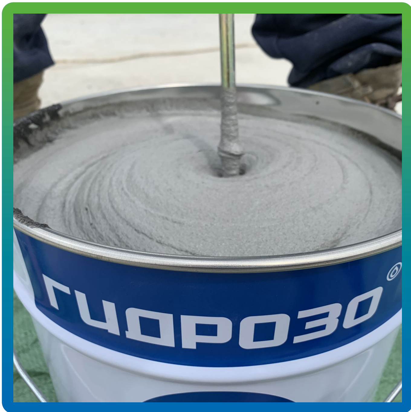
Смешивание компонентов Манопокс 331