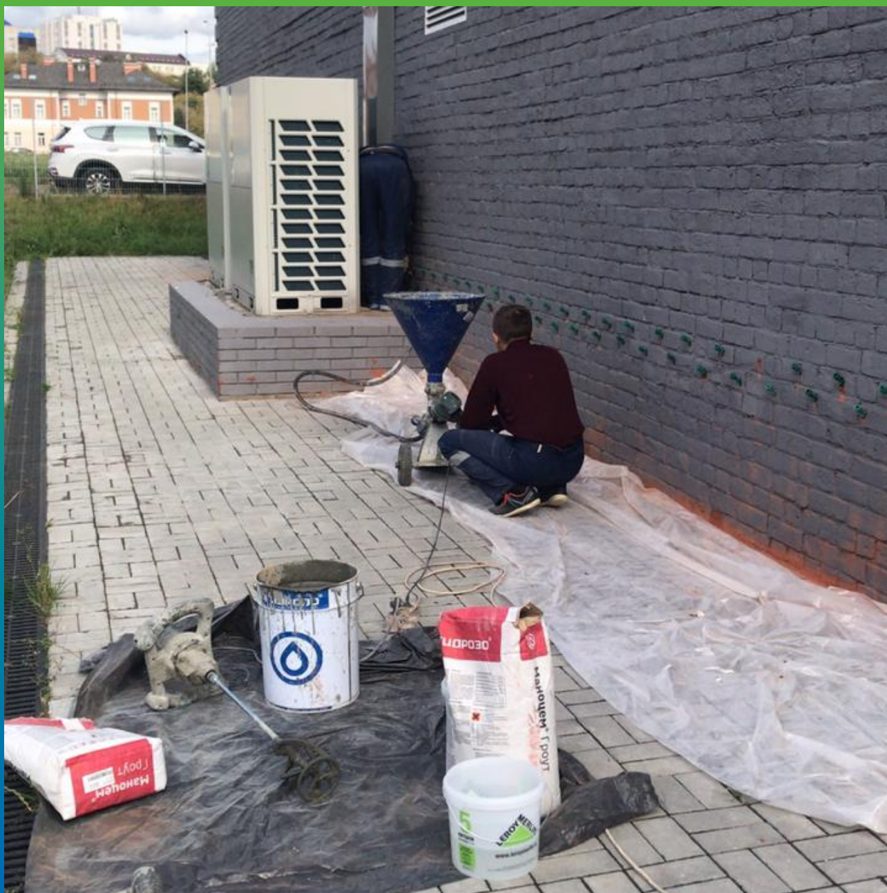
Подача инъекционного материала при помощи насоса.