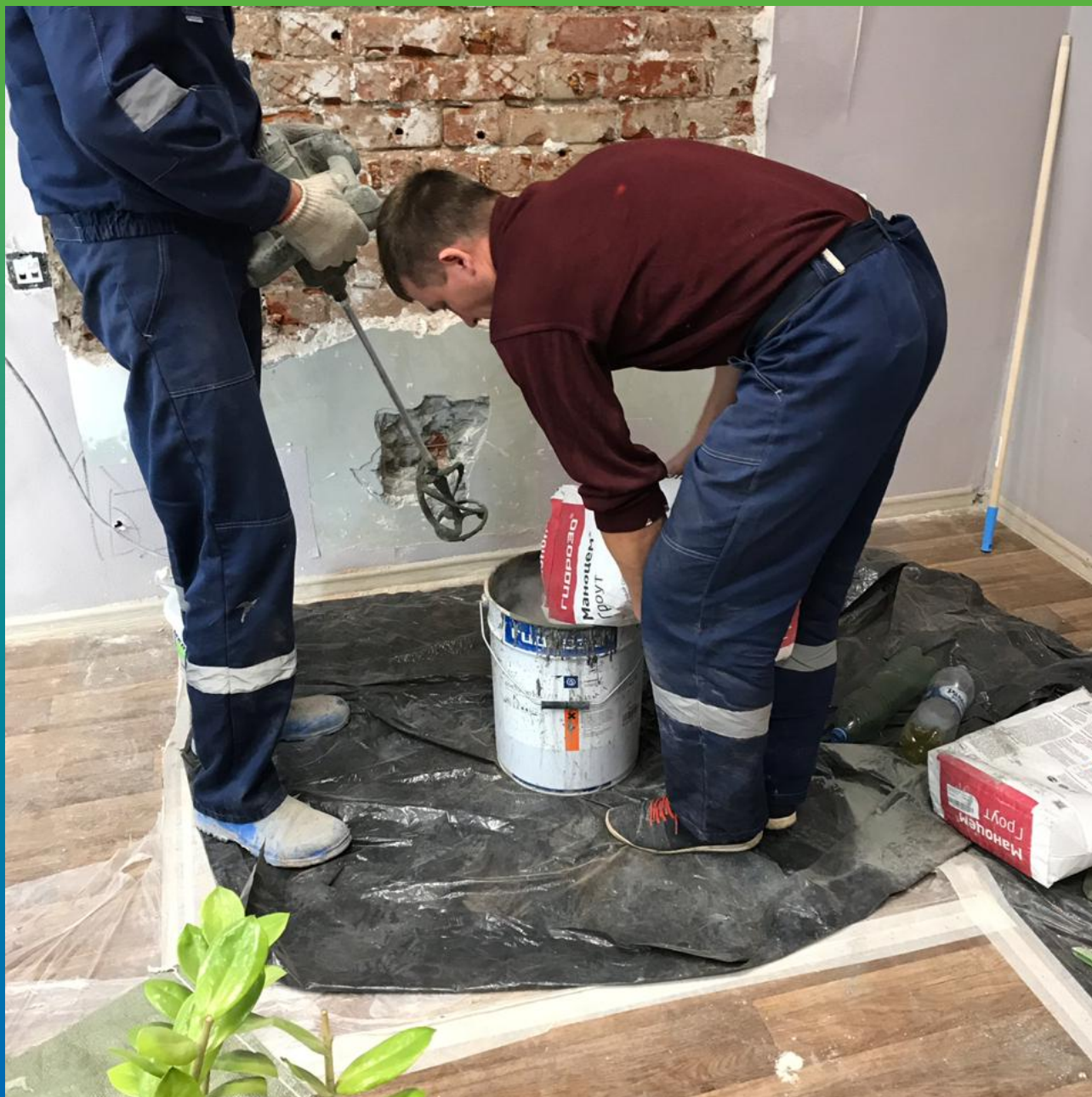
Замешивание инъекционного материала.