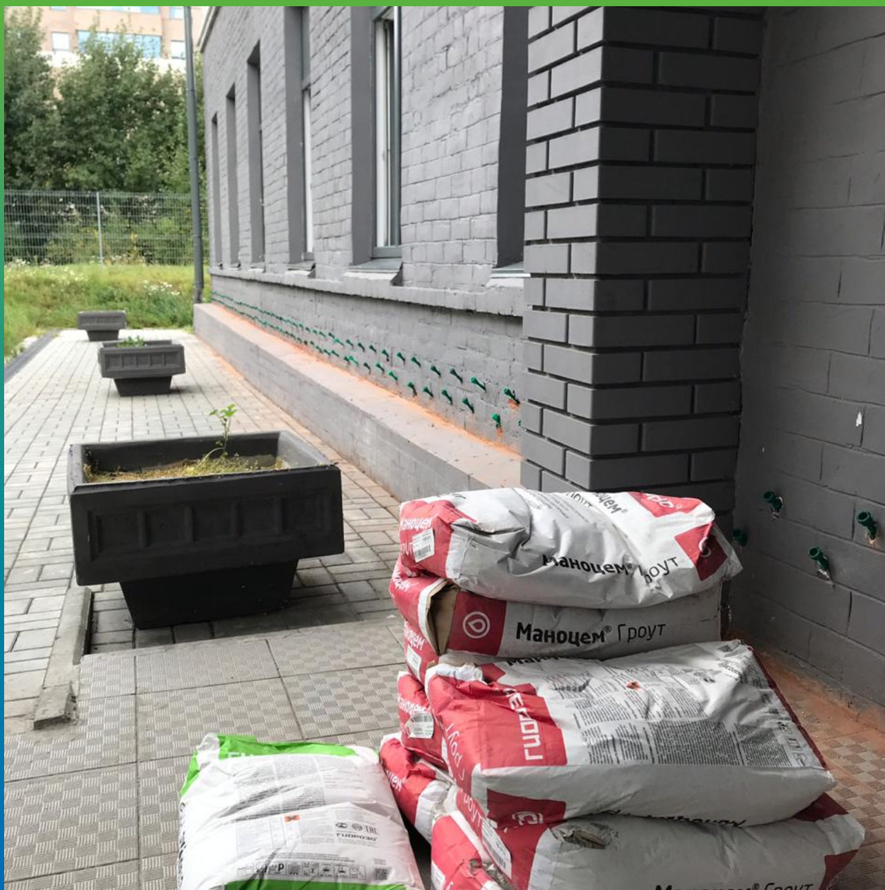
Монтаж пакеров для проведения инъекционных работ