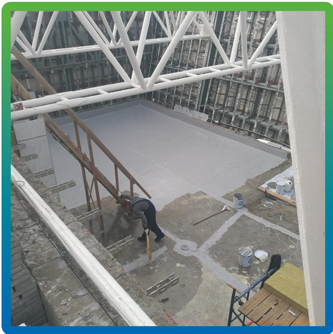
Нанесения первого слоя мастики ДенсТоп МС 351 на одной из террас