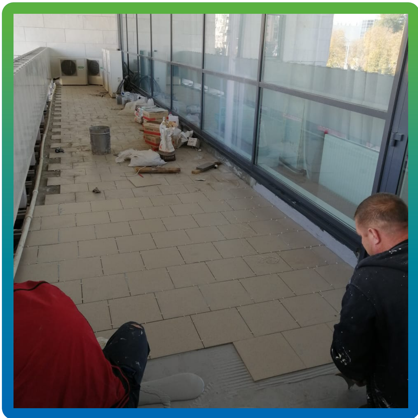
Применение мастики ДенТоп МС 351 в качестве клеящего слоя под плитку