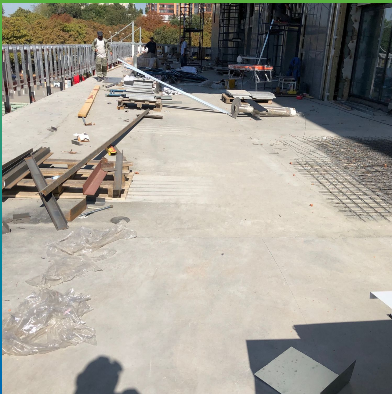
Подготовка террасы перед нанесением ДенСтoп МС 351