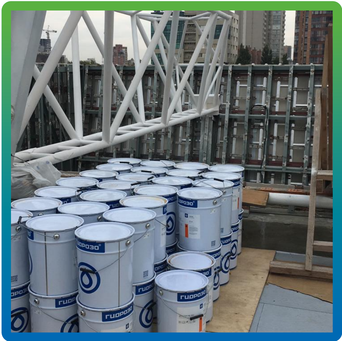
ДенТоп МС 351 - водонепроницаемая мембрана