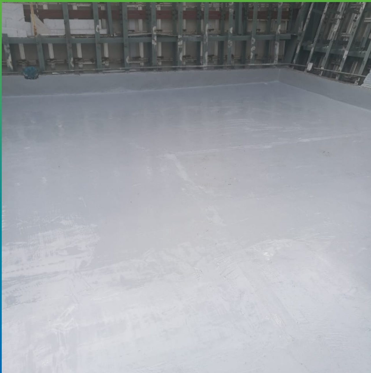
Финишный вид покрытия на первой террасе