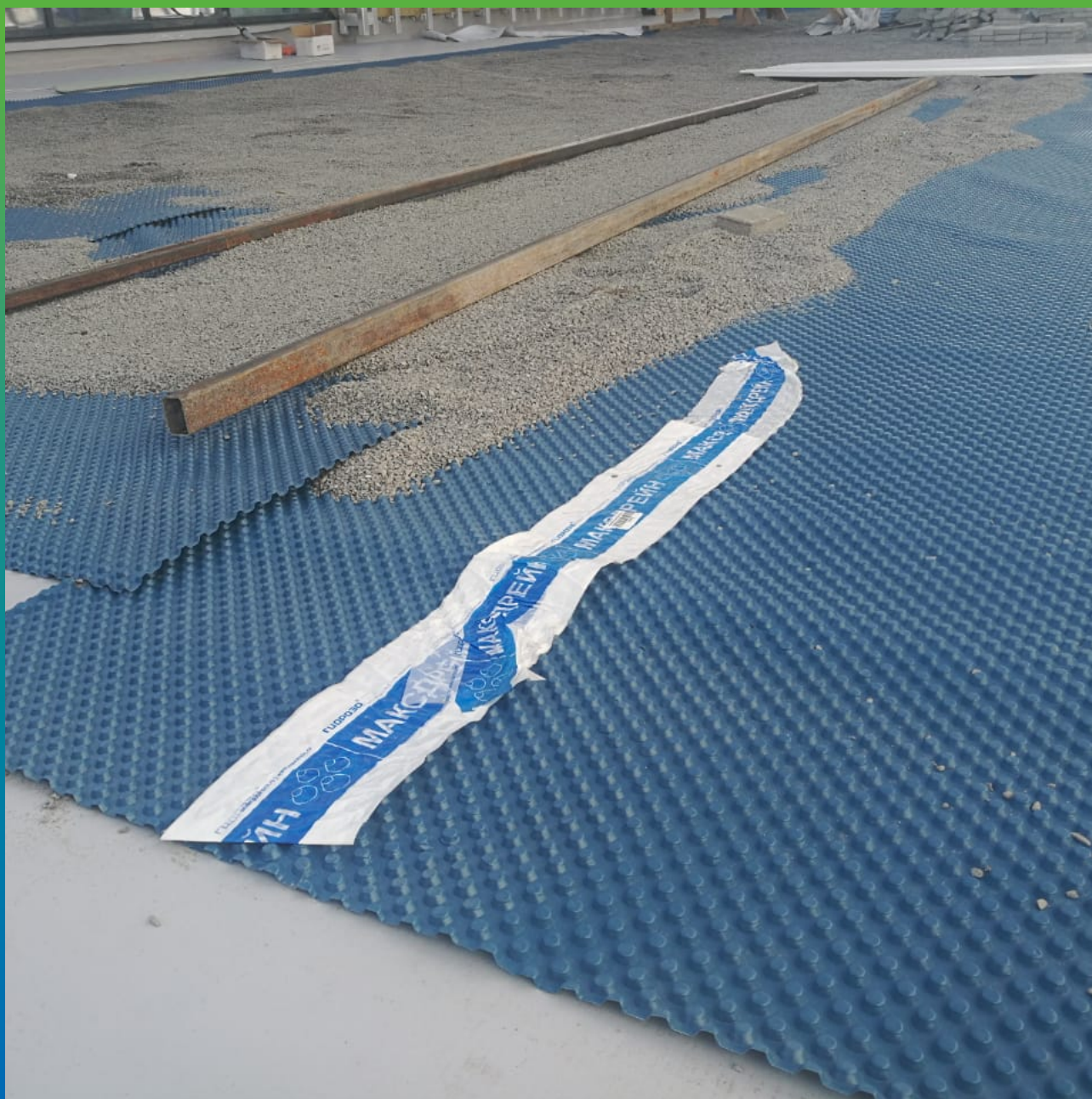
Монтаж профилированной дренажной мембраны Максдрейн 8 поверх гидроизоляционной мастики