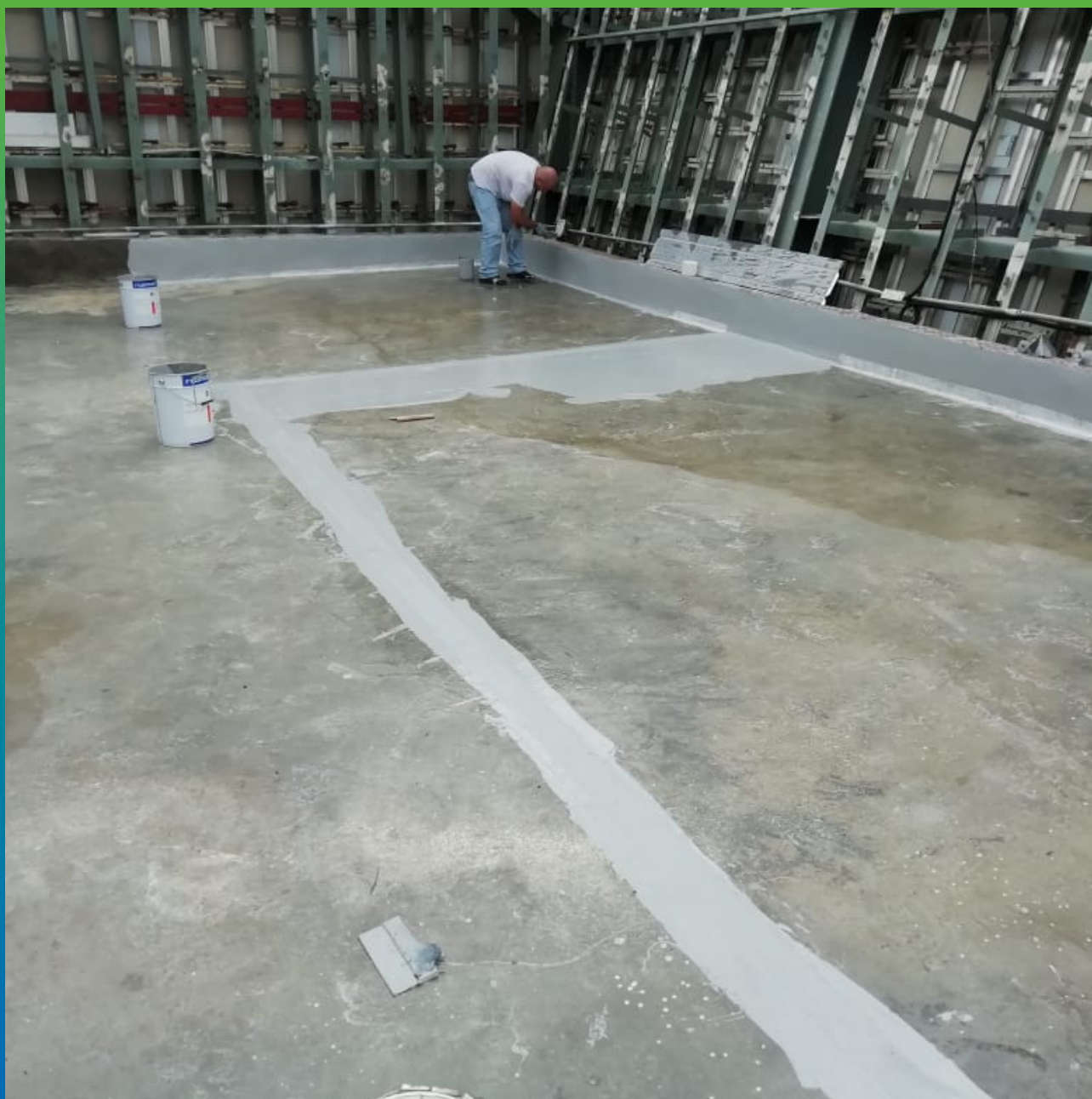
Нанесение мастики ДенсТоп МС 351 на примыкания. Основание загрунтовано эпоксидным праймером ДенсТоп ЭП 100.