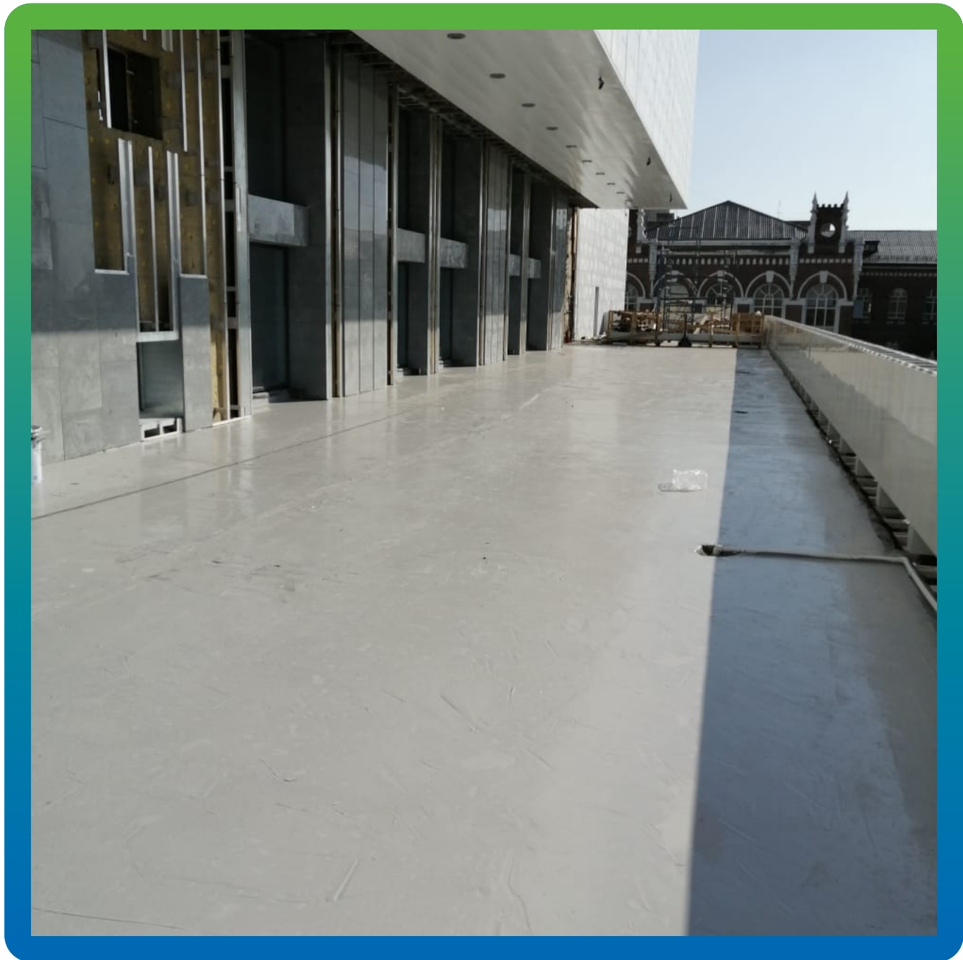
Финишный вид мастики на второй открытой террасе