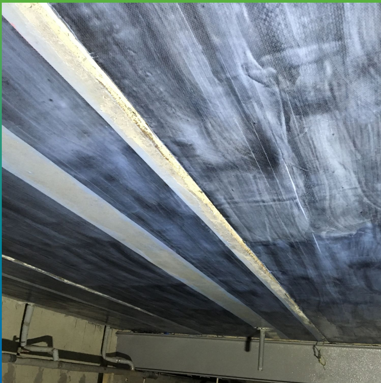
Финальный вид плиты перекрытия