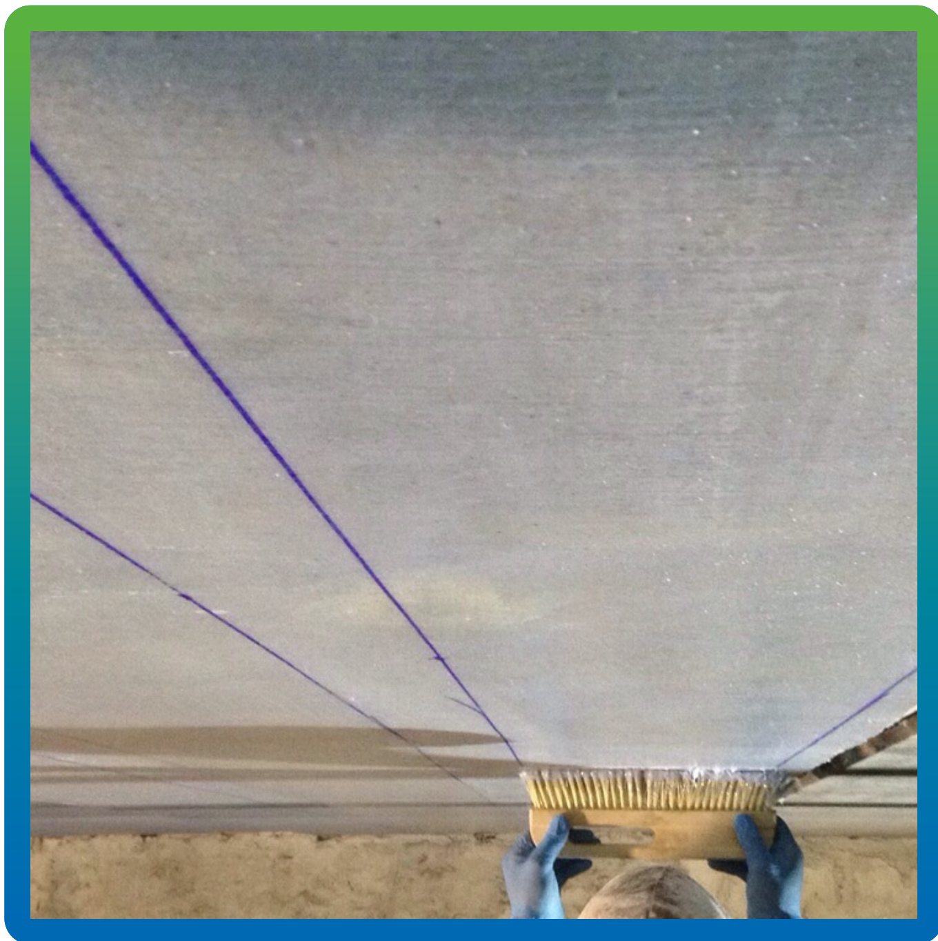
Нанесение Манопокс 372 загущенного с помощью Манопокс Тикс