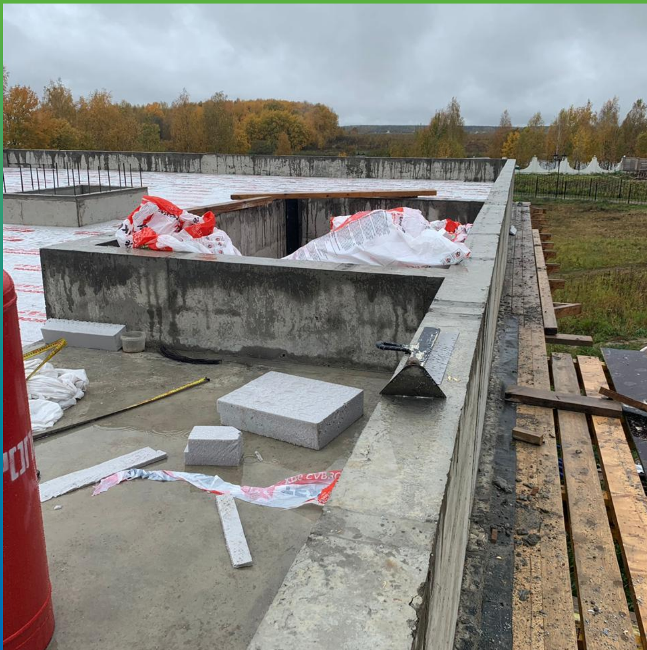
Подготовка к укладке ЭПДМ мембраны Суперсил 2.1