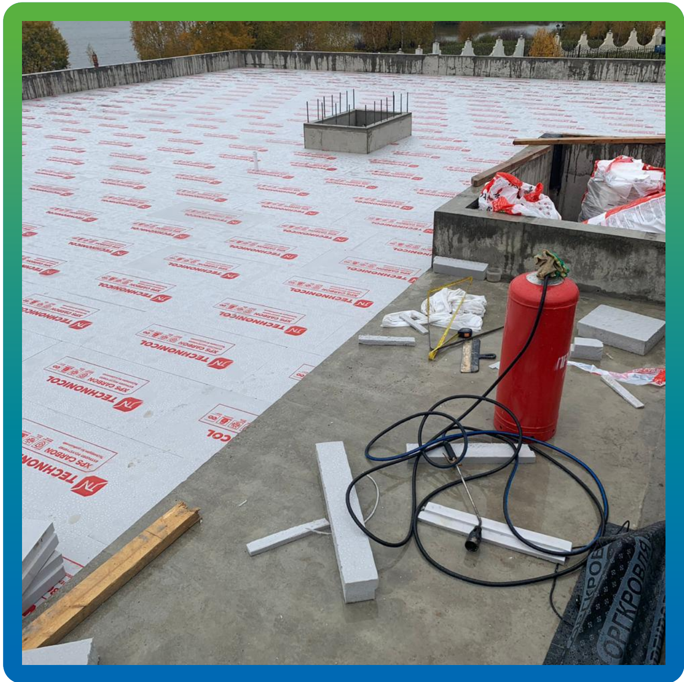
Подготовка к укладке ЭПДМ мембраны Суперсил 2.1