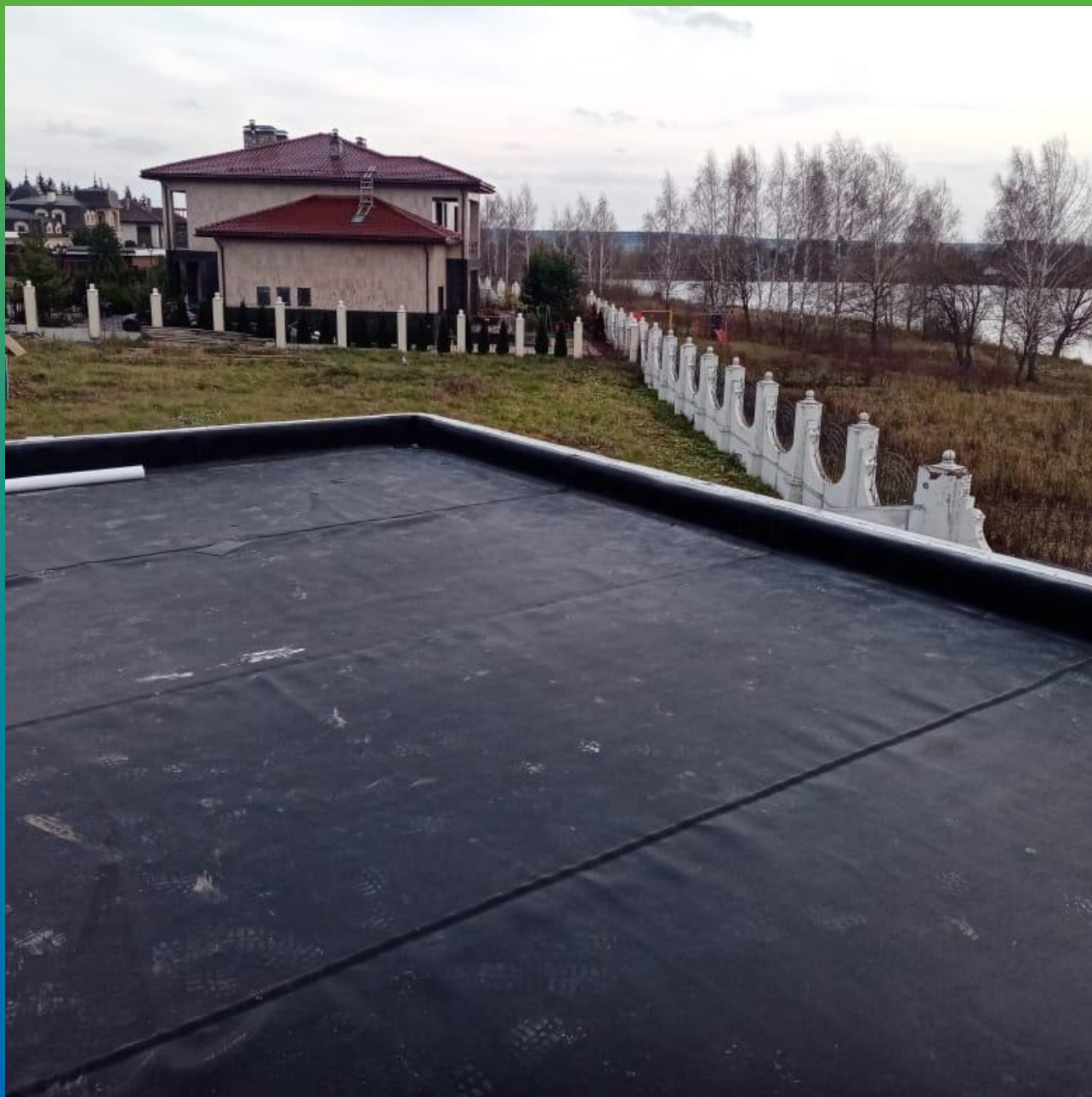
Материал Суперсил 2.1, сваренный на объекте