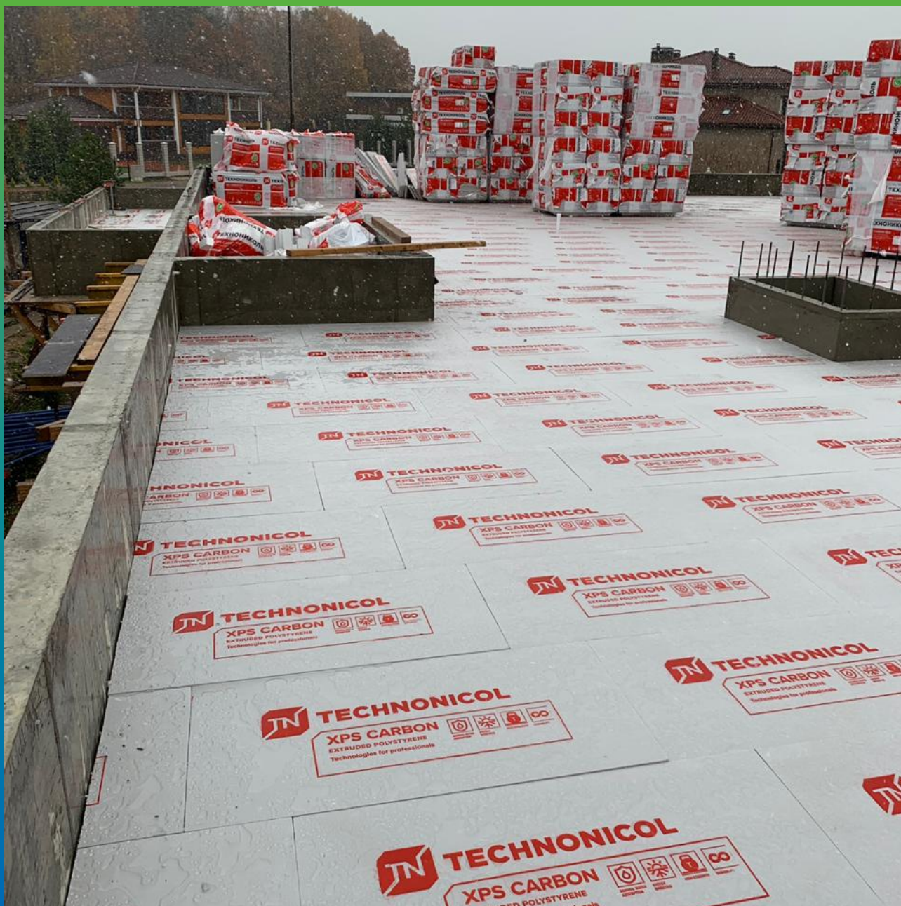
Подготовка к укладке ЭПДМ мембраны Суперсил 2.1