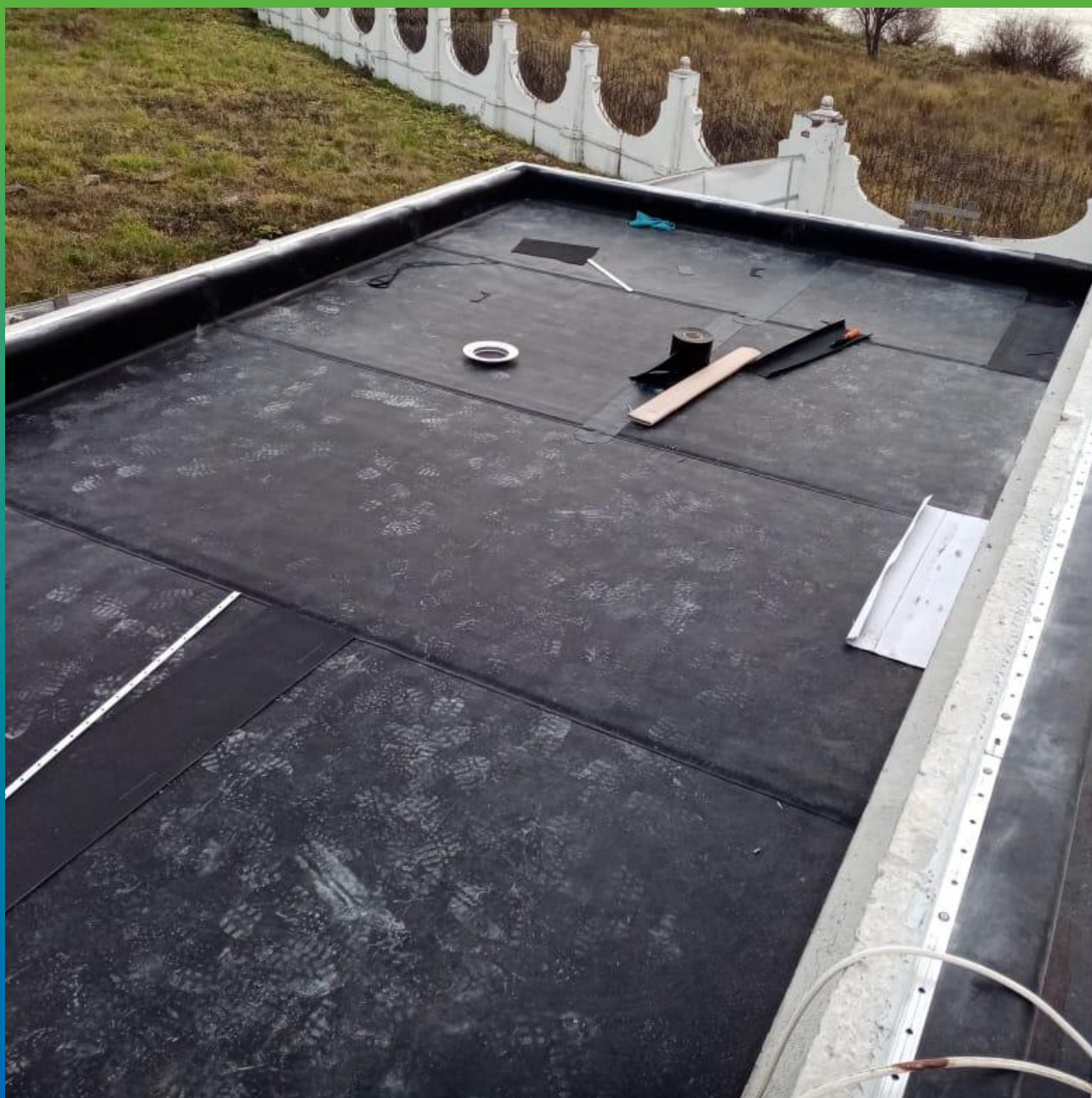
Вторая зона кровли, материал Суперсил с применением сварочной ленты Термобонд