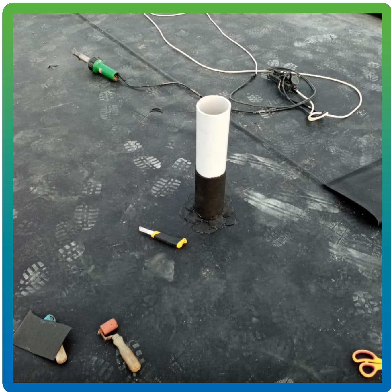
Сварка рулонов осуществляется специальным инструментом "Ляйстер"