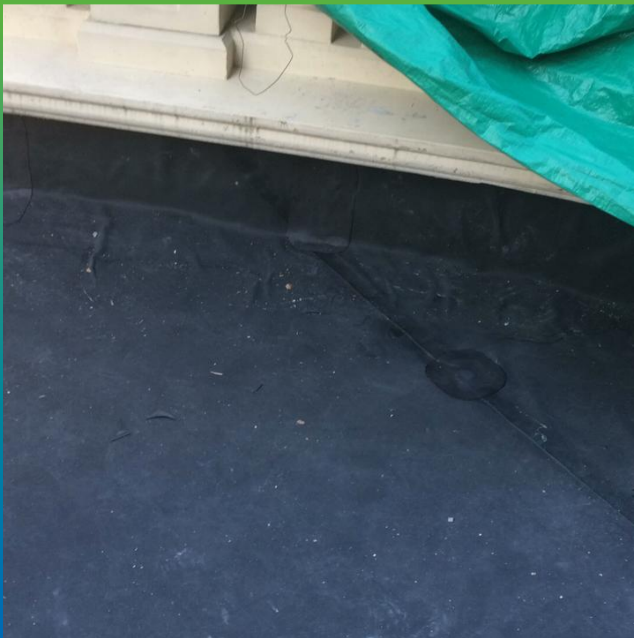
Устройство гидроизоляции балкона материалом Эластосил 1.2