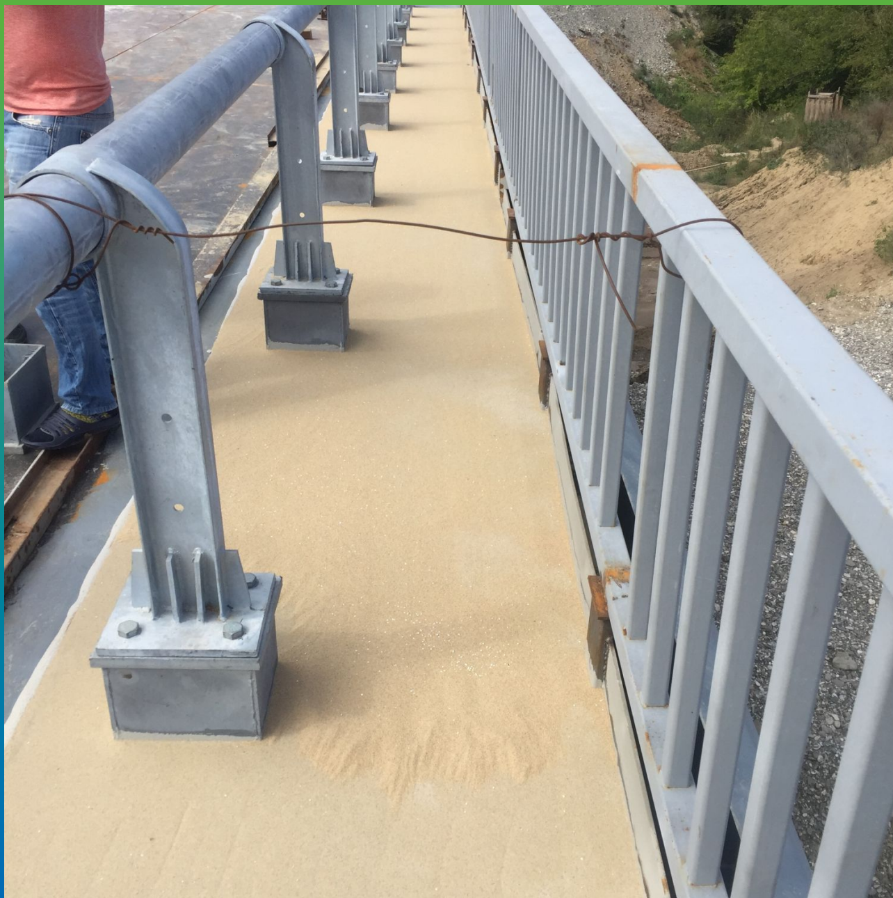
Сбор излишков ДенТоп Филлер 01, после этапа просыпки