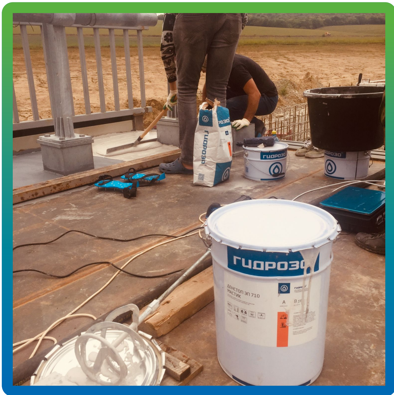
Нанесения основного слоя ДенТоп ЭП 710 Мастик