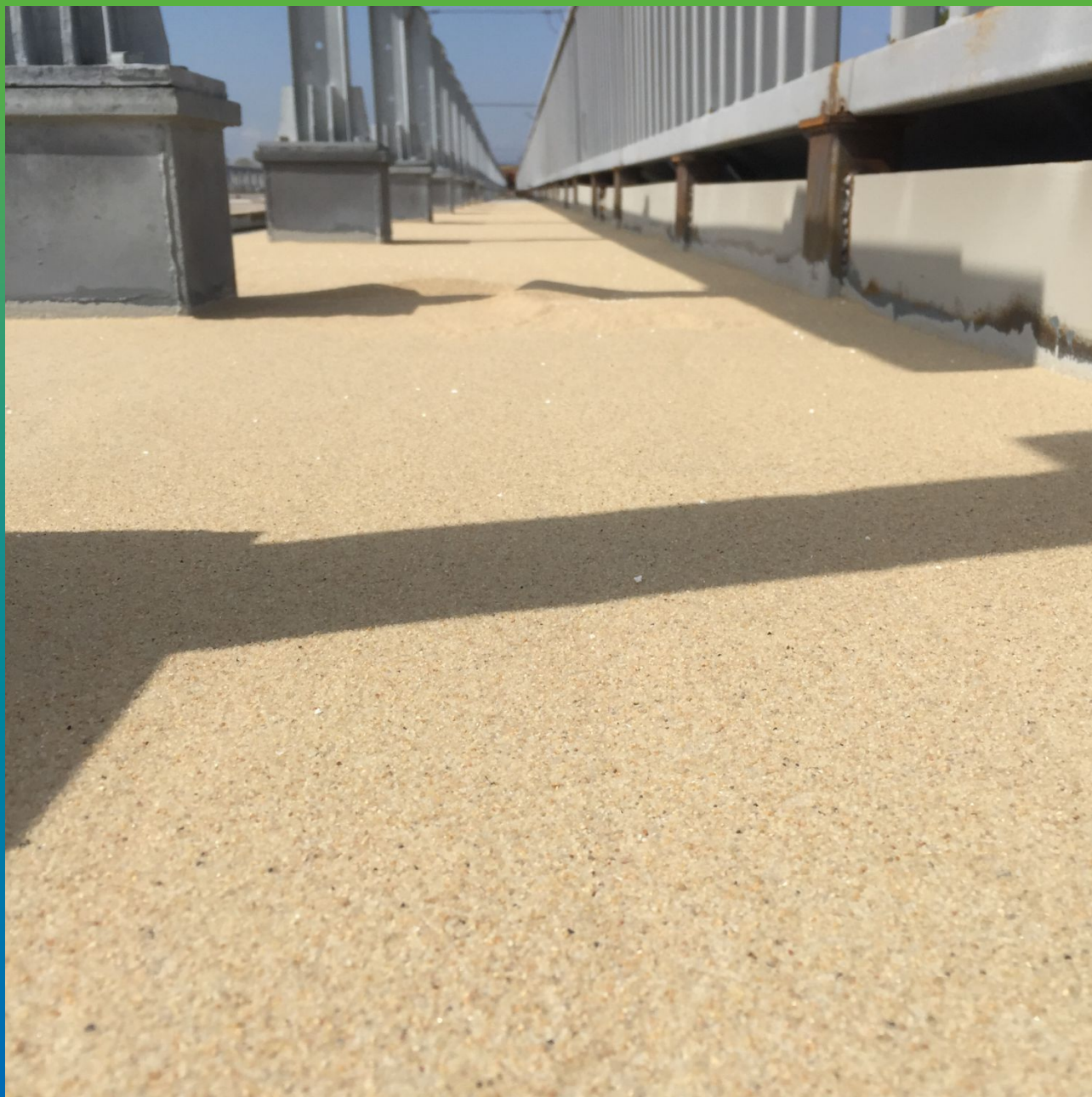
Просыпка ДенсТоп Филлер 01