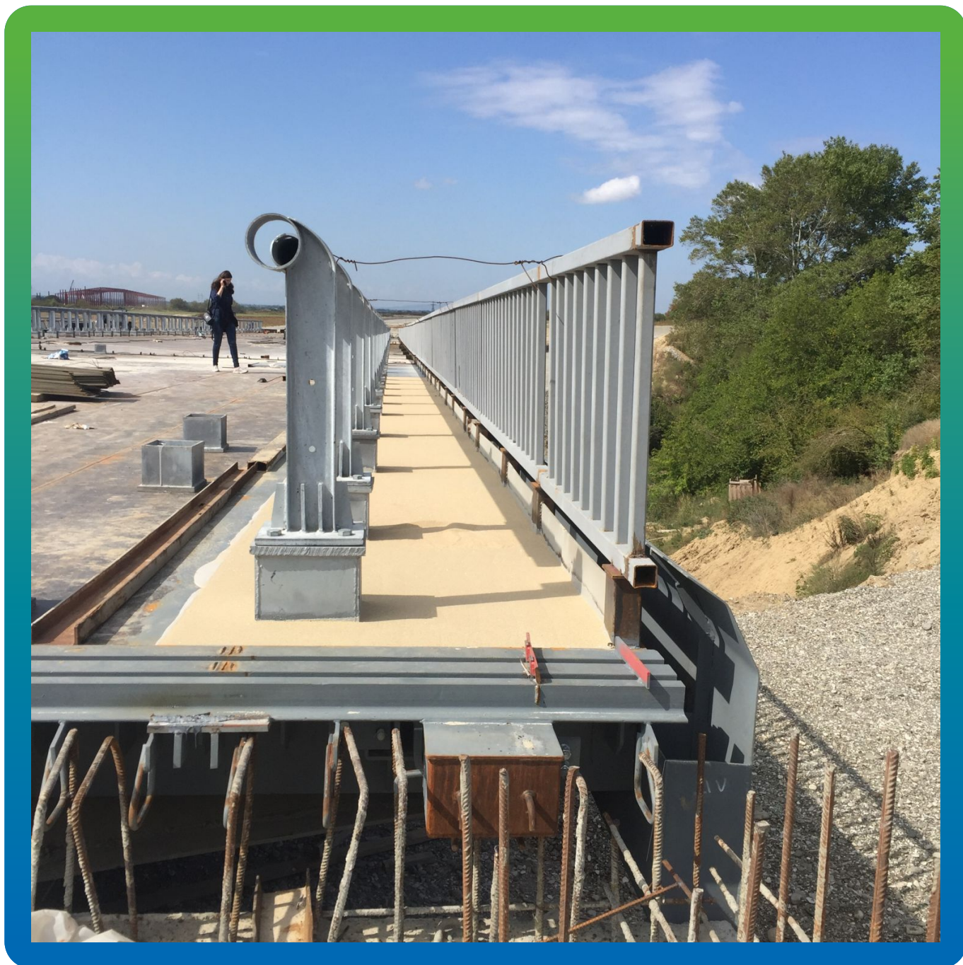
Просыпка ДенсТоп Филлер 01