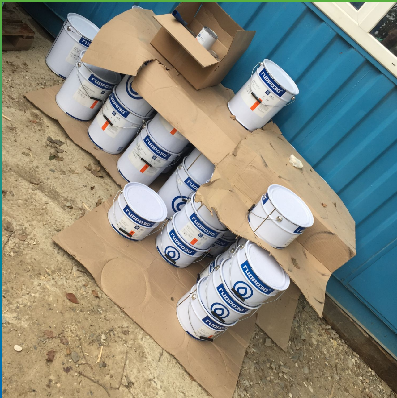
Зона хранения материалов