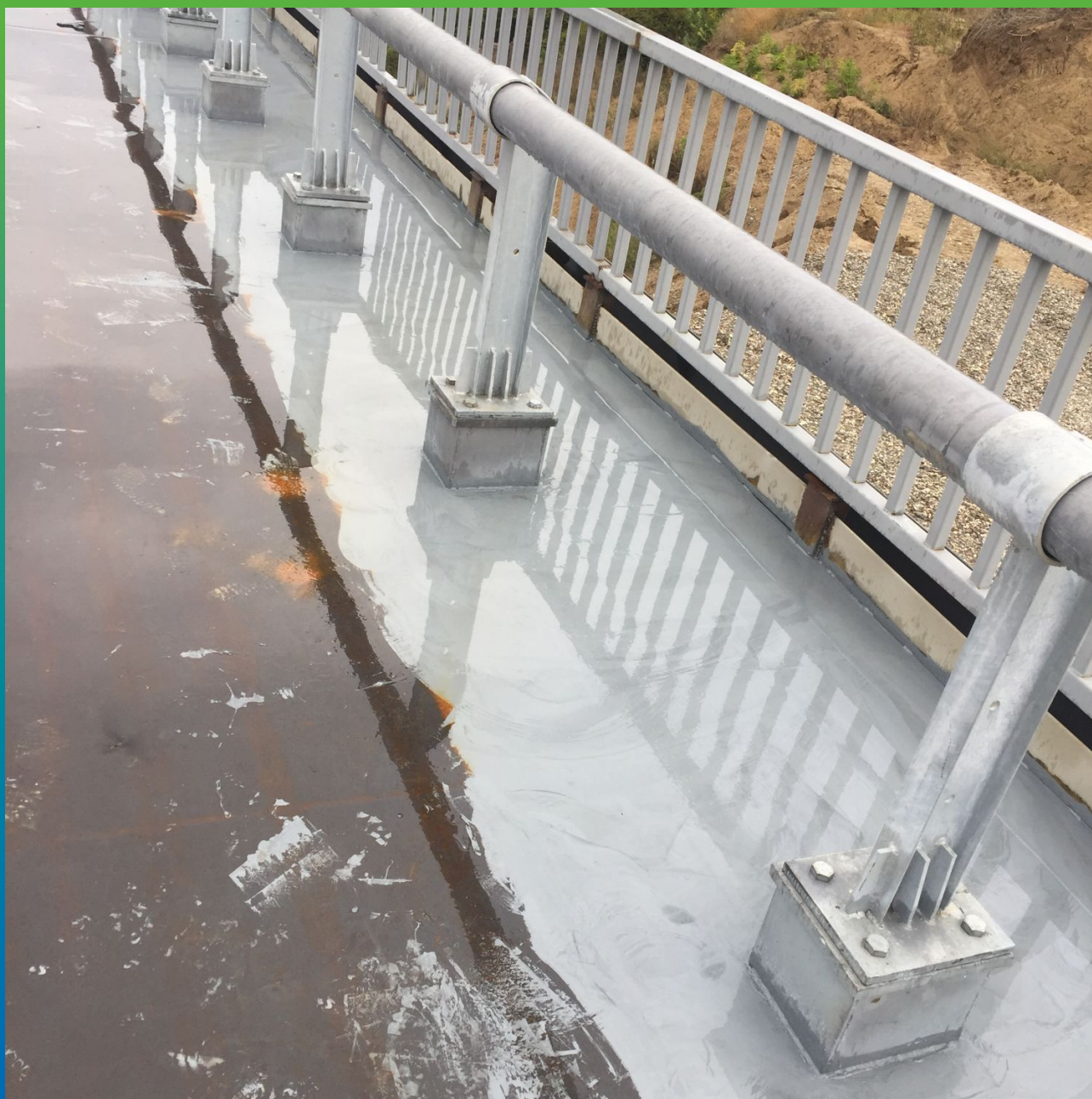
Прогрунтованное основание составом ДенсТоп ЭП 116