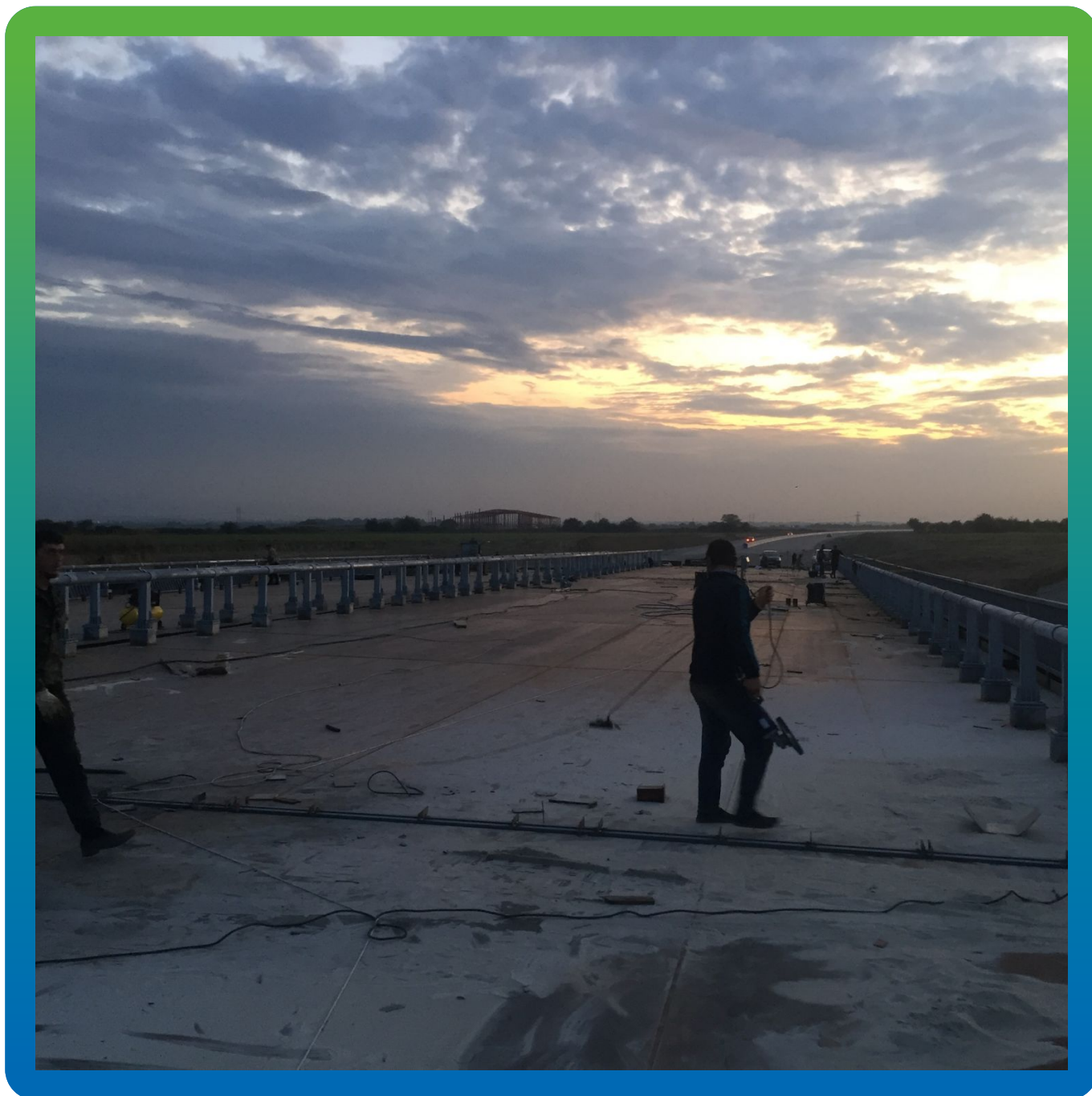
Пескоструйная обработка ортотропного основания