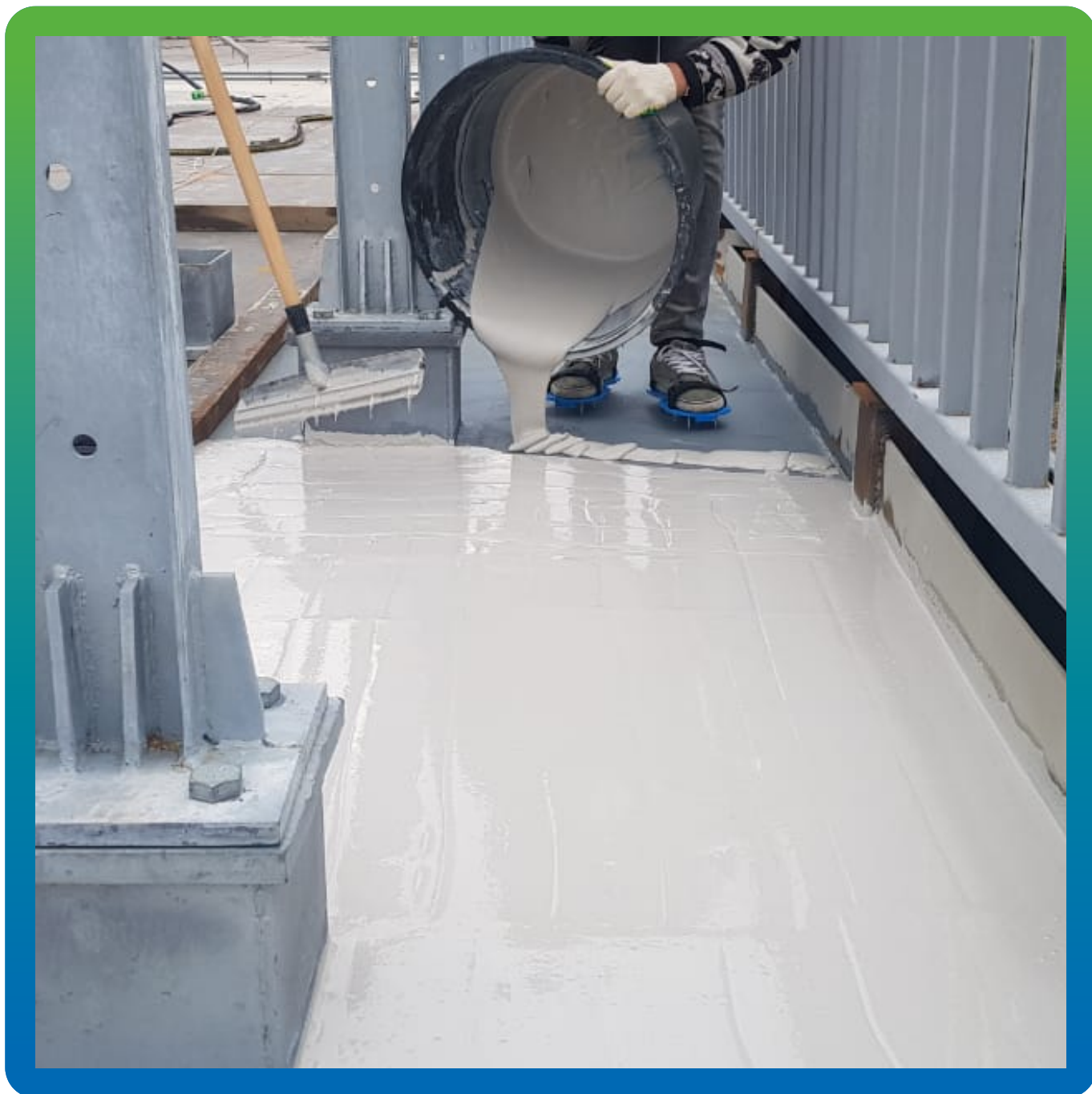
Нанесение основного слоя ДенТоп ЭП 710 Мастик