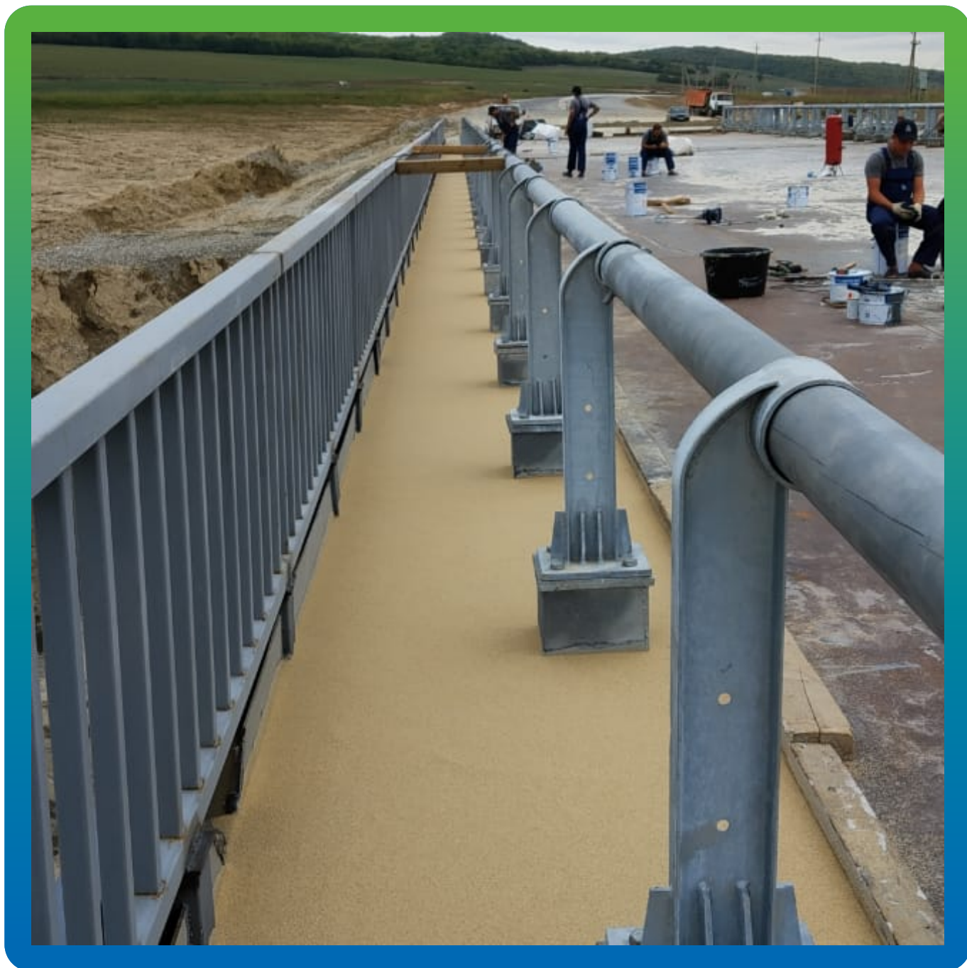
Запечатывающий слой ДенсТоп ПУ 302