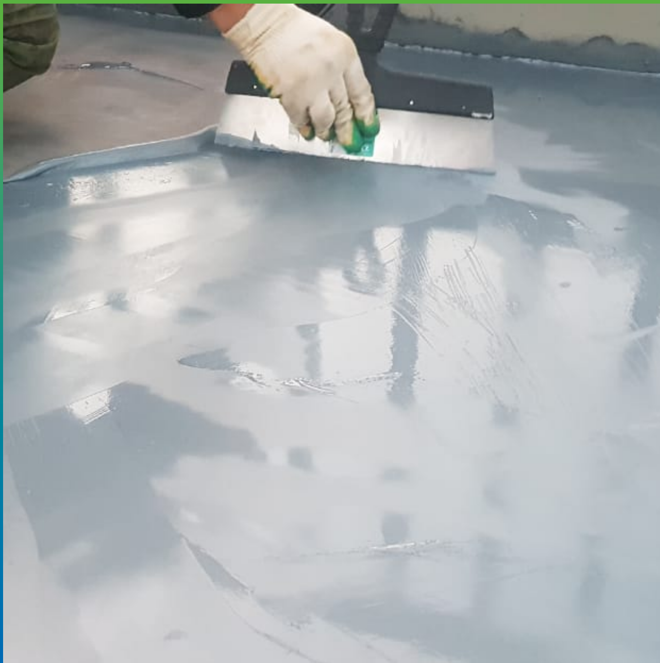
Нанесение грунтовочного слоя ДенсТоп ЭП116