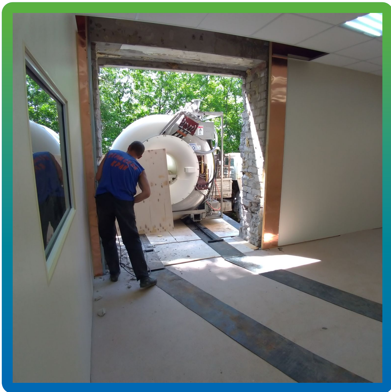
Установка томографа на усиленную конструкцию