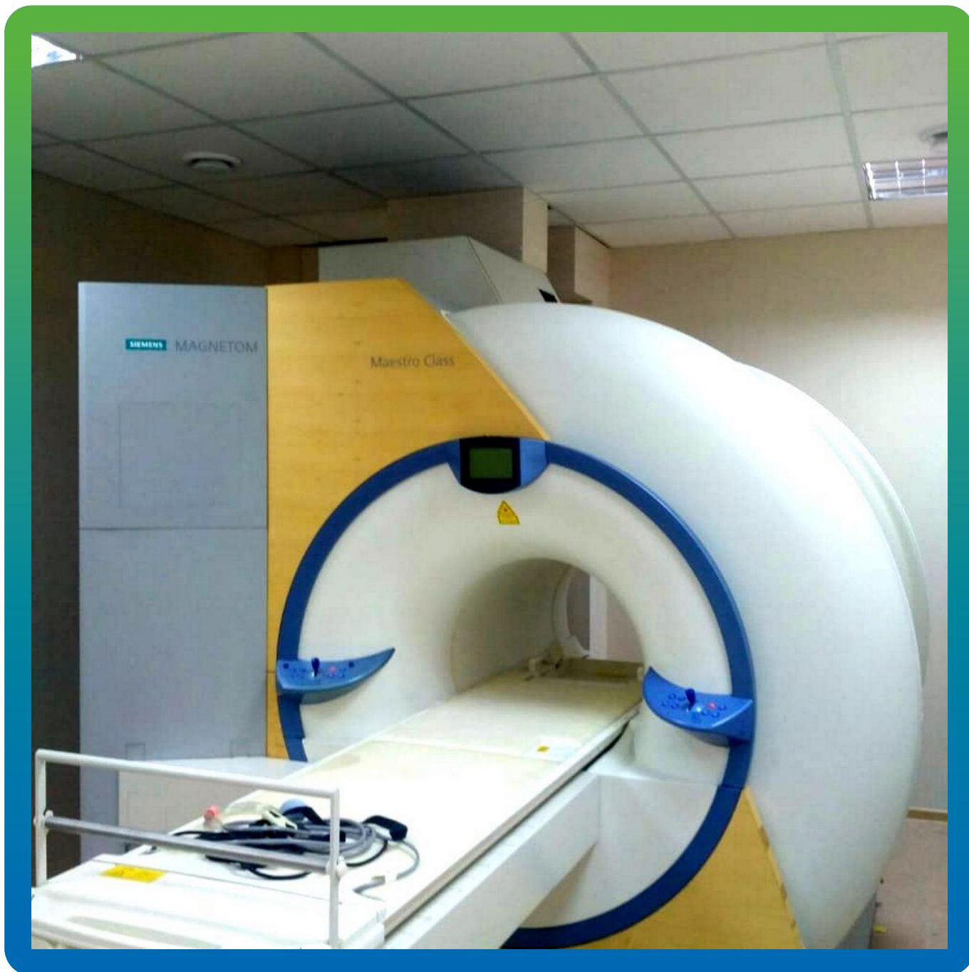
Вид объекта после сдачи в эксплуатацию