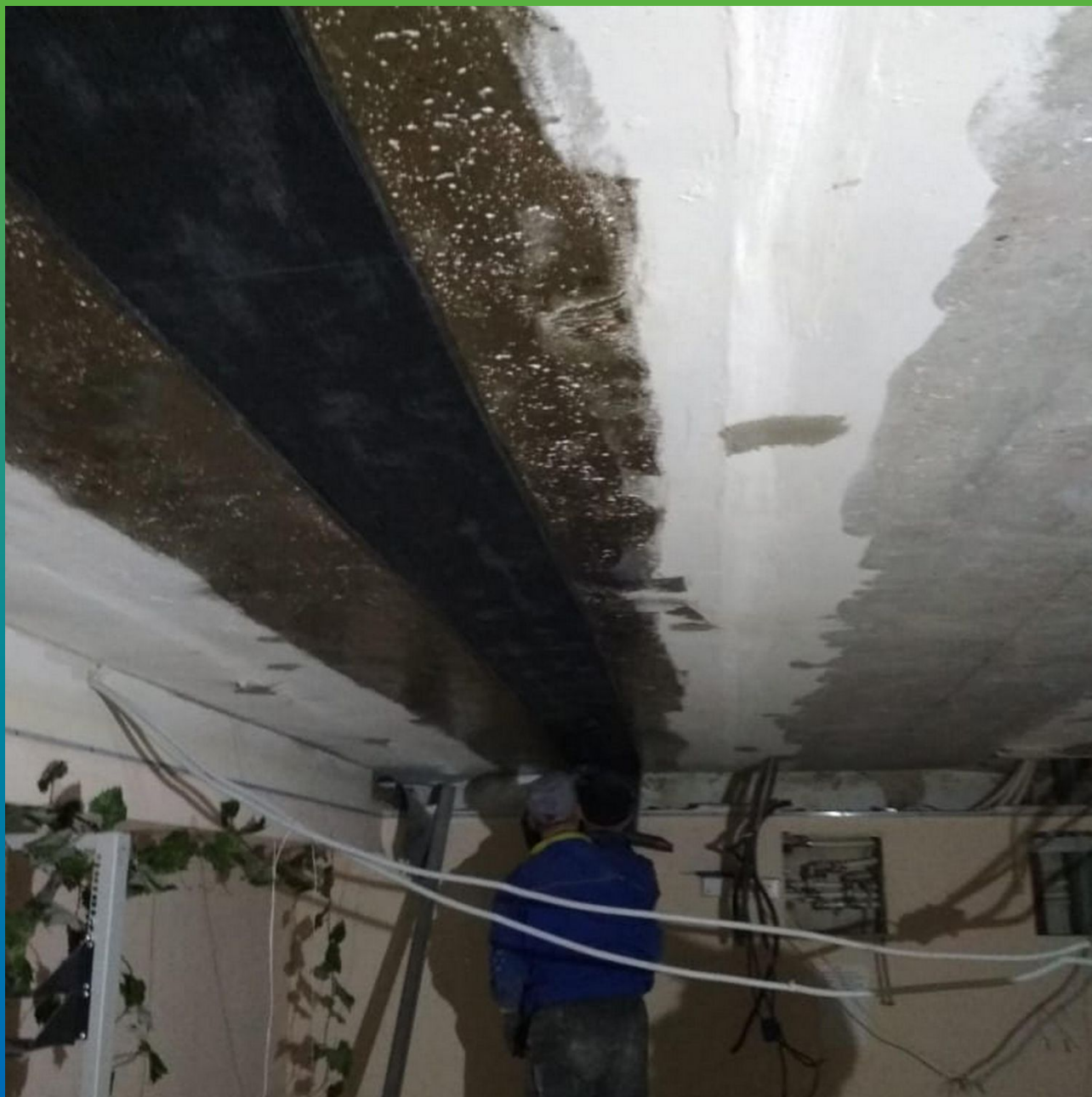
Монтаж холста Армошел KB 900 пропитанного загущенным клеем Манопкс 372