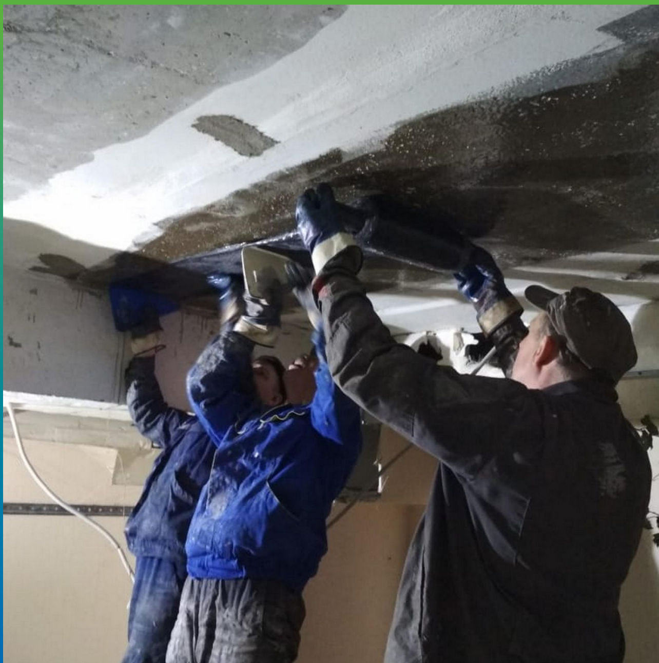
Монтаж холста Армошел KB 900 пропитанного загущенным клеем Манопкс 372