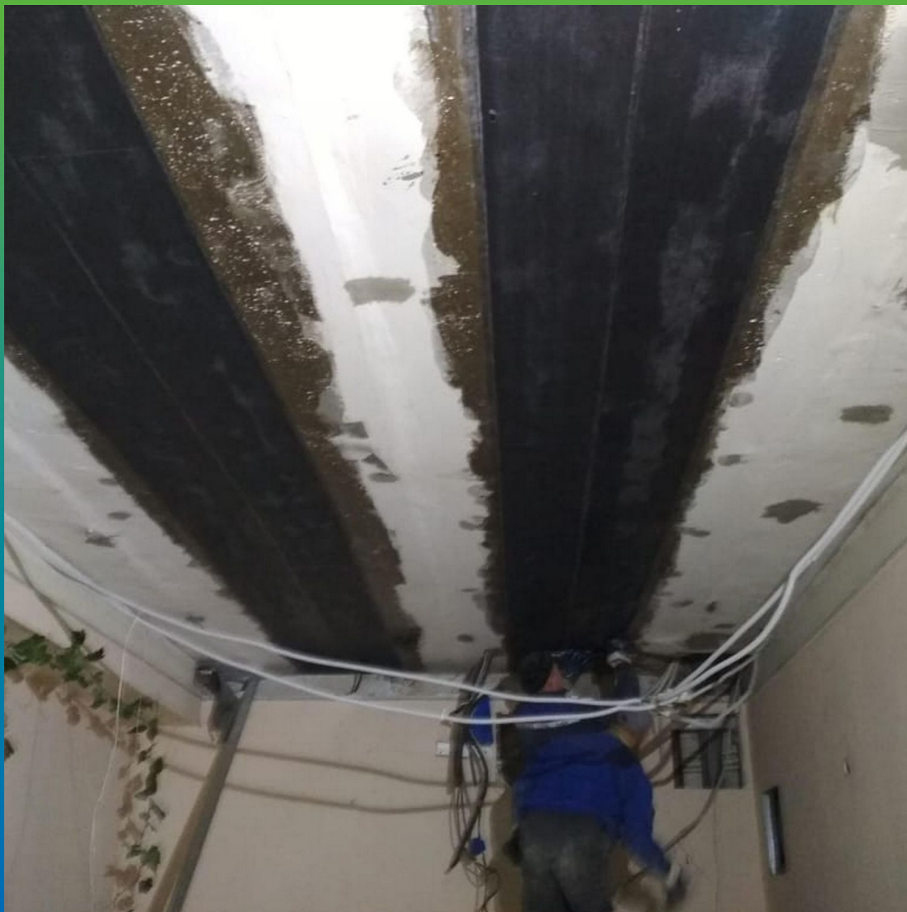
Вид конструкции после проведения работ по усилению