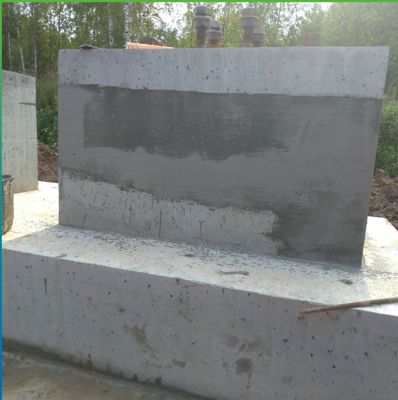
Нанесение первого слоя материала