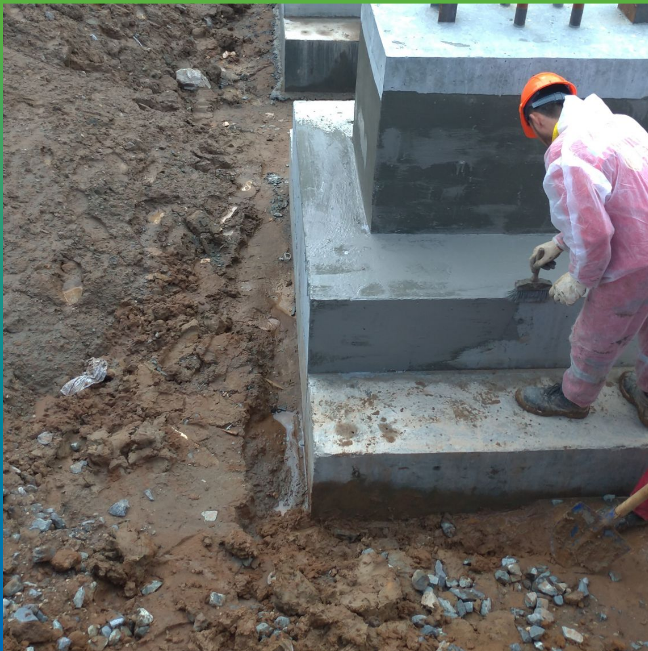
Нанесение второго слоя материала