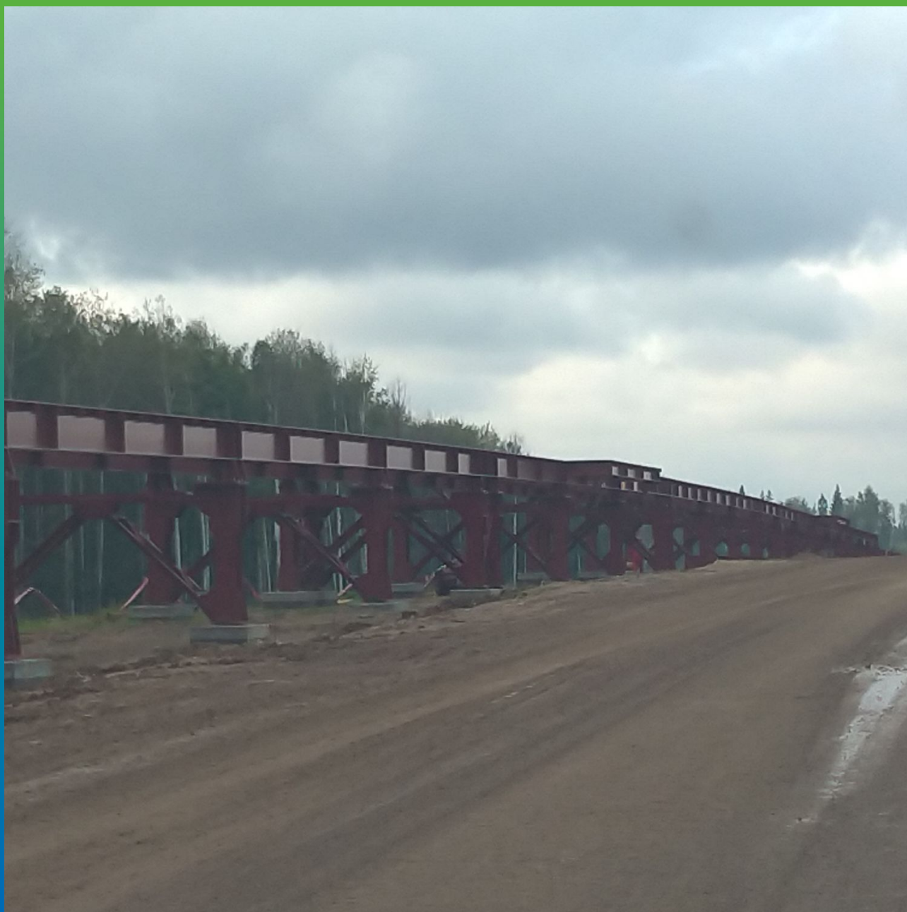
Общий вид конструкции после проведения гидроизоляционных работ фундаментов