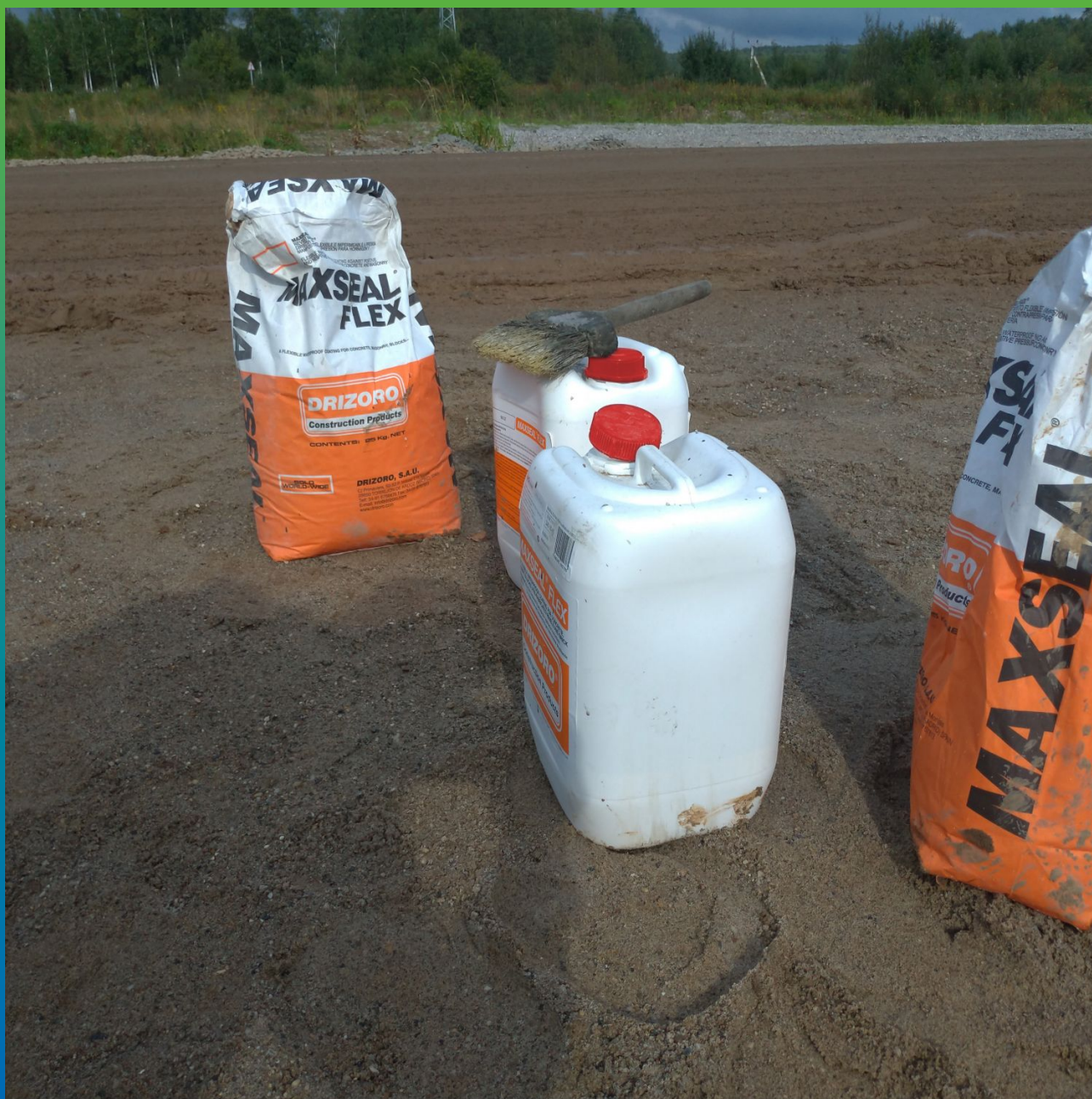
Материал Макссил Флекс на объекте