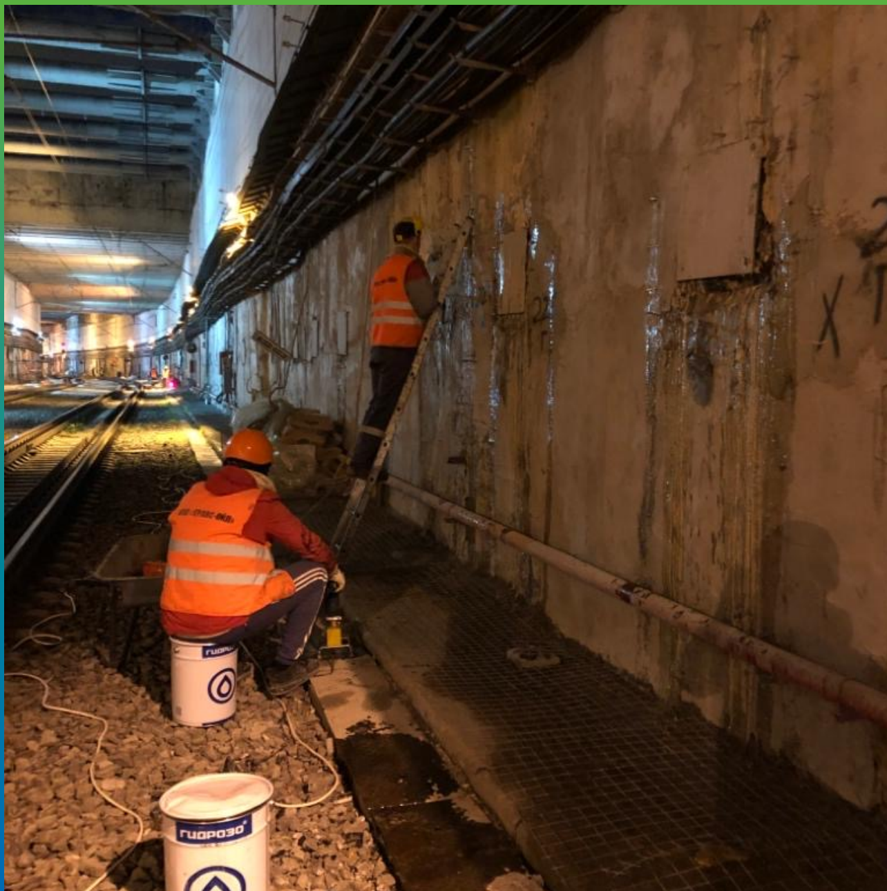
Инъектирование Манопур 143