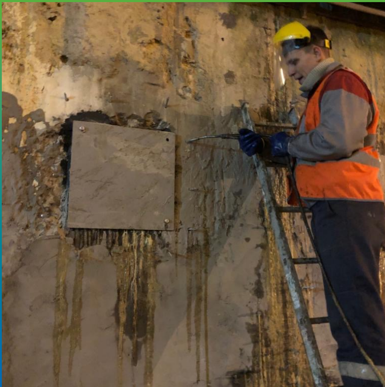
Инъектирование Манопур 143