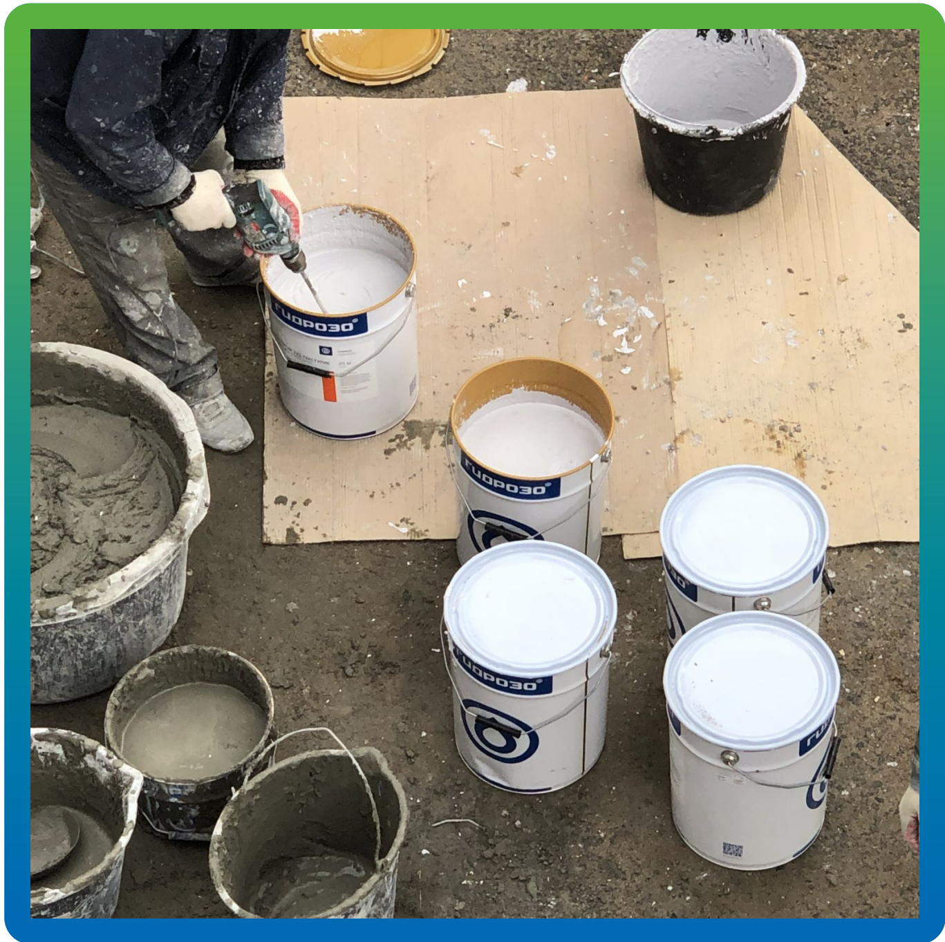
Размешивание материала Денстоп АК 225 Текстурик