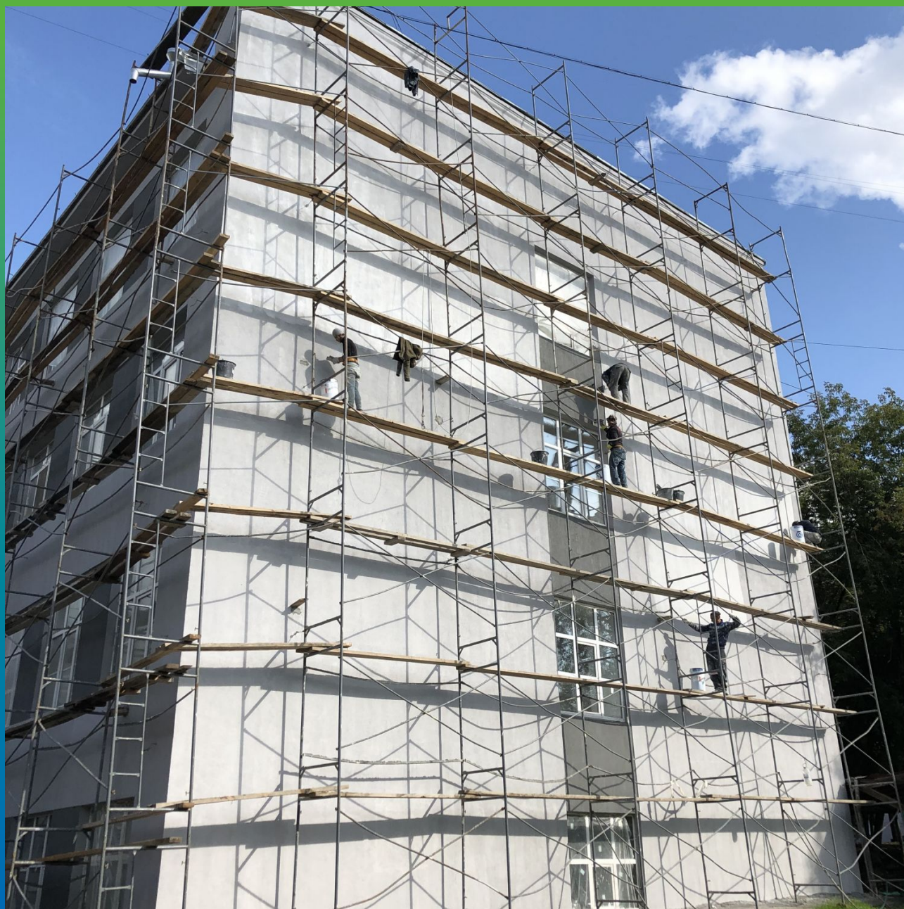
Нанесение Денстоп АК 225 Текстурик