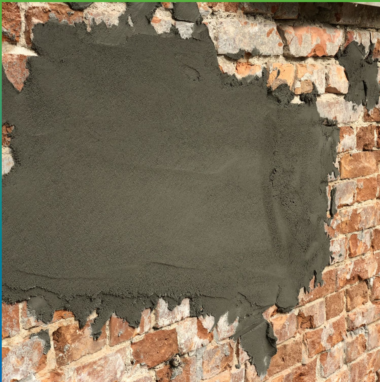
Нанесение ремонтно-штукатурного состава Стармекс Лайм С