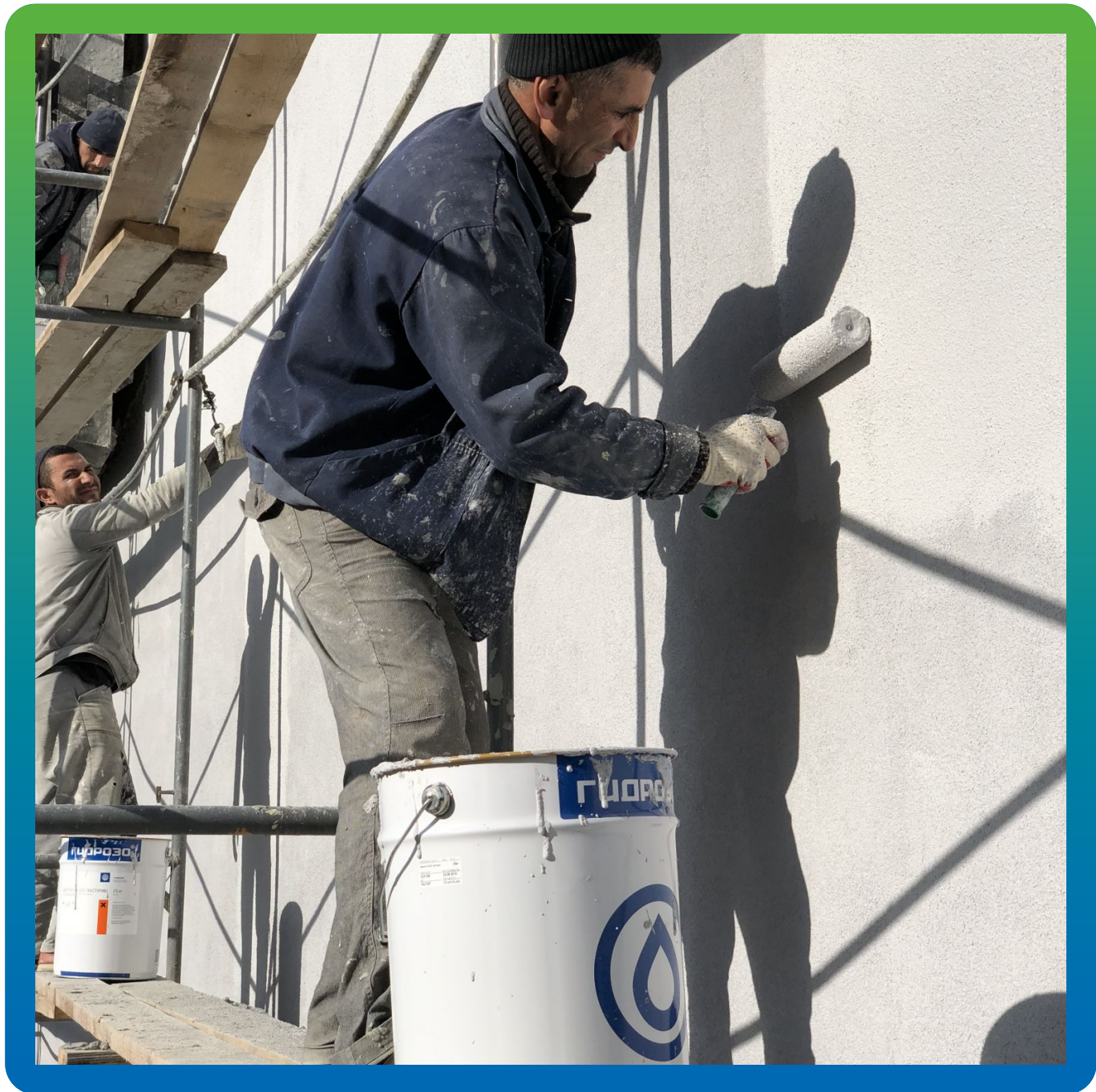
Нанесение Денстоп АК 225 Текстурик