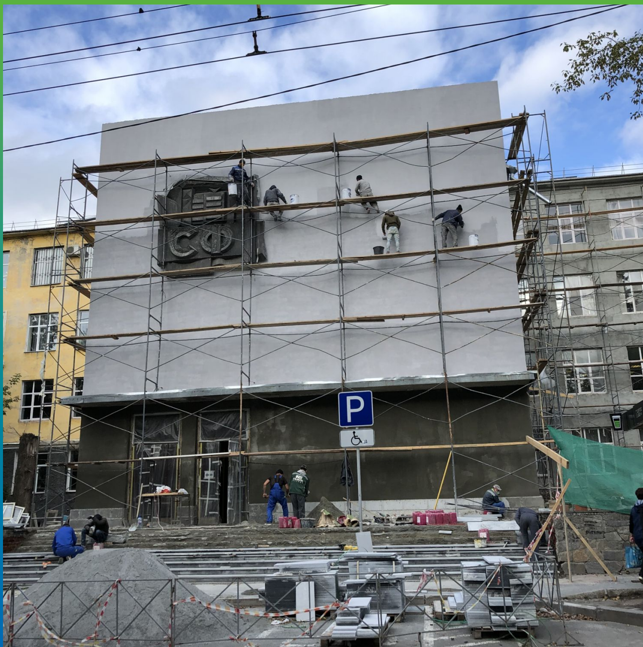
Нанесение Денстоп АК 225 Текстурик