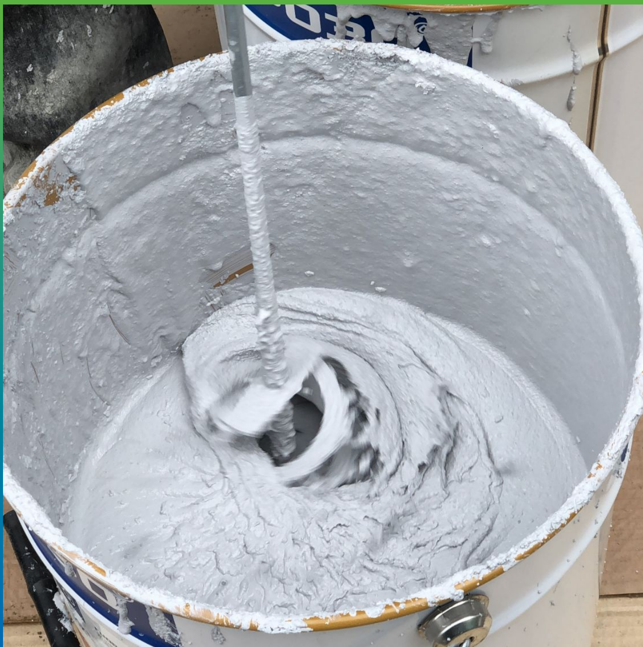
Размешивание материала Денстоп АК 225 Текстурик