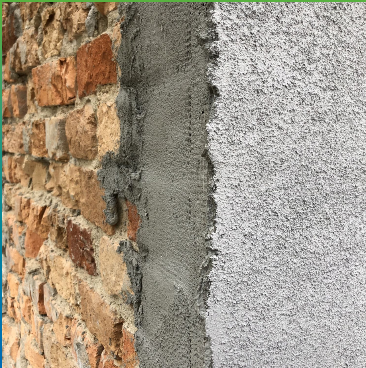
Нанесение Денстоп АК 225 Текстурик