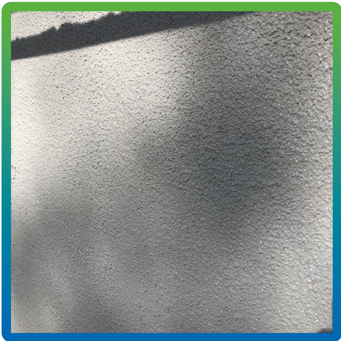
Нанесение Денстоп АК 225 Текстурик