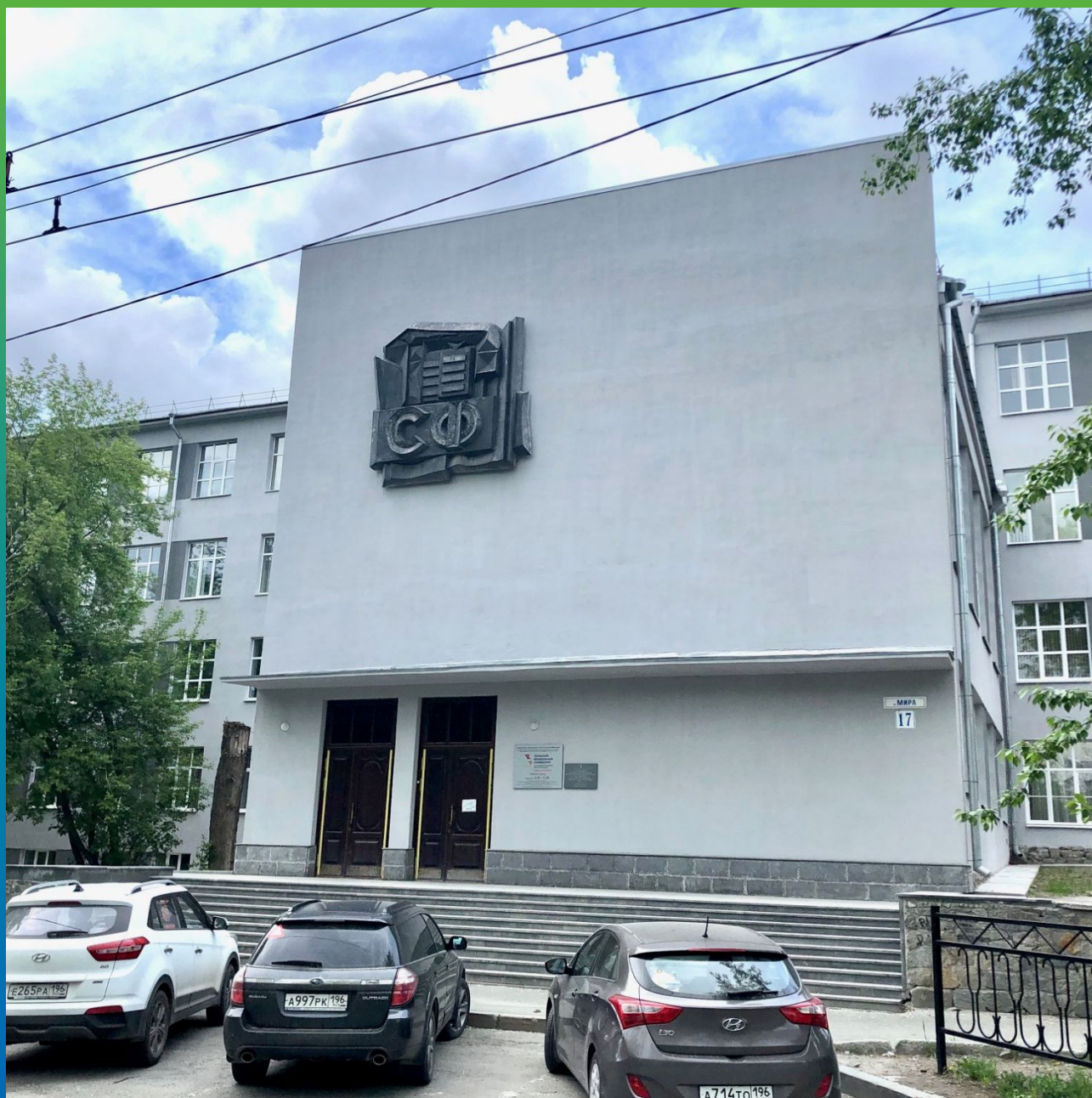
Вид здания после ремонта