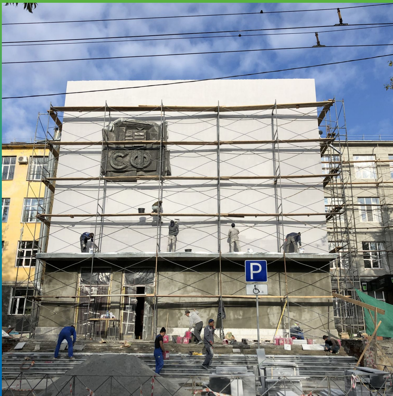
Нанесение Денстоп АК 225 Текстурик