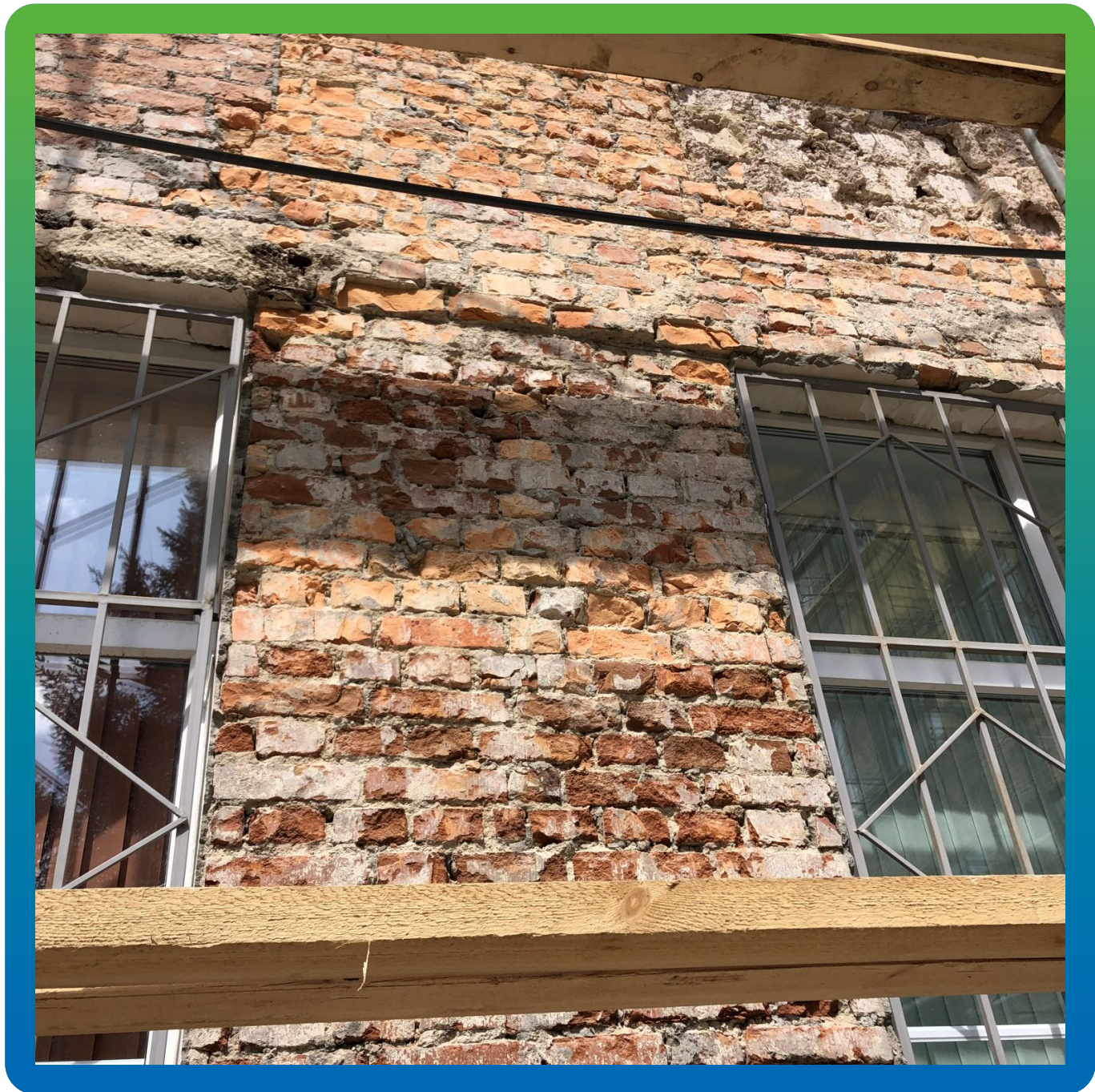
Частный вид удаление отделки фасада, очистка фасада