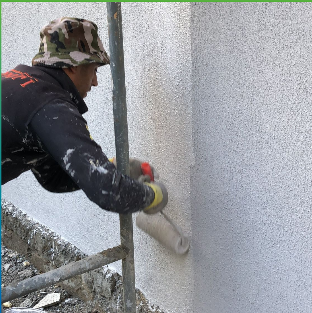
Нанесение финишного Денстоп АК 223 Силко