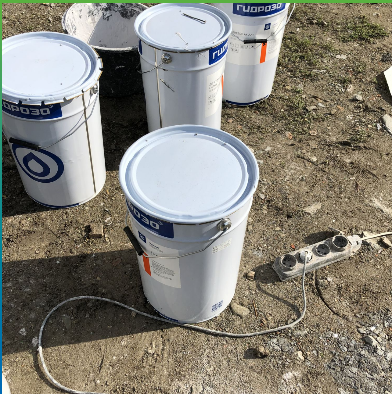
Материалы на объекте Денстоп АК 225 Текстурик, Денстоп АК 223 Силко