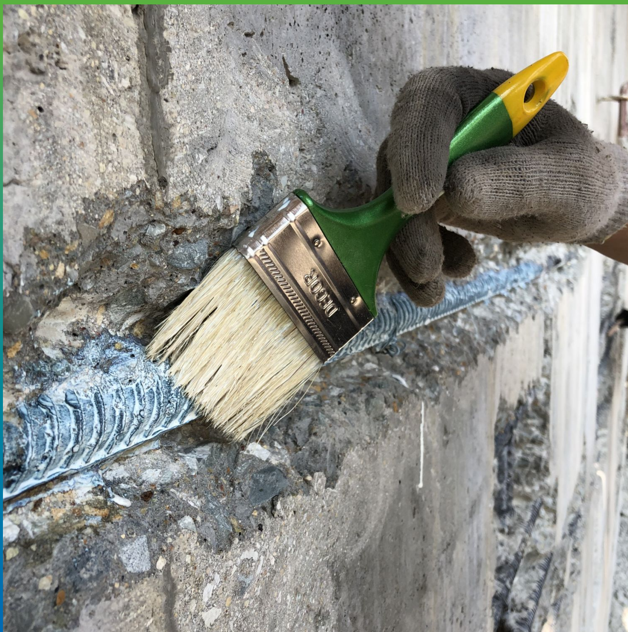
Обработка арматуры ингибитором и пассиватором коррозии Маногард 133 Фер