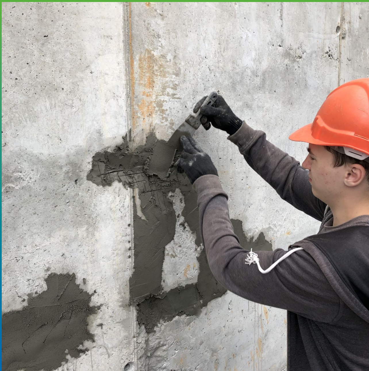
Нанесение финишного и защитного слоя ремонтным составом Стармекс РМЗ