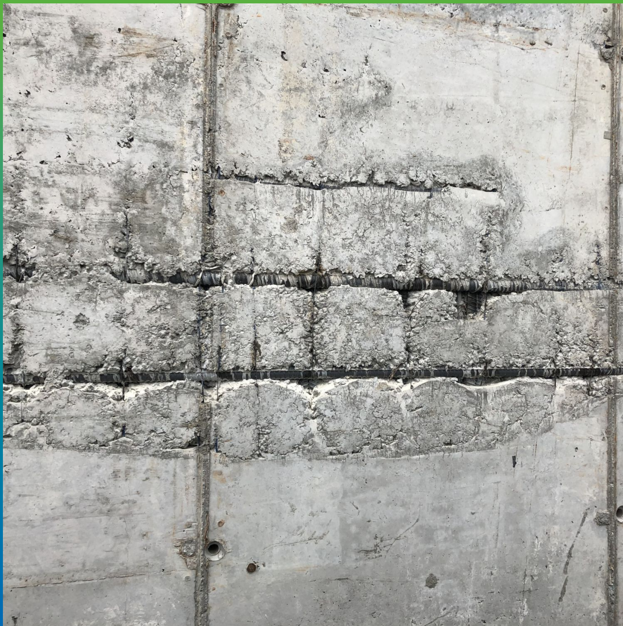
Дефекты монолитных ж/б конструкций