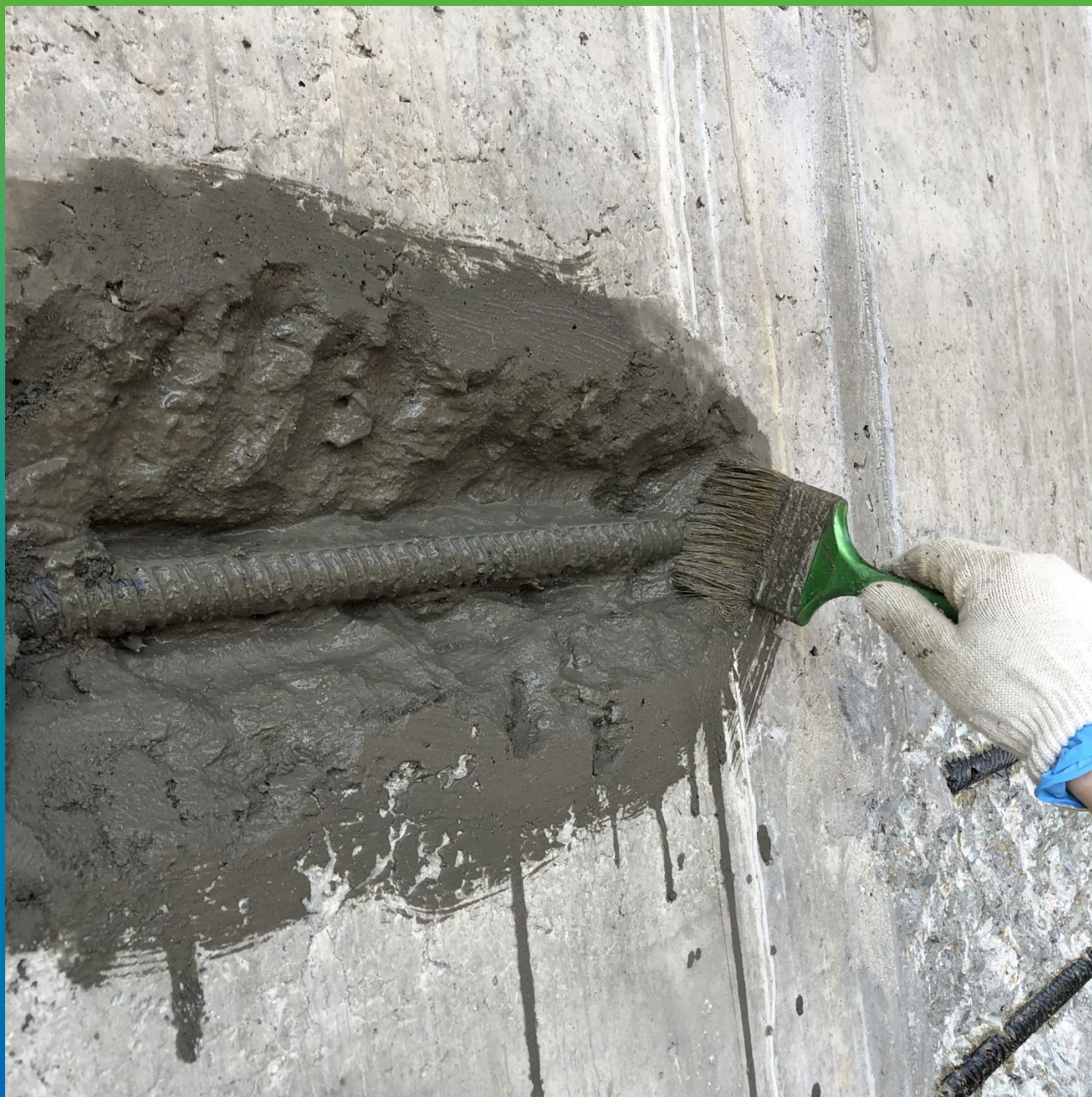
Грунтование адгезионным составом дефектного участка