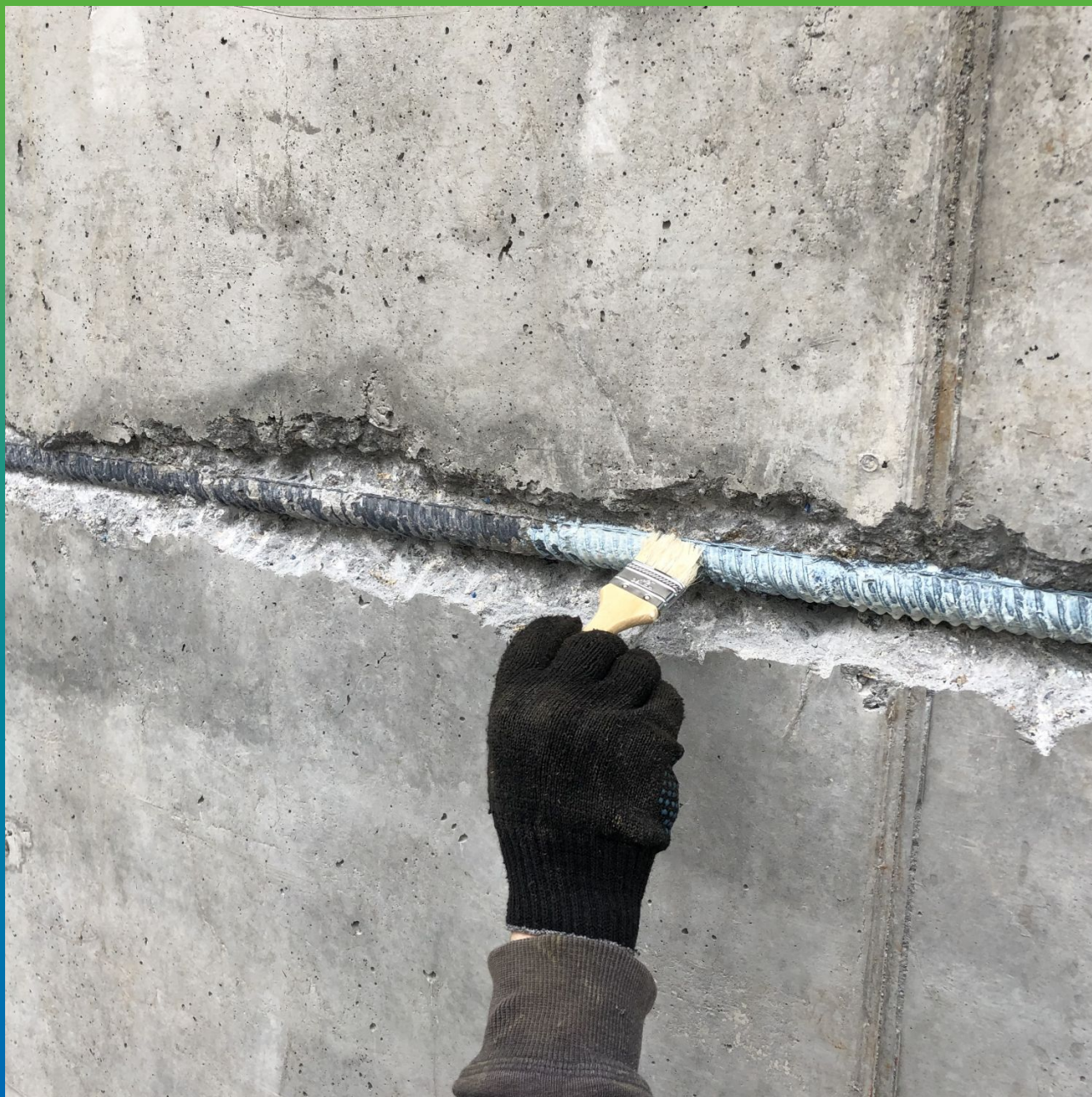
Обработка арматуры ингибитором и пассиватором коррозии Маногард 133 Фер