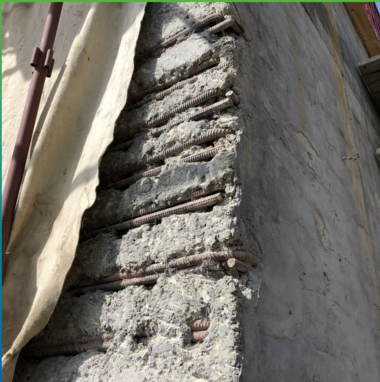
Дефекты монолитных ж/б конструкций