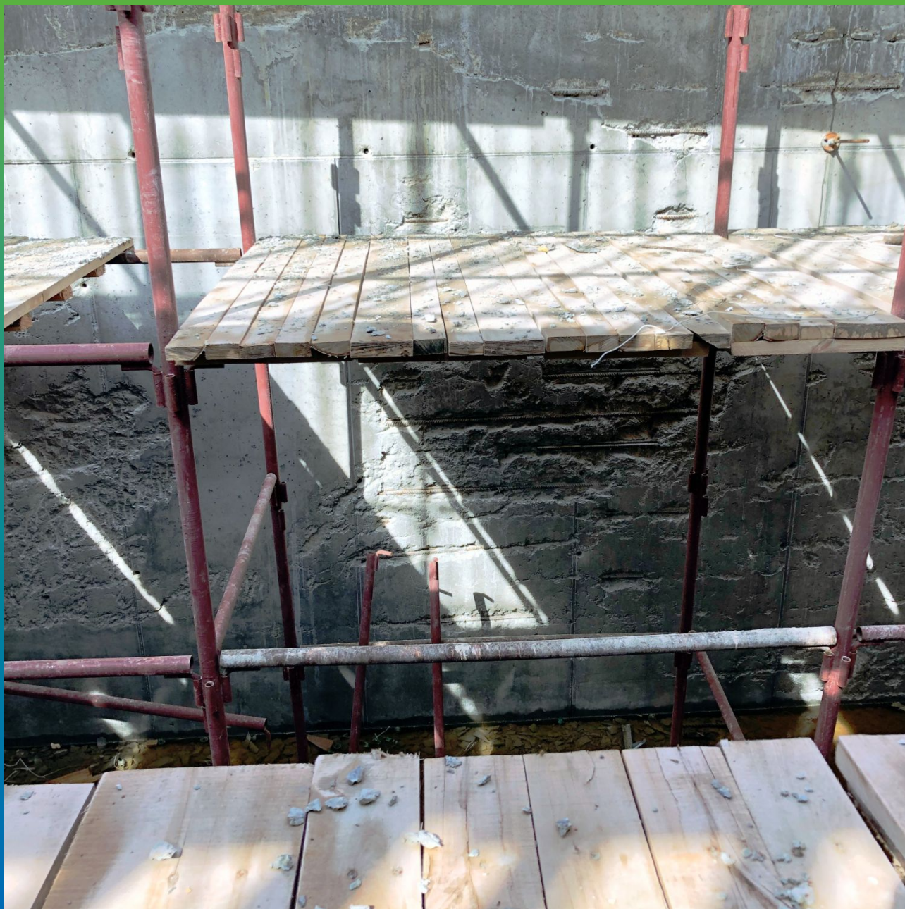
Дефекты монолитных ж/б конструкций