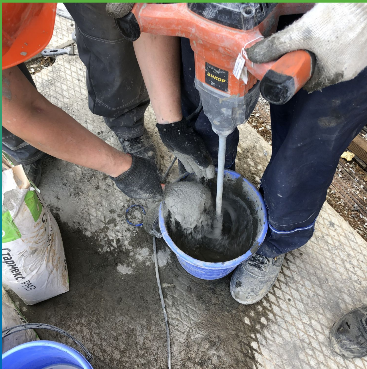
Замешивание ремонтного состава Стармекс РМЗ