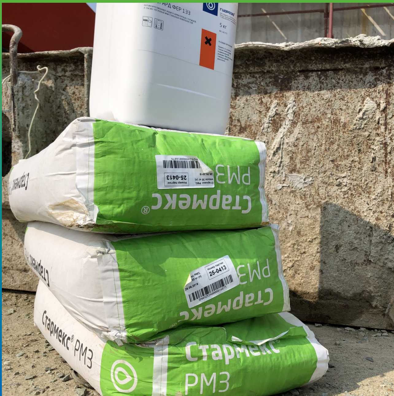
Материалы на объекте. Маногард 133 Фер, Стармекс РМЗ