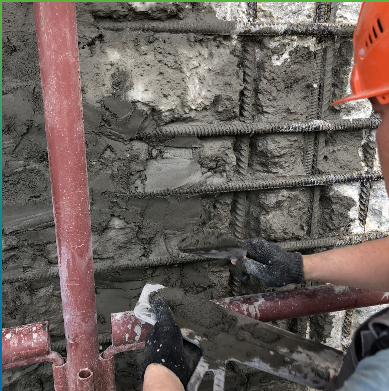
Нанесение финишного и защитного слоя ремонтным составом Стармекс РМЗ