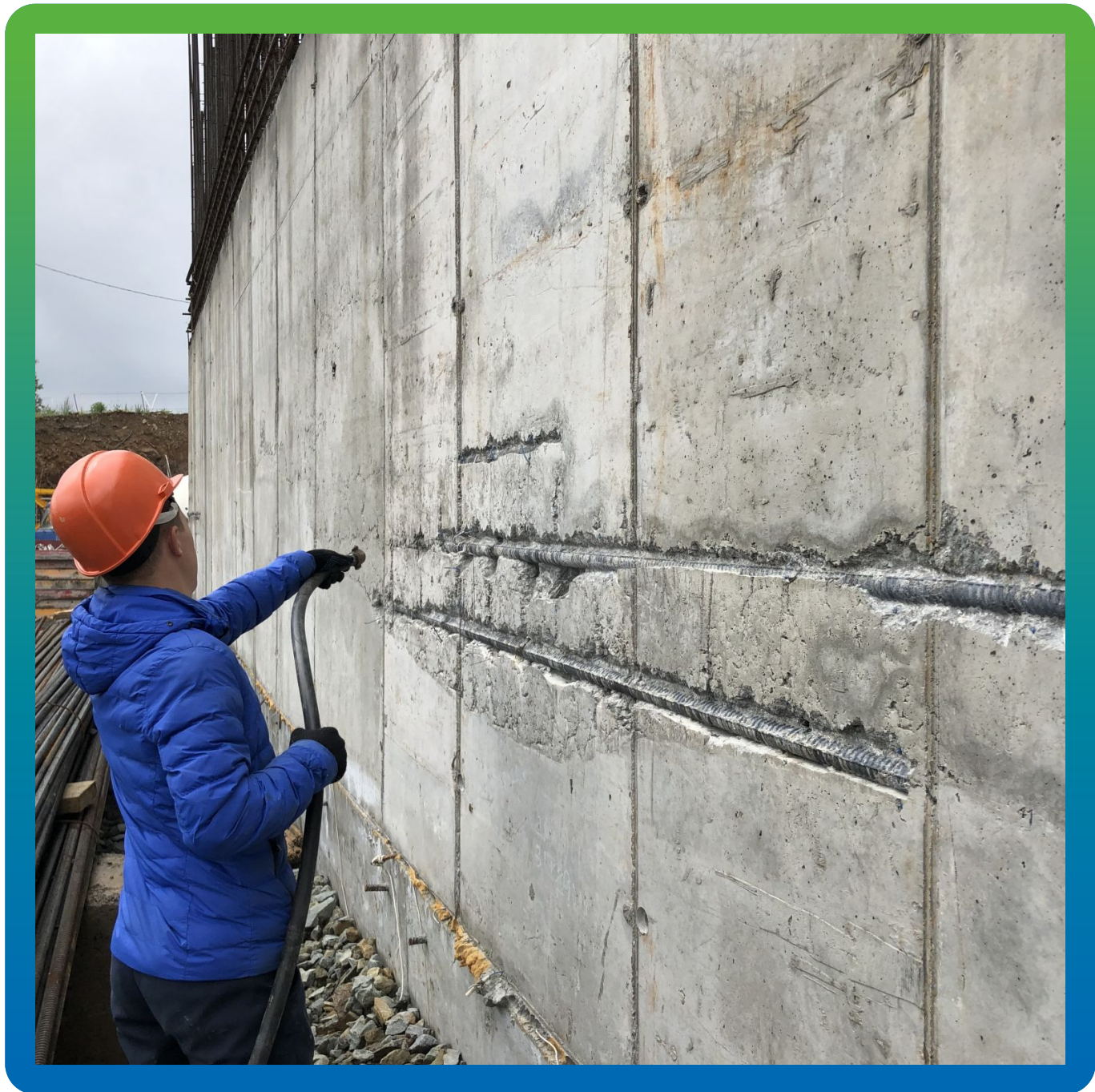
Очистка участков сжатым воздухом