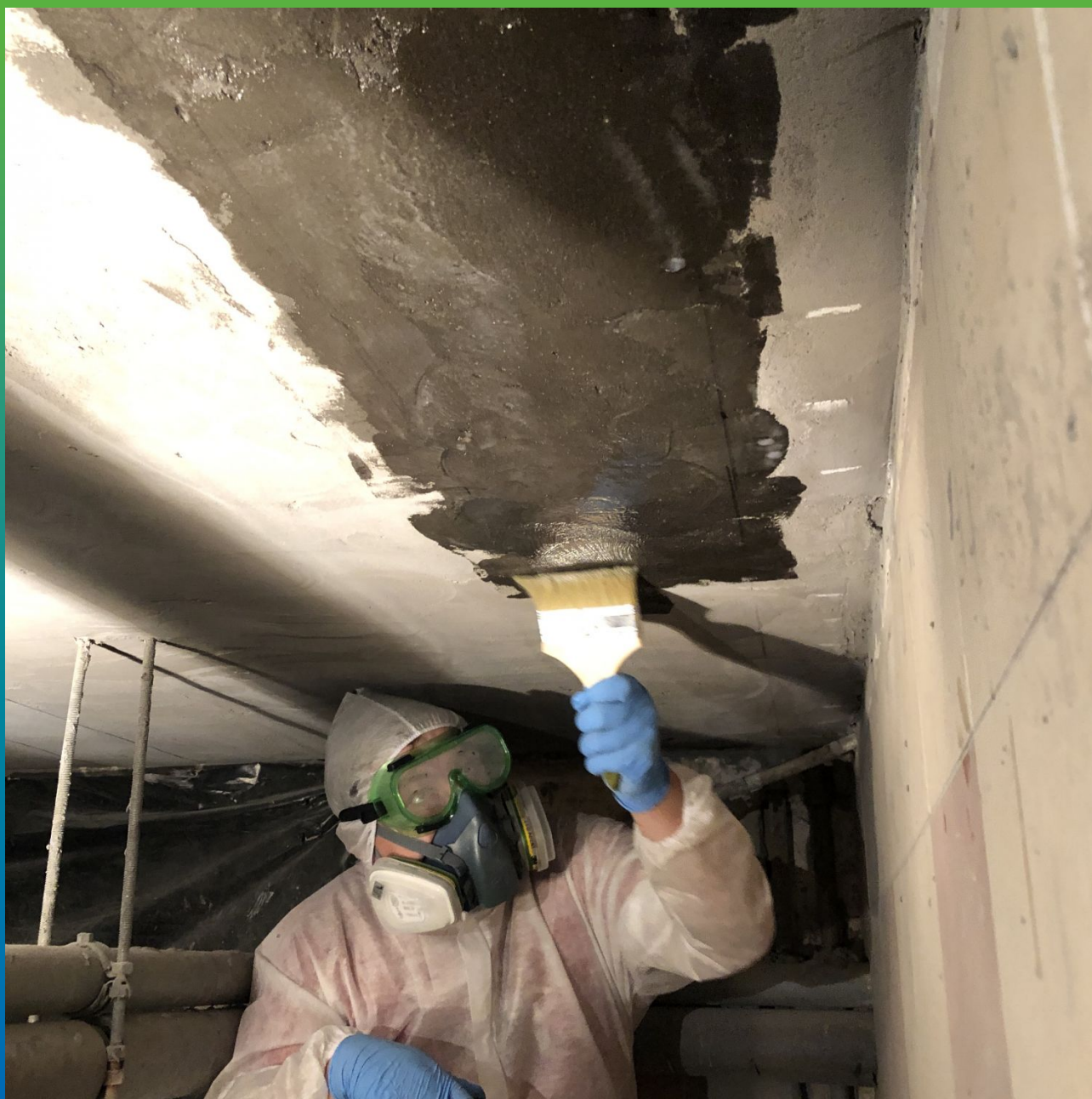
Грунтование основания составом Манопокс 372