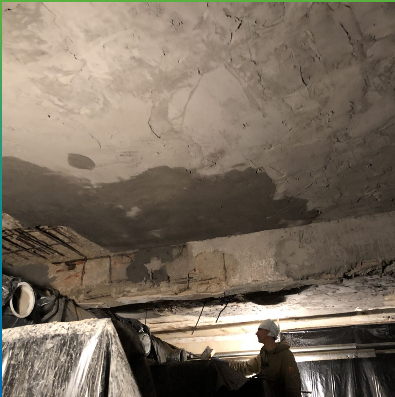
Нанесение ремонтного состава Стармекс РМ5