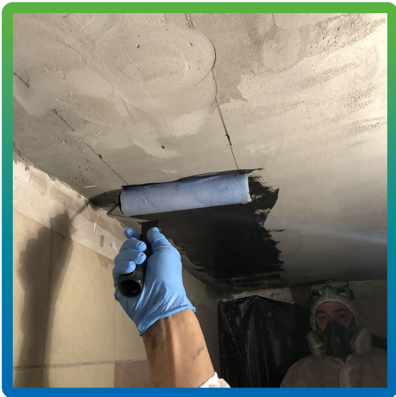
Шлифовка пятна контакта, нанесение разметки и грунтование основания составом Манопокс 372