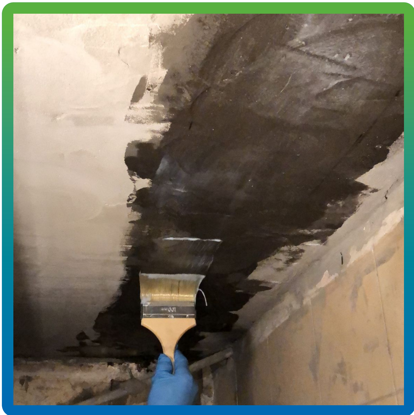
Нанесение загущенного клеевого состава Манопокс 372 + Манопокс Тикс