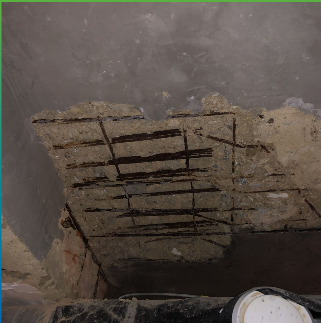
Нанесение ремонтного состава Стармекс РМ5