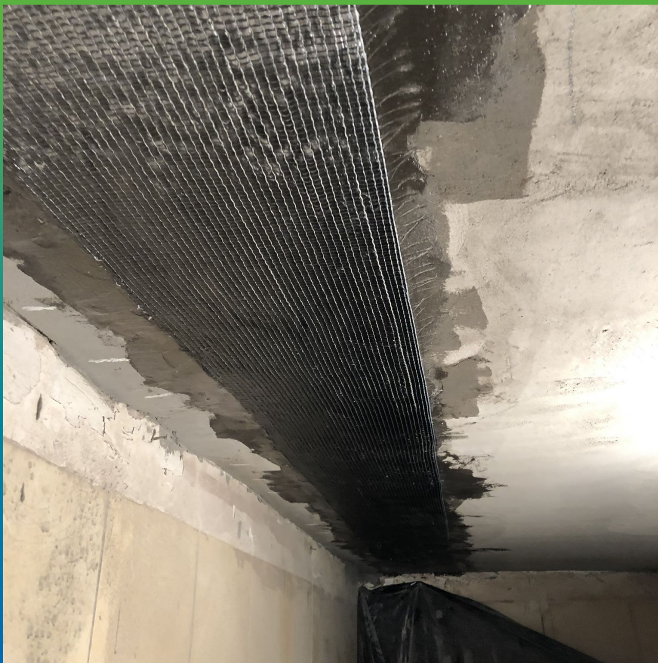
Общий вид смонтированной композитной системы усиления (КСУ) Армошел