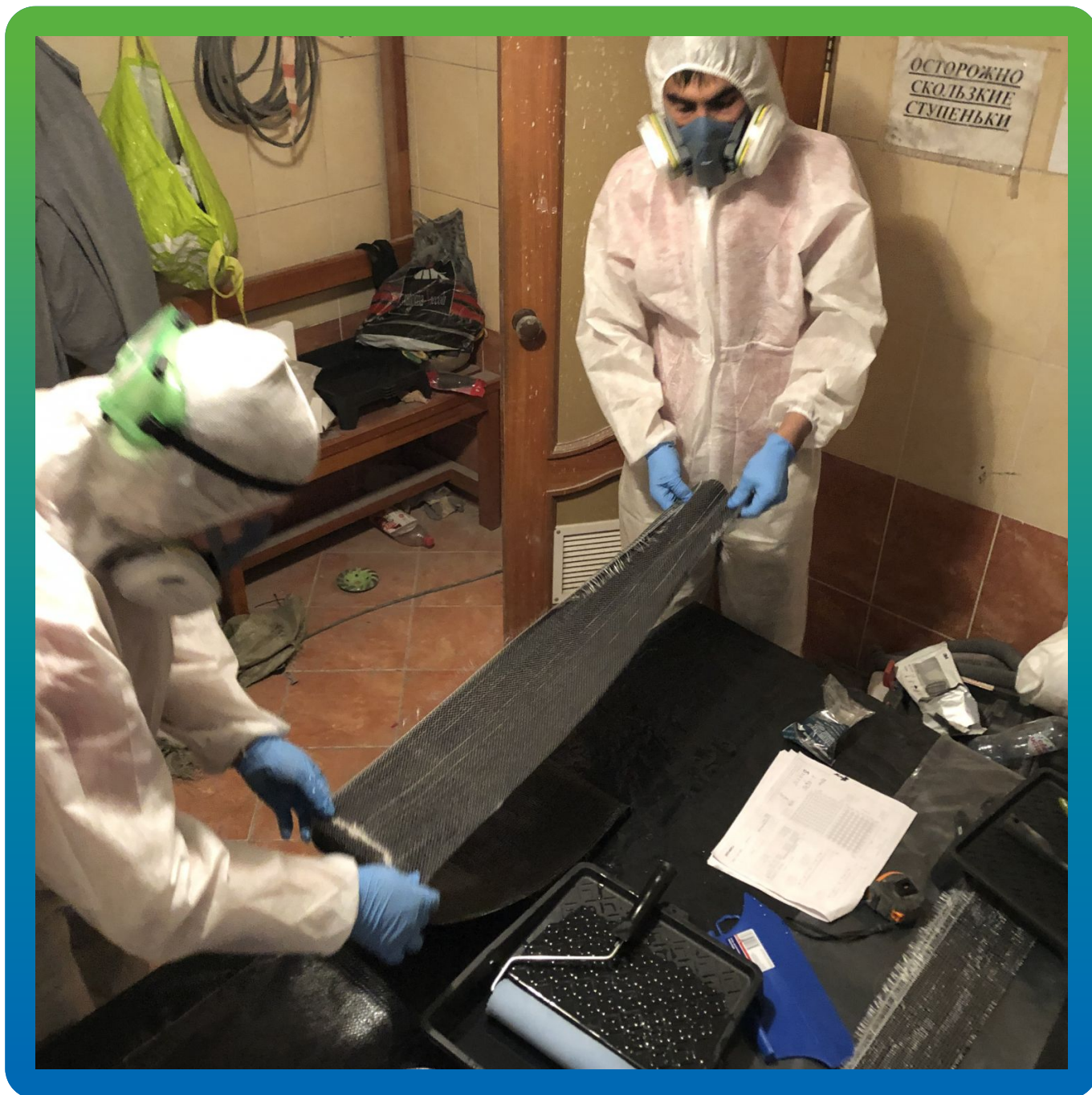
Подготовка и пропитка Углеродной ткани Армошел КВ 200