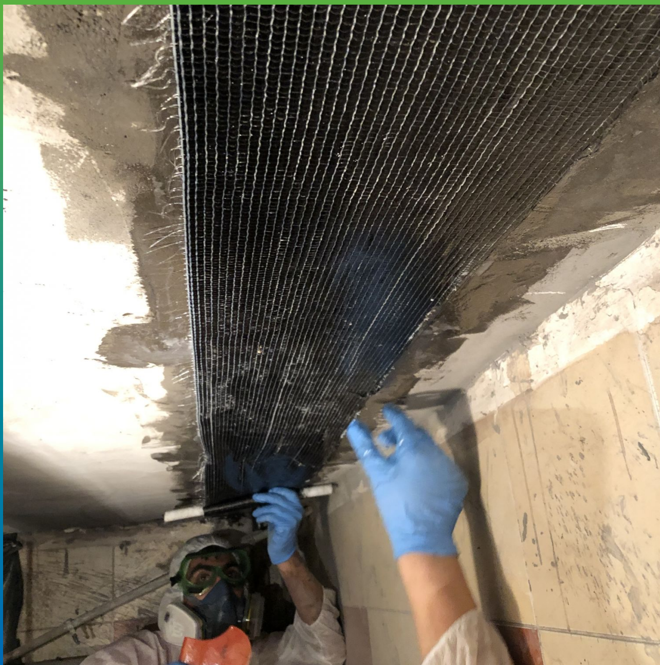
Монтаж пропитанного углеродного волокна Армошел KB 200