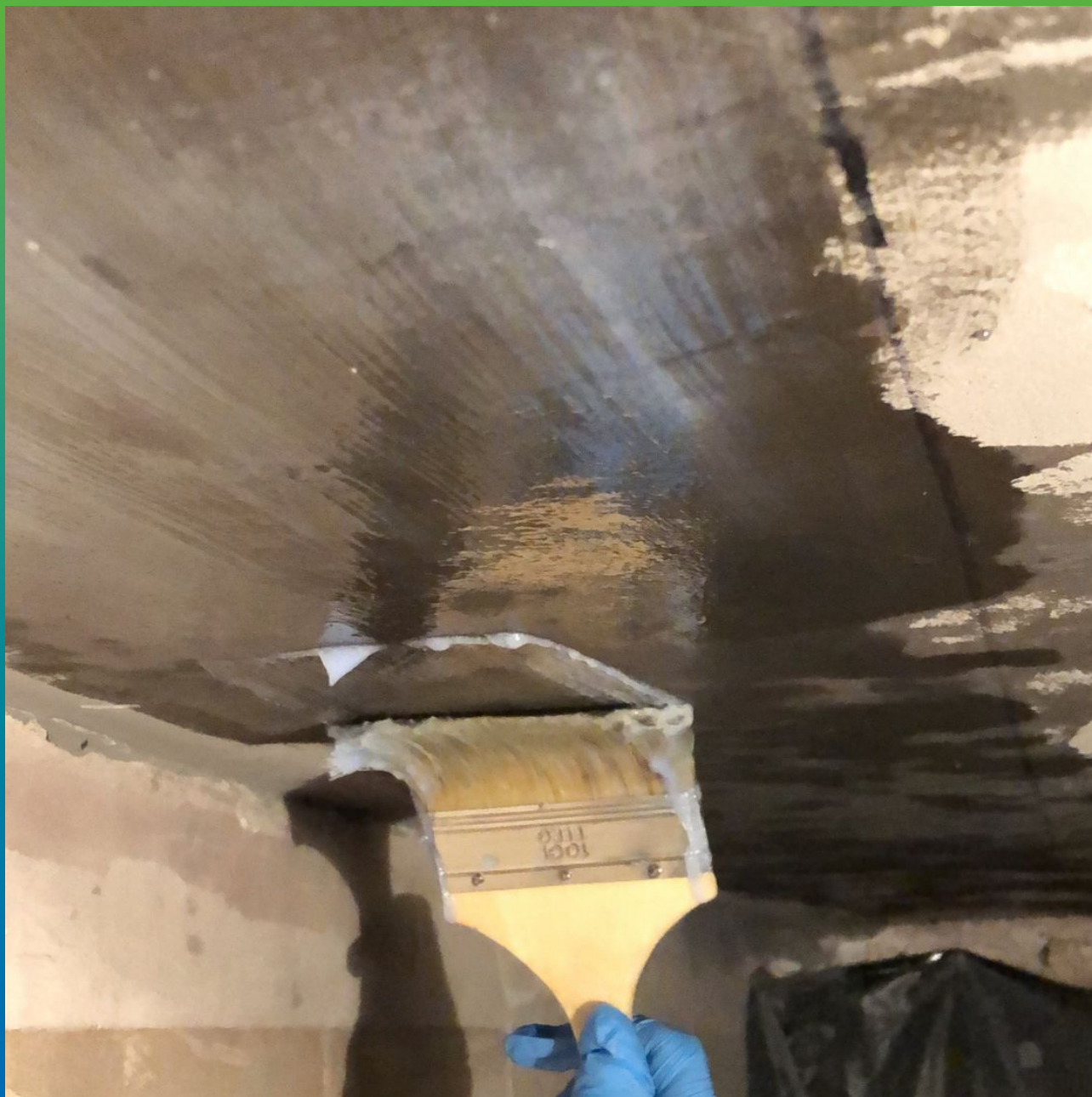
Нанесение загущенного клеевого состава Манопокс 372 + Манопокс Тикс