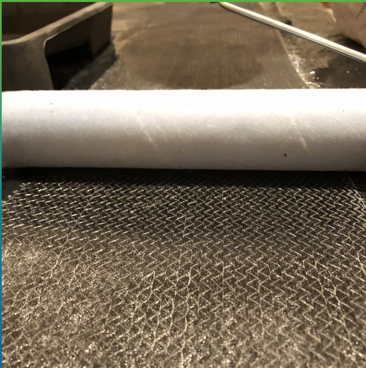
Подготовка и пропитка Углеродной ткани Армошел KB 200