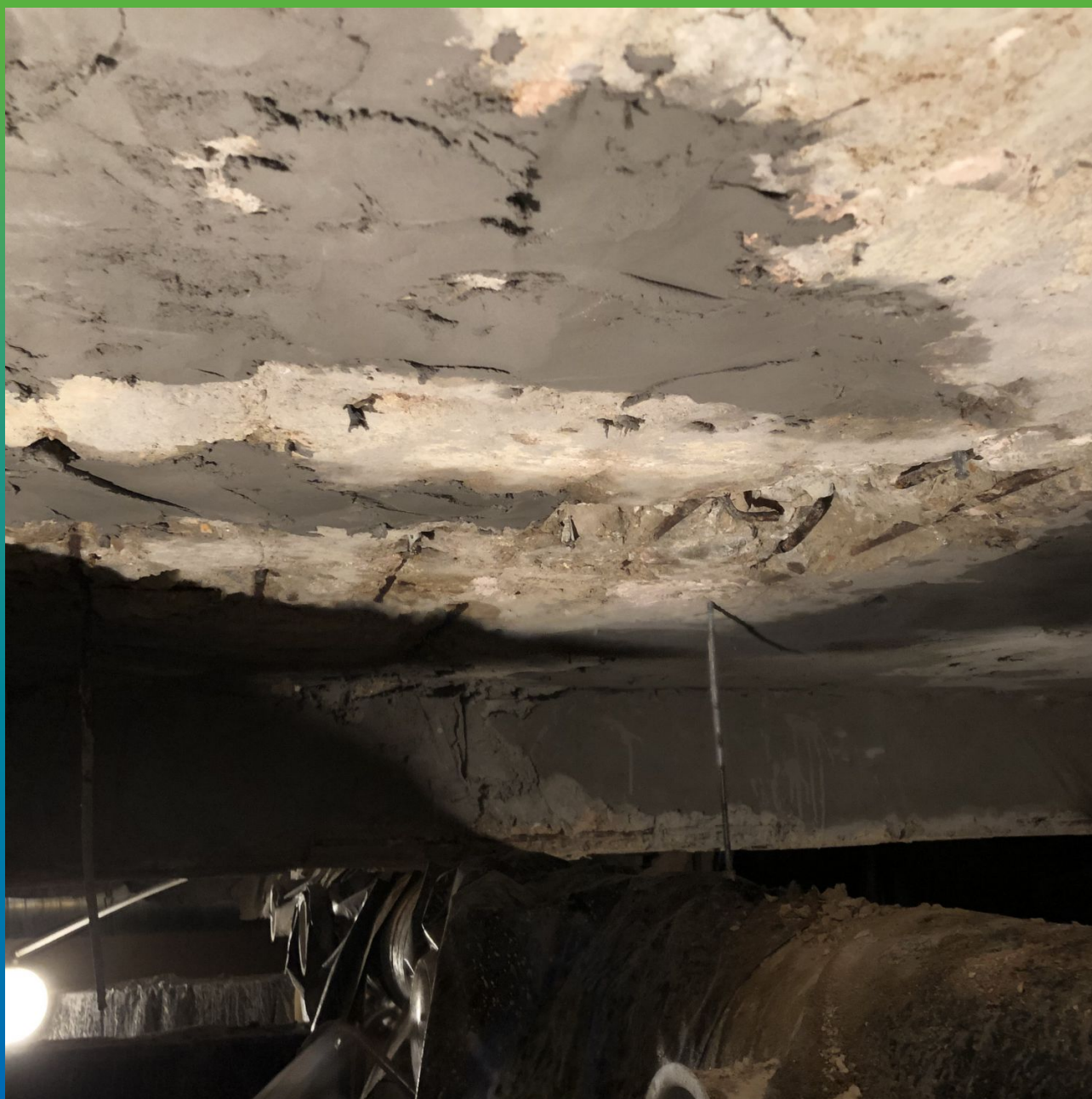
Нанесение ремонтного состава Стармекс РМ5