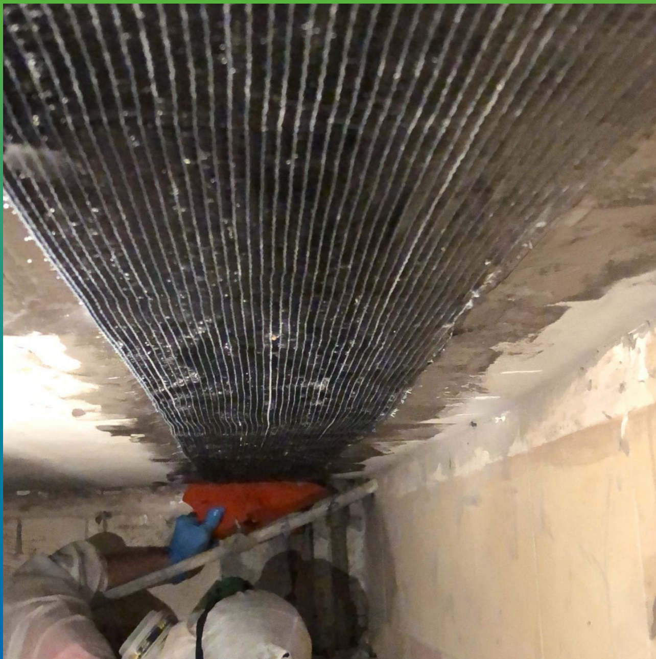
Удаление воздуха и разглаживание углеродного волокна Армошел KB 200